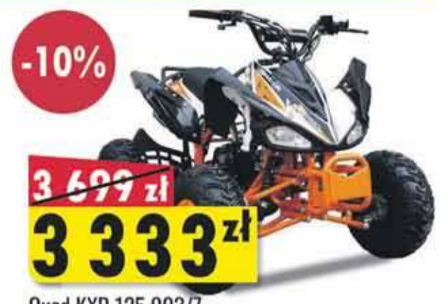
Quad KXD 125 003/7 125 cm 3 | 12 KM | Automatyczna skrzynia biegów | Koła 7 cali | elektryczny rozruch