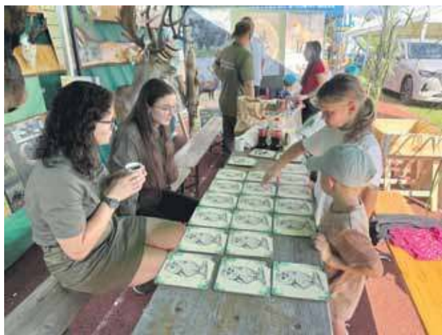
Festiwal Bobu w Skawie