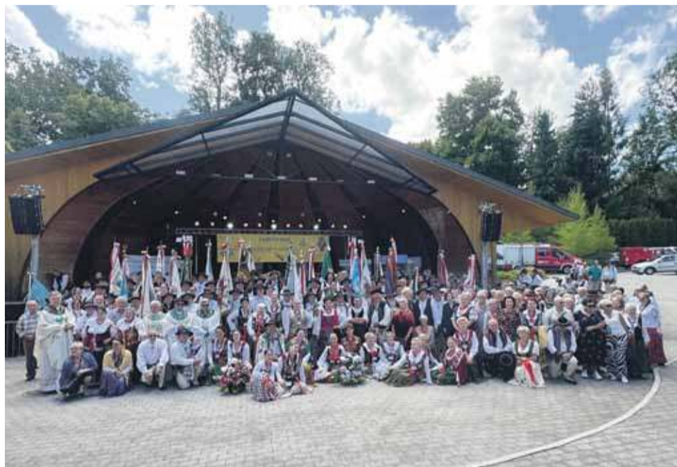
Gorczański Oddział ZP kończy 95 lat.