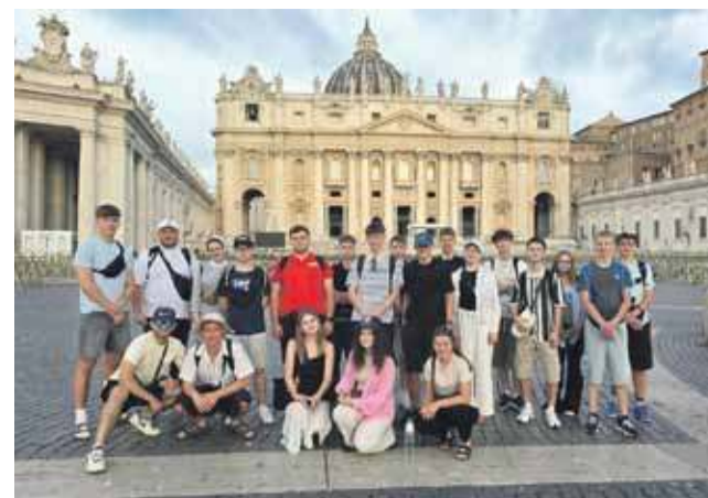
Był też czas na zwiedzanie.