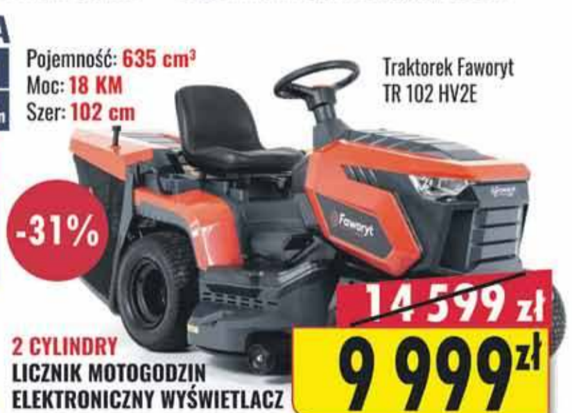
Traktorek Faworyt TR 102 HV2E