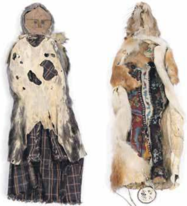
Figurki błędnie opisane jako „lalki” okazały się szamańskimi przedmiotami kultowymi.

- Te figurki prowadzą do pojęcia duszy u Selkupów. Ale i in-