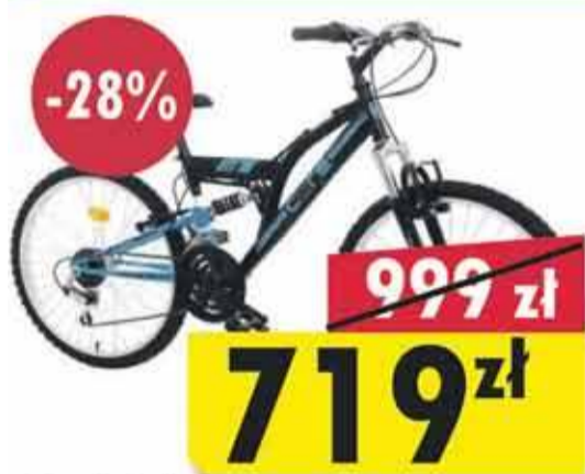
Core Antrak Rama 17" | Koło 26" | 18 biegów | Amortyzowany