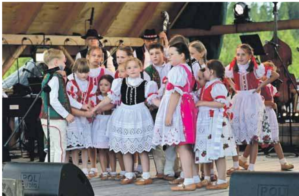
Kacwińskie Borówceki z Kacwina - czysta słodycz, wdzięk i radość.