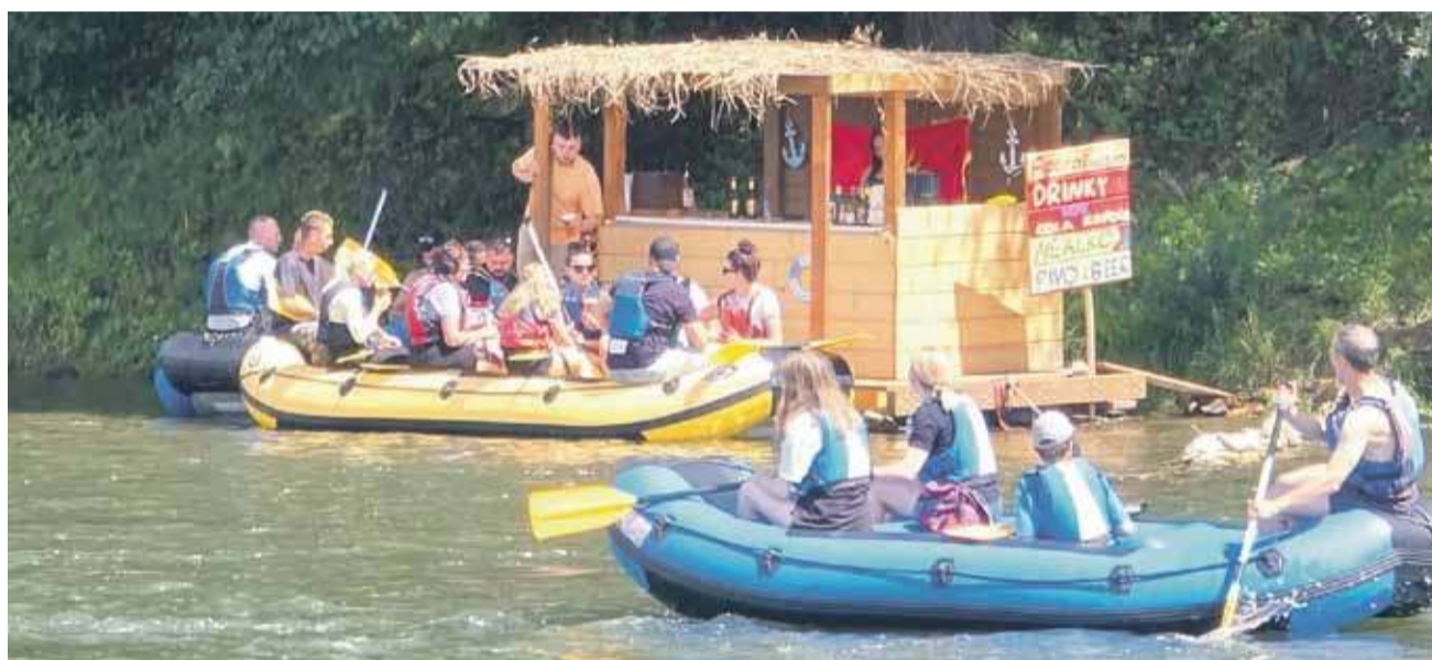
Budka z piwem w Czerwonym Klasztorze, kilkaset metrów poniżej kładki rowerowej w Sromowcach. Alkohol na wodzie to prośenie się o nieszczęście.

Rezerwat? Raczej imprezownia pod chmurką. Kilkaset metrów od kładki rowerowej w Sromowcach leje się alkohol - na górskiej rzece, gdzie chwila nieuwagi może skończyć się tragedią.