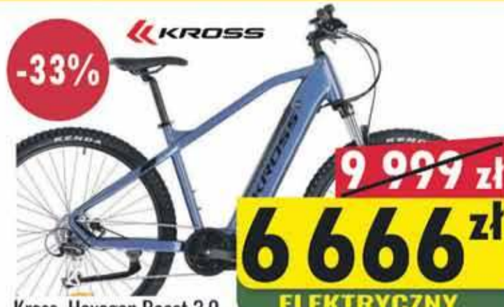
Kross Hexagon Boost 3.0 Aluminiowa rama | Koła 29" | 21 biegów | Hamulce hydrauliczne | Silnik - TRUCKRUN M1, 250 W | Bateria - 43.2V/13AH/561WH