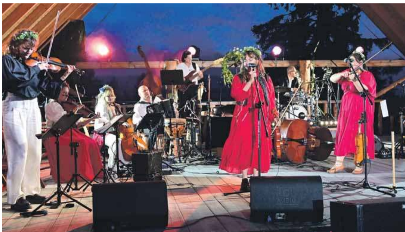
Koncert „Inspiracje” był gwoździem festiwalu Spiskie Melodie.