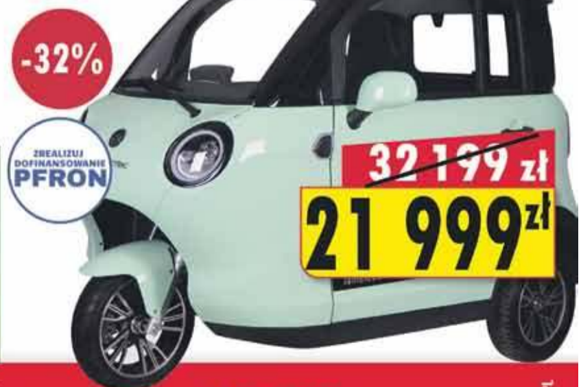
ZREALIZUJ DOFINANSOWANIE PFRON