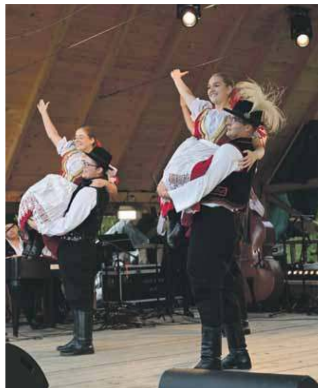
Zielony Jawor z Krempach w żywiołowych tańcach węgierskich,