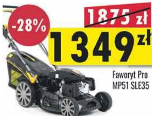
Faworyt Pro MP51 SLE35