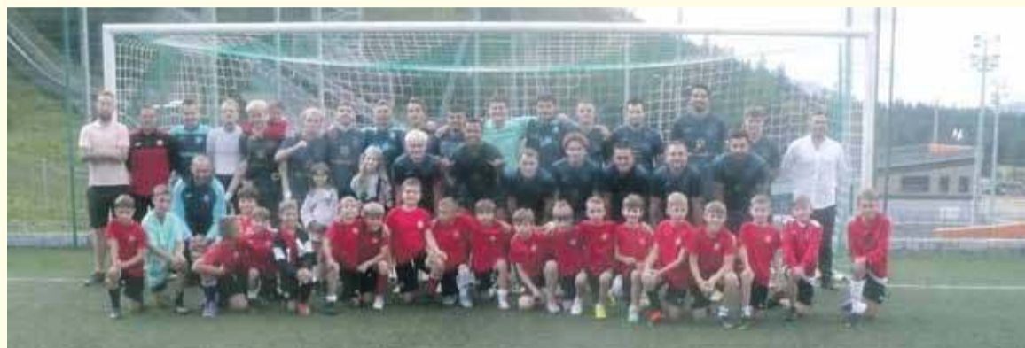
Drużyna KS Zakopane zainaugurowała sezon w klasie okręgowej wygraną z Orkanem Raba Wyżna.