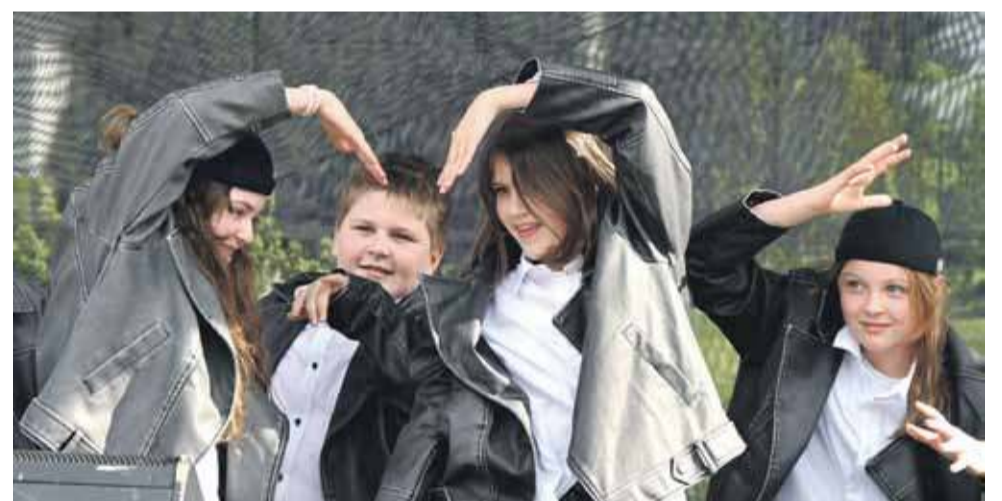
Grupa taneczna RED heART OF DANCE dała świetny popis swoich umiejętności.