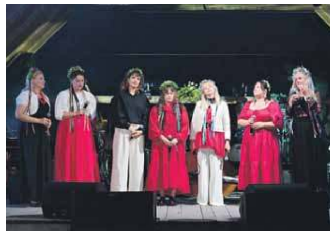
Koncert „Inspiracje” zakończyła przepiękna pieśń pt. „Dobrunoc” w wykonaniu artystek Piwnicy św. Norberta.