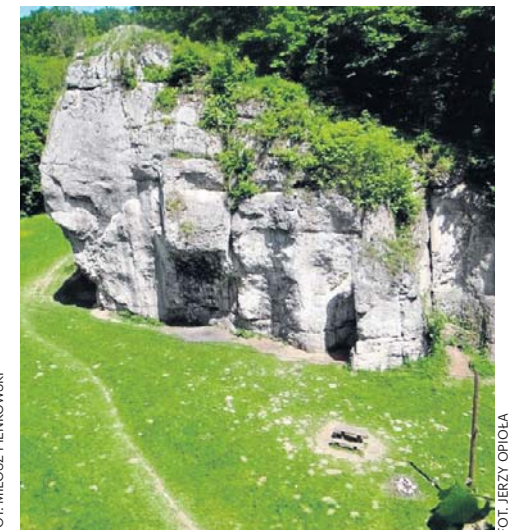
Dupa Słonia w Łazach