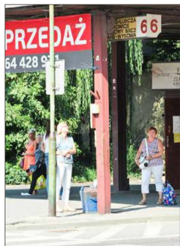
Był wystawiony na sprzedaż, nie znalazł się chętny.

Najpierw jednak działka zostanie wyceniona przez rzeczoznawcę i tę ofertę miasto przedstawi właścicielowi. Jeśli ten od razu zgodzi się na sprzedaż, przyspieszy to procedurę. Ale może być i tak, że od ustalenia bieglego odwoła się do Samorządowego Kolegium Odwoławczego.