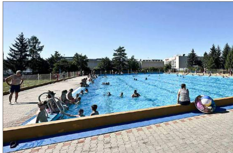
W lipcu z basenów zewnętrznych dało się korzystać tylko przez kilka dni.