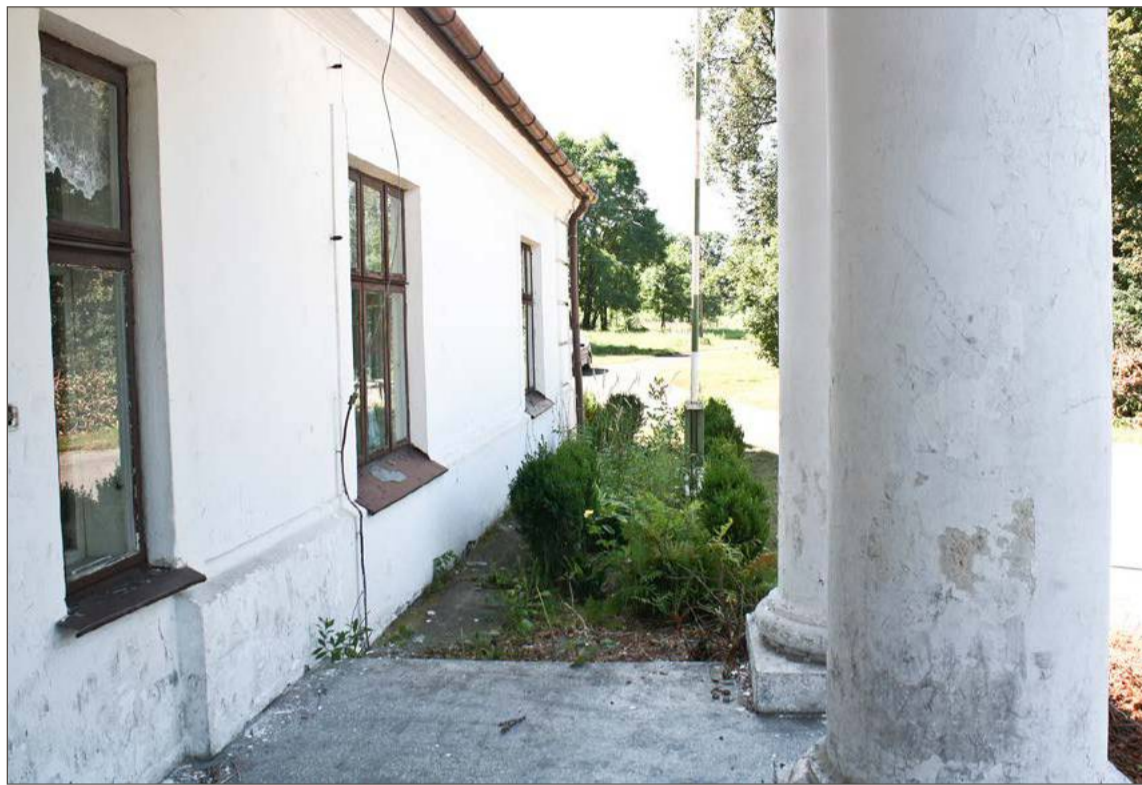
Spokojnym na co dzień Korzeniowem wstrząsnęła informacja o porwaniu dziecka.

Ciągle jesteśmy bombardowani różnymi nieprawdziwymi informacjami. Jak się ich ustrzec?