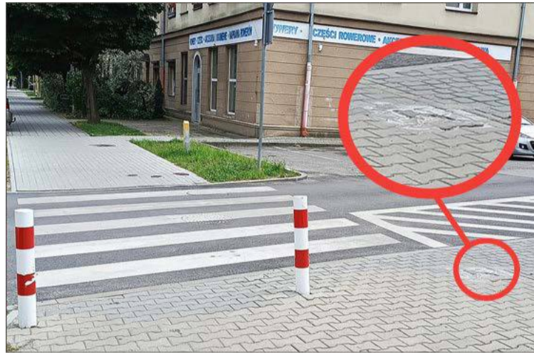
Dziura, która została po słupku została zatkana kostką brukową.

Znikający słupek na skrzyżowaniu Sobieskiego i Batorego nie jest jedynym problemem w tamtej okolicy. Droga po kilkunastu miesiącach prac została oddana do użytku, jednak już widać działania wandalami. Na skrzyżowaniu Sobieskiego z Ogrodową i Czarnieckiego wstawione zostały słupki z łańcuchami, które miały ograniczać przekraczanie jezdni w niedozwolonych miejscach. Komuś najwyraźniej