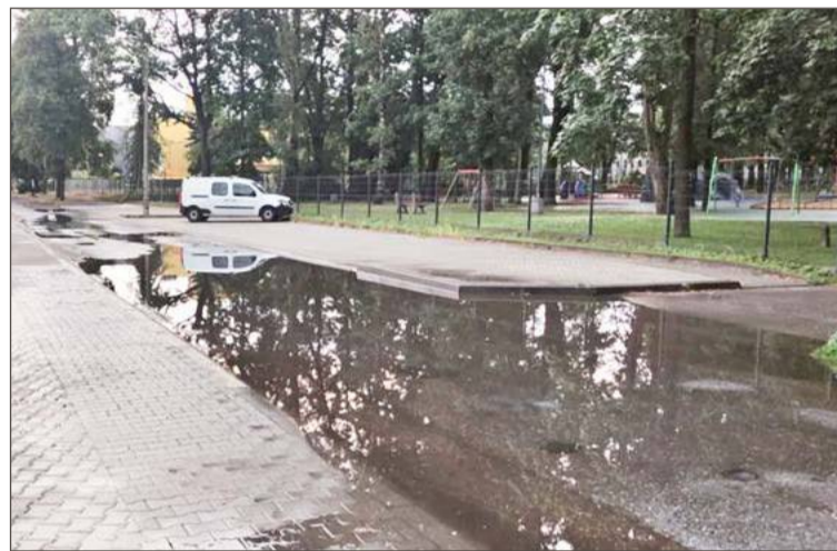
Na rozwiązanie problemu miasto ma pomysł.

Na roboty w terenie trzeba będzie jeszcze poczekać. Brak dokumentacji to jedno, ale przy Lisa jeden z deweloperów planuje budowę wielorodzinnego budynku mieszkalnego (pomiędzy stadionem a domem kultury).