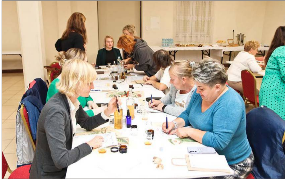
Wcześniej zajęcia w Uniwersytecie Samorządności cieszyły się dużą popularnością.