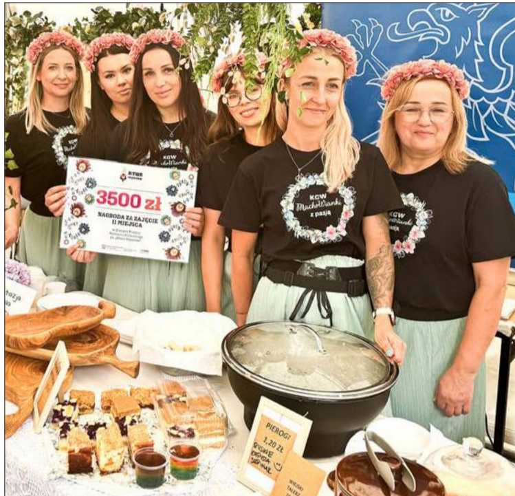
MachoWianki z pasją w Lesku zdobyły nagrodę w wysokości 3 500 zł.

Twierdzi, że choć w namiocie, w którym obywatel się konkurs był mało miejsca, to takiego stoiska jak one nie miał nikt, mimo że prezentowało się tam 6 najlepszych kół z Podkarpacia. I choć nie udało