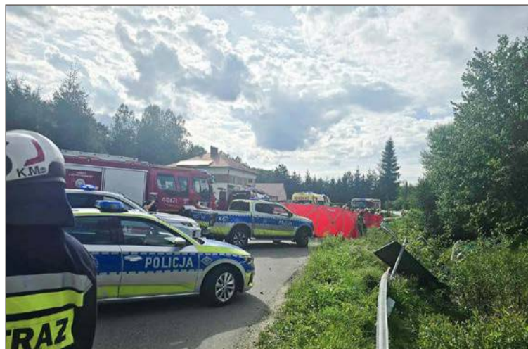
Samochód wypadł z drogi i wpadł do potoku.