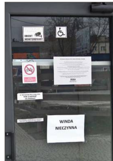
W tym roku była to pierwsza awaria windy.

I dodaje, że windy i szyby przystosowane są do norm, które w czasie intensywnych opadów zostały przekroczone.