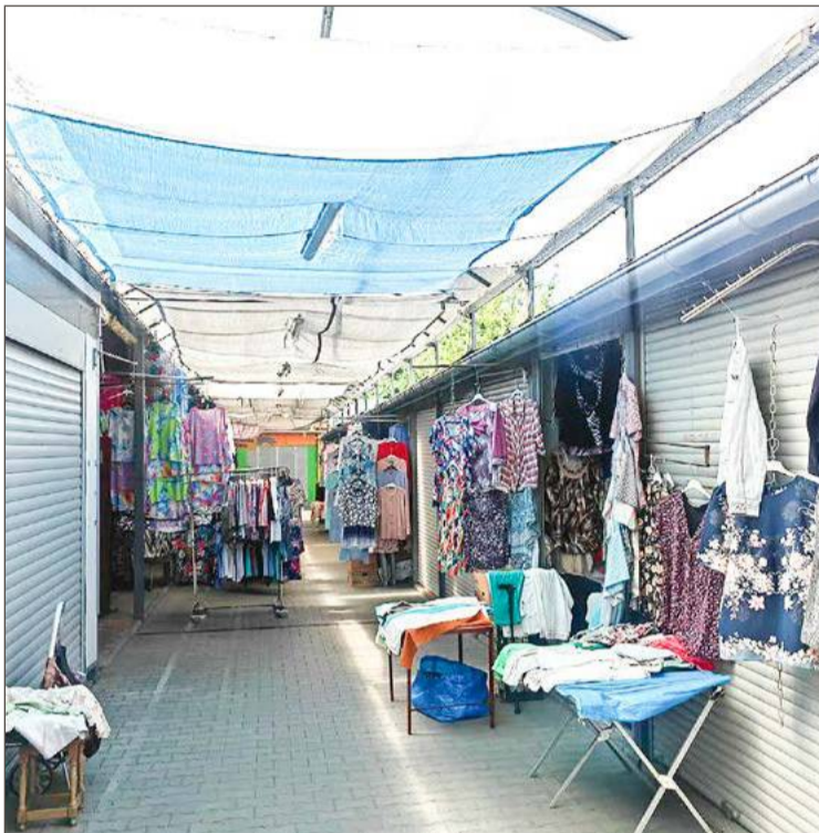
Wiele stoisk zostało zamkniętych. Trzyma się jeszcze sekcja z ubraniami.

- No pewnie, że brzydki. Miałam na to pomysł, ale nikt nie był zainteresowany - wyjaśnia.