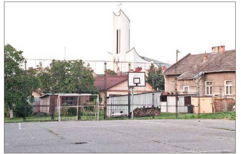
Boisko wymaga remontu.