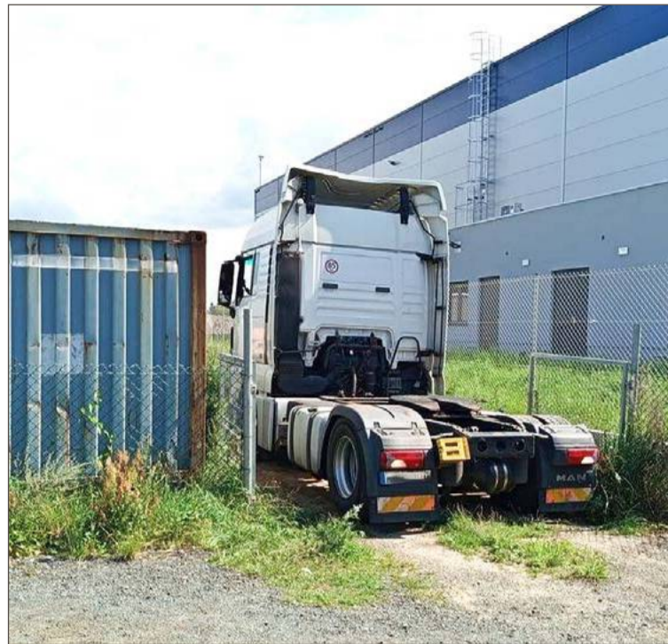
Ten samochód został użyty podczas oszustwa.

Na podstawie zebranego materiału oraz w wyniku czynności podjętych zarówno przez funkcjonariuszy Wydziału Kryminalnego, jak i Wydziału do Walki z Przestępczością Gospodarczą