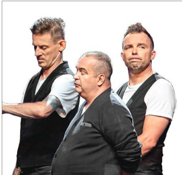
Kabaret Ani Mru Mru planuje przyjechać do Dębicy 15 września.

5 października natomiast do Morsa zaprasza Robert Rozmus, który poprowadzi tam koncert, podczas którego usłyszeć będzie można największe przeboje opowiadające o miłości. A jak już przy