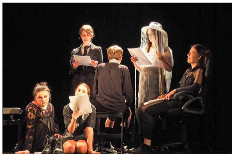
Na scenie zobaczyć będzie można m.in. członków grupy T.Lab.

25 sierpnia Miejski Ośrodek Kultury zaprasza na koncert piosenki aktorskiej dla dorosłych.