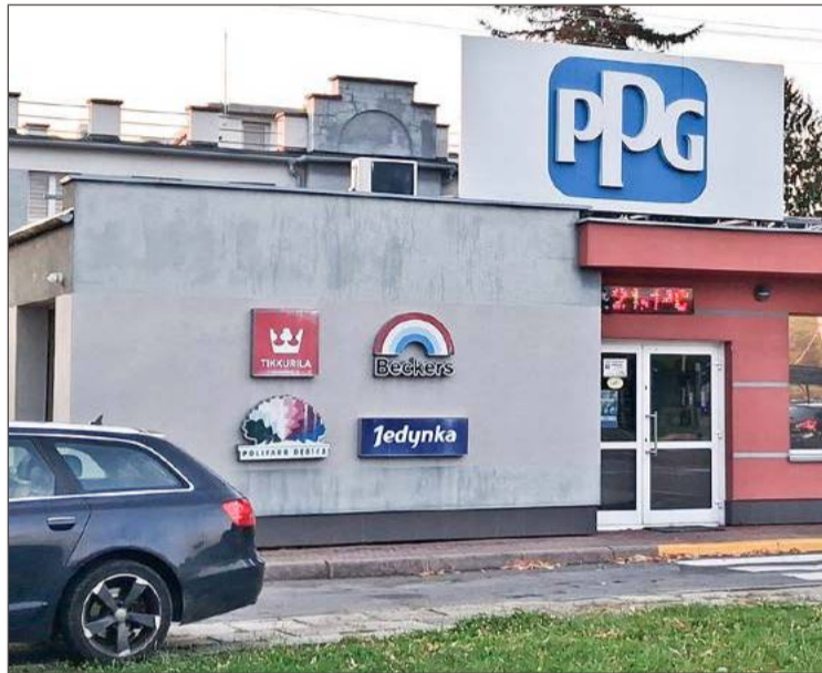
Produkcja w zakładzie rozpoczęła się w 1938 roku. Najpierw produkowano tam syntetyczny kauczuk. Produkcja farb i lakierów ruszyła 7 marca 1955 roku.

We Wrocławiu ma zostać przeprowadzona rozbudowa zakładu i tamtejsza fabryka nie będzie