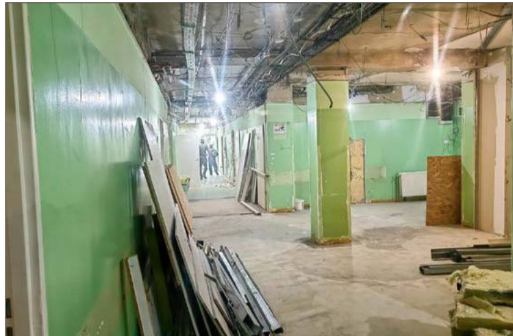
Część SOR, gdzie przyjmują chirurdzy, jest już zamknięta.

Plany remontowe zakładają także przeniesienie z części, gdzie znajduje się SOR, pomieszczenia na dokumentację medyczną.