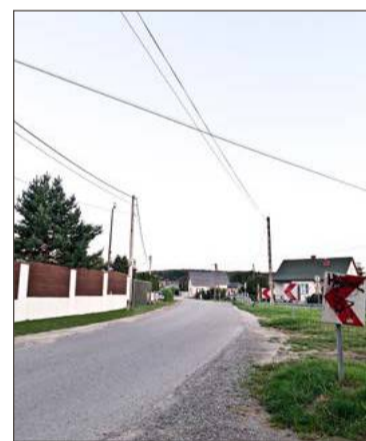
Budowa chodnika na Polnej jest długo wyczekiwana przez mieszkańców.

- Przed obwodnicą, na ostatnim łuku inwestycja będzie wchodziła