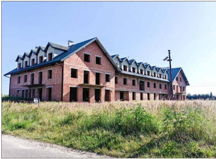
Nikt nie jest w stanie powiedzieć, ile będzie kosztowała adaptacja budynku w Nagawczynie na potrzeby siedziby urzędu gminy.

I przypomina, że budynek został zbudowany około 20 lat temu i od