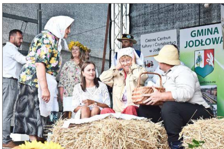
To będzie już szóste powiatowe święto potraw regionalnych.

Na tym jednak nie koniec atrakcji podczas Jużyny. Zaprezentują się także kapela ludowe, a dla dzieci przygotowane zostaną darmowe dmuchańce, z których będzie można korzystać przez całą imprezę.