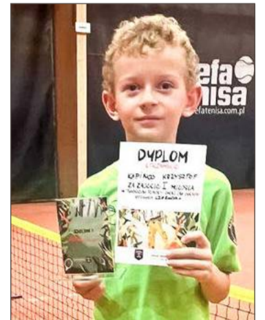
Młody tenisista może pochwalić się kolejnymi zwycięstwami.

Ale wydarzenie w Krakowie nie było jedynym w ostatnim czasie, gdzie triumfował młody zawod-