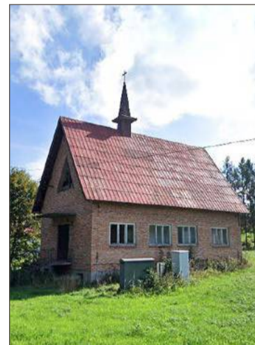
Coraz bliżej przebudowy kaplicy.

Nie wiadomo kiedy rozpoczną się prace. W tym roku nie ma na to szans. Zadanie będzie dość kosztowne, gdyż budynek wymaga kapitalnego remontu i gruntownej