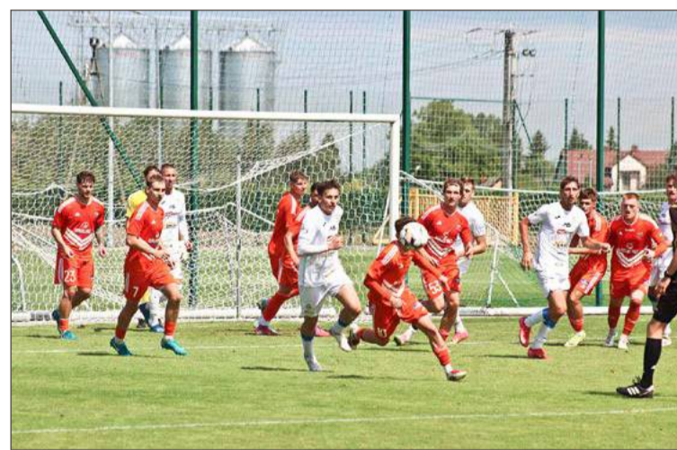
Igloopol pokonał rezerwy Bruk-Betu Termalica.