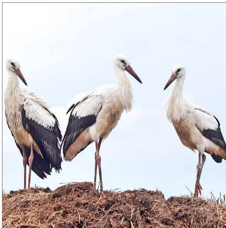
Taki widok można zobaczyć w Chotowej.