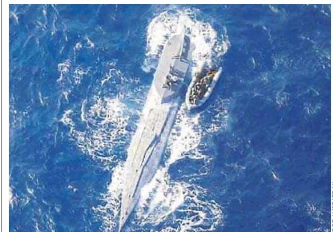
Zdjęcie z przejęcia łodzi podwodnej pełnej kokainy wartej 441 milionów dolarów