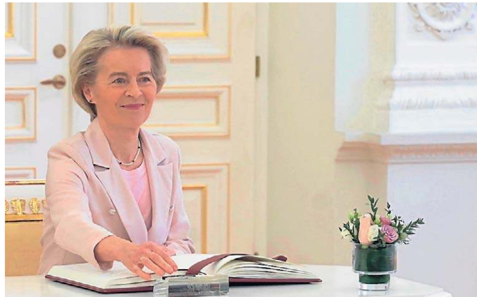
W liście do przywódców UE von der Leyen wskazała pięć kluczowych obszarów działań, przed którymi stanie Unia Europejska

Pierwszym z nich jest deregulacja i uproszczenie prawa unijnego. KE zapowiedziała dalsze pakiety „Omnibus” (uproszczenia w unijnym prawie), kompleksowy przegląd dobroku prawnego UE oraz ograniczanie biurokracji dla firm i obywateli. Celem jest obniżenie kosztów administracyjnych, przyspieszenie inwestycji i ułatwienie prowadzenia działalności gospodarczej w całej Unii.