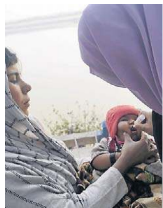
Kampania szczepień w Pakistanie

- Najczęściej ekipa medyczna nie zastała dziecka w domu. W innych przypadkach pracownikom nie udało się dotrzeć na miejsce z powodu problemów z bezpieczeństwem lub trudnych warunków atmosferycznych - powiedział dziennikowi „Dawn” pracownik programu walki z polio, zorganizowanego przez pakistańskie Narodowe Centrum Operacji Kryzysowych (EOC).