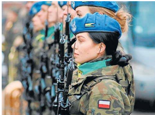
Pierwszą masową deportację obywateli polskich z ziem wschodnich RP przeprowadzono 10 lutego 1940 r.

Organizatorem uroczystości był Zarząd koszalińskiego oddziału Związku Sybiraków. Oddział liczy łącznie około 200 osób. ©