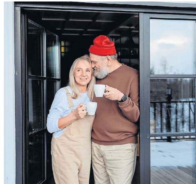
Bliskość drugiej osoby wpływa zarówno na nasze samopoczucie psychiczne, jak i na stan zdrowia