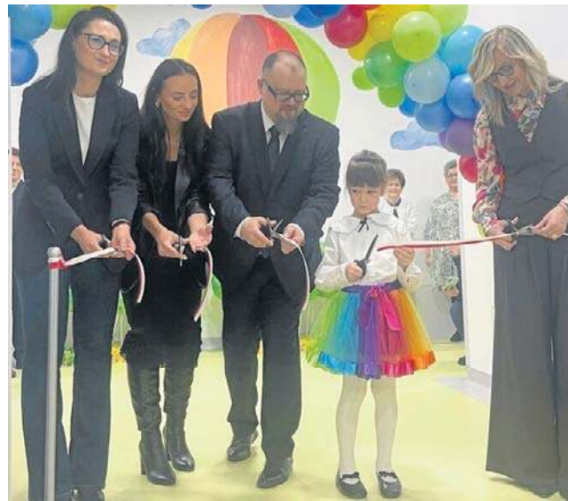
Nowe przedszkole w Białym Borze zostało oficjalnie otwarte