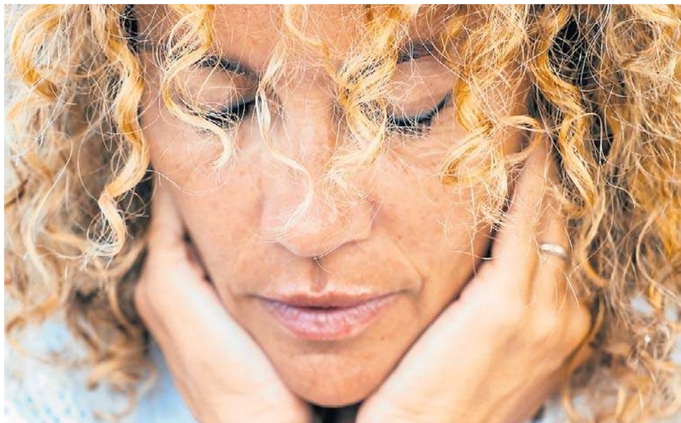
Już wcześniej łączono menopauzę z pogorszeniem funkcji poznawczych

Badacze z uniwersytetu w Cambridge wykorzystali dane zgromadzone w brytyjskim Biobanku, analizując informacje dotyczące blisko 125 tysięcy kobiet. Uczestniczki zaklasyfikowano do trzech grup: kobiet przed menopauzą, kobiet po menopauzie, które nie korzystały z hormonalnej terapii zastępczej (HTZ), oraz kobiet