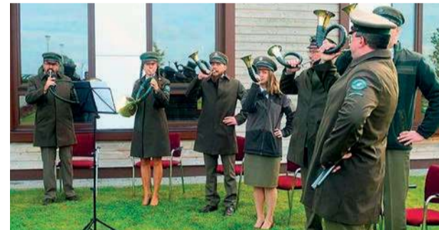
Uroczystość uświetnił występ zespołu sygnalistów myśliwskich Akord