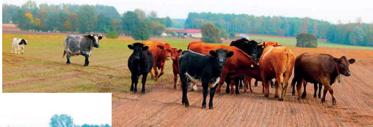
Jak opowiadają mieszkańcy stado krąży po okolicznych polach i łąkach

Stado krów, które ucieka z jednego z gospodarstw, nie tylko niszczy uprawy innych rolników, powodując straty materialne. Stanowi zagrożenie na drodze, i nie tylko - prowadzi je potężny byk przewodnik, który według relacji mieszkańców jest agresywny.