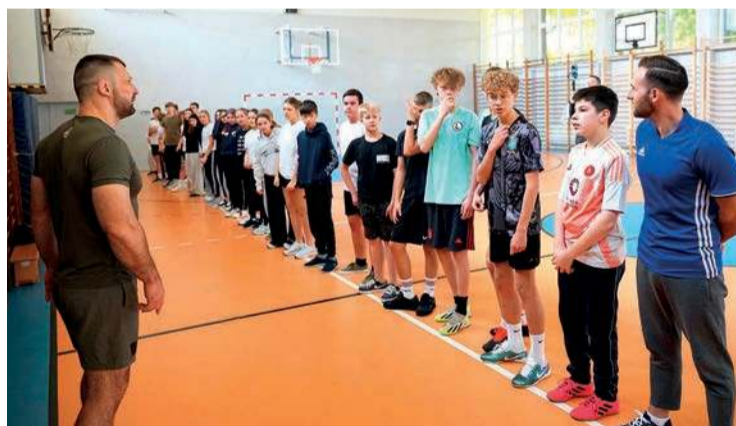
Czy mistrz olimpijski i zawodnik MMA namówi dzieci do ruchu?

W Ciechanowie rozpoczęła się realizacja miejskiego programu przeciwdziałania nadwadze i otyłości wśród dzieci i młodzieży.