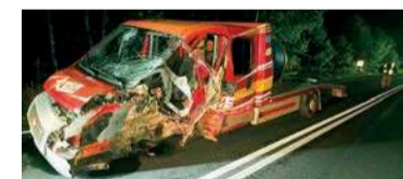
Zderzenie w Karniewie

Wstępne ustalenia wskazują, że 32-letni kierujący Renault, mieszkaniec pow. toruńskiego, z nieustalonych przyczyn zjechał na przeciwny pas ruchu zderzając się czołowo z jadącym z naprzeciwka Fiatem Ducato, którym kierował 49-letni mieszkaniec pow. elckiego. 32-latek trafił do szpitala. Jak się później okazało mężczyzna nie odniósł większych obrażeń ciała. Wstępne badania wskazały, że 32-letni kierujący był pod działaniem narkotyków – informuje oficer prasowa makowskiej policji.