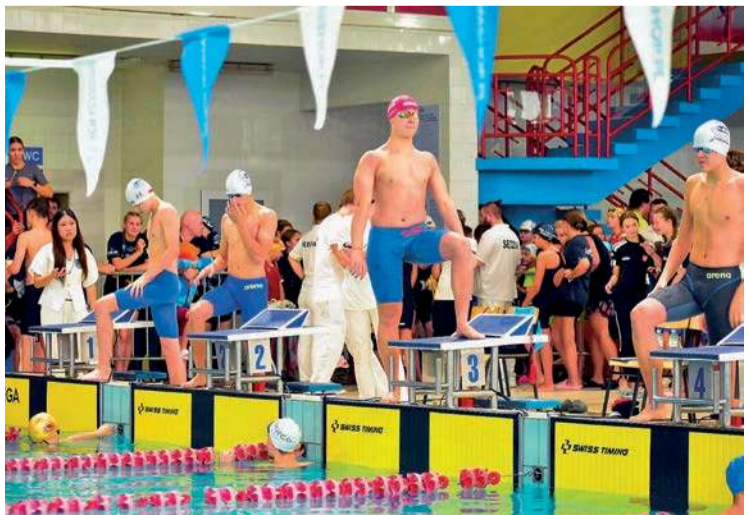
Organizatorem zawodów był Klub Pływacki Ciechanów