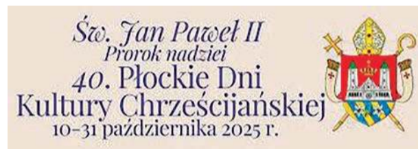
Płockie Dni Kultury Chrześcijańskiej 2025