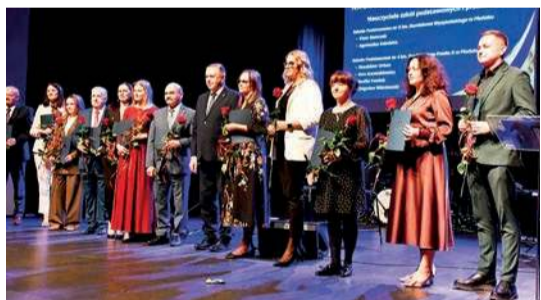
Miejska gala Narodowego Dnia Edukacji odbyła się we wtorek, 14 października. Podczas uroczystości wręczono nagrody burmistrza

Podczas miejskich obchodów Dnia Edukacji Narodowej w Płońsku wręczono nagrody burmistrza oraz nagrody dyrektorów szkół podstawowych i przedszkoli.