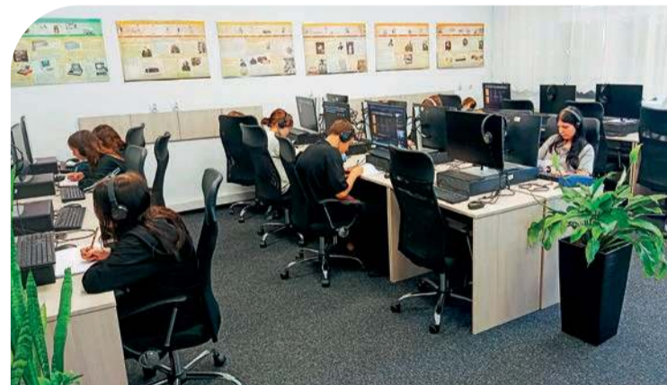
Do dyspozycji uczniów jest nowoczesna pracownia internetowa

Dzięki wsparciu samorządu województwa oraz środków z WFOŚiGW wykonano m.in. dwie termomodernizacje obiektu. Zespół Placówek dysponuje nowoczesnymi salami, pracowniami