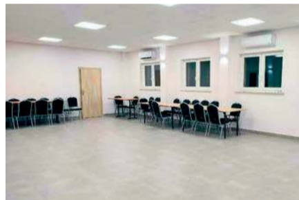
Zmodernizowane wnętrze świetlicy

z mazowieckich środków to ponad 119 tys. zł.