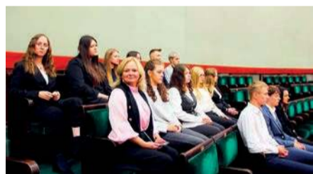
Młodzieżowa rada w Sejmie RP