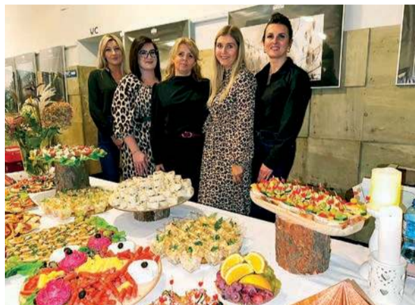
Pysznie i pięknie - aby tak było zadbał zespół Miejskiego Ośrodka Pomocy Społecznej w Pułtusku