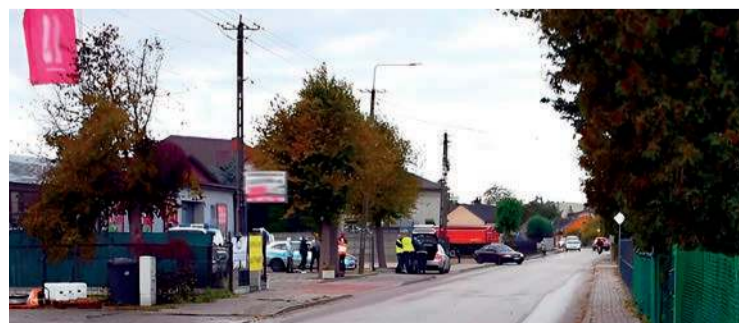
Na tej ulicy został potrącony pieszy

W ubiegły poniedziałek, po godz. 6 rano, na ul. Słowackiego w Strzegowie, doszło do poważnego zdarzenia drogowego z udziałem pieszego. Mężczyzna stał na jezdni, został potrącony przez kierującego nissanem. 21-latek, jadący nissanem, nie miał uprawnień do kierowania.