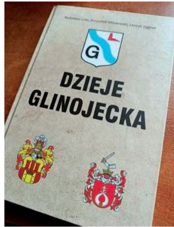
Monografia „Dzieje Głinojeczka”