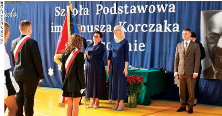
Uroczystości z okazji nadania sztandaru w Gąsocinie

przenieśli się do sali gimnastycznej. Tam odbyła się oficjalna część wydarzenia – prezentacja nowego sztandaru oraz część artystyczna w wykonaniu uczniów i młodych artystów związanych m.in. z Gminnym Ośrodkiem Kultury w Golotczyźnie.