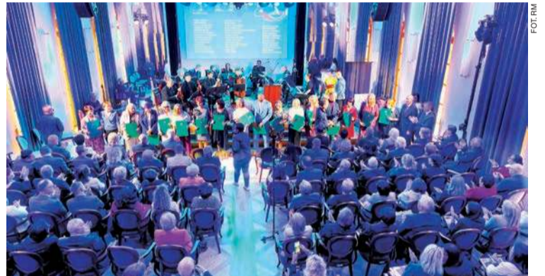
Gala z okazji 40-lecia ciechanowskiego szpitala

Piątkowe wydarzenie zgromadziło licznych gości – przedstawicieli środowiska medycznego, instytucji samorządowych, przyjaciół szpitala oraz lokalnej społeczności. Nie zabrakło również pracowników i personelu placówki, którzy od lat z oddaniem służą pacjentom.