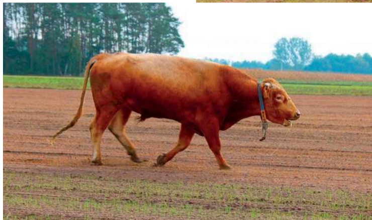
Stadu przewodzi potężny byk

Z jednego z gospodarstw w gminie Nowe Miasto regularnie ucieka stado krów. Zwierzęta tratują zboża, sieją zniszczenia w kukurydzy, podchodzą pod okoliczne posesje.