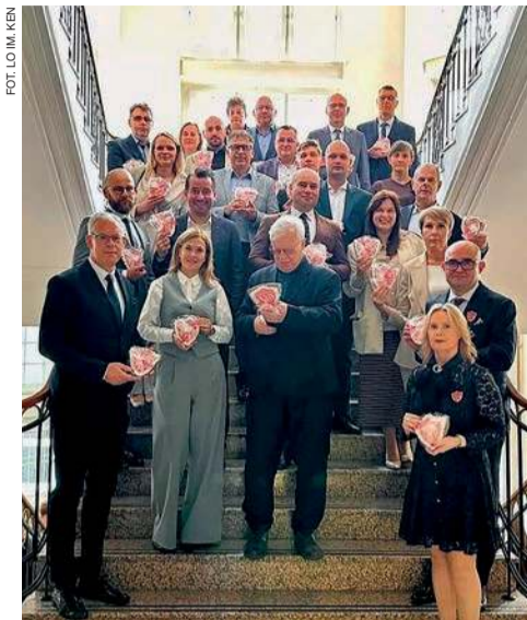
Uroczyste akademie odbyły się m.in. w Liceum Ogólnokształcącym im. Komisji Edukacji Narodowej w Przasnyszu

Henryka Sucharskiego miały miejsce w „Brzozowym Zakątku”. Do udziału w nich zaproszeni zostali przedstawiciele samorządu, nauczyciele emerytowani oraz pracownicy administracji i obsługi. Starostowie, przedstawiciele Rady Rodziców i Samorządu Uczniowskiego skierowali