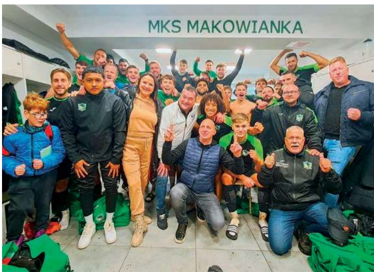
Piłkarze Makowianki wygrali szósty mecz w bieżących rozgrywkach