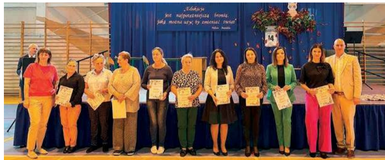
...oraz w Zespole Szkół Powiatowych im. Wł. St. Reymonta w Chorzelach

Henryka Sucharskiego miały miejsce w „Brzozowym Zakątku”. Do udziału w nich zaproszeni zostali przedstawiciele samorządu, nauczyciele emerytowani oraz pracownicy administracji i obsługi. Starostowie, przedstawiciele Rady Rodziców i Samorządu Uczniowskiego skierowali