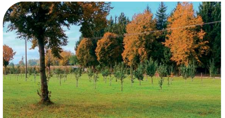
Sad utworzony przez wychowanków

Dzień toczy się według szkolnego rytmu: lekcje, zajęcia terapeutyczne, koła zainteresowań, akcje społeczne (WOŚP, Szlachetna Paczka, „Paka dla psiaka”) oraz częste wycieczki, które dla wielu wychowanków są pierwszą okazją, by zobaczyć świat poza miejscem zamieszkania.