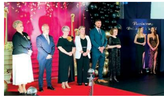
Nagrodzeni nauczyciele mieli okazję przejść po czerwonym dywanie