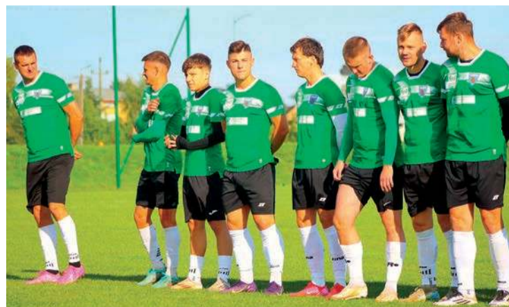
Piłkarze ze Słozewo pokonali na wyjeździe Krysztal Głinojeck

11. kolejka (25-26 października): Krasnosielc - Wkra, Orzeł - Pelta, Bartnik - Mazowsze, Łyse - Korona, Wymakracz - Przasnysz II, Pokrzywnica - Żbik II, Iskra - Mazur