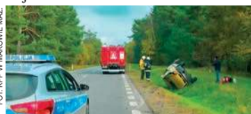
Dachowanie w Młynarzach

Policjanci wyjaśniają okoliczności i przyczynę zdarzenia drogowego, jakie miało miejsce 15 października o godz. 12.00 w Młynarzach, na drodze krajowej nr 61.