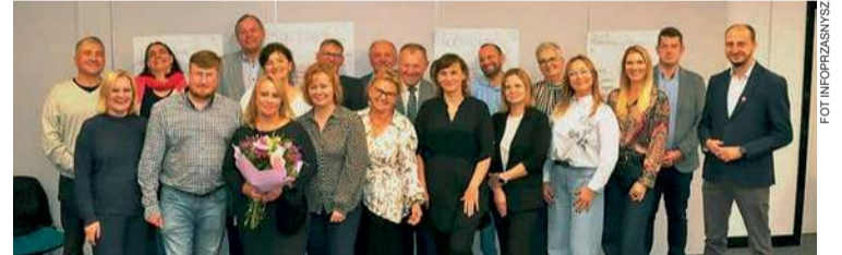
Federacja Rosa świętowała 10-lecie istnienia

ROSA jest związkiem sześciu stowarzyszeń działających na terenie powiatu przasnyskiego. Są to: Przasnyskie Stowarzyszenie Trzeźwościowe Rodzin Abstynenckich „Orlik”, Przasnyskie Stowarzyszenie Historii Źywej, Stowarzyszenie Pomocy