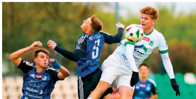
Mławianka przegrywa po raz szósty w sezonie

12. kolejka (25-26 października): Oldaki - Ostrovia, Konopianka - Sona, Mławianka II - Wkra R., Narew II - Rzekunianka, Gladiator - Korona, Strzegowo - Krysztal, Wkra B. - Opia, Kurpik - Wkra Ż.