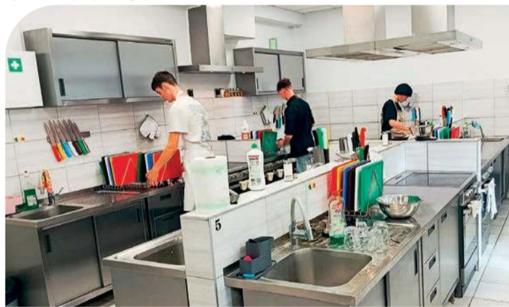
Młodzież podczas zajęć praktycznych

– Ośrodek socjoterapii to pierwszy szczebel, gdzie rodzic chce pomóc dziecku. Ośrodek wychowawczy – gdy sąd się włącza. Są też okręgowe ośrodki wychowawcze, schroniska dla nielet-