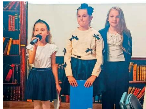
Program artystyczny uczniów SP w Głinojeczku