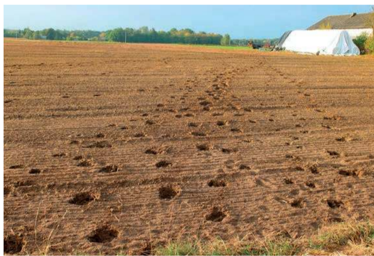
Policja wyjaśnia sprawę uciekającego bydła, które niszczy uprawy i stanowi zagrożenie

- Po ostatnim zdarzeniu rozmawiałem z burmistrzem, przyjechał strażnik