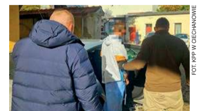
Mężczyźni grozi wieloletni wyrok pozbawienia wolności

Dodatkowo 19-latek odpowie za wcześniejsze (10 października) strzelanie z broni pneumatycznej w jednym z supermarketów Biedronka w Ciechanowie, narażając innych na niebez-