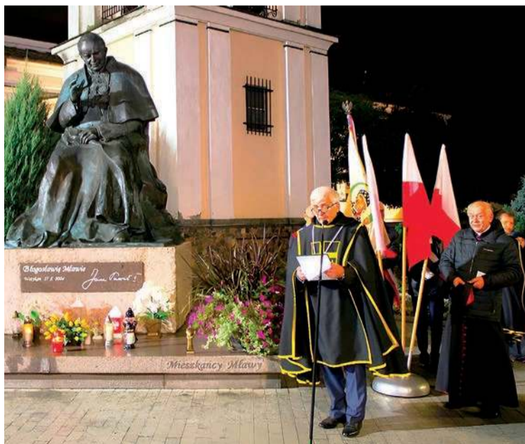
Rycerze z Zakonu św. Jana Pawła II przy pomniku