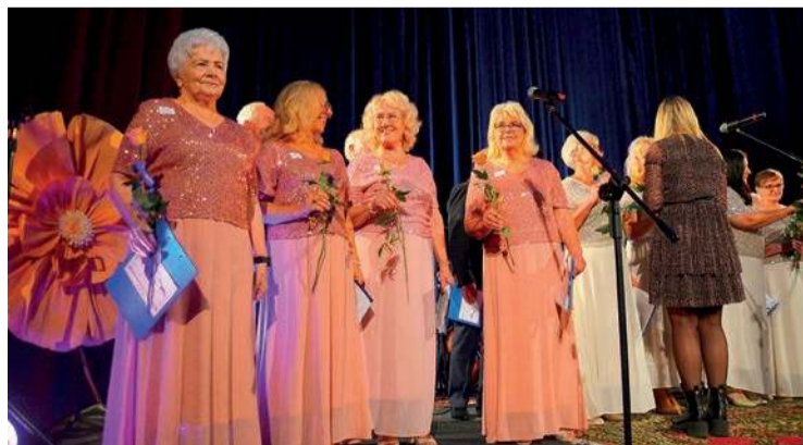
Artyści nagrodzeni zostali kwiatami

kręgosłup”, wernisaż wystawy i spotkanie autorskie twórców wystawy „Moje Mazowsze” zorganizowanej przez Fundację Art-Heart, bezpłatne dla seniorów