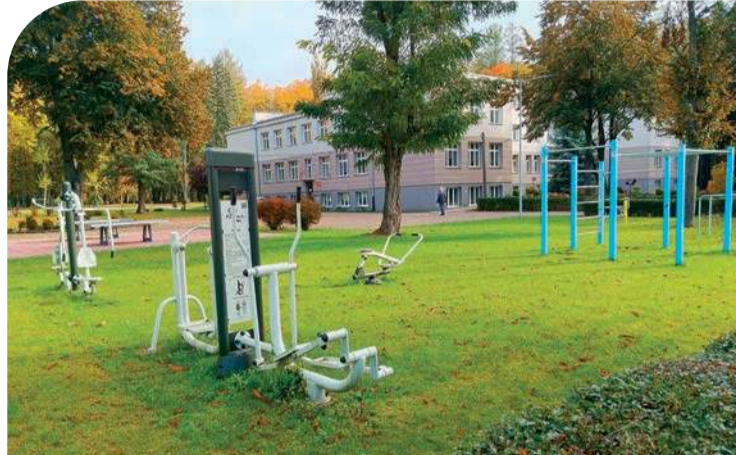
Siłownia w plenerze

W ośrodkach zatrudnieni są m.in. psychologowie, pedagodzy, socjoterapeuci oraz pielęgniarka ze specjalizacją. Placówka współpracuje z poradnią „Szansa” w Płońsku i Ciechanowie, zapewniając swoim wychowankom regularne konsultacje psychiatryczne.