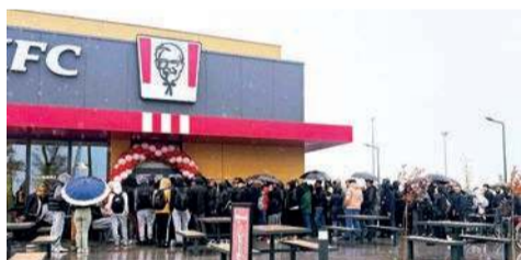
Kolejka po kubetek...

Oficjalne otwarcie nowego KFC przy galerii handlowej we Władysławowie odbyło się w piątek 17 października w samo południe. Sieć zapowiedziała, że na pierwszych stu smakoszy czekają