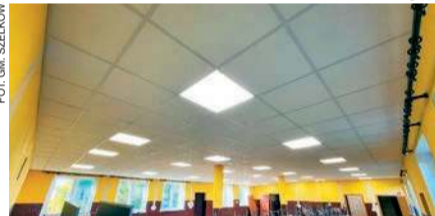
Inwestycja w OSP

Całkowita wartość zadania to niemal 149 tys. zł, z czego dofinansowanie