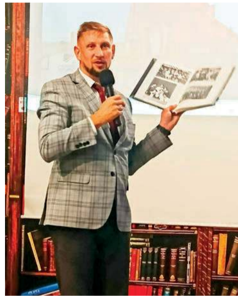
Burmistrz Łukasz Kapczyński