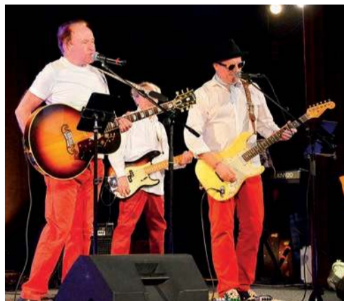
Zespół Czerwone Teksasy

Wydarzenia w ramach Pułtuskiej Złotej Jesieni cieszą się dużym zainteresowaniem, seniorzy aktywnie w nich uczestniczą. Dotychczas odbyły się już m.in. zajęcia gimnastyczne „Zdrowy