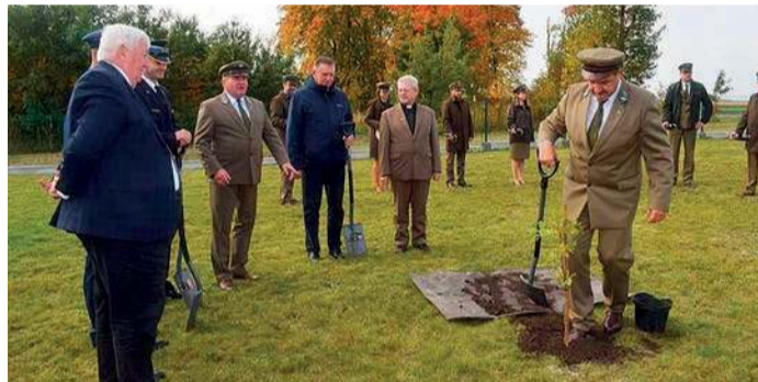
Posadzony został pamiątkowy dąb