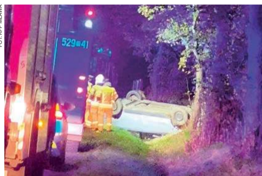
Kierujący trafił do szpitala

Wczoraj wieczorem doszło do wypadku na drodze Rywociny – Kęczewo. Kierowca osobowego passata w pewnym momencie wypadł z drogi i dachował.