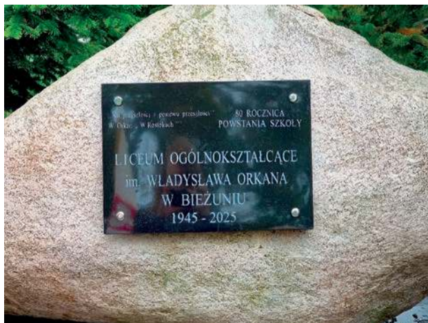
Tablica upamiętniająca 80-lecie szkoły

lizację wojskową. W marcu 2000 roku szkoła podjęła starania o utworzeniu