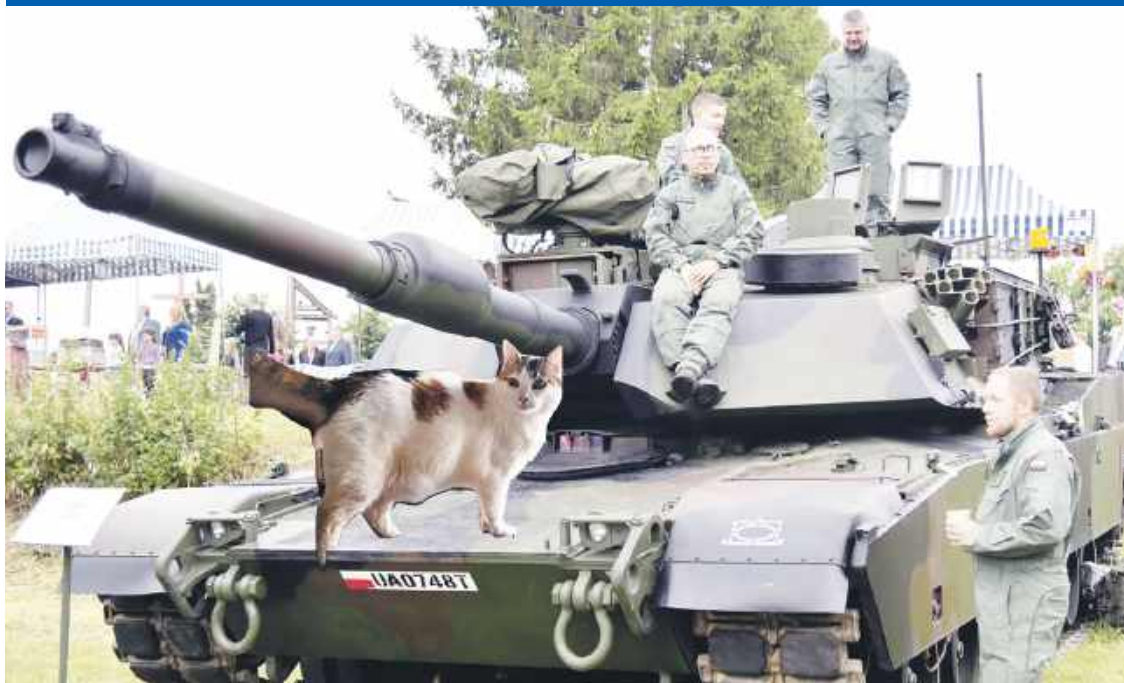
Cztery pancerni i kotka... (Łucja)