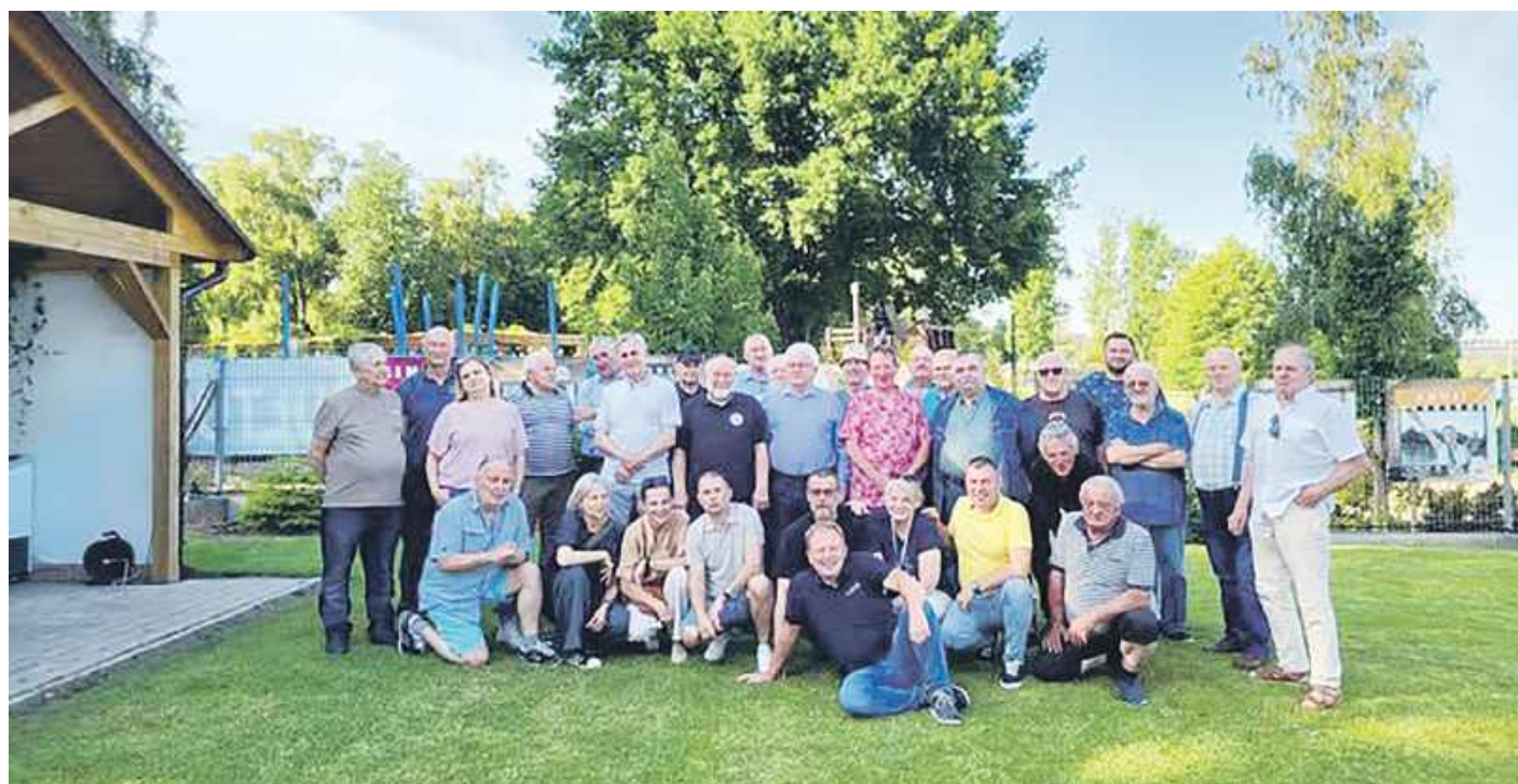
Spotkanie grupy 1PHDŻ i HOW, czerwiec 2025

Od paru lat odbywają się coroczne zjazdy starszych i młodszych członków tej grupy, w których uczestniczy od 30 do 80 osób. W tym roku, pod wiatą Pułtuskiego Klubu Wodniaków, 14 czerwca br. odbyło się czwarte spotkanie. Co było wyjątkowego w tym spotkaniu? Obecni byli na nim przedstawiciele uczestników wszystkich największych spływów w historii drużyny od 1960 roku, udało się ustalić początki ratownictwa wodnego w Pułtuskach, podjęto też decyzje o dalszej pracy i wybrano zarząd grupy.