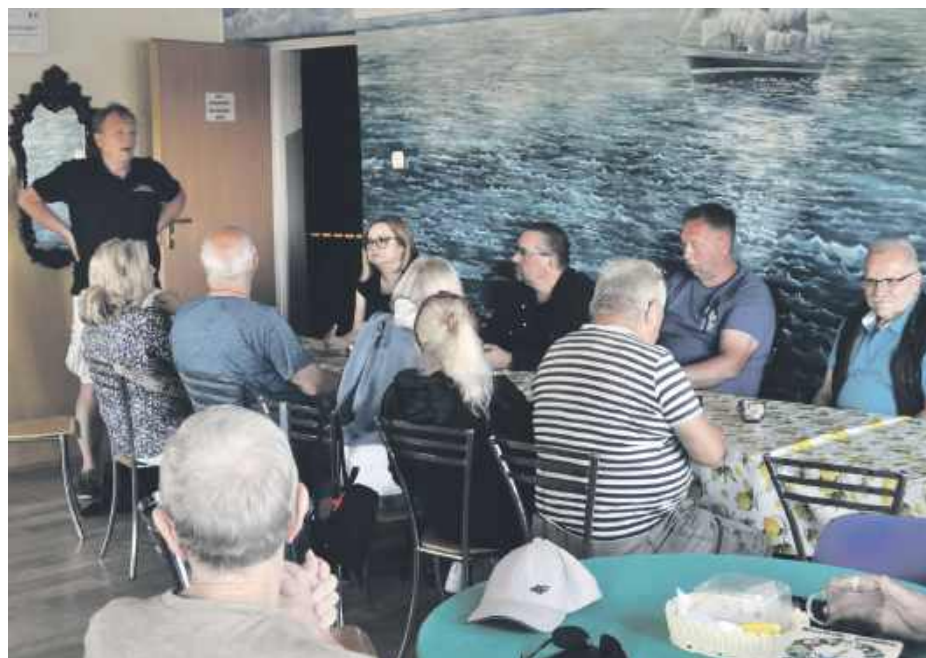
W czerwcu 2025 r. członkowie Klubu podjęli uchwałę o powołaniu grupy 1 Pułtuskiej Harcerskiej Drużyny Żeglarskiej i Harcerskiego Ośrodka Wodnego przy Pułtuskim Klubie Wodniaków.