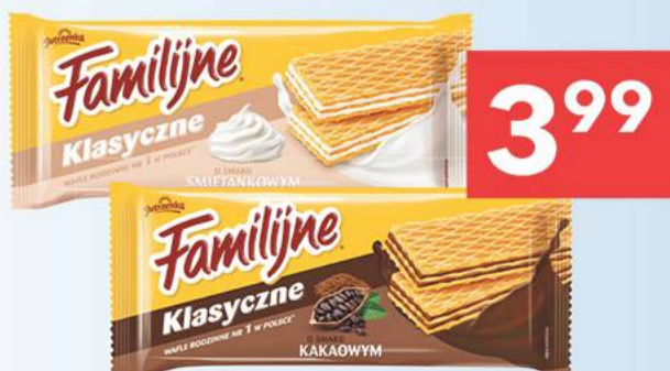
Wafle Familijne Klasyczne Jutrzenka o smaku kakaowym, śmietankowym 180 g [22,17 zł/ 1 kg]