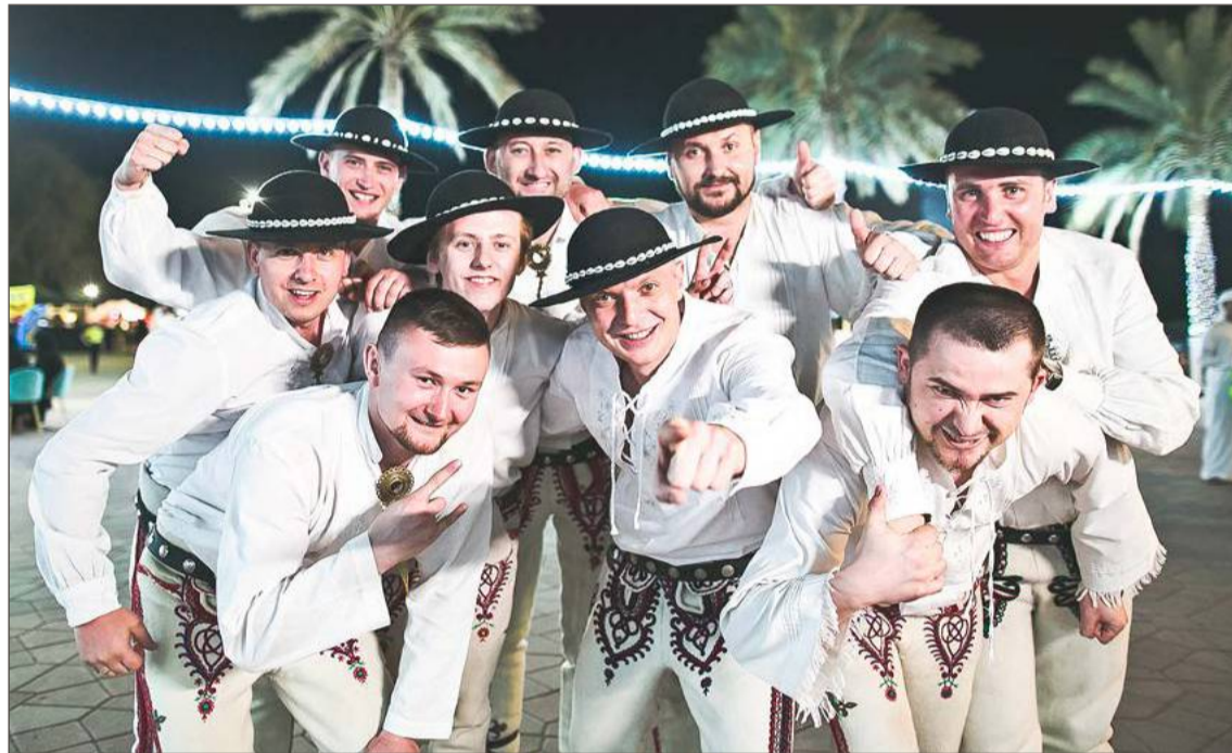
Gwiazdą dożynek w Jodłowej będzie Kapela Góralska Ciupaga.

Do dożynek szykuje się również gmina Jodłowa. Tam odbędą się one tydzień później, w niedzielę 31 sierpnia.