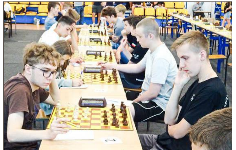
Przez dwa dni w Dębicy rywalizowało ponad 270 szachistów.