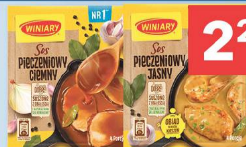
Sos pieczeniowy Winiary jasny 27 g, ciemny 30 g [76,33-84,81 zł/ 1 kg].

Przy zakupie 2 szt. cena za pakiet wynosi 11,98 zł. Limit 1 pakiet na kupon.