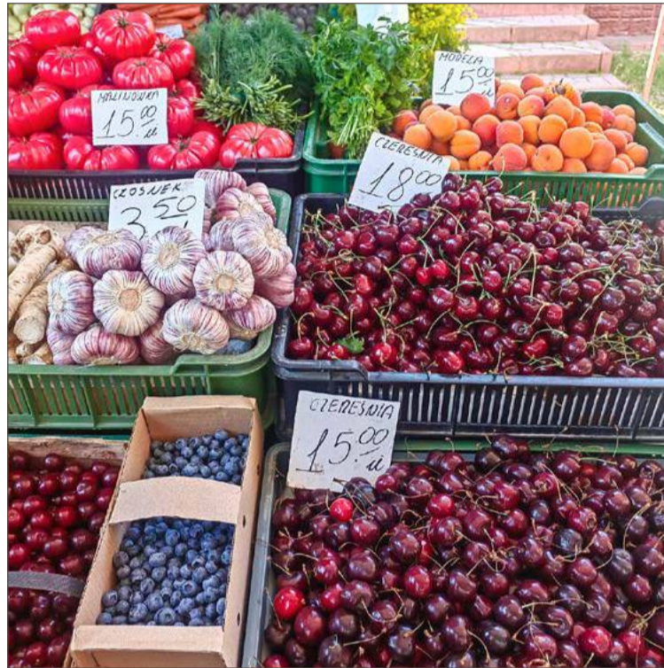
Za kilogram czereśni ceny dwucyfrowe. I to się nie zmieni.

Młody seler z pióropuszem liści to wydatek 7 zł za sztukę, tyle samo kosztuje główka kapusty, pęczek młodej marchwi - 5 zł, kalafior od 5 do 7 zł, duża kalarepa 4 zł. Kilogram szparagówki kosztuje