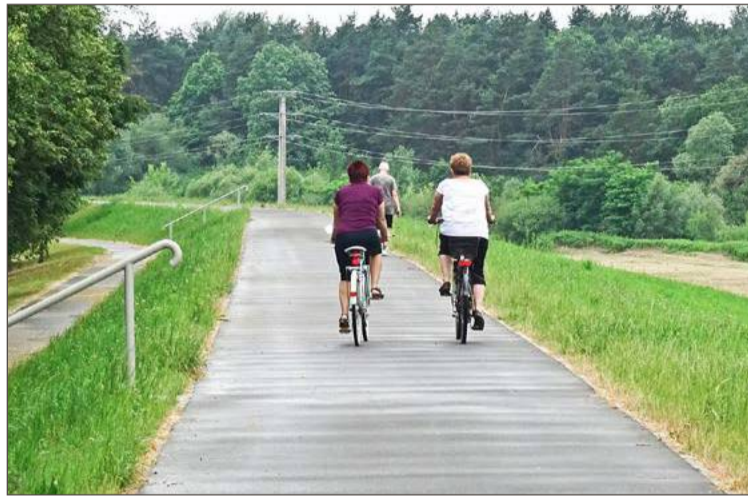
Wały to ulubione miejsce spacerów mieszkańców osiedla Słoneczne.

Wtedy miejskie służby mogłyby nie tylko oznakować je na całej dłu-