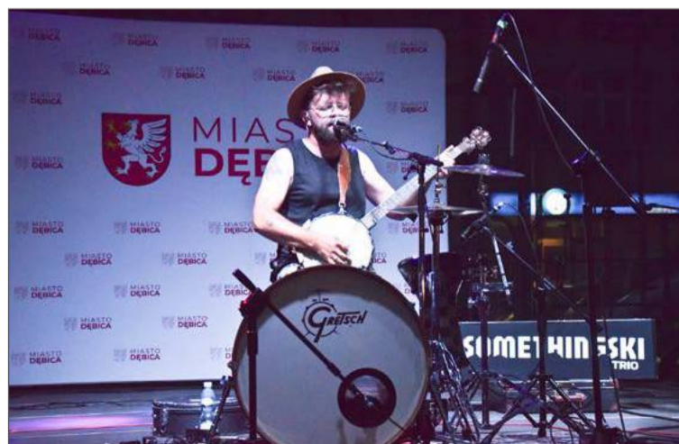
Finałowy koncert Somethingski Trio.