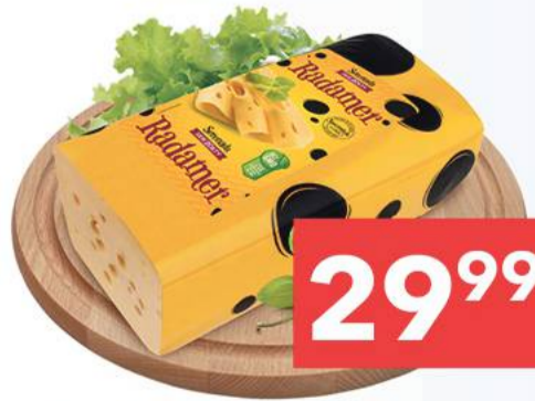
Ser Radamer Serenada 1 kg [29,99 zł/ 1 kg]