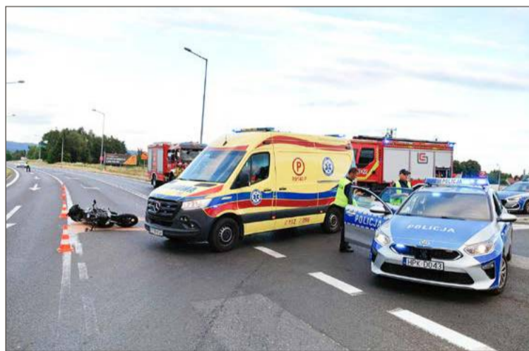
W Piłźnie też ucierpiał kierujący motocyklem.

I dodaje, że kierowcy obydwu pojazdów zostali przebadani na obecność alkoholu w organizmie, obydwaj byli trzeźwi. Kierujący audi zostanie ukarany mandatem.