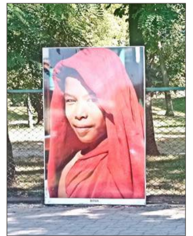
Jedno ze zdjęć prezentowanych na wystawie.

Jeszcze do 15 lipca na ogrodzeniu Parku Jordanowskiego gości wystawa pt. Uśmiech świata.