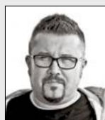
ratuszniak@ol.com.pl tel. 14 670 27 80