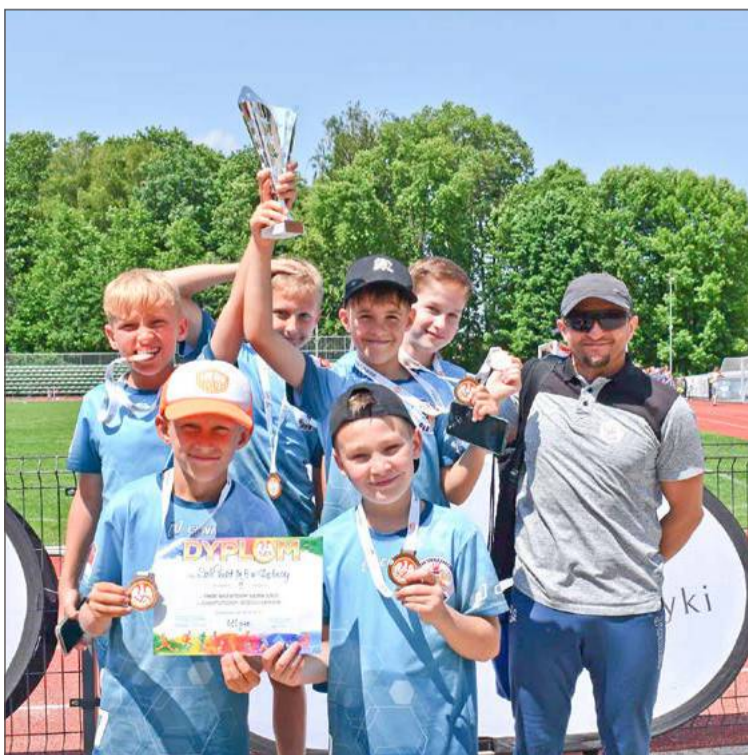
Uczniowie SP nr 5 zdobyli brązowy medal w finale wojewódzkim w 3-boju.