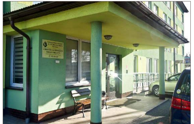
500 000 zł, tyle Anna Wójcik proponuje za ten budynek i działkę.