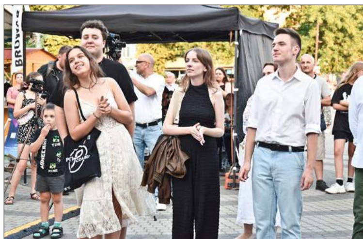
Publiczność na Rynku w niedzielny wieczór.