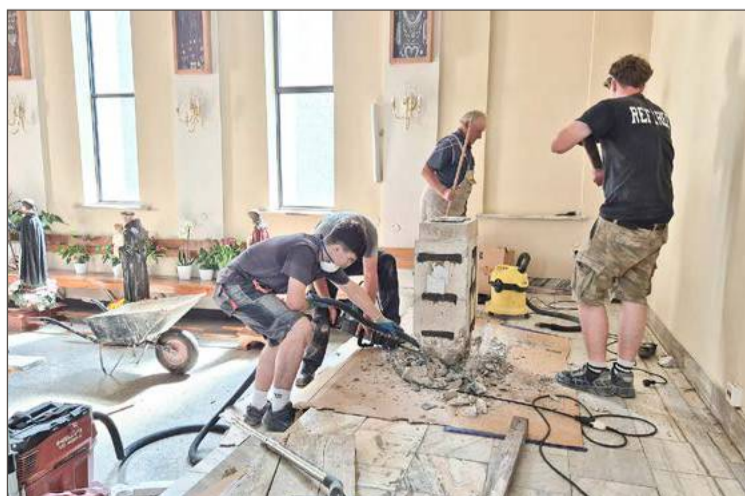
Ołtarz i ambonka w kaplicy bocznej zostały zdemontowane.