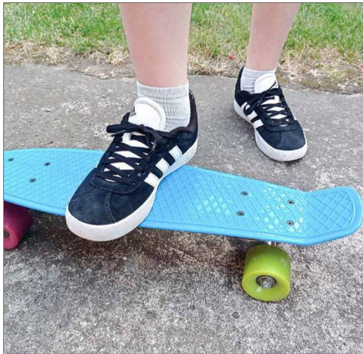
Jazda na deskorolce może być niebezpieczna. Zwłaszcza w konfrontacji z samochodem.

I wyjaśnia, jak doszło do wypadku. 35-latek na deskorolce miał zamiar przejechać przez rondo pasem dla rowerów. Ale nie wyhamował i dostał się pomiędzy kabinę, a nacząpę tira. Został wciągnięty pod nadwozie. Doznał licznych obrażeń w postaci stłuczeń i otarć, karetka zabrała go do szpitala. Zdaniem Roberta Krasa kierujący tirem nie miał szans zauważyć, co się stało. Policjanci już namierzili samochód na gdańskich numerach rejestracyjnych, kierowca zostanie przesłuchany. Ale ustalenia wskazują, że do wypadku doszło z winy deskorolkowca.