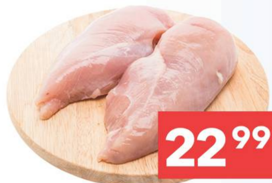
Filet z kurczaka 1 kg [22,99 zł/ 1kg]

TANIE TANIE TANIE TANIE TANIE TANIE TANIE TANIE TANIE TANIE TANIE TANIE TANIE TANIE TANIE TANIE