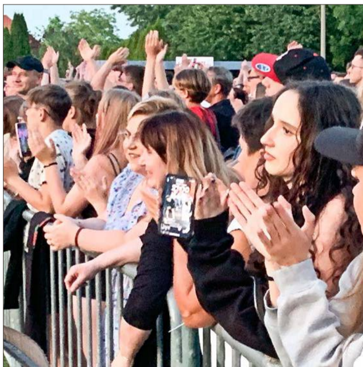
Uczestnicy sobotnich koncertów świetnie się bawili.