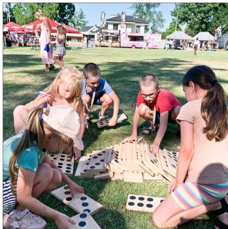
Popularnością cieszyły się gry i zabawy dla dzieci.