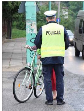
Policjanci bez przerwy zatrzymują nietrzeźwych rowerzystów.