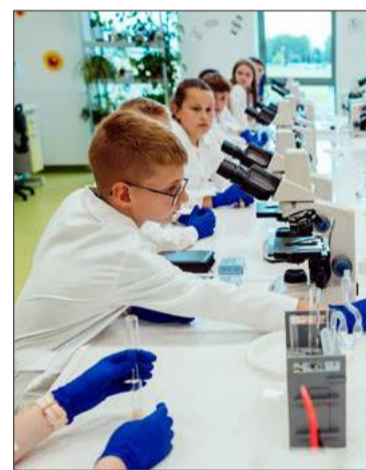
Uczniowie z 25 szkół zostali zaproszeni na ciekawe zajęcia.

Uczniowie byli zachęceni do kreatywnego i krytycznego myślenia oraz współpracy w grupie. Dowiedzieli się, co jest najważniejsze podczas wystąpień publicznych. Uczestnicy mogli też sami zaplanować budżet wycieczki. A wszystko to robili metodą bawiąc uczymy się najlepiej.