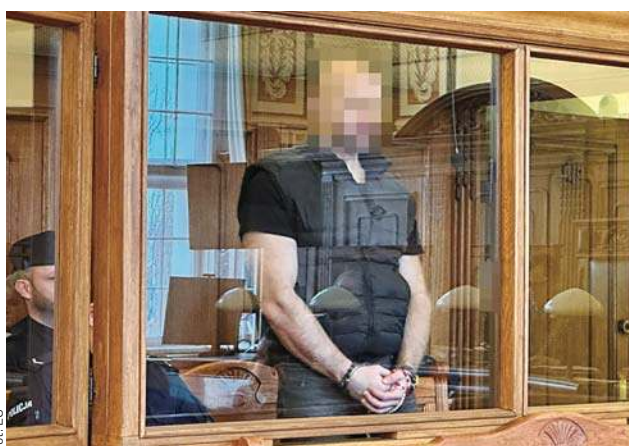
Oskarżony podczas rozprawy trzymał w dłoniach różaniec

„Był bardzo wysoki, dobrze zbudowany, w wieku około 40-45 lat, krótko ostrzyżony, na jeża, ciemny blond, bez zarostu, bez okularów. Nie pamiętam, w co