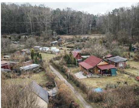
Boją się o Kormorana |2