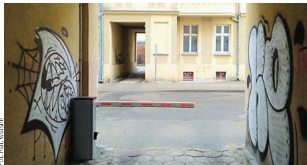
Nowy szlaban przy ul. Mazurskiej w Olsztynie

Kolejny taki dziki parking znajduje się w tej samej części miasta, kilkaset metrów dalej. W dni robocze codziennie stoi tam po kilkadziesiąt aut. Nie wszyscy mieszkańcy zamierzają biernie przyglądać się takiej sytuacji. Przykładem jest wspólnota mieszkaniowa budynku przy ul. Mazurskiej 16. W marcu na jej zlecenie został ustawiony szlaban uniemożliwiający wjazd na pobliskie podwórko nieupoważnionym osobom. Zmotoryzowani lokatorzy tego budynku otrzymali piloty do jego otwierania. — Od razu zrobiło się luźniej. Zniknęły