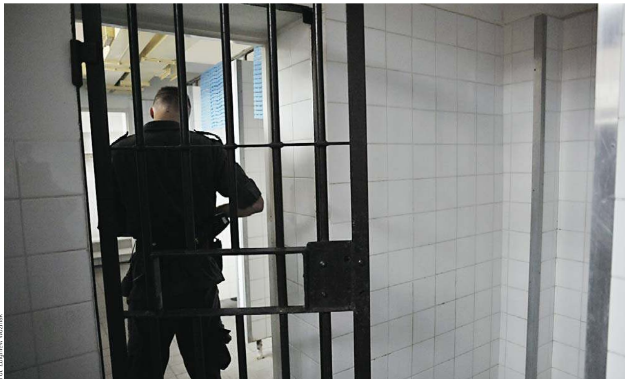
Od stycznia 2023 roku prokuratura badała sprawę przekroczenia uprawnień przez funkcjonariuszy Służby Więziennej z zakładu karnego w Barczewie

Jeden z poszkodowanych tak opisywał wliście