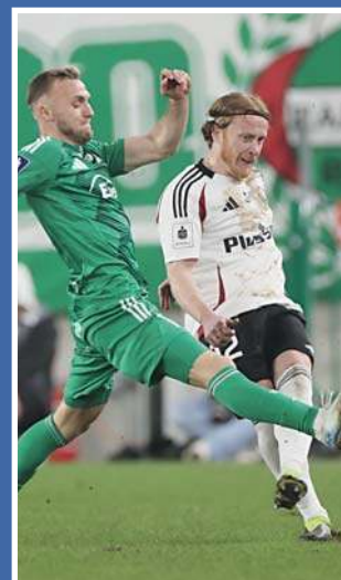
Legia wciąż pojawia się i znika |13