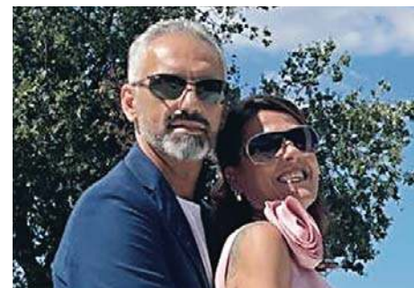
Taka miłość nie zdarza się często |10