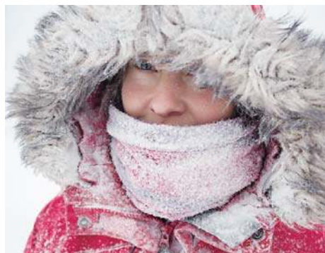
Musiałam polubić ciszę |6