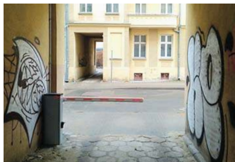
Mieszkańcy odgradzają się szlabanami |3