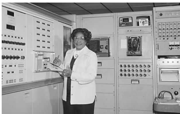
Mary Jackson w Centrum Badawczym Langley w 1977 roku

Dorothy Jean Johnson Vaughan urodziła się 20 września 1910 roku — zmarła 10 listopada 2008 roku. Była amerykańską programistką komputerową i nauczycielką, która pracowała dla Narodowego Komitetu Doradczego ds. Aeronautyki (NACA) oraz NASA w Centrum Badawczym Langley w Hampton w stanie Wirginia. W 1949 roku została p.o. kierownika West Area Computers, jako pierwsza Afroamerykanka, która