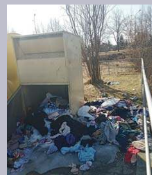
Nieporządek przy kontenerach na odzież używaną

W ostatnim tygodniu strażnicy wielokrotnie interweniowali w miejscach wskazanych przez mieszkańców. Ich działania polegają przede wszystkim na kontrolowaniu terenów, ustalaniu podmiotów odpowiedzialnych za utrzymanie porządku oraz przekazywaniu im informacji o konieczności uprzątnięcia wskazanych miejsc. Tylko w miniony weekend skontrolowano i przekazano do realizacji 17 spraw dotyczących nieporządku na terenie miasta. Strażnicy podkreślają, że na bieżąco reagują na wszystkie zgłoszenia i zachęcają mieszkańców do dalszego informowania o miejscach wymagających interwencji. RED.