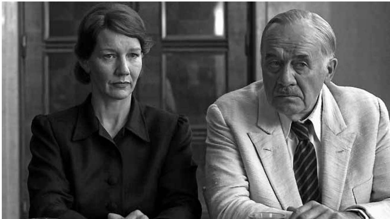
„Ojczyzna” opowiada o relacji między pisarzem Tomaszem Mannem, a jego córką Eriką - aktorką i pisarką.

„Ojczyzna” opowiada o relacji między Tomaszem Mannem, laureatem Nagrody Nobla w dziedzinie literatury, a jego córką Eriką - aktorką i pisarką. Akcja rozgrywa się w szczytowym okresie zimnej wojny. Ojciec i córka wyruszają w trudną, pełną emocji podróż czarnym Buickiem przez zrujnowane Niemcy - z Frankfurtu pod kontrolą amerykańską do Weimaru pod sowiecką kuratelą. Po raz pierwszy od zakończenia wojny