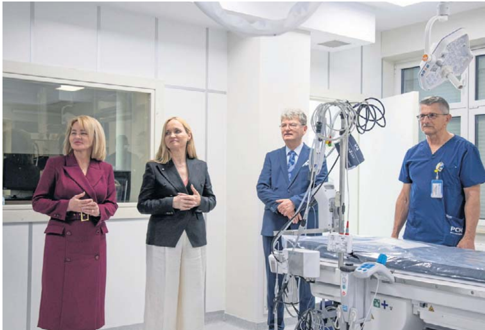
Szpital za środki z KPO kupił 205 sztuk sprzętu, w tym m.in. rezonans magnetyczny.

- Dla mieszkańców Słupska, okolicy i całego województwa to najlepsza informacja, gdy możemy powiedzieć, że mamy bardzo wykwalifikowany personel, zespoły dobrze współ-