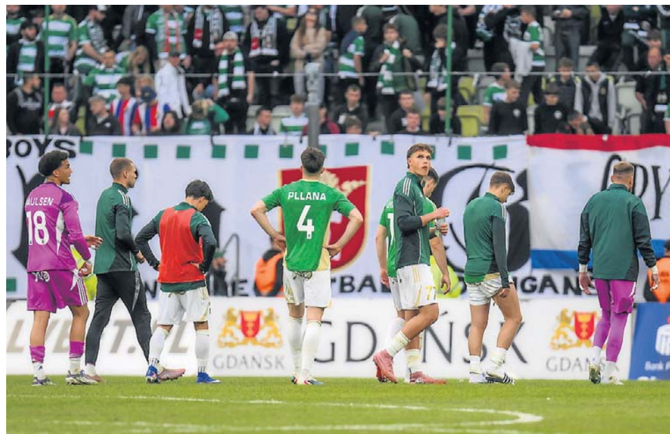
W Lechii jest ogromne rozczarowanie pod spadku z PKO Ekstraklasy

MKS Bytovia Bytów otrzymał zaproszenie do udziału w programie „Przyszły Zawodnik Ekstraklasy” organizowanym przez Akademię Lechia Gdańsk.