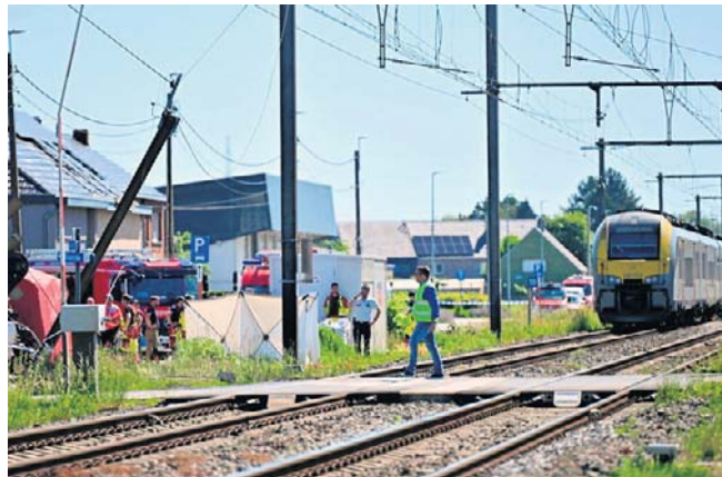
Belgia jest wstrząśnięta wypadkiem, do którego doszło na przejeździe kolejowym w mieście Buggenhout

Z pociągu ewakuowano około 100 pasażerów, jedna osoba ucierpiała z powodu szoku.