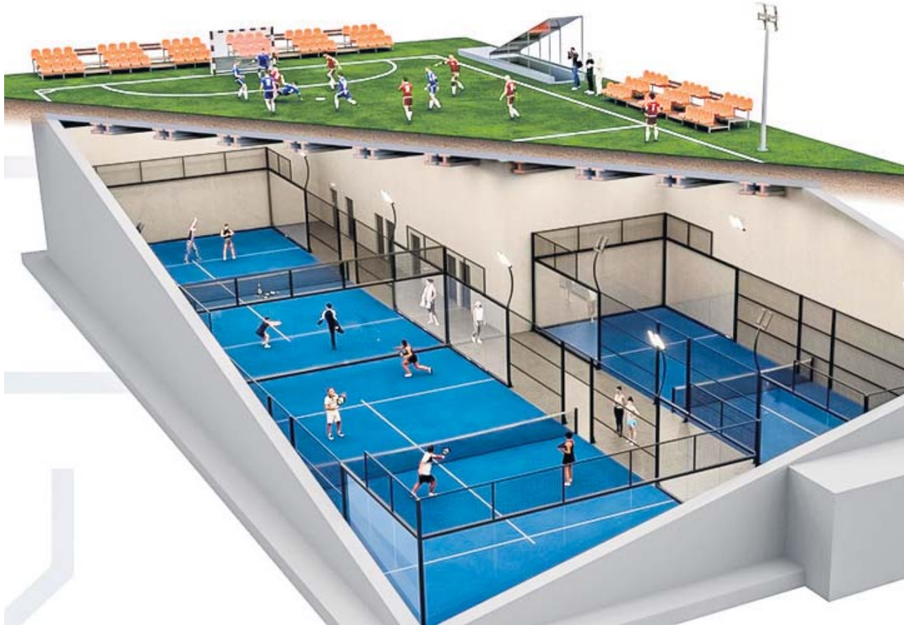
ORLIK S-1 to schron kategorii S-1 dla 750 osób zaprojektowany pod standardowym boiskiem szkolnym o wymiarach 20x40 metrów

- ORLIK S-1 rozwiązuje jednocześnie dwa problemy, które blokowały dotychczas budowę schronów w polskich miastach. Pierwszym jest lokalizacja - Orliki i boiska szkolne należące do gmin są równomiernie rozmieszczone w tkance miejskiej,