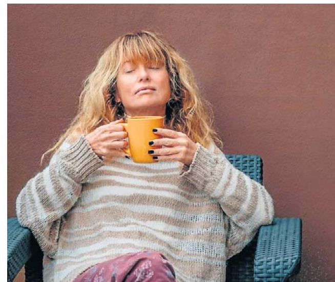
Nie trzeba wierzyć w moc ćwiczeń oddechowych, by czerpać z nich korzyści

Jeśli potrzebujesz prawdziwego odpoczynku, zamiast modnych kurortów wybierz tę spokojną, górską wieś. Może właśnie tutaj znajdziesz swoje własne źródło sił - dosłownie i w przenożeniu.