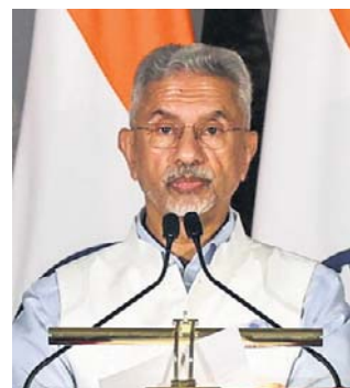
Subrahmanyam Jaishankar, indyjski minister spraw zagranicznych

Zapowiedział też współpracę w sferze infrastruktury portowej, „zwłaszcza w reakcji na niewystarczający potencjał