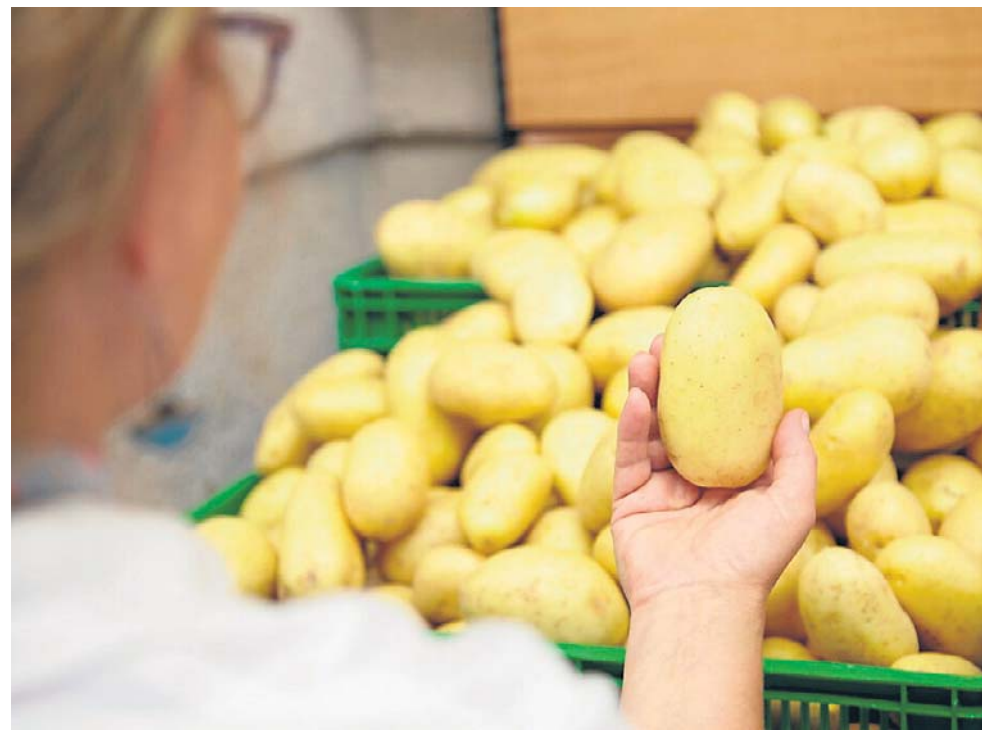
Zarówno młode ziemniaki, jak i stare mogą zawierać trującą solaninę. To substancja, która pojawia się w miejscach uszkodzenia bulwy, kiełkowania oraz w czasie wzrostu. Kupując ziemniaki, zwracaj uwagę na ich wygląd

Ziemniak pochodzi z terenów obecnego Peru, Chile i Boliwii. Do Europy sprowadzono go dopiero w drugiej połowie XVI wieku. Nie stanowił on jednak produktu żywnościowego, pełnił rolę rośliny