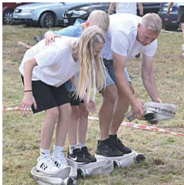
Dla dzieci zorganizowano animacje, gry i zabawy, które pozwoliły najmłodszym spędzić ten dzień aktywnie i radośnie