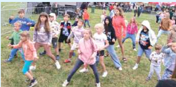
Przewidziano moc atrakcji dla najmłodszych