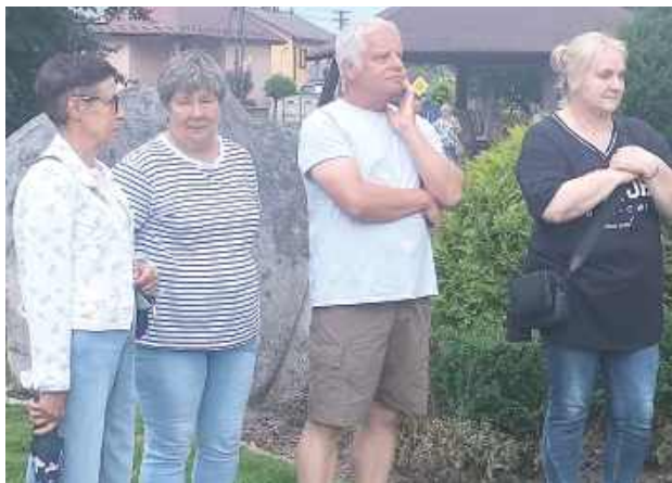
Sobotni koncert w Józefowie