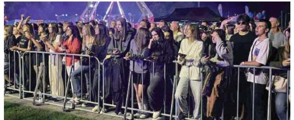
Koncerty cieszyły się ogromnym zainteresowaniem