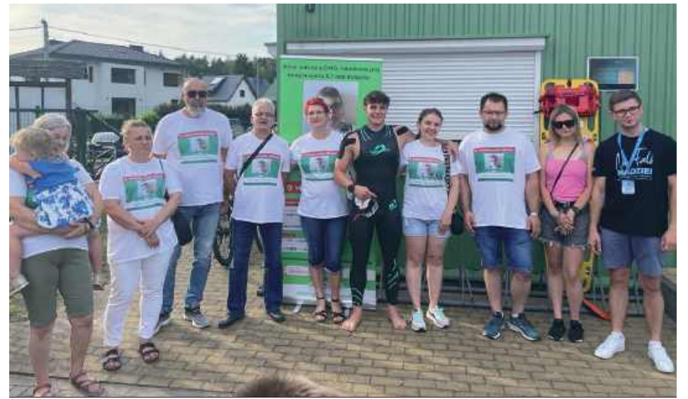
Piątek: ostatnie wspólne zdjęcie przed wejściem do wody