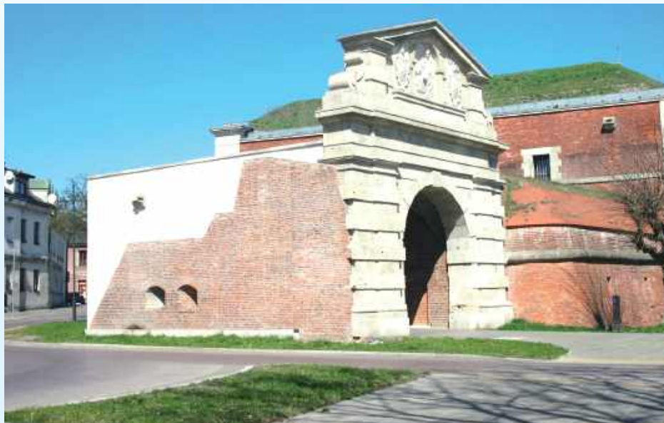
Brama Lwowska Stara w Zamościu została wyróżniona w jubileuszowej edycji ogólnopolskiego konkursu „Zabytek Zadbane”

Brama Lwowska Stara została zaprojektowana przez włoskiego architekta Bernarda Moranda i zrealizowana jako jedna z trzech pierwotnych bram miejskich twierdzy Zamość – obok Bra-