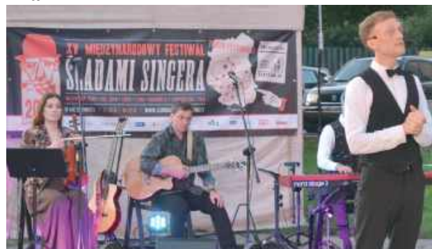
Przedstawienie „Przyjaciele Sztukmistrza”