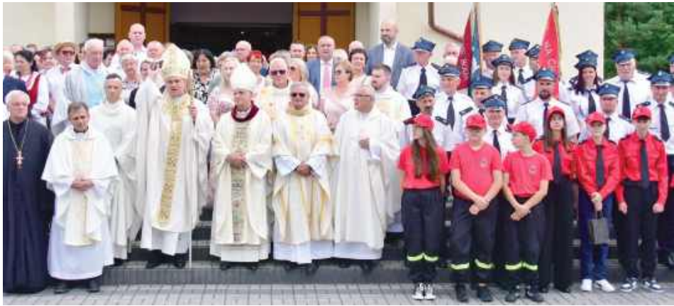
Pamiątkowa fotografia z ważnej uroczystości

GMINA JÓZEFÓW: W sobotę, 26 lipca parafia polskokatolicka w Długim Kącie obchodziła jubileusz 50-lecia erygowania.