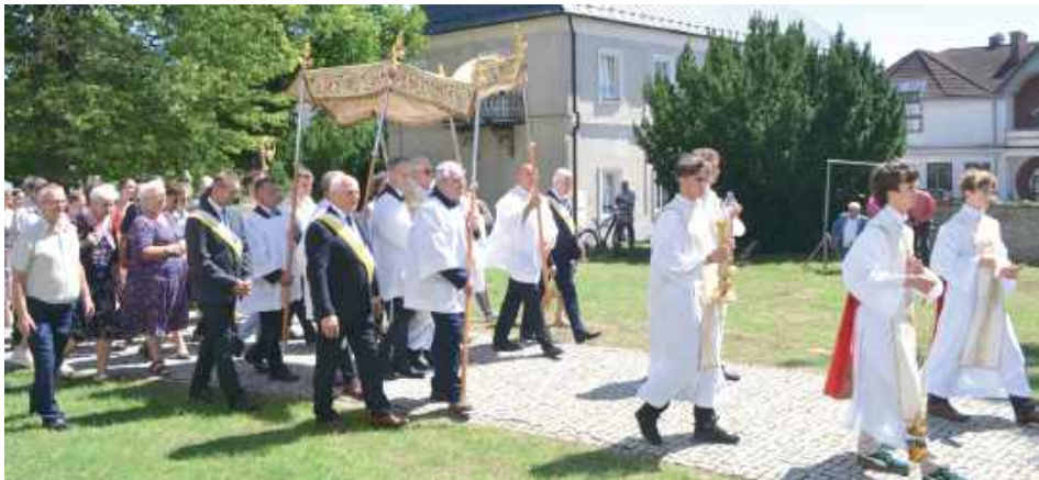
Po sumie odpustowej odbywała się procesja z relikwiami patronki