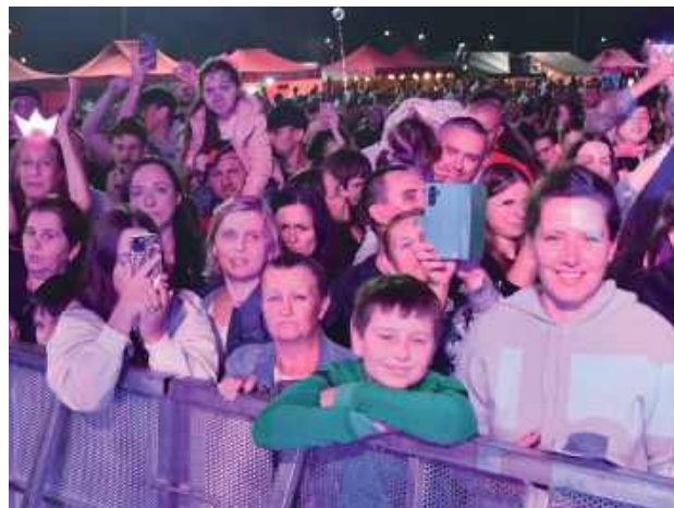
Tłumy na wieczornych koncertach