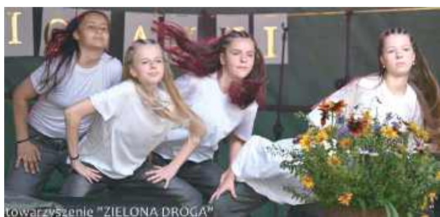
Występy artystyczne dzieci był ważnym punktem programu