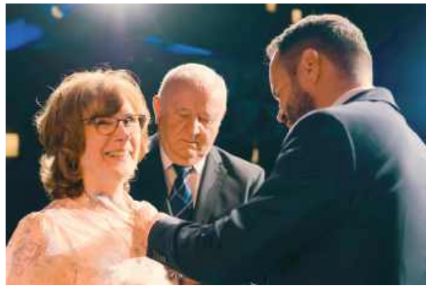
Uroczystość odbyła się w Biłgorajskim Centrum Kultury

W minioną środę sala kinowa Biłgorajskiego Centrum Kultury stała się miejscem świętowania miłości, wytrwałości i rodzinnych wartości. Poznajcie tych, którzy przeżyli razem 50 lat!