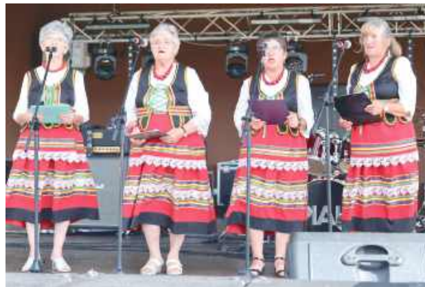
Lokalni artyści zaprezentowali się z najlepszej strony