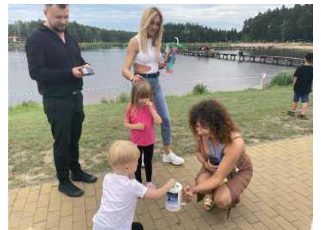
Pani Kasia przez trzy dni kwestowała i pomagała w organizacji imprezy