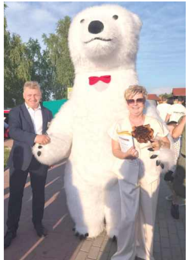
Z takim słodziakiem nawet wójt musi mieć zdjęcie