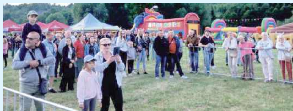
Całe rodziny wzięły udział w wydarzeniu

Za nami jedno z najbardziej wyczekiwanym wydarzeń sezonu letniego w regionie – Dni Krasnobrodu. Dwudniowe święto, które odbyło się 19 i 20 lipca na terenie rekreacyjnym przy ul. Partyzantów, zgromadziło tłumy mieszkańców i turystów spragnionych dobrej zabawy, muzyki i letniego klimatu nad zalewem.