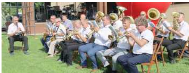
Orkiestra Dęta stanęła na wysokości zadania