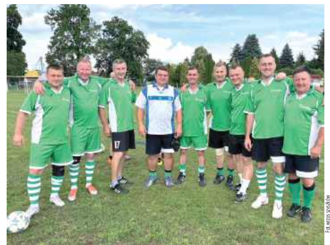
Głównym celem turnieju było promowanie sportu w lokalnej społeczności