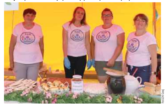
Kości Gospodyń zadbały, by nikt nie wyszedł głodny