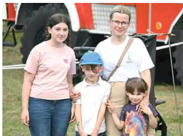
To był wartościowy czas spędzony z rodziną