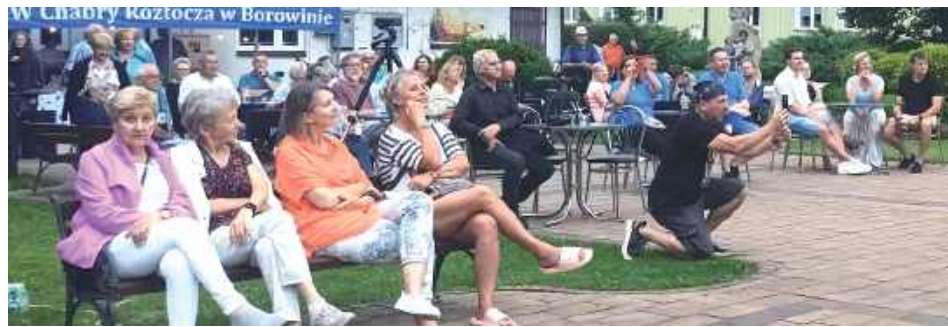
Mieszkańcy chętnie wzięli udział w wydarzeniu