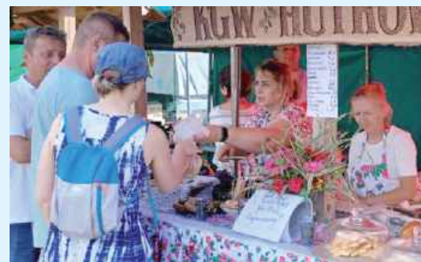
Koła Gospodyń Wiejskich przygotowały tony pyszności