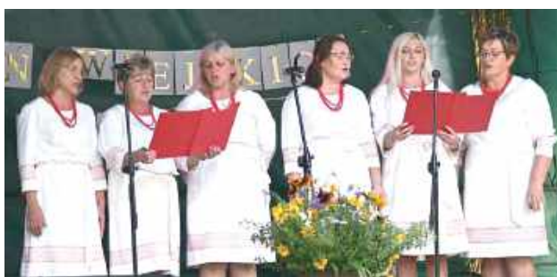
Na scenie wystąpili lokalni artyści

Ogromny wkład w przygotowanie wydarzenia miało Stowarzyszenie Zielona Droga, które kolejny