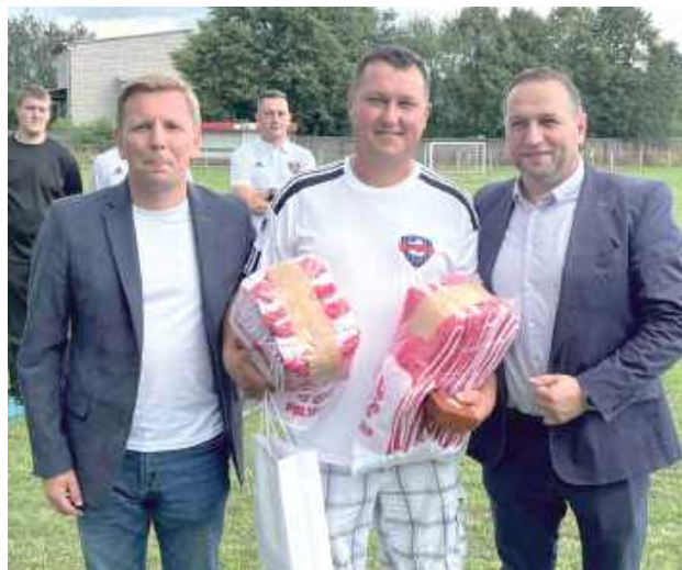
V Memoriał Prezesa Józefa Frąca w Szyszkowie