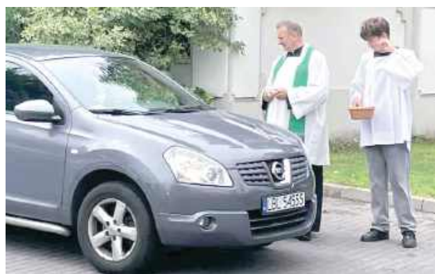
Poświęcenie pojazdów na przykościelnym parkingu

W niedzielę przy parafii Wniebowzięcia Najświętszej Maryi Panny odbyło się poświęcenie pojazdów. Kierowcy prosili o bezpieczne podróże, a Kościół - o rozsądek i odpowiedzialność na drodze. Choć to znany zwyczaj, jego korzenie i symbolika wciąż potrafią zaskoczyć.