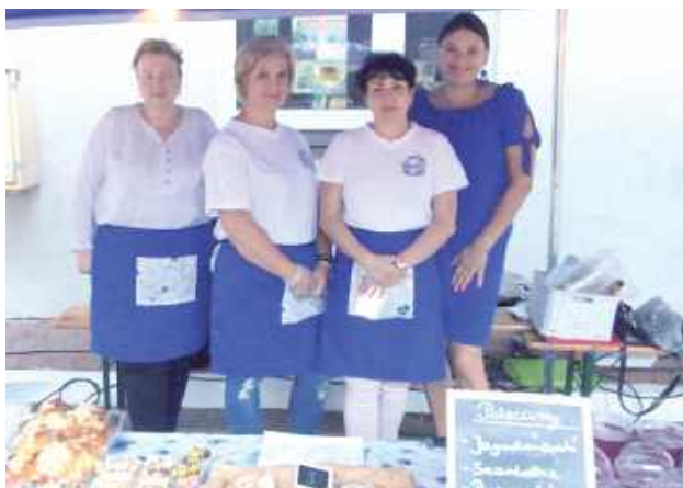
KGW Chabry Roztocza zadbały, żeby nikt nie wyszedł z imprezy głodny