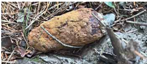
Poszedł na grzyby, znalazł pamiątki z czasów II wojny

Zaskakujące odkrycie miało miejsce w lesie w okolicach Aleksandrowa, gdzie 66-letni mężczyzna zauważył podejrzane przedmioty. Natychmiast powiadomił służby, co pozwo-