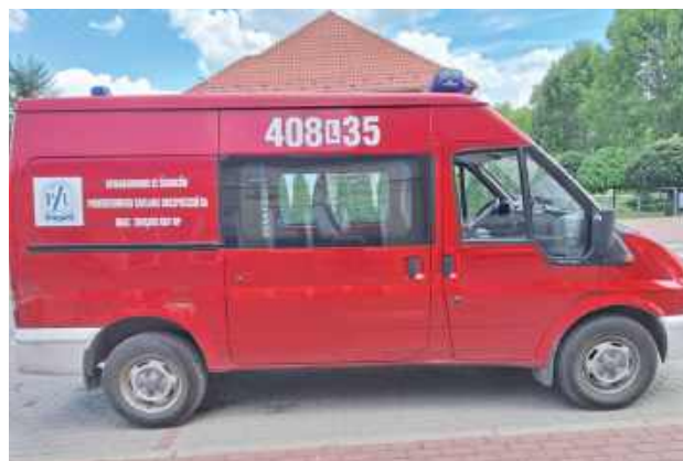
Gmina Turobin ogłosiła przetarg na sprzedaż samochodu specjalnego – pożarniczego Ford Transit 350M. Cena wywoławcza została ustalona na 12 200 zł brutto

Samochód to Ford Transit 350M z 2003 r., napędzany silnikiem wysokoprężnym o pojemności 2402 cm 3 i mocy 66 kW (90 KM). Pojazd jest przystosowany do celów pożarniczych, a jego liczba miejsc wynosi 6. Został zarejestrowany po raz pierwszy 11 grudnia 2003 roku, a jego przebieg wynosi obecnie 144 449 km. Numer rejestracyjny pojazdu to LBL76337. Samochód jest w pełni sprawny i w ciągłej eksploata-