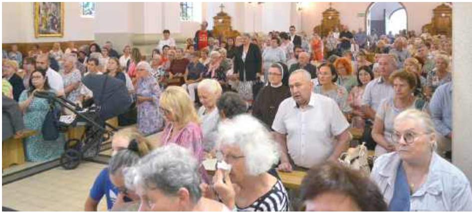
Wierni przybywali z różnych miejscowości, m.in. Goraja czy Tarnogrodu