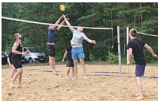
Uroczystości rozpoczęły się turniejem siatkówki plażowej o Puchar Wójta Gminy Biłgoraj

Organizatorami wydarzenia byli Wójt Gminy Biłgoraj, Gminy Ośrodek Kultury w Biłgoraju, Stowarzyszenie Zielona Droga, Zespół Śpiewaczy KGW i OSP z Dąbrowicy.