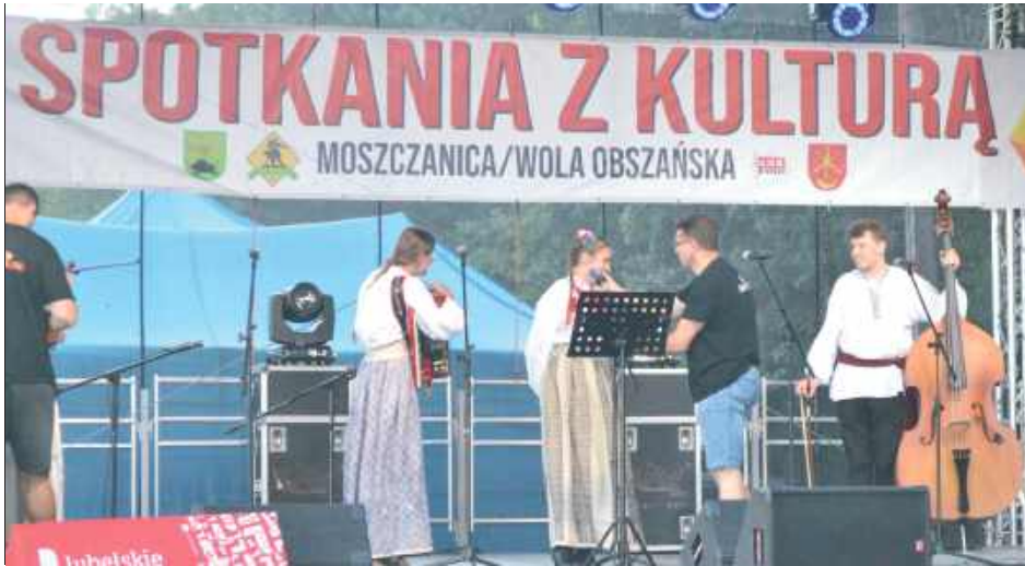
Spotkanie z Kulturą w Woli Obszańskiej/Moszczanicy