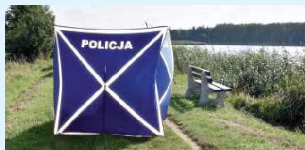
Była to pierwsza ofiara utonięcia w tym sezonie na terenie powiatu zamojskiego

W miniony weekend w zamojskim zalewie doszło do tragicznego zdarzenia. 50-letni mieszkaniec Zamościa utonął po tym, jak spędził noc z soboty na niedzielę na dyskotekę odbywającej się w okolicach zbiornika wodnego. Mężczyzna bawił się w towarzystwie znajomych i spożywał alkohol. Po zakończeniu spotkania miał udać się do domu, jednak tam nie dotarł.