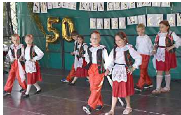
Część artystyczna pikniku rozpoczęła się występami dzieci i młodzieży ze Szkoły Podstawowej w Dąbrowicy