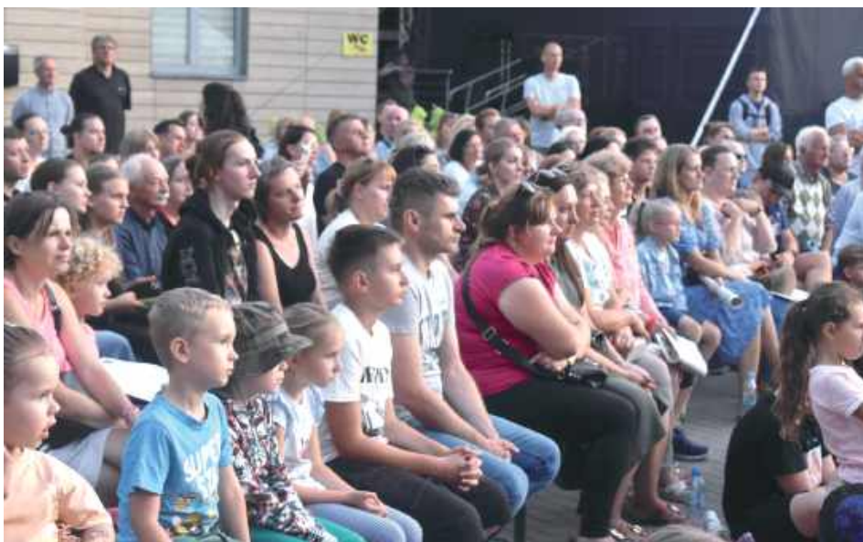
Spektakl cieszył się ogromnym zainteresowaniem

We wtorkowy wieczór, 22 lipca mieszkańcy Biłgoraja licznie zgromadzili się na placu przy Biłgorajskim Centrum Kultury na spektaklu „Przyjaciele Sztukmistrza 2025”, który był finałowym wydarzeniem Festiwalu Śladami Singera w Biłgoraju. Dopisała nie tylko frekwencja, ale też pogoda