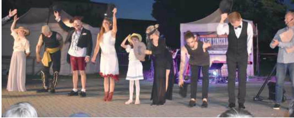
„Przyjaciele Sztukmistrza 2025” to widowisko łączące elementy ulicznego variete, cyrku, powietrznych akrobacji, fire show i muzyki na żywo. Wszystko to osadzone zostało w literackim świecie Izaaka Baszewisa Singera – noblisty i autora „Sztukmistrza z Lublina”