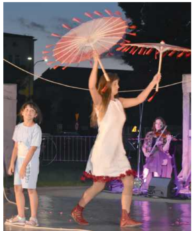
Na festiwalowej scenie młoda artystka z Biłgoraja