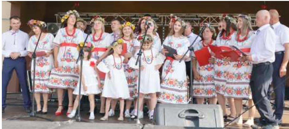
Na scenie wystąpili lokalni artyści