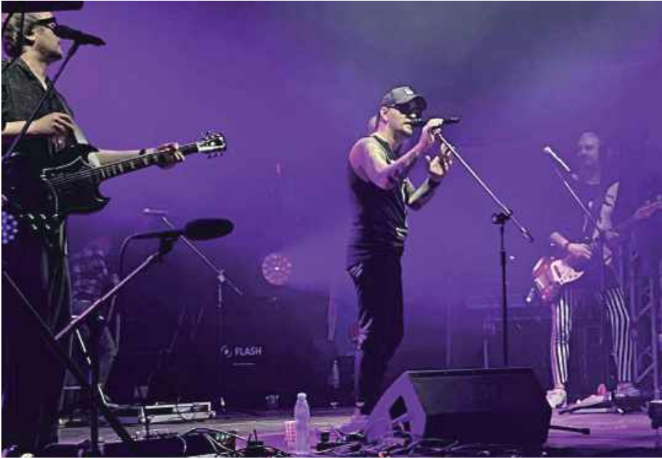
Gwiazdą imprezy był zespół VIDEO