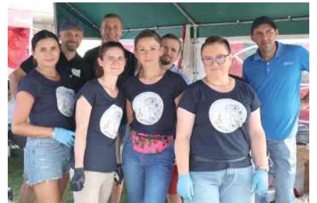
Każdy miał swój wkład w przygotowania do imprezy