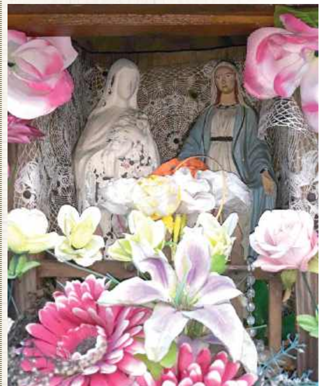
Kapliczka z 1928 r. między Bukową a Szeligą

W lesie między Bukową a Szeligą, przy dawnej drodze łączącej oba wsie, stoi archaiczna kapliczka wyciosana w pniu sosny. Kapliczka upamiętnia tragedię.