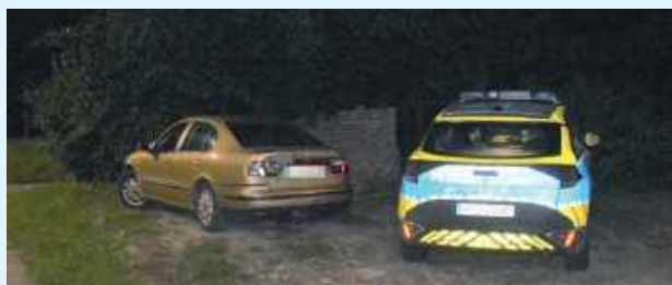
Kierowca Seata próbował uciec z miejsca zdarzenia, jednak został powstrzymany przez świadka, który zabrał mu kluczyki do auta

W Kalinowicach kierowca Seata, będący pod wpływem alkoholu, uderzył w samochód marki Volvo. Próbował uciec z miejsca zdarzenia, ale został powstrzymany przez świadka. Na szczęście nikt nie odniósł obrażeń. Mężczyzna został zatrzymany i odpowie za swoje czyny przed sądem.