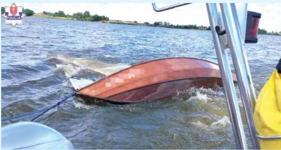
Małżeństwo w wieku 62 i 64 lat, mieszkańcy powiatu chełmskiego, żeglowało po zbiorniku, gdy ich łódź nagle przewrócił silny podmuch wiatru