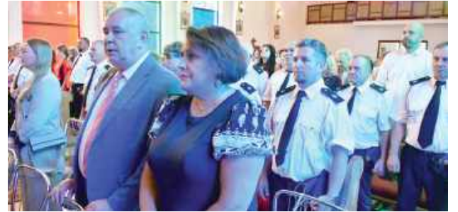
NR 50-lecie parafii w Długim Kącie