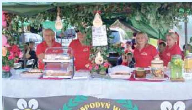
Koła Gospodyń Wiejskich stanęły na wysokości zadania