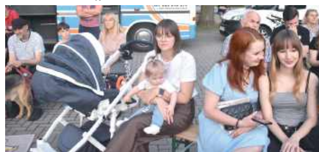
Rodzinne popołudnie w Biłgoraju