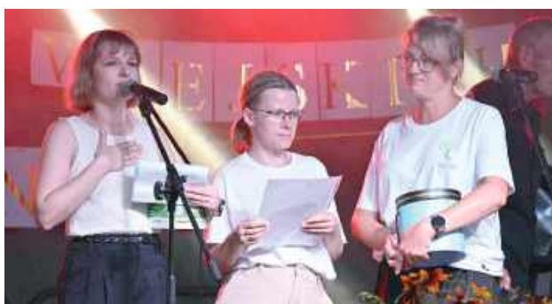
Organizatorem wydarzenia było Stowarzyszenie „Zielona Droga”

raz udowodniło, że potrafi łączyć mieszkańców wokół ważnych spraw. Dzięki ich inicjatywie oraz wsparciu wójta gminy Biłgoraj, Gminnego Ośrodka Kultury, OSP Dąbrowica, Młodzieżowej Drużyny Pożarniczej i „Dąbrowiczank” piknik był nie tylko świetną zabawą, ale i ważnym gestem solidarności.