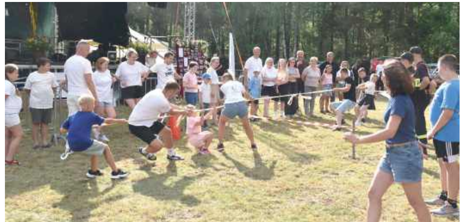
Rodziny mogły wziąć udział w sportowych konkurencjach, które wywoływały wiele emocji i śmiechu