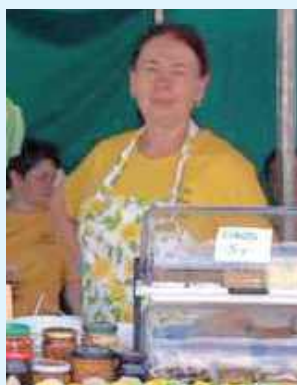
Dla każdego coś pysznego