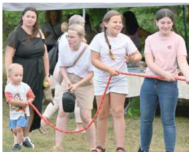
Rodzinne konkurencje dla wszystkich!