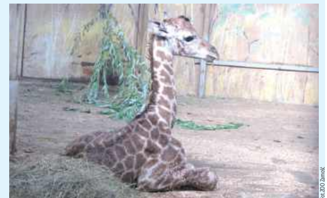
W zamojskim ZOO przyszło na świat wyjątkowe młode

Matką malucha jest Jasira, która opiekuje się nim z troską, a nowonarodzony samodzielnie ssie mleko, co jest bardzo dobrym prognostykiem na