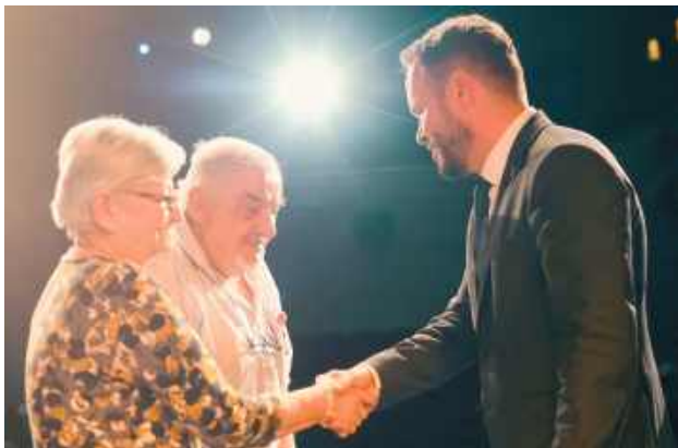
50 lat razem to piękne osiągnięcie