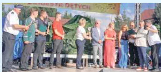
Działo się na imprezowej scenie