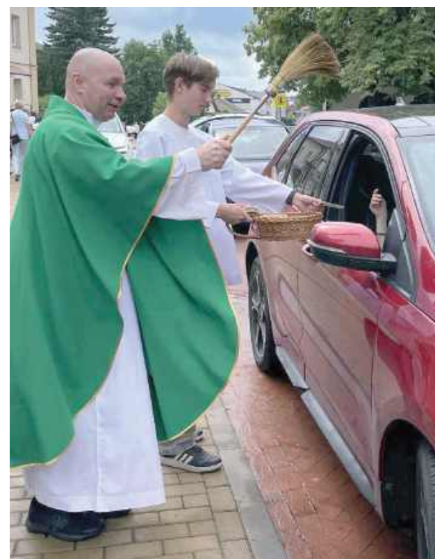
Święcenie pojazdów z okazji dnia św. Krzysztofa to wielka tradycja