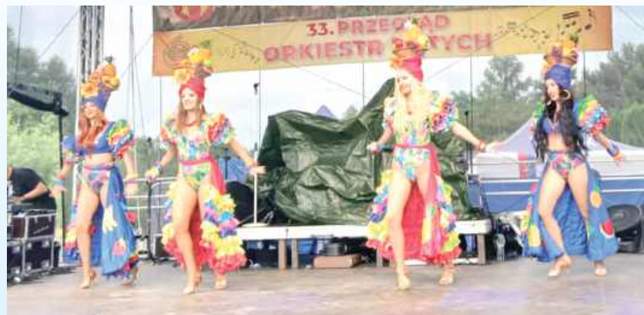
Na scenie było barwnie i wesoło