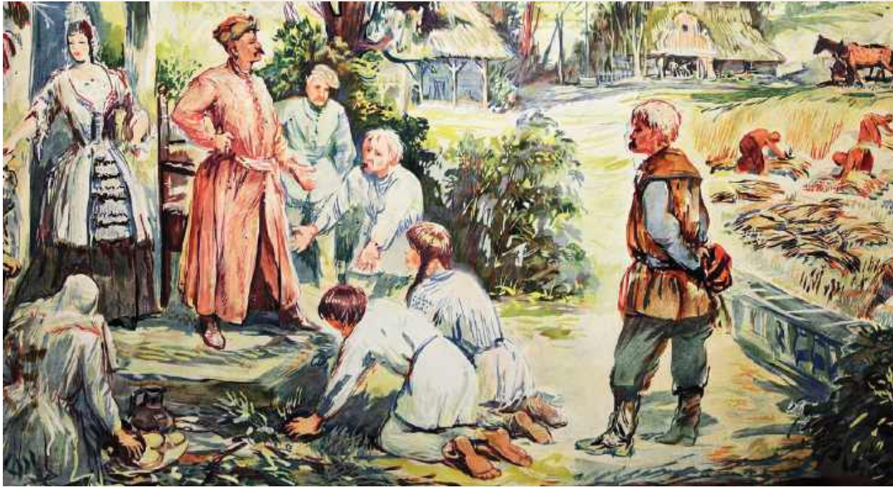
Chłop miał niełatwe życie... (domena publiczna)

W ostatnim czasie weszły do kanonu literatury historycznej książki, które mogą zmienić punkt widzenia na naszych, niestety dość zapracowanych przodków. Chodzi m.in. pozycję „Pańszczyzna. Prawdziwa historia polskiego niewolnictwa” Kamila Janickiego. Co więcej, została bardzo chwalona przez prof. Andrzeja Chwalbę, który był przecież moim dawnym nauczycielem akademickim. W odniesieniu do powyższej książki w kontekście pańszczyzny chciałbym przypomnieć o trudnym życiu naszych przodków na terenie Ordynacji Zamojskiej.