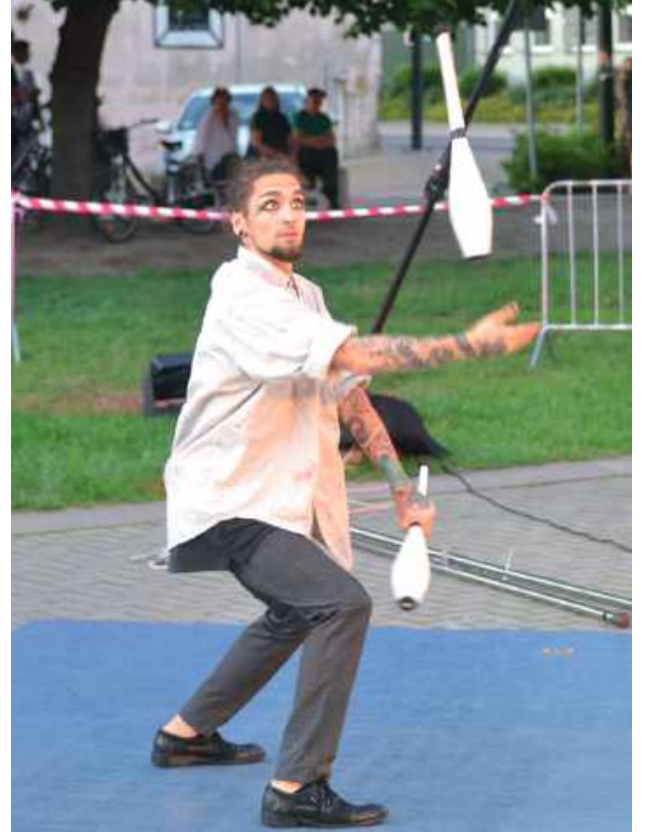
Przedstawienie „Przyjaciele Sztukmistrza”