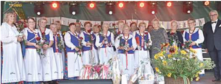
Jubileusz 50-lecia działalności Zespołu Śpiewaczego Koła Gospodyń Wiejskich z Dąbrowicy

W niedzielę 20 lipca w Dąbrowicy odbył się wyjątkowy Piknik Rodzinny, który zgromadził mieszkańców miejscowości i okolic na wspólnym świętowaniu. Okazją była szczególnie - jubileusz 50-lecia działalności Zespołu Śpiewaczego Koła Gospodyń Wiejskich z Dąbrowicy. Wydarzenie te połączyło tradycję z nowoczesnymi formami rozrywki i integracji międzypokoleniowej.