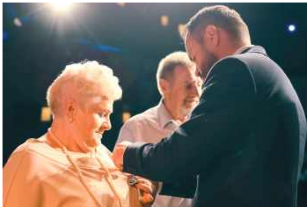
Jubilaci otrzymali medale z rąk wojewody lubelskiego