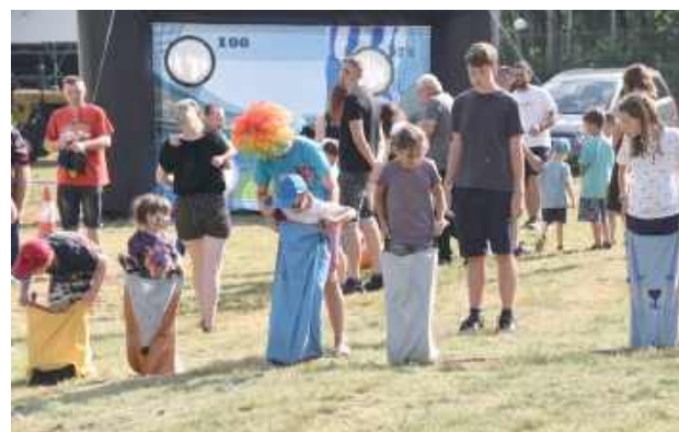
Podczas pikniku nie zabrakło atrakcji dla całych rodzin