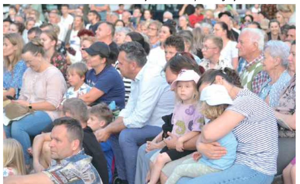
Mieszkańcy byli oczarowani przedstawieniem