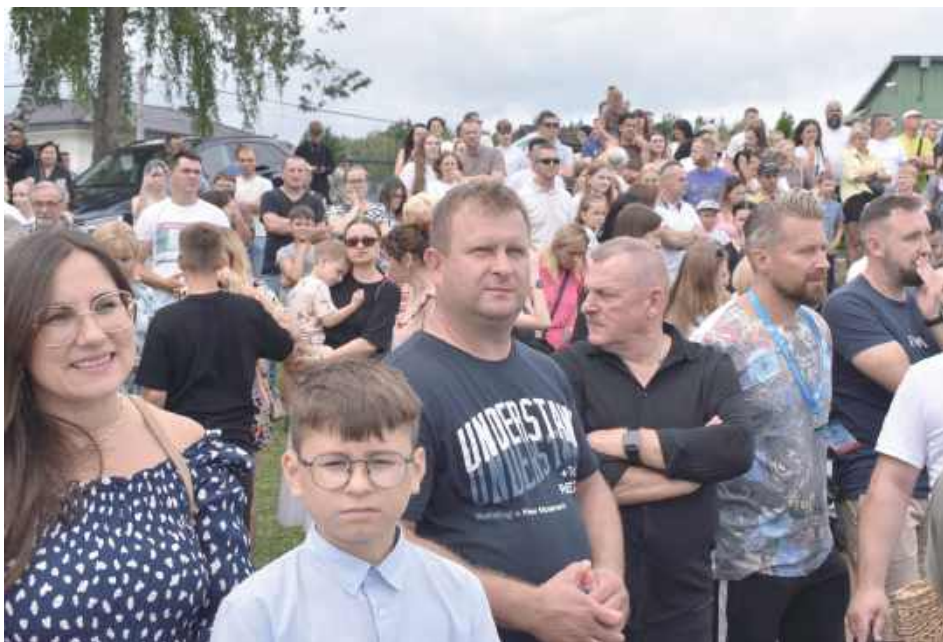
To było ogromne przedsięwzięcie!