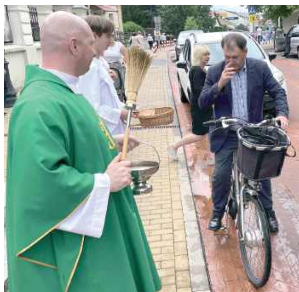
Nie tylko samochody. Rowerzyści również chętnie podjeżdżali poświęcić swoje dwókołowce

jest tylko obrzędem - to także okazja do przypomnienia, że bezpieczeństwo na drodze zaczyna się od człowieka. Kapłani zachęcali, by nie traktować błogostawieństwa jak talizmanu, lecz jako wezwanie do rozwagi, trzeźwości i kultury jazdy.