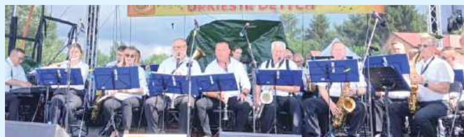
Niedzielne popołudnie rozpoczęła XXXIII Przegląd Orkiestr Dętych, podczas którego przez Krasnobród przemarszerowały orkiestry z różnych zakątków regionu, m.in. z Nowej Sarzyny, Sawina, Tarnogóry i Krasnobrodu