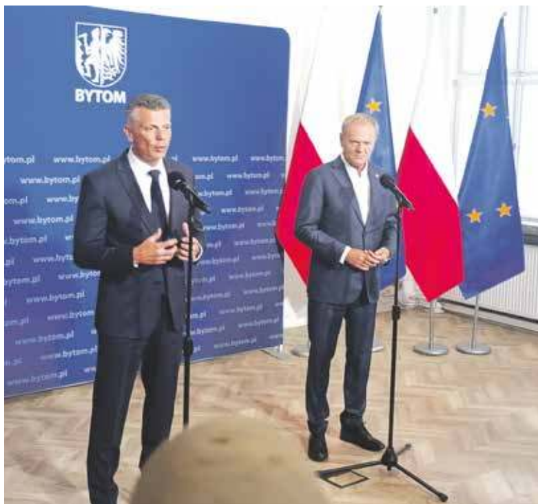
Prezydent Mariusz Wołosz bardzo dobrze przyjął deklarację złożoną przez premiera Donalda Tuska

Podzielony na etapy proces przekazywania zgodnie z ustaleniami potrwa do końca roku 2026, a lokale będą podlegały Bytomskim Mieszkanom. W pierwszym etapie przejmowane mają być te budynki należące dziś do