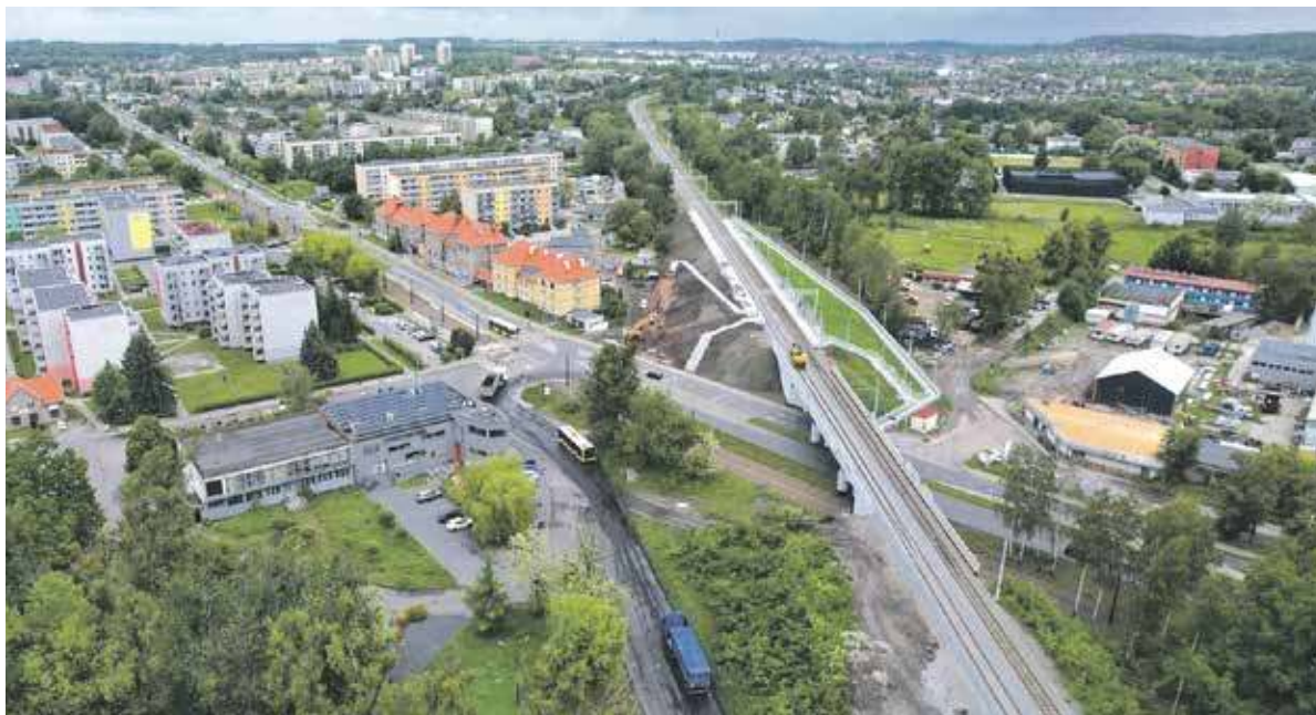
Centrum przesiadkowe powstanie obok linii kolejowej

Jak widać zostało to tak zaprojektowane, by podróżni mieli wszystko w jednym miejscu: – Realizacja tej