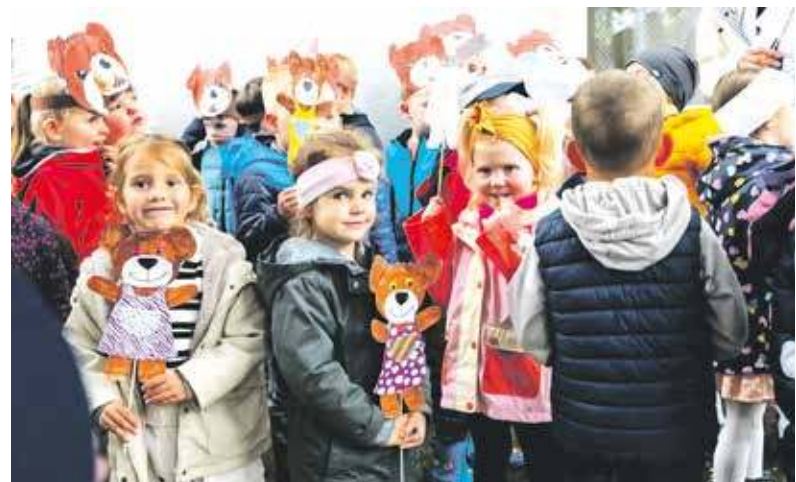
Jubileusz przedszkola był dla dzieci wielkim przeżyciem

Pogoda się zdecydowanie nie popisała, ale uczestnikom tego wydarzenia zupełnie to nie przeszkadzało. I tak bawili się doskonale na jubileuszu 40-lecia Przedszkola Miejskiego nr 15. Ale czy mogło być inaczej, skoro jego patronem jest Miś Uszatek?