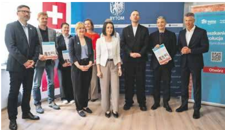
Bez tych ludzi nie udało się odnowić budynku

Całkowity koszt prac remontowych to około 1 mln zł. Kwotę w całości pokryła Fundacja. Projekt został zrealizowany również dzięki wsparciu Rapid Response Fund (RRF) oraz partnerów biznesowych m.in. firmy Saint Gobain.