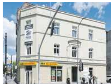
Kamienica prezentuje się efektownie