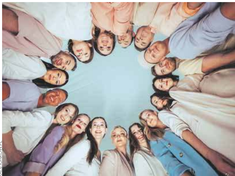
Jedną z gwiazd Dni Radzionkowa będzie grupa Sound'N' Grace

W najbliższy weekend, 7 i 8 czerwca szykujecie się na wspaniałą zabawę. Czekają nas bowiem kulminacja Dni Radzionkowa, a program wydarzeń jest bogaty i atrakcyjny.