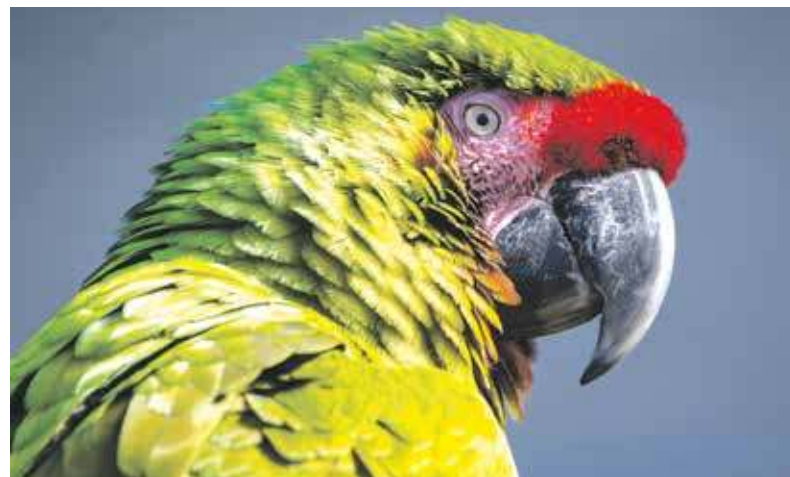
Ciekawe, cy tyn papagaj poradzi godać?

Co tam jesse furgu we lufcie? Szpok, a więc szpak, abo gynś (gans), czyli gęś. Jest tyz cimpel, ftorego mianujom tyz dziamblym. To wróbel. Bajtle znajom tako ślonsko przy-