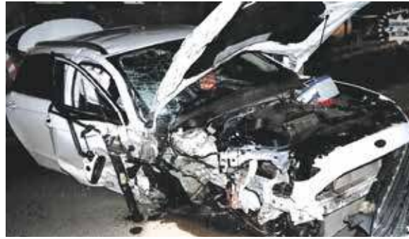
Z forda zostało niewiele

MIECHOWICE. 44-LETNI MĘŻCZYŻNA JADĄCY ULICĄ RACJONALIZATORÓW Z IMPETEM UDERZYŁ W DRZEWO. ON TRAFIŁ DO SZPITALA, Z AUTA ZOSTAŁ TRUDNY DO ROZPOZNANIA WRAK. WIELE WSKAZUJE, ŻE KIEROWCA BYŁ NIETRZEŻWY.