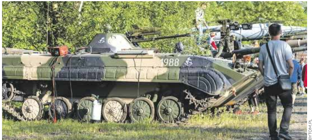
Ciężki sprzęt wojskowy będzie jedną z największych atrakcji manewrów

Po powrocie do Miechowic czeka nas ciekawie się zapowiadająca inscenizacja historyczna nosząca tytuł "Atak z zaskoczenia". Opowie ona o tym, co się działo na misji w Afganistanie w roku 2004. Kogo nie interesuje wojskowy spektakl, ten zainteresuje się zapewne stoiskami z pamiątkami, skorzysta z możliwości przejechania się któryś z wozów bojowych oraz zobaczy widowiskowy pokaz laserowy i pokaz ognia.