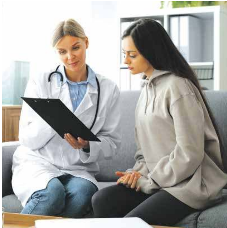
Do programu zgłosiło się już 80 tysięcy pacjentów

Program pozwala wcześniej wykryć choroby cywilizacyjne i infekcyjne, co daje szansę na ich skuteczniejsze leczenie. Wzmacnia też relację pacjenta z podstawową opieką zdrowotną i przywraca POZ rolę miejsca, które nie tylko leczy, ale przede wszystkim dba o zdrowie na co dzień. Jednocześnie nie wyklucza możliwości korzystania z codziennej opieki POZ, badań profilaktycznych, skierowań na badania w ramach indywidualnego planu opieki medycznej.