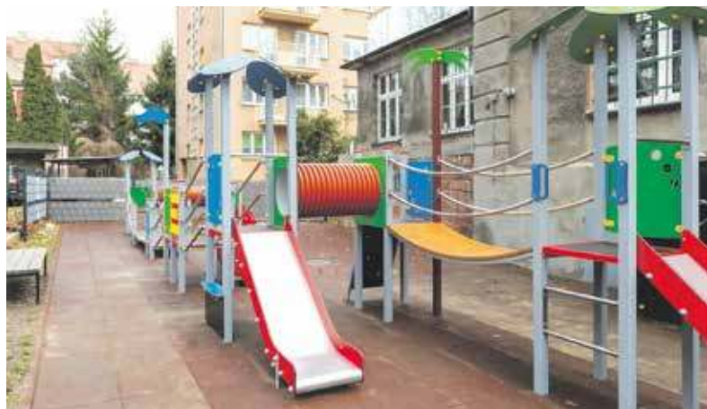
Bardzo często w ramach BBO tworzone są place zabaw

W ostatniej edycji budżetu partycypacyjnego wnioskodawcy zgłosili 55 projektów, a 14 z nich wybrano do realizacji. W samym tylko głosowaniu uczestniczyło ponad 23,5 tys. mieszkańców. Można z dużą dozą prawdopodobieństwa założyć, że