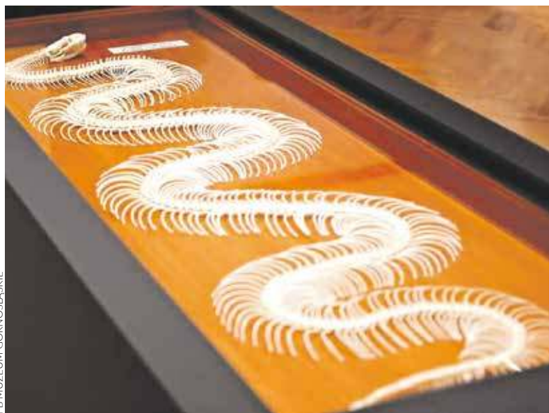
Takie eksponaty znajdziemy na nagrodzonej wystawie

Pracownicy bytomskiego Muzeum Górnośląskiego mają uzasadnione powody do radości. Dwa przygotowane przez nich projekty zostały bowiem uhonorowane w organizowanym przez Śląski Urząd Marszałkowski konkursie na Wydarzenie Muzealne Roku 2024.