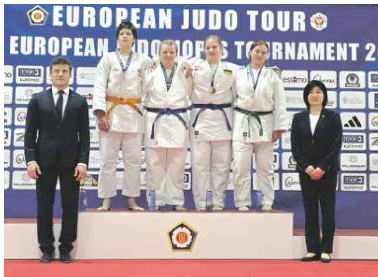
Nadzieje džudo rodziły się podczas turnieju w Szombierkach

MYSŁOWICE, BYTOM. DWIE WAŻNE I SILNIE OBSADZONE IMPREZY ZA DŻUDOKAMI CZARNYCH BYTOM. PODCZAS OBYDWU ODGRYWALI ONI PIERWSZOPLANOWE ROLE WIELE RAZY STAJĄC NA PODIUM.