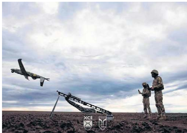
Ukraińcy przeprowadzili kolejne udane ataki dronowe na zakłady chemiczne i naftowe na terenie Rosji

W nocy z soboty na niedzielę wojska rosyjskie atakowały też Ukrainę. Według Sił Powietrznych tego kraju okupanci użyli watach 98 dronów, z czego 91 zostało strąconych lub unieszkodliwionych środkami walki elektronicznej. Siedem bezzałogowców trafiło w cele w sześciu miejscach - przekazano w komunikacie. PAP