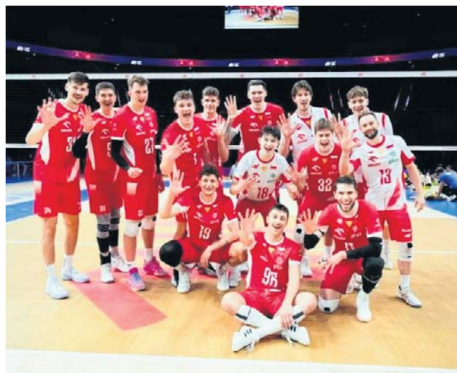
Reprezentacja Polski na turnieju Ligi Narodów w Linyi w Chinach wygrała dwa mecze i poniosła dwie porażki

W VNL 2026 gra 18 reprezentacji, które rozegrają łącznie 116 spotkań. W fazie interkontynentalnej każda z drużyn wystąpi w trzech turniejach i zagra po dwanaście meczów. Siedem najlepszych drużyn fazy interkontynentalnej oraz gospodarz Chin awansują do turnieju finałowego, który odbędzie się 29 lipca-2 sierpnia w chińskim Ningbo. ©©