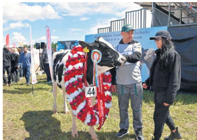
Jednym z punktów Opolagry była prezentacja zwycięzców Śląskiej Wystawy Bydła Hodowlanego.

– Wystawa jest organizowana przez związki hodowców bydła z całego Śląska, czyli z okręgów opolskiego, dolnośląskiego i śląskiego. Wracamy z jeszcze większym rozmachem po rocznej przerwie, która była spowodowana pryszczycą. Wreszcie te trzy