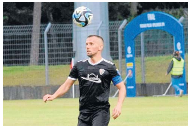
Ruch postawił trudne warunki wymagającemu rywalowi, ale w przyszłym sezonie nadal będzie grać w 4 lidze

- Przeanalizowałem trzy spotkania z udziałem rezerw Rakowa. To bardzo mocny zespół, grający w takim samym ustawieniu jak my, czyli 1-3-4-3. Składa się z mło-