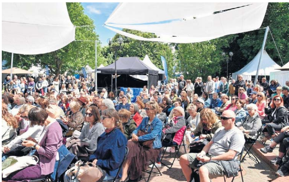
Festiwal po raz kolejny udowodnił, że jest wydarzeniem skierowanym do wszystkich – zarówno do zapalonych czytelników, jak i do tych najmłodszych.

szych, którzy dopiero rozpoczynają swoją przygodę z książkami.