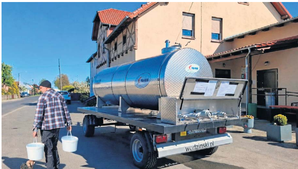
W wodociągu wykryto chloropiryfos - groźny pestycyd zakazany w Unii Europejskiej od sześciu lat.

Świat: ukraiński atak na Rosję. Drony podpaliły zakłady chemiczne w obwodzie tuskim str. 10