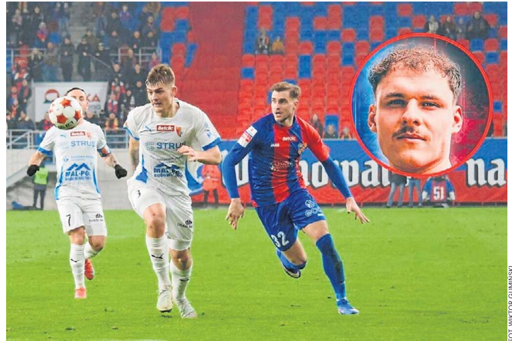
Za niespełna tydzień ruszą przygotowania Odry Opole do kolejnego sezonu

Po powrocie do Polski, Opolanie rozegrają dwa spotkania