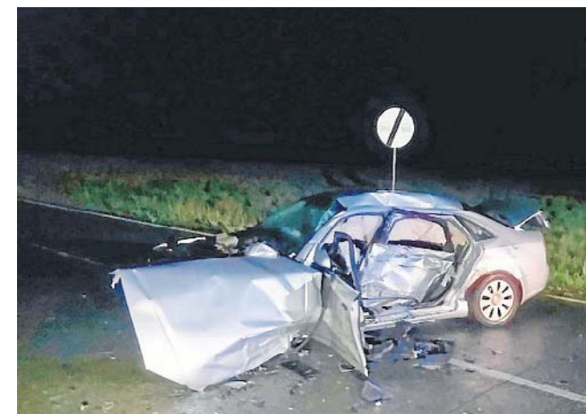
Jedna osoba nie żyje, a cztery zostały poważnie ranne. Zaczęło się od potrącenia dzikiego zwierzęcia.

Sprawca został zatrzymany. Może usłyszeć zarzut spowodowania wypadku ze skutkiem śmiertelnym w stanie nietrzeźwości, za co grozi do 12 lat pozbawienia wolności. Decyzję w tym zakresie podejmie prokurator.