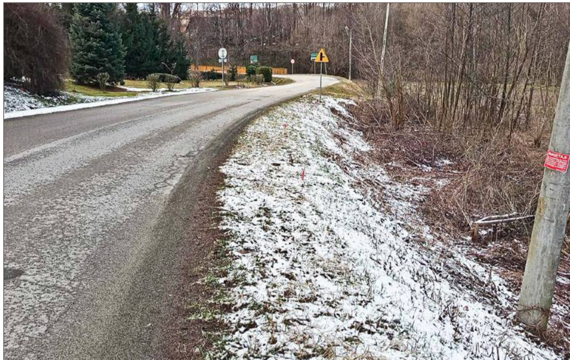
Powstałe w 2010 roku osuwisko zostanie w końcu zabezpieczone.

- Cieszę się, szczególnie że w ostatnim roku nie możemy liczyć na żadne inne programy. Jedynie Rządowy Fundusz Rozwoju Dróg z 70% dofinansowaniem. Dobrze napisany wniosek i ważne społecznie i pod względem bezpieczeństwa zadanie zostało pozytywnie ocenione. Duża praca Zarządu Dróg Powiatowych - podkreśla starosta Chęć.