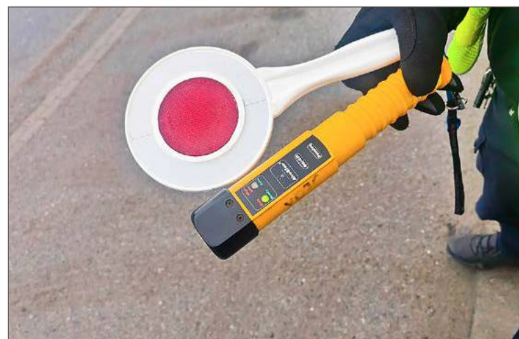
Od początku roku w powiecie przeprowadzonych zostało 17 takich akcji.