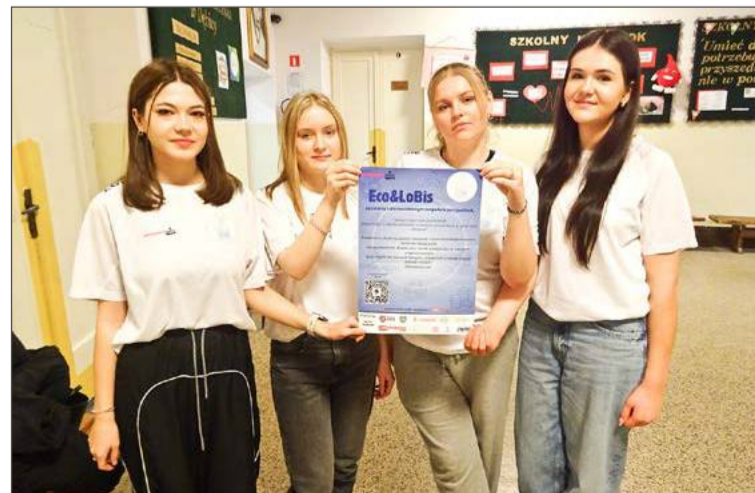
Uczennice z ZSE w Dębicy starają się wyjaśnić pojęcia ekonomiczne.