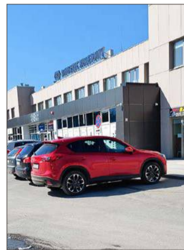
Dwa samochody stoją na zakazie.

W momencie jej powieszenia strażnicy kolejowi zyskują uprawnienia do wystawiania mandatów. Ich rozpiętość jest dość duża. Najniższy to 20 zł i ten z pewnością jeszcze niektórych nie odstraszy. Ale jeśli funkcjonariusze widzieć będą, że jakieś numery rejestracyjne będą pojawiać się częściej, to szczególnie oporni mogą dostać nawet 500 zł kary.