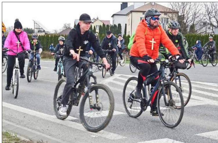
W 2024 roku w RDK uczestniczyło 60 rowerzystów.