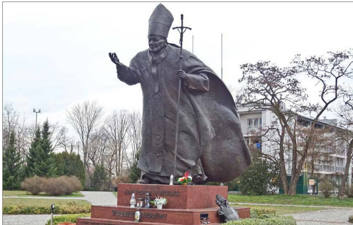
Pomnik Jana Pawła II, gdzie dotrą uczestnicy drogi krzyżowej w Dębicy, został odsłonięty 16 października 2005 r.

We wtorek 2 kwietnia na ulice Dębicy wyjadą uczestnicy drogi krzyżowej. Wyruszą o godz. 20:00 równocześnie z kościołów św. Jadwigi, Krzyża Św., Matki Bożej Anielskiej i Miłosierdzia Bożego. Rozważając kolejne stacje myślni Jana Pawła II przejdą na Plac Solidarności. Pod pomnikiem papieża Polaka będzie modlitwa w ciszy,