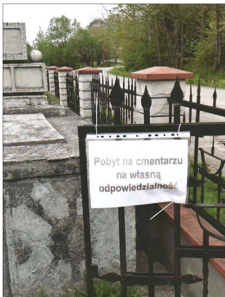
Kto to wymyślił?