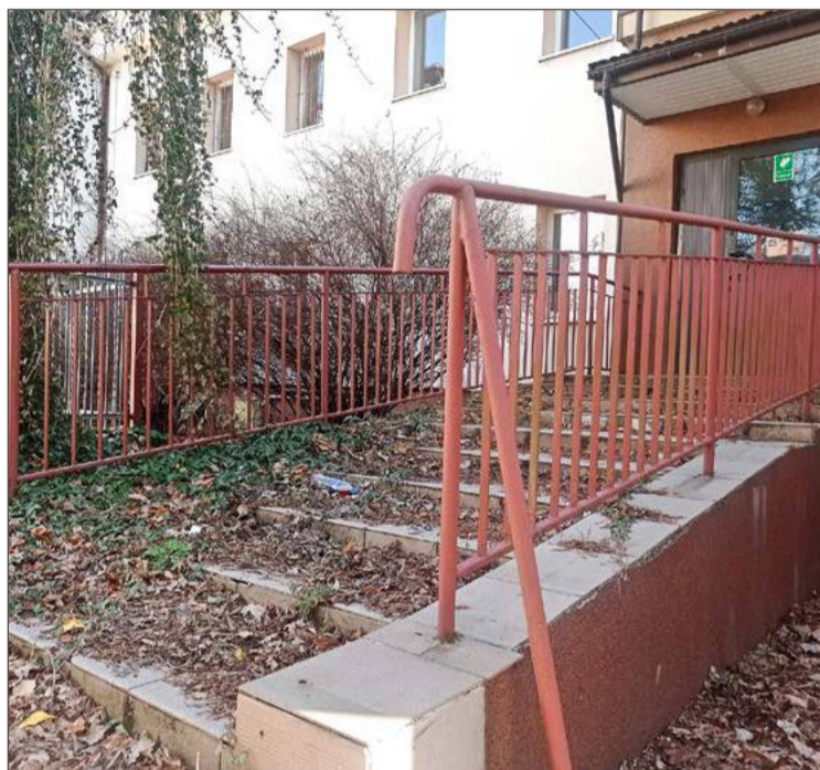
Tak dziś wygląda wejście do byłej siedziby Zespołu Szkół Specjalnych.

- Od momentu, kiedy zaczną obowiązywać akty wykonawcze do w/w ustawy temat przebudowy budynku będzie przedmiotem analizy pod kątem potrzeb obron-