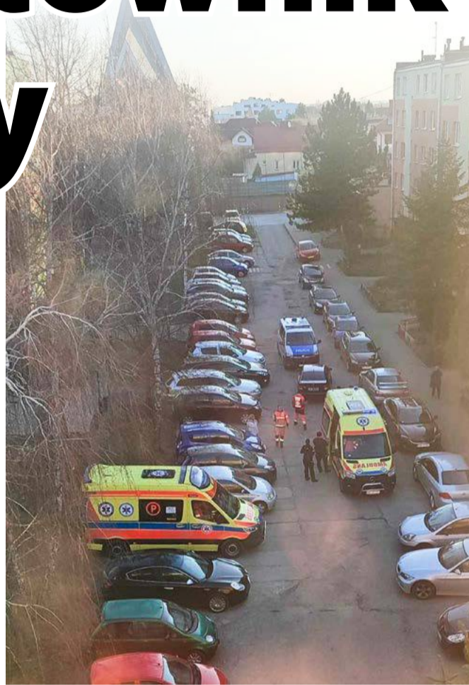
Do wydarzeń doszło w centrum osiedla.

Zlikwidowali parking, bo służył do schadzek