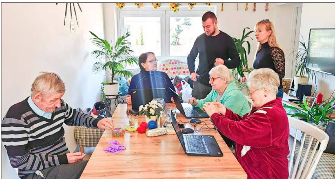
Komputery? Dla seniorów z Kochanówki korzystanie z nowych technologii to żaden problem.