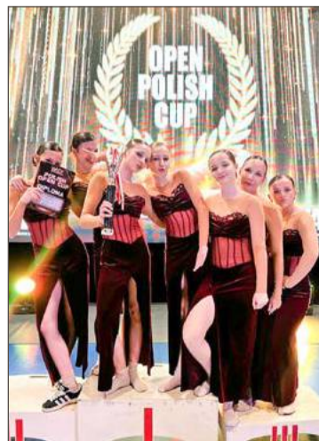
Pierwsze miejsce dla Soul Dance.