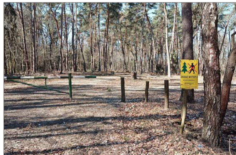
Parking przy drodze Machowa-Podlesie zniknął.