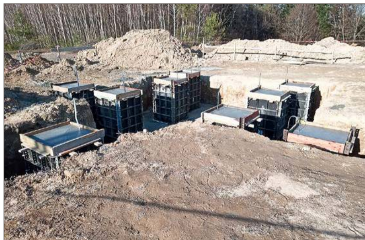
Fundamenty pod wieżę widokową w Wisowej już są gotowe.