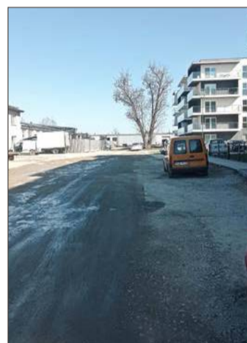
Mieszkańcy chcą remontu tej drogi.

- Albo tylko w tym pasie, w którym prowadzone były prace, albo, jeśli radni dołożą nam do tej inwestycji, na całej szerokości drogi - tłumaczy.