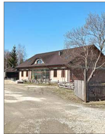
To w tym budynku będzie mieściło się nowe muzeum.

- Będę chciała pokazać historię chrześcijaństwa, przypomnieć odwiedzającym o tym, jak to zaczęło się u nas, czyli zaprezentujemy także Polskę piastowską - podkreśla Zofia Gągała-Bohaczyk.