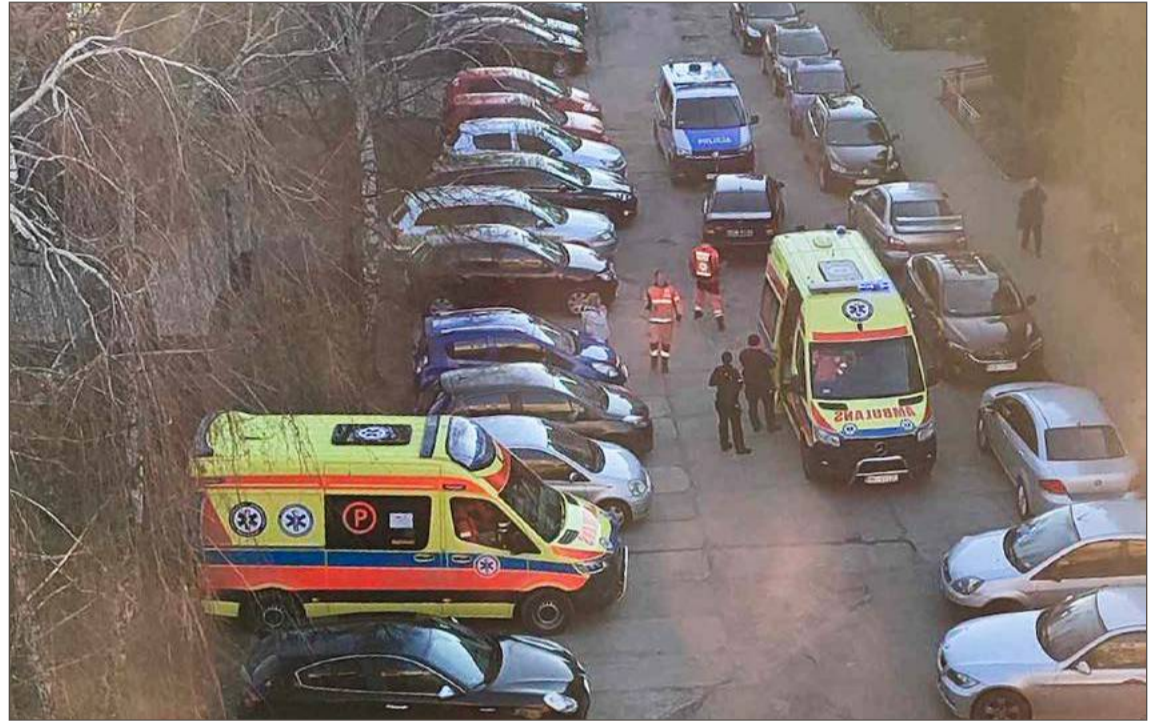
Mężczyzna znieważał ratowników, dusił jednego z nich i zaatakował także policjantów.

Ale na tym nie koniec. 25-letni mieszkaniec Dębicy zaatakował również mundurowych. Mężczyzna - jak mówi rzecznik policji - również ich znieważał. W końcu udało się okiełznać agresora, który trafił do Szpitalnego Oddziału Ratunkowego w Dębicy. Tam nadal kontynuował swoje ataki słowne. Ofiarą tym razem padł jeden z pra-