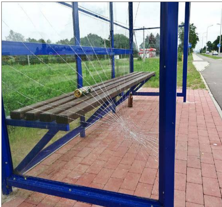
W ten sposób wiaty przystankowe niszczone są w gminie od lat.

- Dzisiaj rano jadąc starą Czwórką przy Machowej, na Borkach, przy gospodarstwie ogrodniczym, znowu zauważyłem rozbite szyby i to ewidentnie z obydwu stron. One stanowią zagrożenie dla życia i zdrowia, bo jeśli część z tej szyby wypadnie, a wiadomo, kto z przystanków korzysta - dzieci i osoby starsze. Jeśli ktoś nieopatrznie się zatoczy, polecą na tą szybę to ewidentnie może się pokaleczyć - przekonywał, zwracając uwagę również