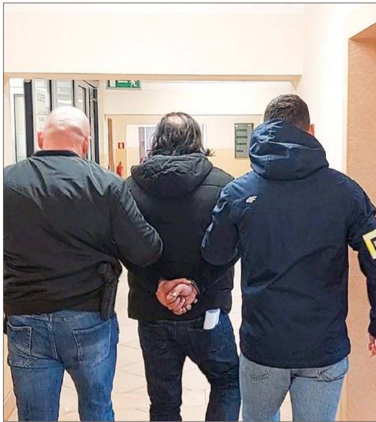
Mężczyzna był tzw. odbierakiem. Teraz grozi mu więzienie.

Obawiając się, że straci gotówkę spakowała ponad 60 tys. zł oraz biżuterię i zgodnie z poleceniami oszusta przekazała je mężczyźnie, który u niej się zjawił.