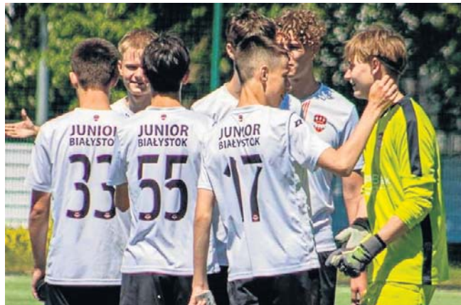
Zespół Akademii Piłkarskiej Junior Białostok wygrał ligę wojewódzką i w dwumeczu powalczy z Górnikiem Łęczna o prawo gry w Centralnej Lidze Juniorów U-17

Pierwszy mecz AP Junior - Górnik rozpocznie się w sobotę - 20 czerwca, o godz. 17, na stadionie przy ul. Elewatorskiej 4. Rewanż tydzień później w Łęcznej. ©