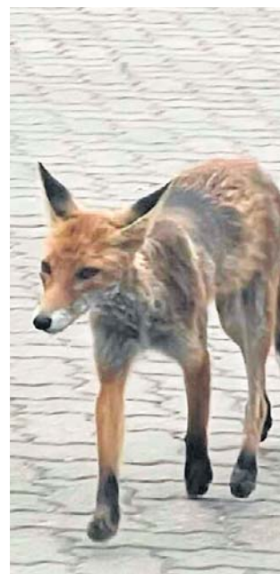
Lisy zamieszkały przy ulicy Kościelnej

Lisy zamieszkały na terenie parafii Wniebowzięcia Najświętszej Maryi Panny przy ul. Kościelnej. Są w złym stanie. Zwierzęta cierpią prawdopodobnie na świerz - niemal