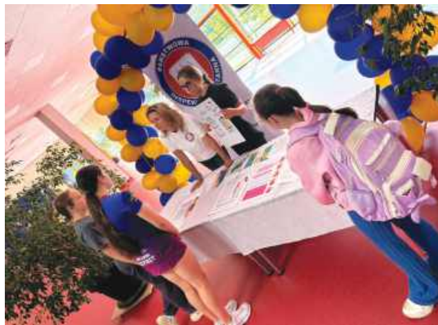
Stoisko „informacyjne” w Szkole Podstawowej w Stanisławowie Pierwszym

Większość komentatorów życia społecznego podkreśla związek panujący pomiędzy decyzją o rezygnacji dziecka z tak zaprojektowanego programu tego przedmiotu z wyznawanymi wartościami. Ważny był też wpływ rzetelnej informacji o zagrożeniach, jaka do części rodziców dotarła ze strony niezależnych instytucji. Bywało jednak, że na decyzje wpływ miały względy czysto praktyczne. Jedno z rodziców dziecka uczęszczającego do szkoły w Orzechowie mówi