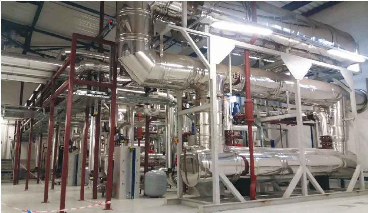
Odzysk ciepła z kogeneracji