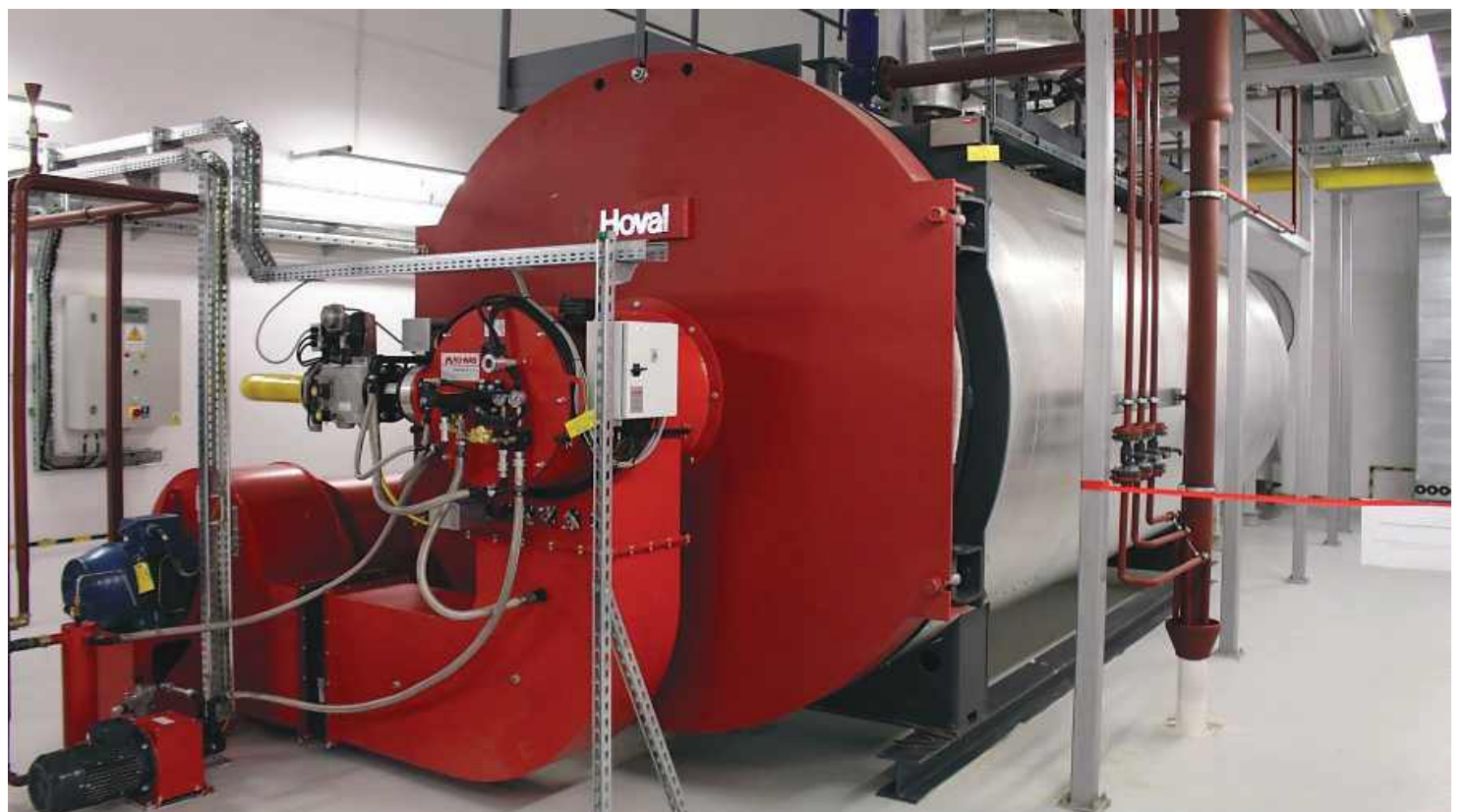
Kocioł szczytowy gazowo-olejowy

Absolwentka matematyki na Uniwersytecie Łódzkim, posiada tytuł MBA, studia ukończone na Uniwersytecie Warszawskim. Ukończyła studia doktoranckie i studia podyplomowe na SGH, te ostatnie z zakresu zarządzania ryzykiem w instytucjach finansowych.