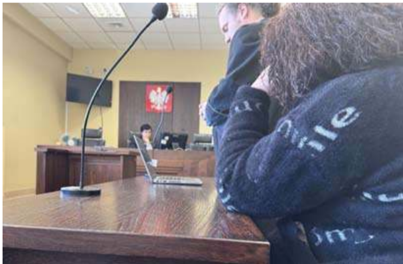
Na sali rozpraw: obrońca oskarżonej mówił o rzekomej „nagonce” na jego klientkę