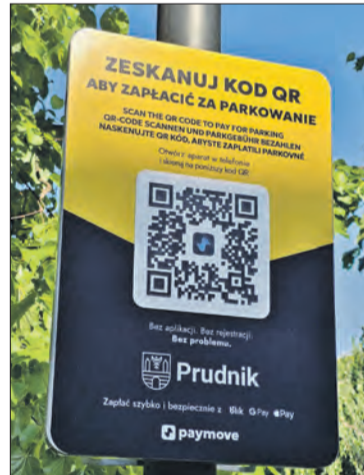
Nowe tablice z QR-kodem

obsługuje płatności blikiem, Google Pay i Apple Pay. Co ważne nie trzeba drukować biletu parkingowego i umieszczania go za szybą. Potwierdzenie opłaty otrzymuje się na podaną przez nas skrzynkę e-mailową. Tablice z kodem opisane są w językach: polskim, angielskim, niemieckim i czeskim. ■