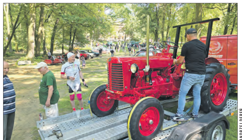
Na lawecie, to pewnie nie jeździ. Nic z tego, jest na chodzie!