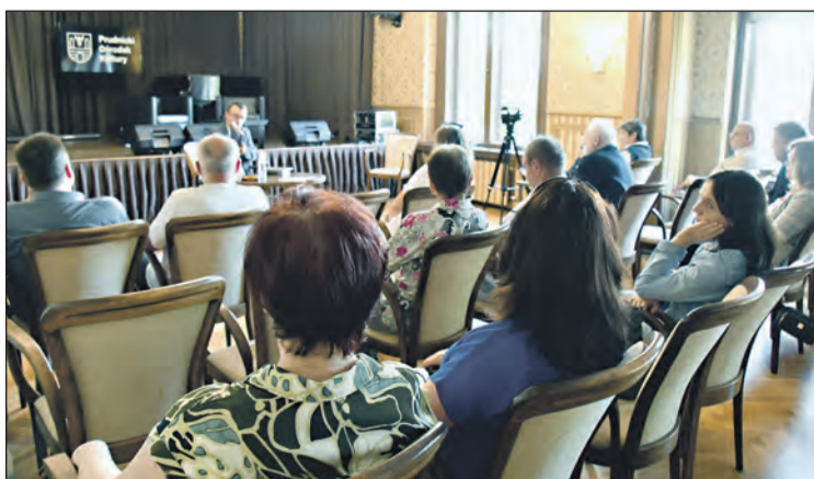
Spotkanie w Prudnickim Ośrodku Kultury