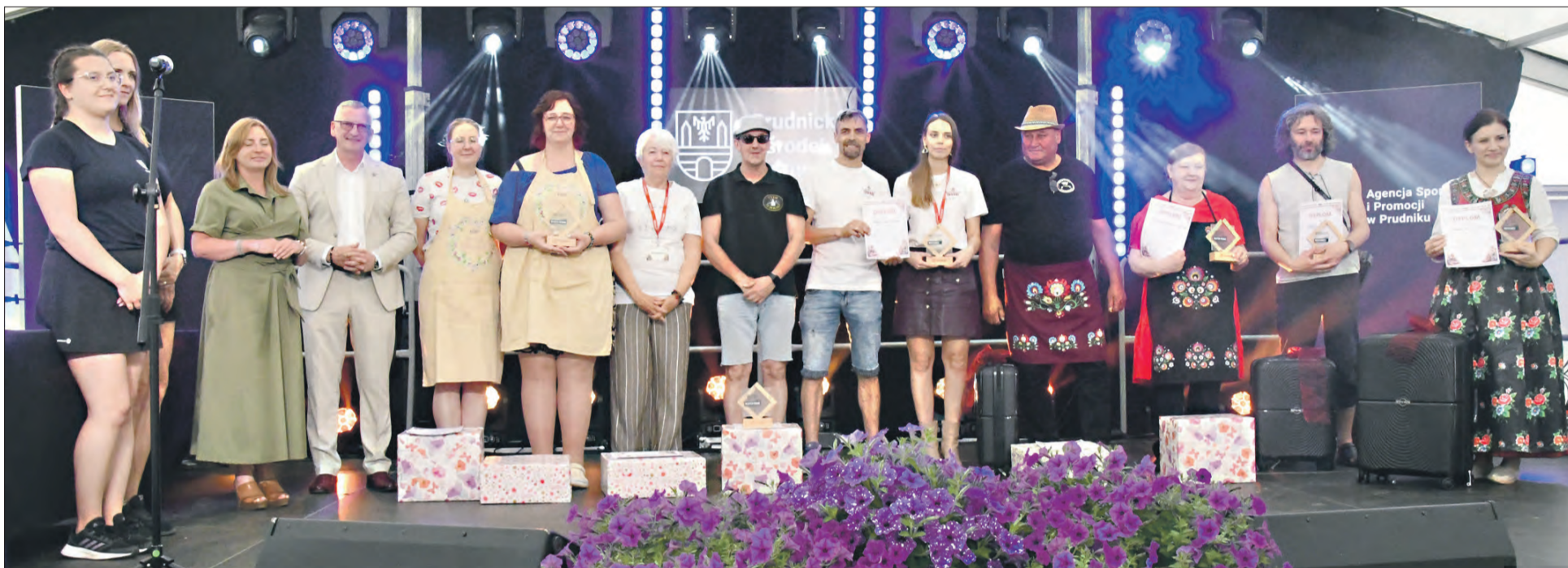
Nagrodzeni w konkursach organizowanych podczas wystawy: „Najlepsza Potrawa Regionalna” i „Najciekawsze Stoisko Wystawowe”