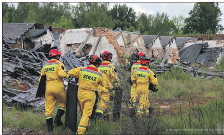
KW PSP OPOLE / ST. STR. SZYMON ADAMÓW (2)

z Brzegu, Opola i Głuchołaz, a także zespół dronowy PSP. W działaniach brały udział również jednostki OSP z Moszczanki i Rudziczki, a także zespoły ratownictwa medycznego, policja, przedstawiciele zarządzania kryzysowego oraz Powiatowy Inspektor Nadzoru Budowlanego.