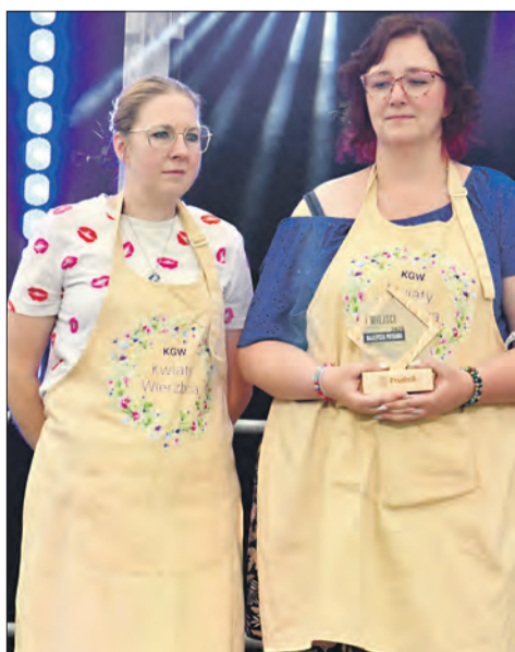
Konkurs „Najlepsza Potrawa Regionalna”, kategoria Dania gotowe, w tym mięsne, mączne, zupy i inne: I miejsce Koło Gospodyń Wiejskich „Kwiaty Wierzba”