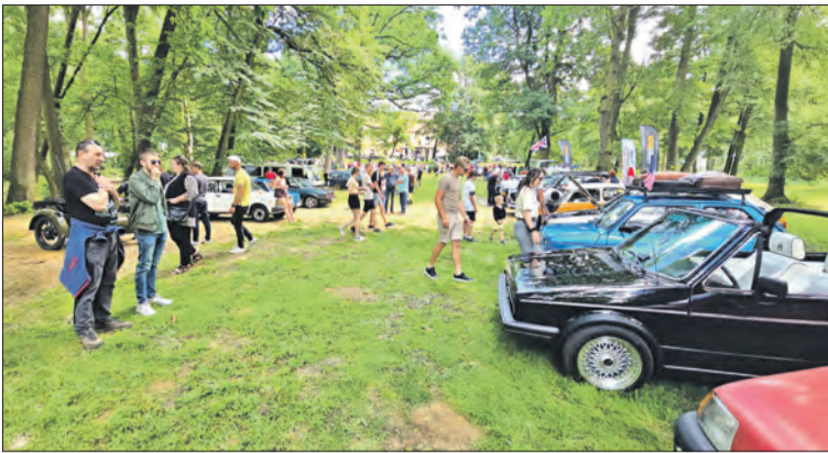
Złoty odbył się w klimatycznych przestrzeniach parku Pałacu Rozkochów