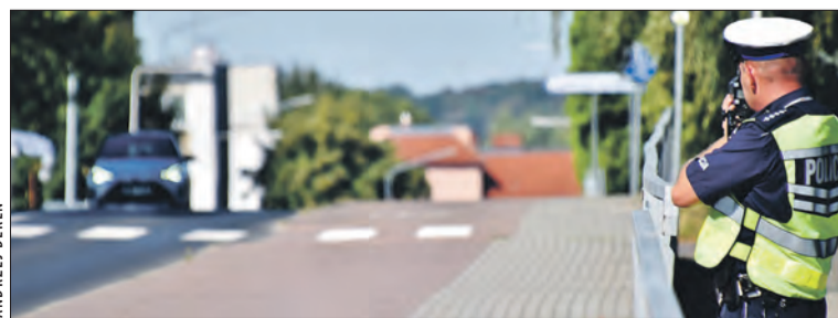
Szybka jazda drogo kosztuje

Niechlubnym rekordzistą okazał się 36-letni kierowca, który na ograniczeniu prędkości do 90 km/h pędził z prędkością 169 km/h. Za swoje zachowanie został ukarany mandatem karnym w wysokości 2500 złotych oraz 15 punktami karnymi. Wszyscy kierowcy stracili uprawnienia do kierowania pojazdami na okres 3 miesięcy. (informacja: KPP Prudnik) ■