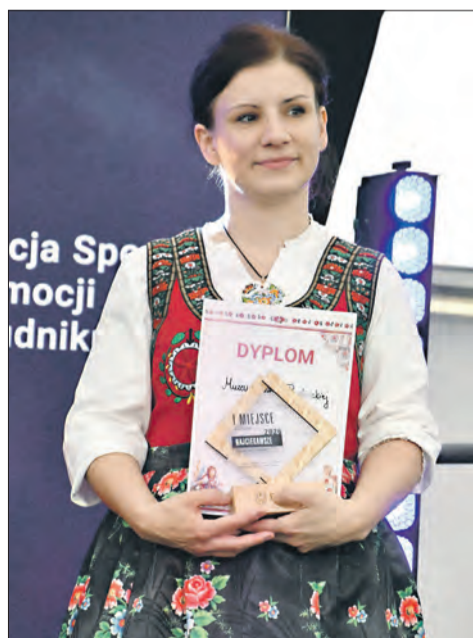
„Najciekawsze Stoisko Wystawowe”, I miejsce zajęło Muzeum Ziemi Prudnickiej