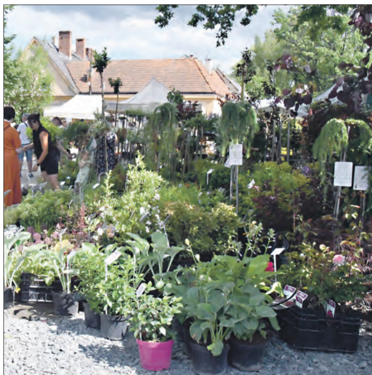
Była także oferta dla miłośników ogrodów

Uczestników nie zniechęciła pogoda (w dzień otwarcia wystawy mocno padało), ani nowa lokalizacja (ze względu na stan hali po powodzi). Tym razem po raz pierwszy wystawa odbyła się na terenie kompleksu sportowego przy ul. Kolejowej. Zaprezentowało się ok. 170 wystawców najróżniejszych dziedzin twórczej działalności. Było też kilkanaście koncertów, nie zabrakło szerokiej oferty gastronomii, warsztatów.