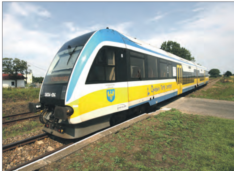
Przystanek kolejowy w Dytmarowie

Od 14 czerwca będzie obowiązywał nowy, wakacyjny rozkład jazdy. Doszedł pociąg do Krakowa, ale ubyło połączenie do Kłodzka.