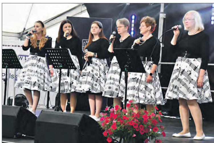
Panie z grupy „Bezimienni” z Brzegu

WIĘCEJ ZDJĘĆ TP NA NASZEJ STRONIE www.terazprudnik.pl