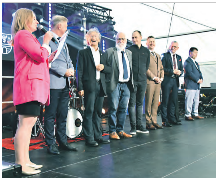
Oficjalne uroczyste otwarcie wystawy