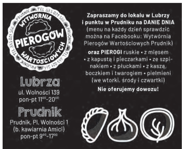
MENU/DANIE DNIA FACEBOOK: Wytwórnia Pierogów Wartościowych

77 436 28 77 | 601 268 421 REKLAMA W „TP” reklama@tygodnikprudnicki.pl