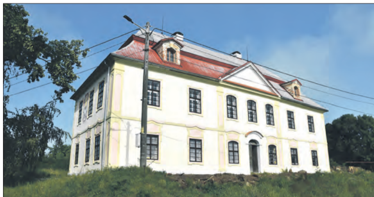
Jeden z pozytywnych przykładów odnowy pałac z najbliższego sąsiedztwa – pałacyk w czeskich Slezkich Pavlovicach koło Dytmarowa.

Atutem zamku w Głogówku jest jego historia z „medialnymi” smaczkami, takimi jak pobyt polskiego króla Jana Kazimierza Wazy, czy niemieckiego kompozytora Ludwiga van Beethovena. Budowla wyróż-