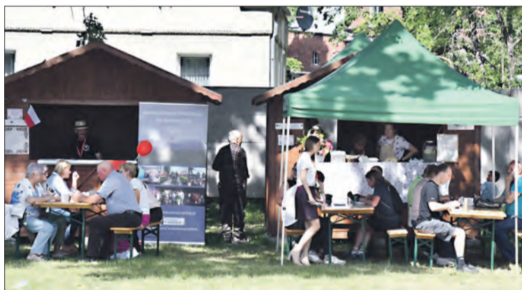
Nie można było narzekać na ofertę gastronomii