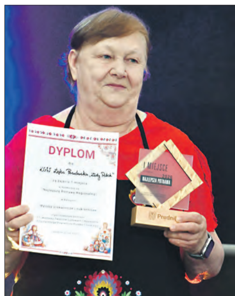
Konkurs „Najlepsza Potrawa Regionalna”, kategoria Wyroby piekarnicze i cukiernicze: I miejsce Koło Gospodyń Wiejskich „Złoty Potok”

Gratulujemy wszystkim laureatom oraz uczestnikom konkursów za zaangażowanie, pielęgnowanie lokalnych tradycji i tworzenie wyjątkowej atmosfery prudnickiej wystawy. ■