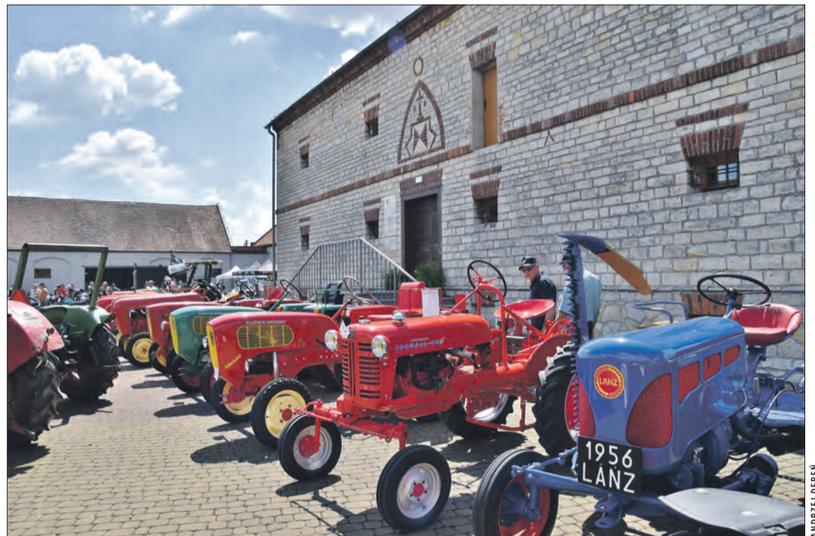
Traktory wystartują z placu przed zabytkowym spichlerzem w Brożcu

Wydarzenie organizowane przez Stowarzyszenie Stary Traktor Głogówek, Stowarzyszenie Inżynierów i Techników Mechaników Polskich - koło nr 22 w Opolu, Gminy Krapkowice, Walce i Głogówek, Krapkowicki Dom Kultury oraz Centrum Kultury i Czytelnictwa w Walcach, odbędzie się 5 lipca (niedziela). Impreza stanowić będzie część obchodów Dni Krapkowic.