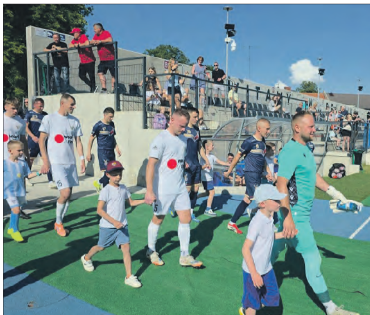
Na zakończenie sezonu Pogoń uległa Orłowi. Drużyna z Branic uzyskała historyczny awans do 4. ligi.