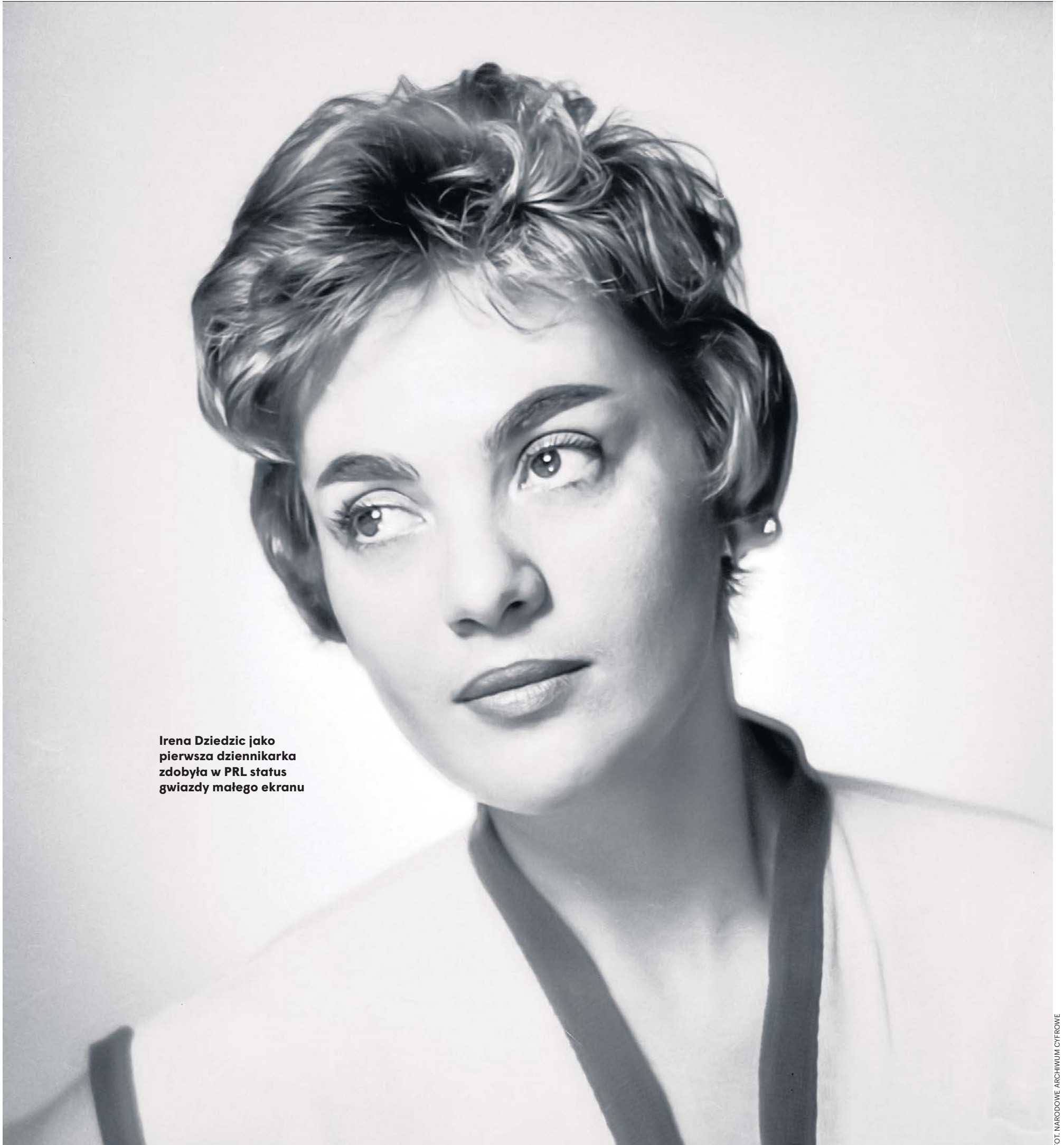
Irena Dziedzic jako pierwsza dziennikarka zdobyła w PRL status gwiazdy małego ekranu