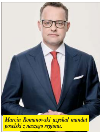
Marcin Romanowski uzyskał mandat poselski z naszego regionu.

Polityk był jednak luźno związany z regionem. To tzw. spadochroniarz – sześć lat wcześniej przegrał wybory w naszym okręgu (uzyskał 7,4 tys. głosów), po czym zameldował się w Bilgoraju (prokuratura wskazywała też na wynajem domu w Gilowie ) i zaczął intensywnie budować tu swoją rozpoznawalność.