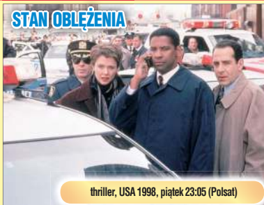
thriller, USA 1998, piątek 23:05 (Polsat)

W USA narasta fala islamskiego terroru, a Amerykanie porwiają arabskiego przywódcę religijnego. Tymczasem szef specjalnego oddziału FBI, Anthony Hubbard współpracując ze specjalistką do spraw Bliskiego Wschodu, Elise Kraft mają przewidzieć kolejne posunięcia terrorystów i skutecznie im przeciwdziałać. W odpowiedzi na akcję FBI dochodzi do kolejnych krwawych zamachów w Nowym Jorku i ataku na kwatery głównej FBI. Prezydent Stanów Zjednoczonych ogłasza stan wyjątkowy a władzę przejmuje wojsko.