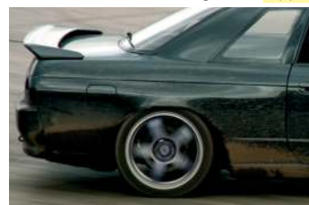
23-latek driftował pod jednym z marketów.

Kierowca został ukarany zgodnie w nowymi przepisami obowiązującymi od 30 marca, które jednoznacznie zakazują driftu i innych niebezpiecz-