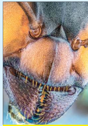
Prace powstały z wykorzystaniem techniki focus stackingu.

Jednym z najbardziej wymagających przykładów jest fotografia przedstawiająca głowę szerszenia. Finalny obraz składa się z 2032 oddzielnych zdjęć. Autor przygotował go z 12 osobnych kadrów, z których każdy zawierał kilkaset fotografii składających się z 2032 oddzielnych zdjęć. Sam proces wykonywania zdjęć