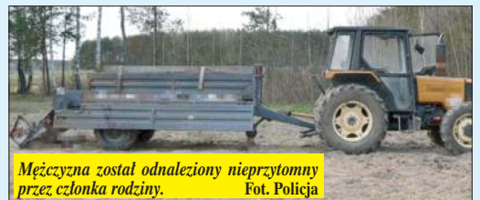
Mężczyzna został odnaleziony nieprzytomny przez członka rodziny.

Sekundy po wypadku były kluczowe. Pogranicznik ruszył natychmiast z pomocą 84-latkowi