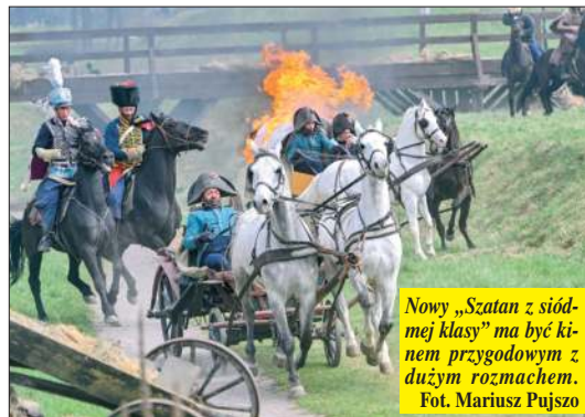
Nowy „Szatan z siódmej klasy” ma być kinem przygodowym z dużym rozmachem.

Nowa ekranizacja jest inspirowana znaną powieścią Kornela Makuszyńskiego, ale twórcy zapowiadają, że historia zyska współczesny wymiar. Obok przygodowo-detektywistycznej osi fabuły pojawić ma się także rozbudowany wątek jednej