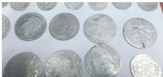
Te monety usiłowano przemyć w Hrebennem.

Szczególnie poważną sprawą było zatrzymanie blisko 1,5 tys. ton nielegalnie przemieszczanych odpadów na kolejowym przejściu granicznym w Dorohusku . Z dokumentów wynikało, że pociąg przewozi z Ukrainy złom stalowy. Ogłędziny wykazały jednak, że ta-