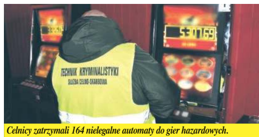
Celnicy zatrzymali 164 nielegalne automaty do gier hazardowych.

Swoje zbiory wzbogaciły muzea. KAS nieodpłatnie przekazała im 286 przedmiotów o charakterze muzealnym i kolekcjonerskim oraz ponad 8 kg kamieni półszlachetnych. Do muzeów w Białej Podlaskiej, Puławach, Hrubieszowie, Zamościu, Tomaszowie Lub. i Warszawie trafiły m.in. kilkadziesiąt monet z różnych wieków, medale, malowidła sakralne, skamieniałe szczątki wymarłych morskich organizmów – trylobity, cenne mine-