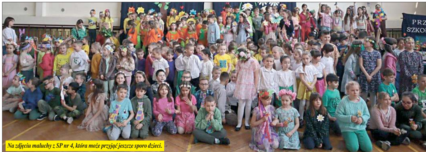
Na zdjęciu maluchy z SP nr 4, która może przyjąć jeszcze sporo dzieci.

Tylko w ciągu roku w Zamościu ubył 3 klasy pierwszaków