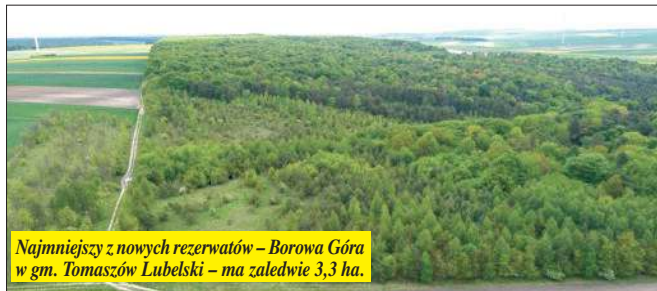
Najmniejszy z nowych rezerwatów – Borowa Góra w gm. Tomaszów Lubelski – ma zaledwie 3,3 ha.

Wszystkie znajdują się na gruntach Skarbu Państwa zarządzanych przez Lasy Państwowe, a ich utworzenie oznacza objęcie ochroną miejsc o wyjątkowej wartości przyrodniczej.