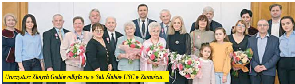
Uroczystość Złotych Godów odbyła się w Sali Ślubów USC w Zamościu.