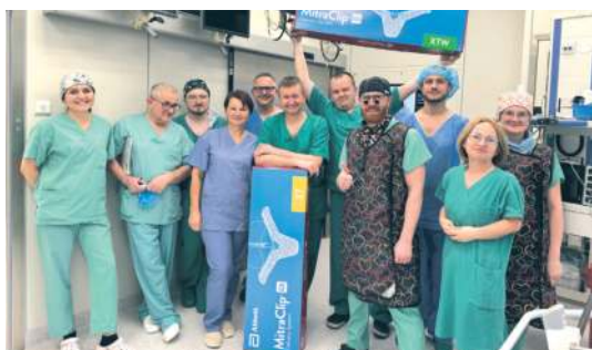
Operacja była efektem pracy wielodyscyplinarnego zespołu.

Lekarze zachęcają również kardiologów do kierowania pacjentów z niedomykalnością zastawki mitralnej do poradni kardiologicznej w Zamościu. Każdy przypadek ma być analizowany indywidualnie, by dobrać najbezpieczniejszą i najskuteczniejszą metodę leczenia. her