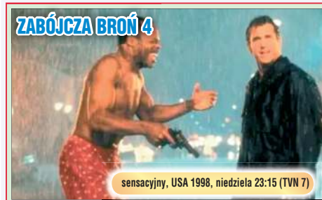
sensacyjny, USA 1998, niedziela 23:15 (TVN 7)