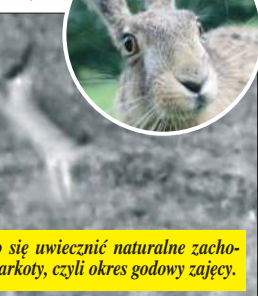
Pogranicznikom udało się uwiecznić naturalne zachowanie zwierząt – tzw. parkoty, czyli okres godowy zajęcy.

Takie widowiska można obserwować głównie wiosną, od lutego do kwietnia, gdy dni robią się dłuższe, a przyroda budzi się do życia.