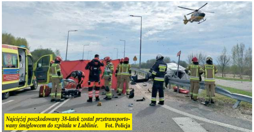
Najciężej poszkodowany 38-latek został przetransportowany śmigłowcem do szpitala w Lublinie.

Dramatyczny wypadek pod Frampolem. Trzy osoby ranne, jedna w ciężkim stanie