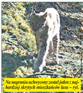
Na nagraniu uchwycony został jeden z najbardziej skrytych mieszkańców lasu – ryś.

Lasy Nadleśnictwa Józefów w większości znajdują się w sąsiednim kompleksie leśnym Puszczy Solskiej. Rysie są tu również nieliczne. Jednak wschodnie i południowe krańce Polski to i tak jedne z niewielu w kraju miejsc stałego występowania rysia. W całym kraju jego populacja szacowana jest zaledwie na około 200 osobników. (ar)