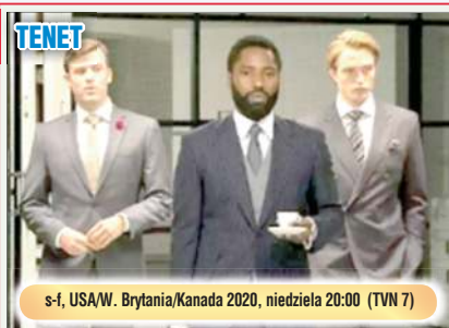
s-f, USA/W. Brytania/Kanada 2020, niedziela 20:00 (TVN 7)