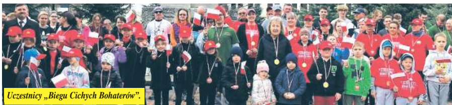
Uczestnicy „Biegu Cichych Bohaterów”.