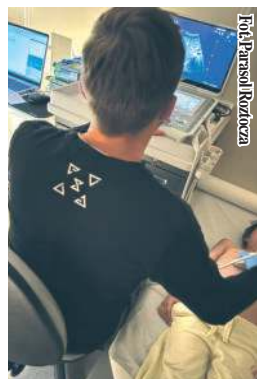
Ostatnia, szósta odsłona akcji – odbyła się 8 kwietnia.

Podobna akcja odbyła się w Krasnymstawie 9 kwietnia. Specjalistyczny ambulans, wyposażony w nowoczesny sprzęt diagnostyczny, stacjonował na parkingu przy Dworcu Starościń-