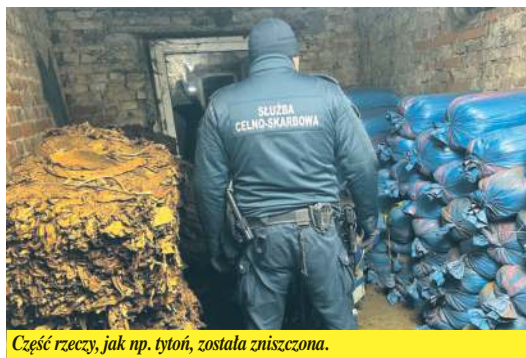
Część rzeczy, jak np. tytoni, została zniszczona.

Nie brakowało też ujawnień gotówki. W Dorohusku funkcjonariusze wykryli u podróźnego 400 tys. dolarów, czyli około 1,4 mln zł. Pieniądże przewoził w bagażu podręcznym i nie zgłosił ich przy przekraczaniu granicy. Na poczet grożącej kary wpłacił 70 tys. zł. (ar)