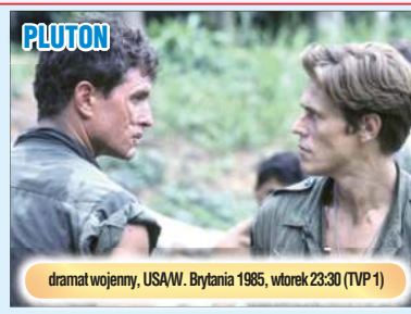
dramat wojenny, USA/W. Brytania 1985, wtorek 23:30 (TVP 1)