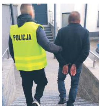
Najbliżej trzy miesiące 59-latek spędzi w areszcie tymczasowym.

Do zdarzenia doszło 2 kwietnia na trasie Malewczynna – Hucisko . Funkcjonariusz Straży Ochrony Kolei, jadąc prywatnym samochodem, zauważył kierującego ciągnikiem, który nie utrzymywał prostego toru jazdy. Zatrzymał pojazd i uniemożliwił dalszą jazdę, a następnie powiadomił służby. 59-latek był agresywny i groził mu pozbawieniem