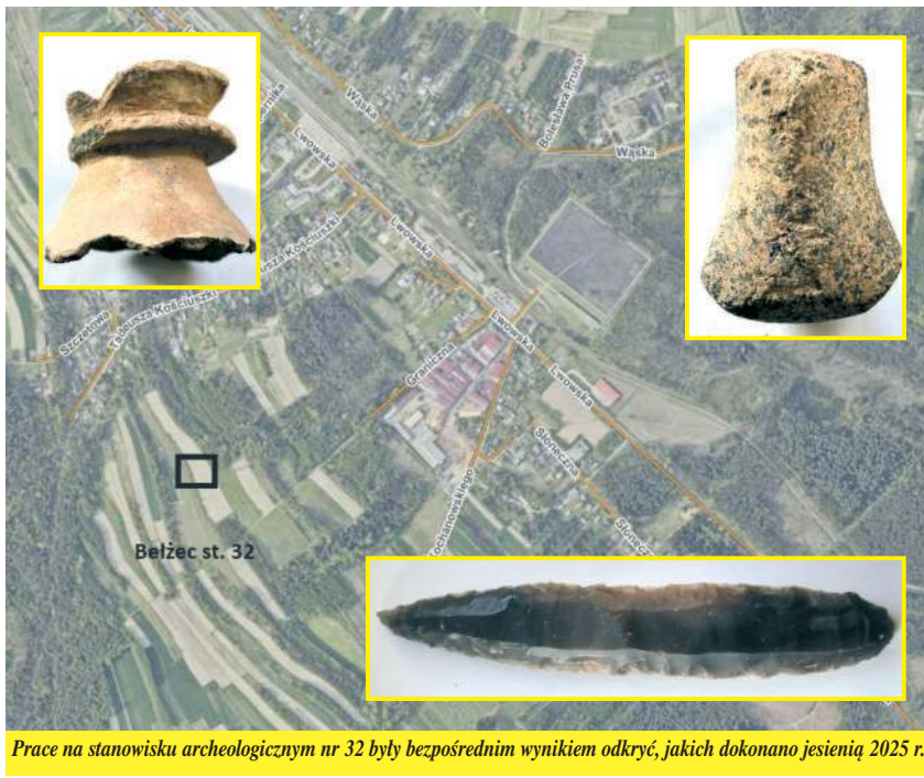
Prace na stanowisku archeologicznym nr 32 były bezpośrednim wynikiem odkryć, jakich dokonano jesienią 2025 r.