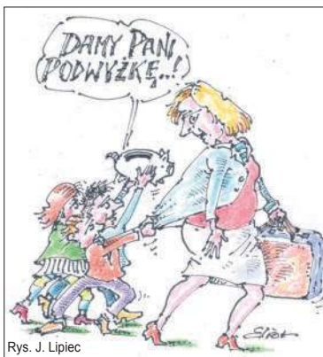
Rys. J. Lipiec

Waloryzacja, zdaniem środowisk nauczycielskich, jest niewystarczająca. Jeszcze w lutym, na etapie uzgodnień z ministerstwem Związków Nauczycielstwa Polskiego domagał się wzrostu o 15 proc., wskazując, że skumulowana inflacja w latach 2016-