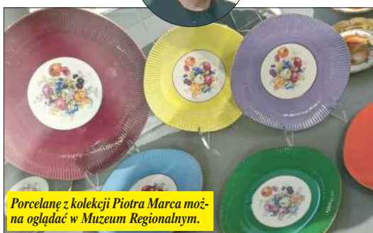
Porcelanę z kolekcji Piotra Marca można oglądać w Muzeum Regionalnym.

Kolekcja porcelany Piotra Marca jest największą prywatną kolekcją porcelany i porcelity z Chodzieży w Polsce.