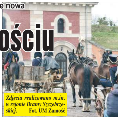
Zdjęcia realizowano m.in. w rejonie Bramy Szczerbkiej.

Jak podkreślają realizatorzy, nowy „Szatan z siódmej klasy” ma być kinem przygodowym z dużym rozmachem,