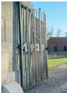
W czasie II wojny światowej Rotunda była miejscem kaźni tysięcy ludzi.

Zamojska Rotunda, to nie tylko unikatowy zabytek, ale także ważne miejsce na turystycznej mapie Zamościa. Szacuje się, że zwiedza ją rocznie ok. 25 tys. osób. To miejsce szczególnie, przypominające o tragicznej historii mieszkańców Zamojszczyzny. Obiekt był budowany w latach 1825-1831 jako