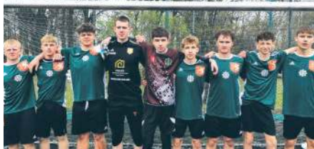
Reprezentacja Zespołu Szkół Techniczno-Motoryzacyjnych im. Jarosława Dąbrowskiego w Tomaszowie Lubelskim.

Reprezentacja Zespołu Szkół Techniczno-Motoryzacyjnych im. Jarosława