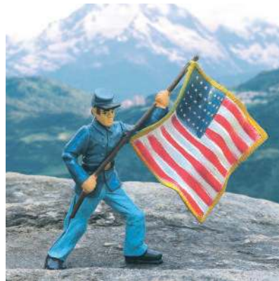
Mężczyzna twierdził, że służy w armii USA i bierze udział w misjach wojskowych.

Z czasem internetowa znajomość zaczęła zacieśniać. Mężczyzna pisał o planach przejścia na emeryturę i zamieszkania w