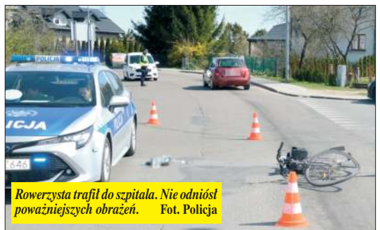
Rowerzysta trafił do szpitala. Nie odniósł poważniejszych obrażeń.