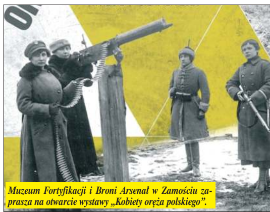
Muzeum Fortyfikacji i Broni Arsenal w Zamościu zaprasza na otwarcie wystawy „Kobiety oręża polskiego”.

W Muzeum Ziemi Biłgorajskiej w Biłgoraju