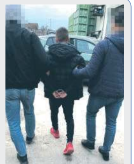
Mężczyzna został zatrzymany na terenie województwa łódzkiego.

Bilgoraj. Drift, pięcioro młodych w audi, muzyka, pisk opon i ucieczka przed policją