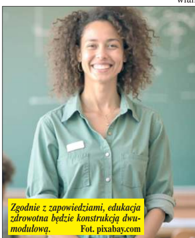
Zgodnie z zapowiedziami, edukacja zdrowotna będzie konstrukcją dwumodulową.

ra Nowacka podkreśliła, że decyzja mogła zapaść wcześniej, jednak proces opóźniło prezydenckie veto do ustawy „Kompas Jutra”, która stanowiła fundament pod planowane zmiany. Prezydent swojej sprzeciw uzasadnił obawami o indoktrynację i koniecznością ochrony praw rodziców. Ministerstwo Edukacji Narodowej zapowiedziało wówczas wdrożenie zmian planem B – poprzez rozporządzenie, aby reforma weszła w życie od 1 września 2026 r. I tak też wprowadza reformę edukacji.