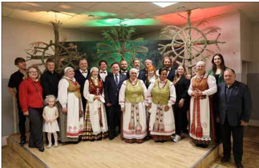
W tym roku Centrum Kultury w Rudominie po raz kolejny włączyło się w obchody święta państwowego, organizując wspólne śpiewanie hymnu narodowego

Jak zaznaczył nasz rozmówca, Dzień Państwowości Litwy należy postrzegać przede wszystkim jako