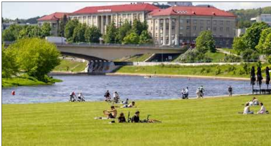
Festiwal oferuje bogaty program wydarzeń – od zajęć sportowych i warsztatów twórczych po koncerty i imprezy wieczorne