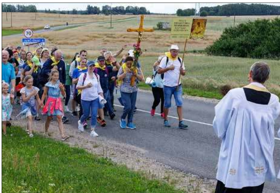
Pielgrzymowanie jest nie tylko formą religijnej wędrówki do miejsc świętych, ale także czasem duchowej odnowy, refleksji i pogłębiania wiary

W programie znalazły się msze święte, konferencje, świadectwa, wspólny śpiew, modlitwa oraz czas na rozmowy. Uczestnicy mogli również podziwiać piękno mijanych miejsc oraz modlić się w intencji swoich rodzin, wspólnot i całego świata. ■