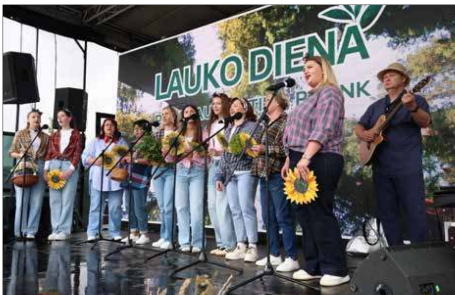
Wszyscy spędzili swój wolny czas w miłej atmosferze, pożytecznie i aktywnie