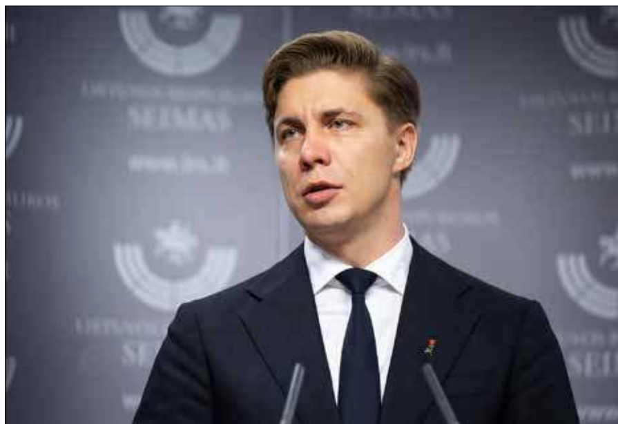
■ Każdy minister nowego rządu wnosi odmienne doświadczenie i kompetencje — zapewnił nowy premier