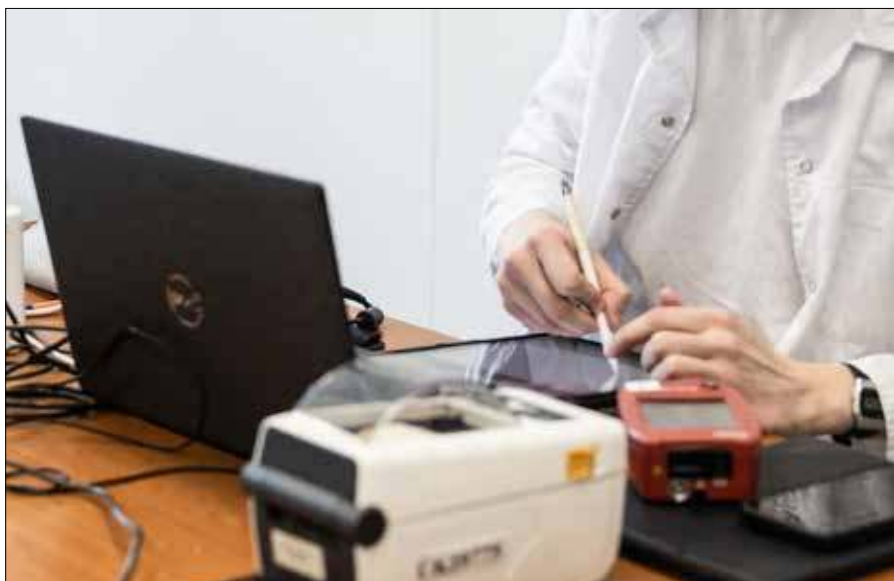
Litwa jest jednym z krajów z najlepszym dostępem do internetu na świecie