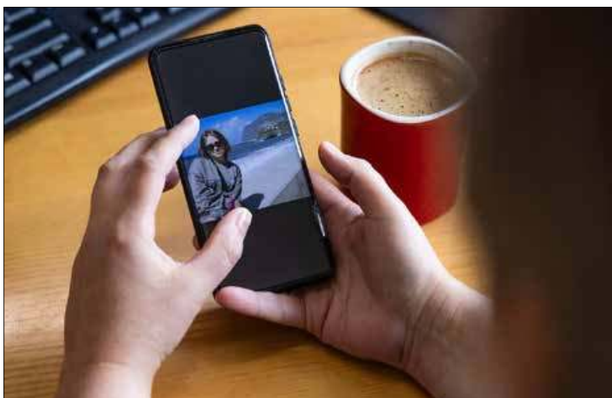
Wakacyjne zdjęcia w mediach społecznościowych pokazują tylko wybrane chwile, a nie codzienną rzeczywistość