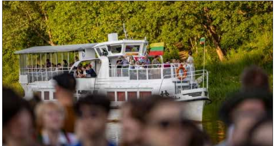
Festiwal zaprasza nad rzekę – aby spędzić tam czas, być aktywnym i na nowo odkrywać Wilno

Osoby pragnące poruszać się w inny sposób – wraz ze swoimi lub bliskich, przyjaciół zwierzakami