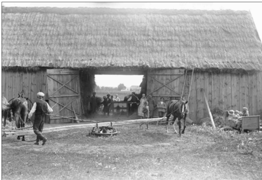
Migawka z Wołynia przed II wojną światową