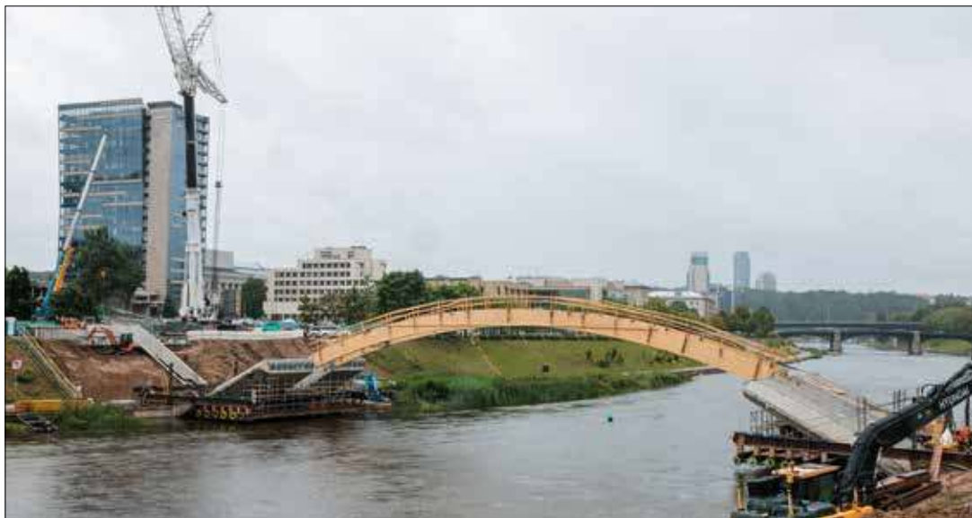
W Wilnie przez Wilię buduje się nowy most dla pieszych i rowerzystów