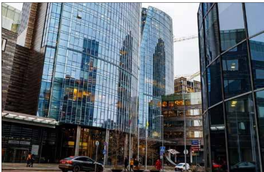
Wzrost liczby milionerów na Litwie jest w dużej mierze związany ze wzrostem cen nieruchomości

Najwięcej milionerów na świecie mieszka w USA — szacuje się, że jest ich ok. 7,9 mln. Wśród miast liderem jest Nowy Jork, gdzie mieszka ponad 350 tys. osób posiadających majątek wart co najmniej milion dolarów. W Europie najwięcej milionerów w stosunku do liczby mieszkańców ma Mediolan. ■