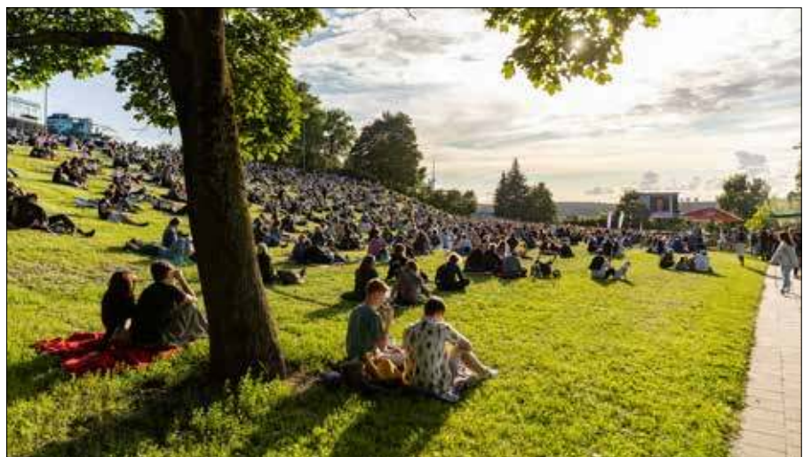
Bezpłatne kino pod gołym niebem – kolejna okazja do miłego spędzenia wolnego czasu