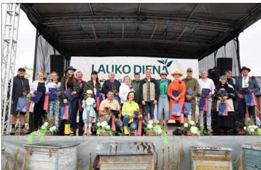
Wydarzenie zostało zorganizowane, aby w ciekawy i przystępny sposób przybliżyć uczestnikom rolnictwo, tradycje oraz innowacje regionu

W wydarzeniu wzięło udział Stowarzyszenie „Kurianty visuomene”,