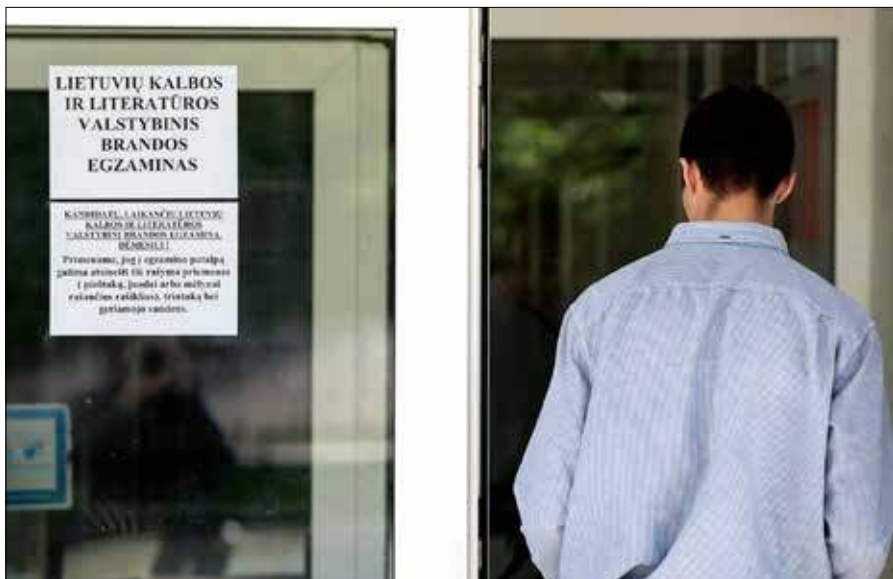
Narodowa Agencja Edukacji opublikowała wyniki państwowych egzaminów maturalnych

Na poziomie podstawowym (B) egzamin zdało 77,1 proc. spośród 8 009 kandydatów.