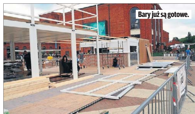
Bary już są gotowe.

Plaża w Manufakturze to nie tylko leżaki. Przez cały sezon odbywają się tu turnieje siatkówki plażowej i rugby, a organizatorzy co roku wzbogacają program o nowe atrakcje sportowe i rekreacyjne.