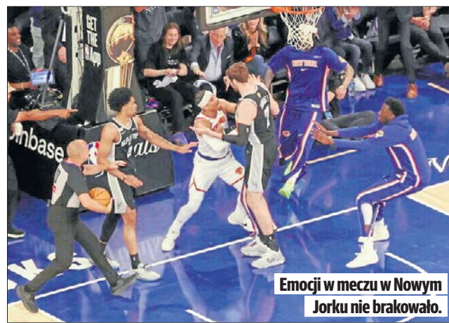
Emocji w meczu w Nowym Jorku nie brakowało.

Piłkarze Piasta triumfowali w futsalowej ekstraklasie po raz trzeci w historii (poprzednio w latach 2022 i 2025).