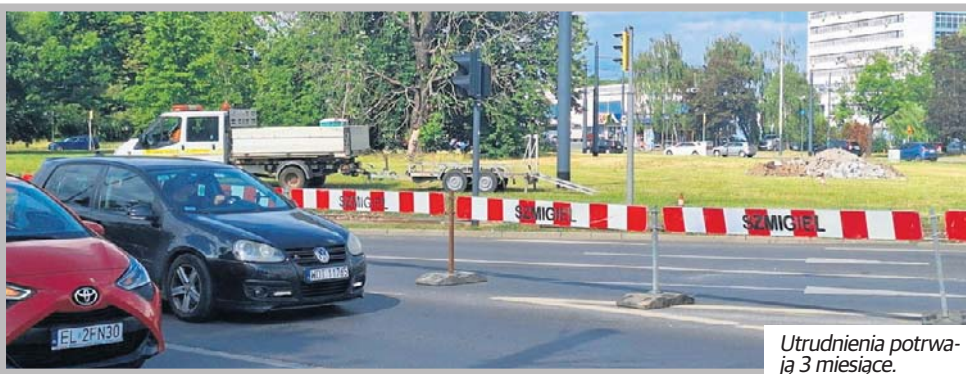
Utrudnienia potrwają 3 miesiące.

Remont ma być prowadzony w dni robocze - od poniedziałku do piątku w godz. 6.30-18.