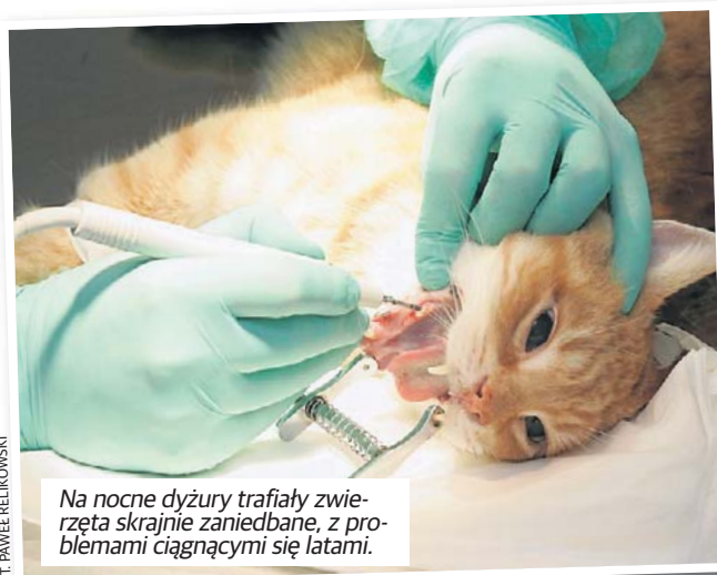
Na nocne dyżury trafiały zwierzęta skrajnie zaniedbane, z problemami ciągnącymi się latami.

- Jeszcze w marcu klinika przy ul. Rzgowskiej świadczyła opiekę całodobową, ale większość weterynarzy miała dość i zrezygnowano z nocnych dyżurów. W ciągu trzech lat w przychodni przewinęło się około dziesięciu lekarzy, obecnie jest ich tylko pięciu - mówi była pracownica lecznicy. - Dostawaliśmy złe recenzje za to, że na dyżurze nie było lekarza specjalizującego się