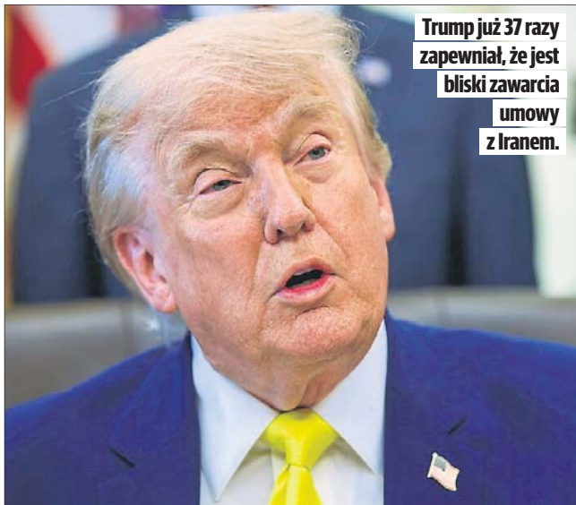
Trump już 37 razy zapewnił, że jest bliski zawarcia umowy z Iranem.

- Mamy duże szanse na podpisanie umowy w ciągu dwóch lub trzech dni - powiedział Trump w poniedziałek wieczorem po finałowym meczu NBA w Nowym Jorku. - Jesteśmy bardzo blisko zawarcia bardzo, bardzo dobrej, silnej, potężnej umowy. Gdybyśmy ich zbombardowali - co moglibyśmy zrobić z łatwością - gdybyśmy zbombardowali ich przez kolejne dwa lub trzy tygodnie, nie zostałoby im nic. Ale cieśnina (Ormuz - PAP) nie zostałaby otwarta przez całe miesiące. Zginęłoby bardzo wielu ludzi.