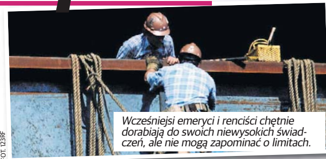
Wcześniejsi emeryci i renciści chętnie dorabiają do swoich niewysokich świadczeń, ale nie mogą zapominać o limitach.

Rzesza polskich emerytów jest coraz liczniejsza. Przybywa nie tylko osób, które osiągnęły powszechny wiek emerytalny, ale także tych, którzy z różnych powodów pobierają wcześniejszą emeryturę.