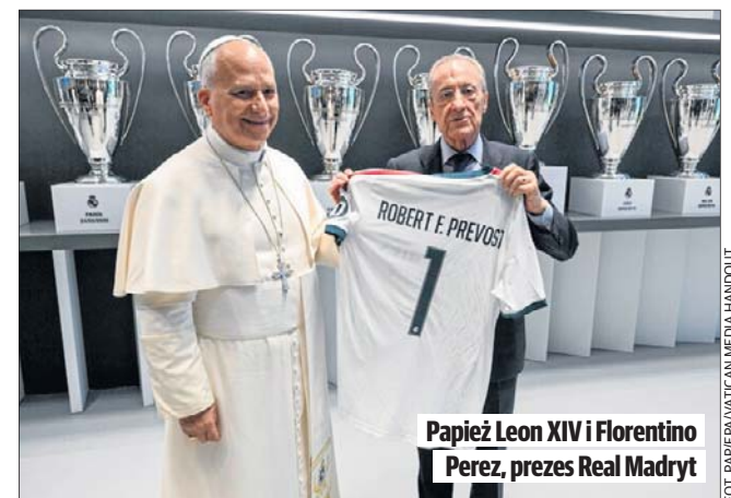
Papież Leon XIV i Florentino Perez, prezes Realu Madryt

To jedno z głównych wydarzeń wizyty papieża w Hiszpanii.