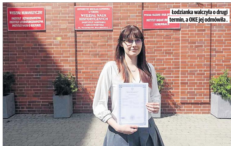
Łodzianka walczyła o drugi termin, a OKE jej odmówiła.

- Datę egzaminu wyznaczono na 19 maja. Przyszłam do szkoły pełna zapału i nagle zobaczyłam, że nie ma mnie na liście. Od razu zwróciłam się do pani Dyrektor. Okazało się, że w ogóle nie ma mnie w systemie. Jako jedyna zdawałam w formule 2015, więc