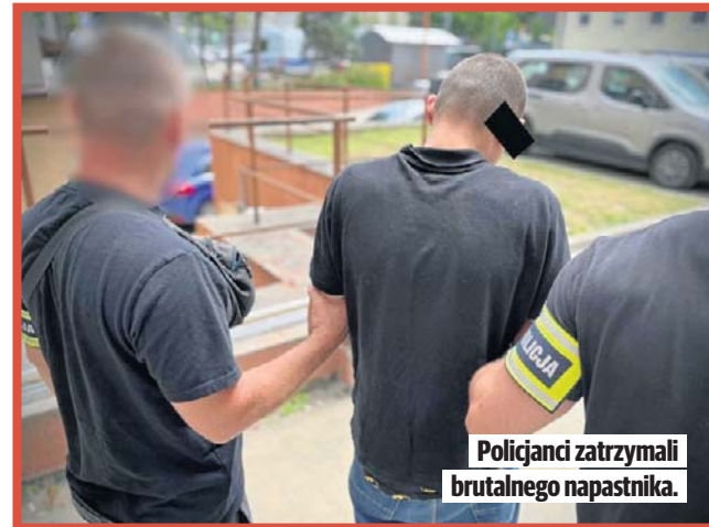
Policjanci zatrzymali brutalnego napastnika.

Bandyta został zatrzymany wczoraj - we wtorek 9 czerwca. Okazało się, że jest to recydywista, który był wiele razy karany, zaś w zakładach karnych spędził ponad sześć lat. Podczas przesłuchania w prokuraturze przyznał się do winy. Usłyszał zarzuty dotyczące czynu chuligańskiego i spowodowania uszczerb-