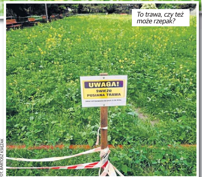
To trawa, czy też może rzepak?

Zapytaliśmy o tę inwestycję Urząd Miasta Łodzi. Do czasu publikacji artykułu nie otrzymaliśmy odpowiedzi.