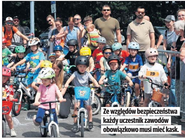
Ze względów bezpieczeństwa każdy uczestnik zawodów obowiązkowo musi mieć kask.