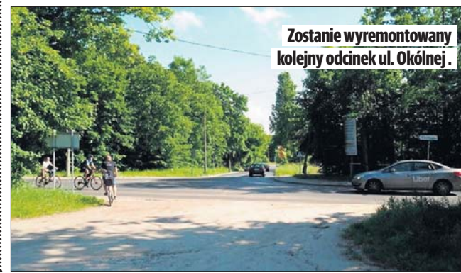
Zostanie wyremontowany kolejny odcinek ul. Okólnej.

Wkrótce nastąpi remont pętli autobusowej przy szpitalu, gdzie oprócz przystanków znajdują się miejsca postojowe i postój taxi. Wyremontowany zostanie też kolejny odcinek ul. Okólnej - aż do ronda z ul. Łagiewnicką.