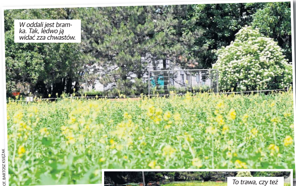
W oddali jest bramka. Tak, ledwo ją widać zza chwastów.

Co ciekawe teren jest ogrodzony taśmą, a przed boiskiem postawiono tabliczkę z napisem: „Uwaga, świeżo posiana trawa. Zakaz użytkowania do 21 czerwca”. Tyle, że powinni dodać, że więcej jest tam chwastów niż tej trawy, a sama trawa musiała zostać posiana dość dawno, skoro w niektórych miejscach sięga kolan. Co prawda magistrat niedawno ogłosił, że w ramach walki z suszą glebową - wprowadza zakaz koszenia traw na terenach mu podlegających, ale to raczej nie powinno obejmować obiektów takich jak boiska do gry w piłkę nożną i koszykówkę. Bo trudno młodzieży uprawiać te dyscypliny sportu