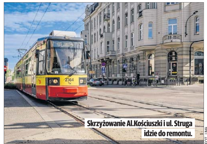
Skrzyżowanie Al. Kościuszki i ul. Struga idzie do remontu.

sie tramwaje przejechały przez nie ponad 2 mln razy. Tory są mocno sfatygowane, trzeba je wymienić. W tygodniu tramwaje kursować będą bez zmian, ale w piątek od godz. 19 do niedzieli skrzyżowanie zostanie zamknięte, także dla samochodów. Zostanie tylko zachowany przejazd jednym prawym pasem Al. Kościuszki tylko na wprost. Z ul. Struga będzie możliwy wyłącznie manewr skrzyżowania w prawą stronę. W czasie robót ruch tramwajów zostanie wstrzymany na Al. Kościuszki i ul. Zachodniej.