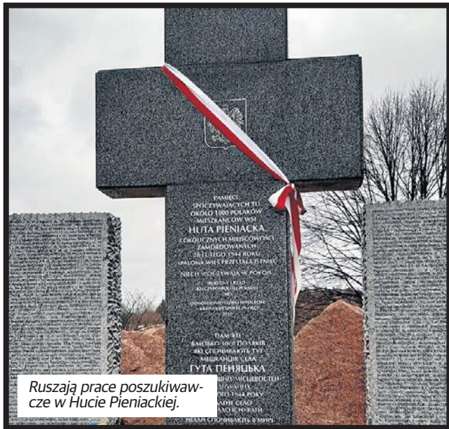
Ruszą prace poszukiwawcze w Hucie Pieniackiej.

Jak mówił, jeżeli chodzi o liczbę konkretną są to 634 osoby, ale wiadomo, że ta liczba już wzrosła i to jest lista imienna,