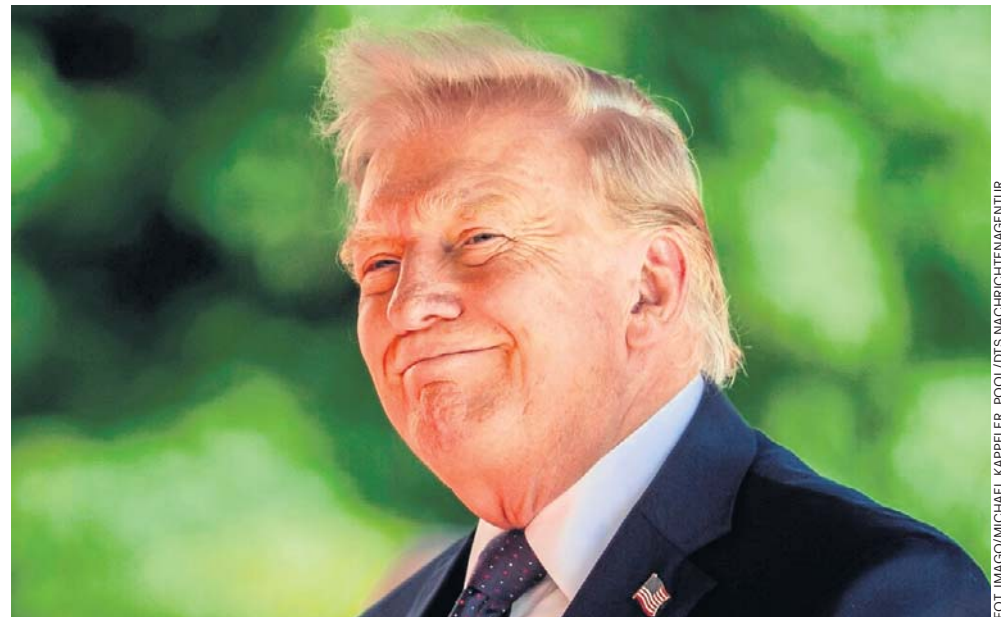
Donald Trump uczestniczy w szczycie G7 we Francji. Kraje europejskie będą zabiegać, by w sprawie wojny na Ukrainie wypracować wspólną linię z prezydentem USA

Powiedział również, że w trakcie rosyjskiej inwazji co miesiąc ginie „dwadzieścia pięć tysięcy osób - głównie żołnierzy”. - A to nie powinno mieć miejsca. Ale wczoraj odbyłem dwie bardzo dobre roz-