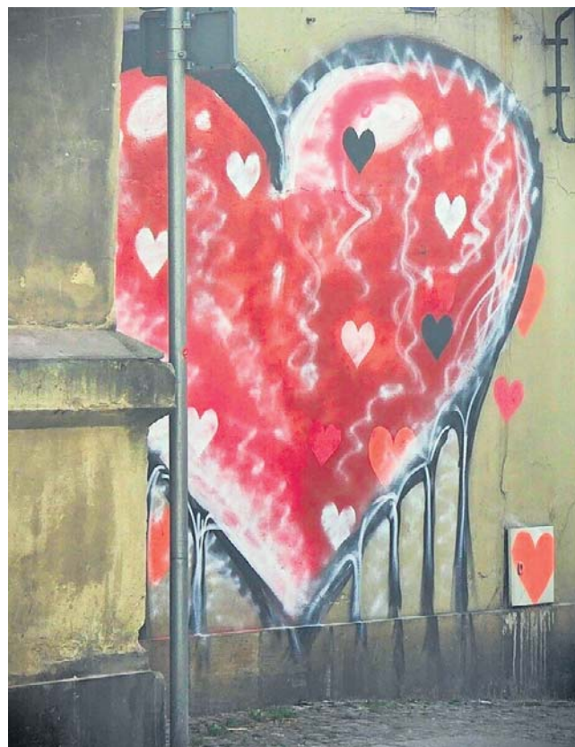
Malunek miał być wyrazem uczuć, ale dla autora oznacza spore kłopoty

- Policjanci ze świdnickiej komendy po raz kolejny przekonali się, że w policyjnej służbie można spotkać naprawdę różne historie - także te, w których serce wyraźnie wyprzedziło rozsądek. W nocy z 28 lutego na 1 marca na jednej z elewacji budynku, jak się później okazało wpisanego do rejestru