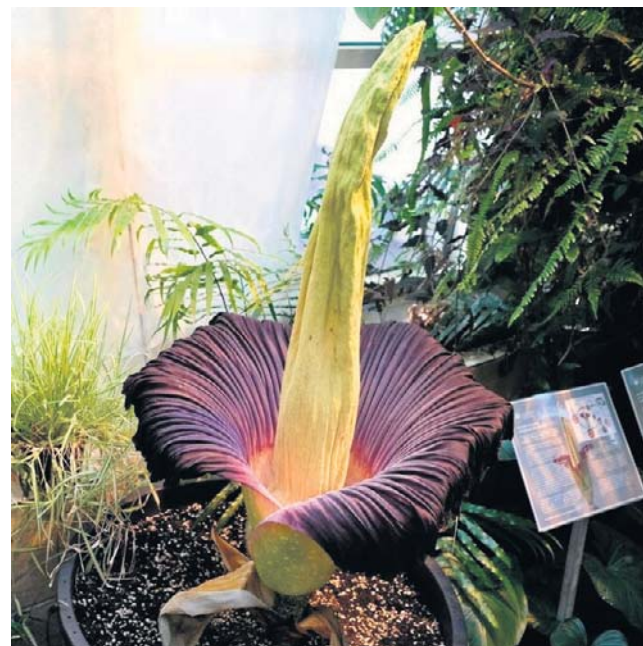
Tak wyglądała ta roślina po zakwitnięciu w 2021 r. w ogrodzie w Warszawie

Dziwadło olbrzymie - ta roślina nazywana jest najbardziej cuchnącym kwiatem na świecie. Mało kto potrafi wytrzymać zapach (a raczej odór), jaki rozsiewa wokół siebie, gdy rozkwita. Ludzie, którzy byli koło rośliny w momencie jej kwitnienia, określają to, co czuły ich czułe nosy, różnie: zapach zepsutego mięsa, padlina, zapach śmierci, jakby cośgniło.