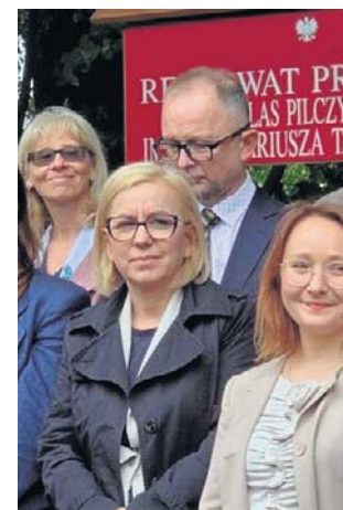
Minister Paulina Hennig-Kloska we Wrocławiu

Rezerwat stworzono, by chronić naturalne procesy przyrodnicze bez ingerencji człowieka. Dzięki temu możliwa będzie obserwacja natural-