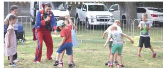
Najmłodszy mogli wziąć udział w zabawach z animatorem

Uprawą roślin ozdobnych zajmujemy się już od 2000 r., a więc 25 lat. Mąż łączy to z pracą zawodową. Bardzo lubię pracę przy roślinach. Niestety co roku jest coraz gorzej, wzrastają koszty produkcji, a dodatkowo mamy wrażenie, że młodsze osoby mniej interesują się roślinami. Starsze osoby sadziły więcej roślin. Produkcujemy także sadzonki warzyw, co roku zmniejszamy ich ilość, a i tak wyrzucamy. Ludzie wolą kupić sobie gotowe, niż uprawiać. Gdy zaczynaliśmy to 70% naszej produkcji stanowiły warzywa, a 30% kwiaty. Dziś może 10% stanowią warzywa, a resztę kwiaty. Jeśli chodzi o kwiaty i rośliny ozdobne, to zawsze klienci pytają o nowości. Dziś sprzedaliśmy np. sporo wieloletniej szafwii. Mamy lilie, są piękne, przyciągają wzrok, ale co roku jest gorzej, moda na nie mija. Ubiegły rok był słaby, a ten niestety chyba będzie jeszcze gorszy. To nie jest łatwy kawałek chleba, wymaga wiele pracy, sporych nakładów