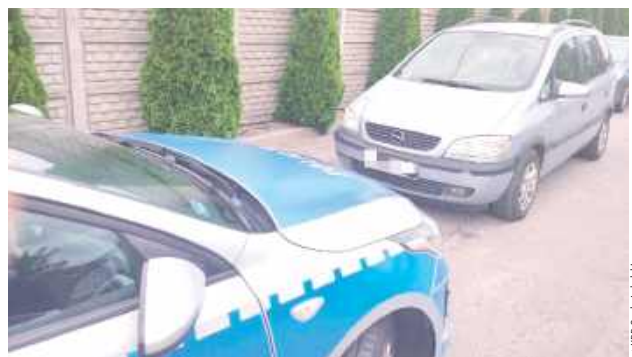
Kierowca odjechał w stronę ul. Przemysłowej, gdzie po krótkiej chwili zaparkował

Choć był po służbie i zapewne planował tylko szybkie zakupy, jego policyjny instynkt nie zawiodł.