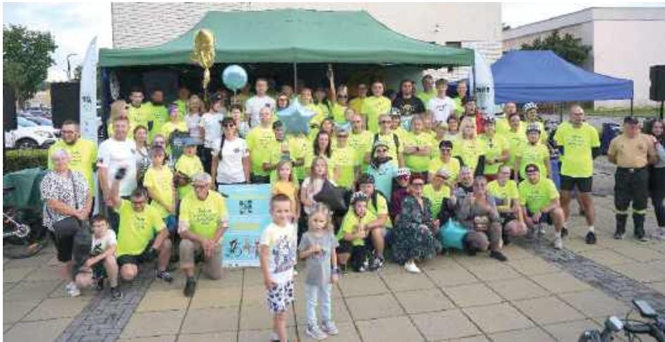
W minioną sobotę odbyło się świętowanie tytułu najlepszych!

Tegoroczna edycja RSP przyniosła wyjątkową dawkę adrenaliny, gdyż rywalizacja toczyła się aż na trzech płaszczyznach! Rowerzyści walczyli o zwycięstwo w osobnych kategoriach: dla dużych miast, dla mniejszych gmin, o zupełnie nowo wprowadzony Super Puchar RSP! W tej prestiżowej rywalizacji zmierzyły się dwa najbardziej utytułowane dotychczas miasta - Biała Podlaska i Nowa Sól, mające po trzy zwycięstwa w historii konkursu. Po zaciętej walce Najlepsza okazała się Biała Podlaska!