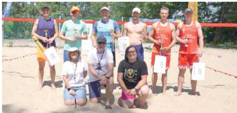
Najlepsi siatkarze na wspólnym zdjęciu

W miniony weekend Marina Puławy po raz kolejny stała się areną sportowych zmagania - odbył się tam drugi w tym roku turniej siatkówki plażowej. Do rywalizacji na piasku stanęło aż 18 par zawodników, które podzielono na dwie kategorie: U-18 oraz open.