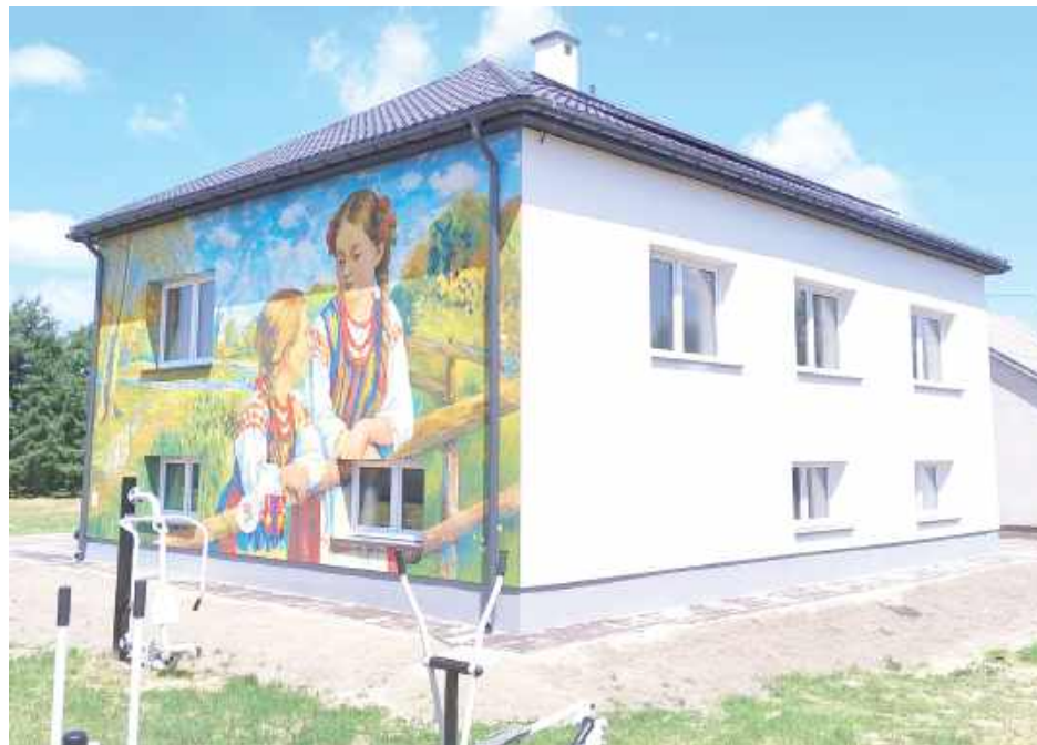
Z zewnątrz budynek świetlicy zdobi efektowny mural

Realizacja projektu nie byłaby możliwa bez wsparcia finansowego. Środki na modernizację udało się pozyskać z Krajowego Planu Odbudowy (KPO), co znacząco przyspieszyło i ułatwiło przeprowadzenie ambitnej inwestycji. Dzięki zaangażowaniu lokalnego samorządu i skutecznemu sięganiu po zewnętrzne fundusze, Borowa zyskała