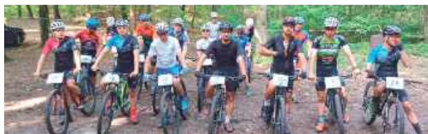
Będzie się działo. Pierwsze zmagania już 19 lipca

Organizatorem wydarzenia jest Puławskie Towarzystwo Krzewienia Kultury Fizycznej, które zaplanowało co najmniej trzy edycje wyścigu: 19 lipca, 23 sierpnia oraz 13 września. Nie wykluczone, że odbędzie się także czwarta runda na początku października. Wszystko zależy jednak od dostępnych środków finansowych.