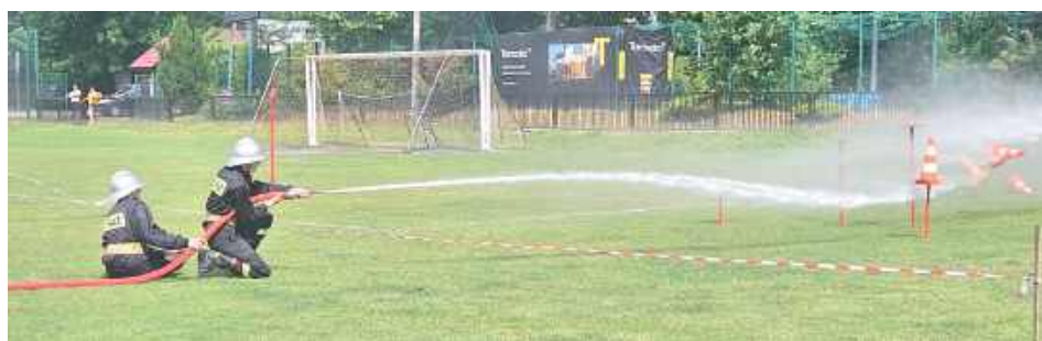
Zadaniem druhow było wycelowanie strumieniem wody w pachołki i strącenie ich w jak najkrótszym czasie

W strugach lejącego się z nieba lipcowego żaru, w pełnym umundowaniu i z determinacją godną prawdziwych bohaterów, druhowie z siedmiu jednostek OSP z gmin Nałęczów i Wąwolnica stanęli do sportowej rywalizacji. Międzygminne Zawody Sportowo-Pożarnicze, które odbyły się w niedzielę 6 lipca, okazały się nie tylko sprawdzianem sprawności, ale i widowiskiem pełnym emocji, pasji i strażackiej solidarności.