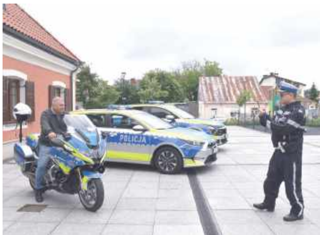
W czasie trwania wydarzenia mieszkańcy mogli z bliska obejrzeć sprzęt, jaki w codziennej pracy wykorzystują policjanci. Nie zabrakło chętnych do fotografowania się z policyjnymi pojazdami