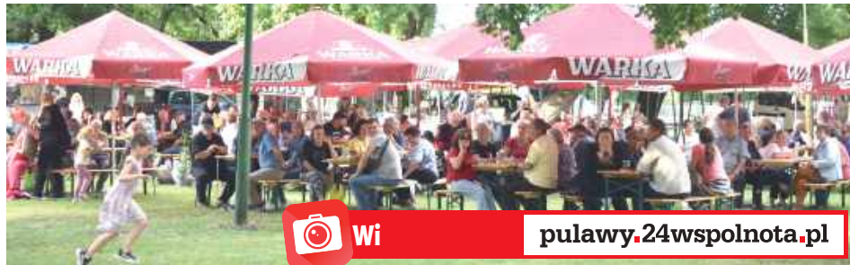
Na miejscu można było wrzucić coś na ząb, usiąść i przy piwie porozmawiać ze znajomymi

I tak w sobotnie popołudnie na placu wystawowym LODR przy ul. Pożowskiej swoje stoiska rozłożyli producenci kwiatów i roślin ozdobnych. Można było na spokojnie obejrzeć przywiezione na kiermasz okazy, wypytać o sposób uprawy. Nie zawieli także rękodzielnicy, którzy oferowali wiele ciekawych