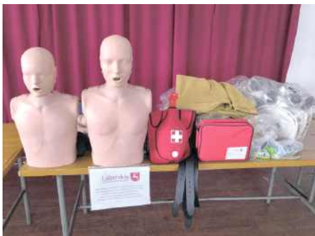
Nowy sprzęt zakupiony dzięki dotacji z urzędu marszałkowskiego pomoże w szkoleniu młodych druhow

Jednostka Ochotniczej Straży Pożarnej z Bronowic w Gminie Puławy, jak wiele drużyn z całego województwa zawnioskowała o dotację z programu realizowanego przez Urząd Marszałkowski Województwa Lubelskiego „Lubelskie wspiera Młodzieżowe Drużyny Pożarnicze”. Druhowie pozyskali w ten sposób 10 tys. zł na doposażenie młodych adeptów sztuki strażackiej. Dzięki temu