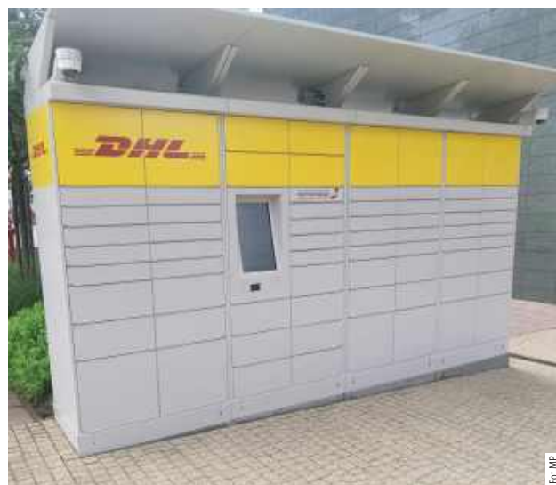
W Puławach paczkomatów przybywa, jak grzybów po deszczu. Ostatnio sporych rozmiarów urządzenie stanęło przy Galerii Zielonej od strony ul. Lubelskiej