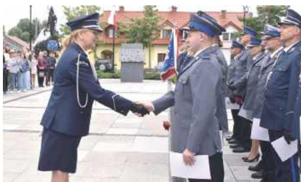
Uroczystości w Końskowoli były okazją do wręczenia wyróżnień i awansów policjantom z puławskiego garnizonu

Były podziękowania za służbę od kierownictwa policji wojewódzkiej i władz powiatu oraz awanse i wyróżnienia. Tak policjanci z Komendy Powiatowej Policji w Puławach uczcili doroczne Święto Policji, a także 100. rocznicę służby kobiet w tej formacji.