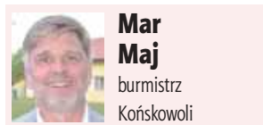
Mar Maj burmistrz Końskowoli

Dlaczego w tym roku Święto Róż trwa dwa dni? Pojawili się bowiem głosy mieszkańców, którzy twierdzili, że sobota jest lepszym dniem na festyn, bo dzięki temu mają więcej czasu na regenerację i celebrowanie tego święta. Stąd pomysł na przeniesienie części rozrywkowej na sobotę, a pozostawienie części oficjalnej na niedzielę