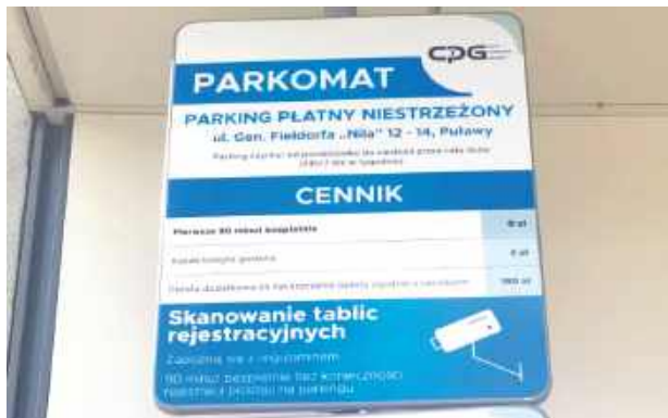
Tablice na parkingu przy Biedronce, Media Expert i Pepco przy ul. Fieldorfa-Niła już nie są zasłonięte i informują o opłacie za parkowanie. Za darmo można zostawić tu auto jedynie na 1,5 godziny - o pół godziny krócej, niż pod Galerią Zieloną i Kauflandem

Dzisiaj wiadomo, że podobnie, jak na pobliskich parkinгах przy Galerii Zielonej i Kauflandzie, za darmo będzie można tu zostawić auto, tylko na określony czas. Ale jak wynika z informacji na umieszczonej na terenie parkingu tablicy - krótszy, niż we wspomnianych miejscach. Tam klient parkuje za darmo przez 2 godziny.