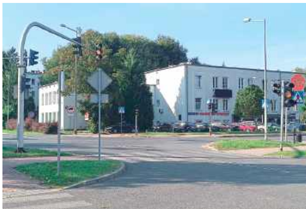
Pulsująca pomarańczowym światłem, albo nie działająca w ogóle sygnalizacja to częsty widok zwłaszcza na ul. Lubelskiej i Partyzantów w Puławach

Szczególnie dużo awarii miało miejsce w ubiegłym roku. Niejednokrotnie bywało i tak, że światła nie działały w kilku miejscach naraz, np. na skrzyżowaniu ul. Lubelskiej z Sikorskiego oraz Lubelskiej i Grota-Róweckiego, znajdujących się w rejonie Szkoły Podstawowej nr 11 i ZSO nr 1. Często awarie dotyczyły również sygnalizację na skrzyżowaniu A. Partyzantów