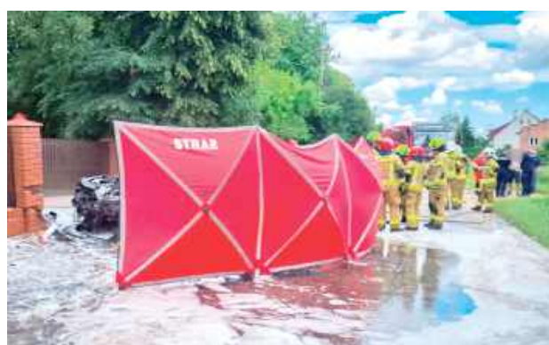
53-latką z powiatu puławskiego zginęła na miejscu. Decyzją prokuratora ciało kobiety zostało przewiezione na sekcję

Na miejsce zadysponowano nawet śmigłowiec Lotniczego Pogotowia Ratunkowego z Lublina, ale ostatecznie maszynę zawrócono. Mimo natychmiast podjętej akcji gaśniczej i ratunkowej oraz wysiłku nie zakończyła się ona sukcesem. Kierująca Renault kobieta nie przeżyła. To 53-letnia mieszkanka powiatu puławskiego.