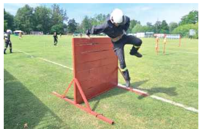
Rywalizacja wymagała od zawodników nie lada sprytu

Jak podkreślali organizatorzy, zawody były nie tylko sprawdzianem sprawności operacyjnej, ale także okazją do integra-