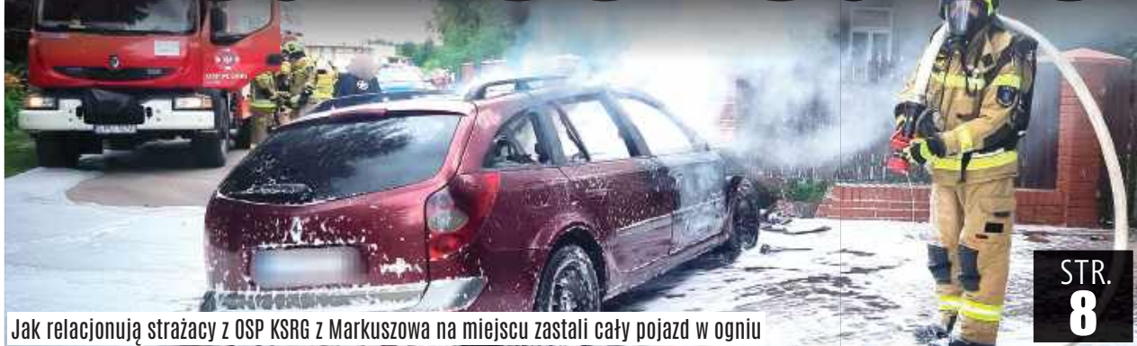
Jak relacjonują strażacy z OSP KSRG z Markuszowa na miejscu zastali cały pojazd w ogniu