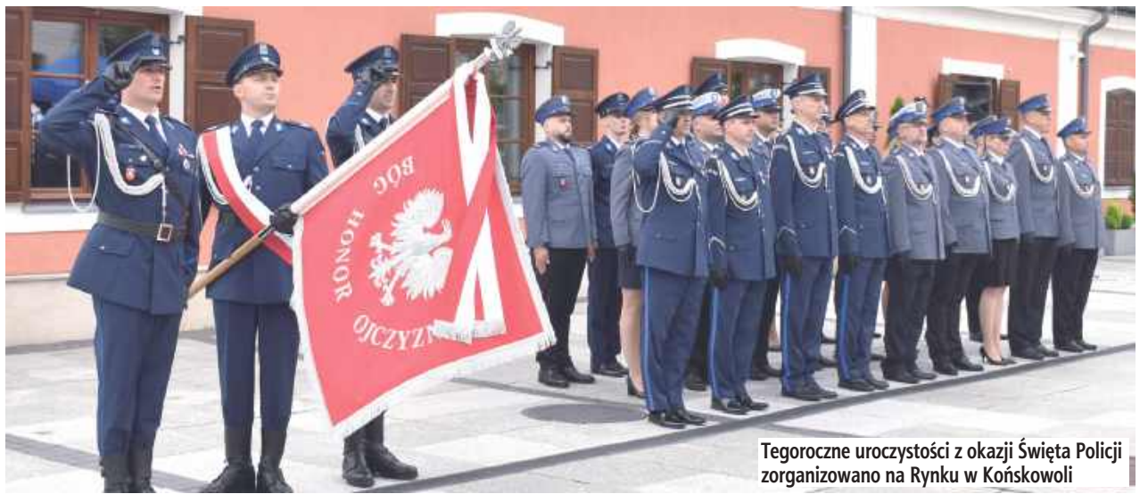
Tegoroczne uroczystości z okazji Święta Policji zorganizowano na Rynku w Końskowoli