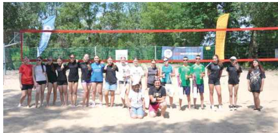
Do rywalizacji na piasku stanęło aż 18 par zawodników, które podzielono na dwie kategorie: U-18 oraz open

Organizatorzy - Miejski Ośrodek Sportu i Rekreacji w Puławach, Ognisko TKKF Chemik oraz Miasto Puławy - zadba