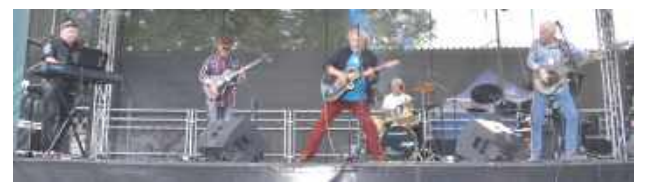
Dla mieszkańców Końskowoli i okolic zagrał m.in. zespół Wawele