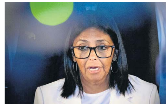
– Wenezuela nie jest kolonią, lecz wolnym krajem – powiedziała p.o. prezydenta Delcy Rodriguez

Rodriguez przemawiała w Międzynarodowym Trybunale Sprawiedliwości (MTS) w Hadze, gdzie toczy się postępowanie w sprawie sporu granicznego pomiędzy Wenezuelą a Gujaną o region Esequibo. U wybrzeży tego regionu, kontrolowanego przez Gujanę, odkryto w ostatnich latach bogate złoża ropy naftowej, a Wenezuela rości sobie do niego pretensje.