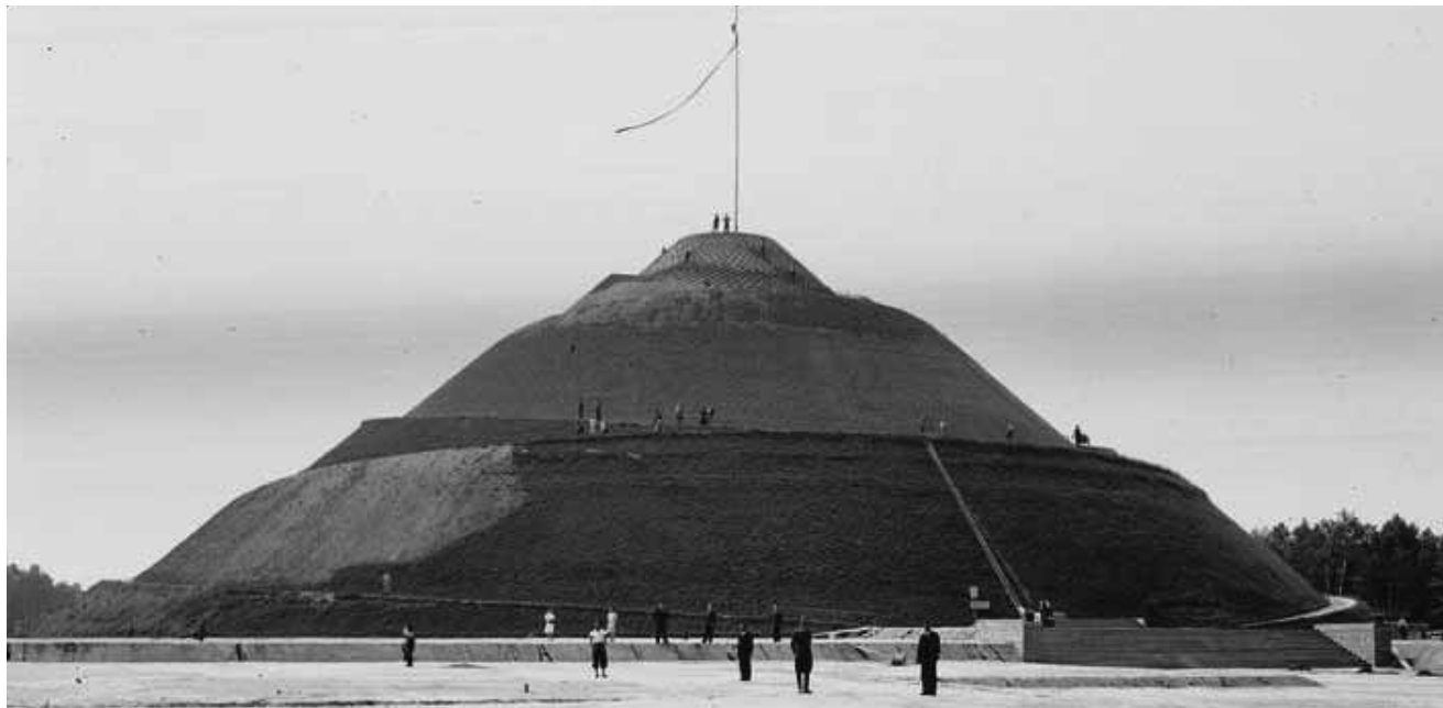
Po śmierci marszałka Józefa Piłsudskiego postanowiono kopiec nazwać jego imieniem. Sypanie zakończono 9 lipca 1937 r.

Uwielbienie piłsudczyków dla swego wodza nie narodziło się jednak nagle – Piłsudskiego mitologizowano już od czasów wojny z bolszewikami w 1920 r. W 1923 r. utworzono Instytut Badań Najnowszej Historii Polski, którego pierwszym prezesem został Leon Wasilewski, uważany w kręgu zaufanych Marszałka za „architekta polskiej polityki wschodniej”. Za podstawę działalności Instytutu uznano tworzenie archiwum, aby zgromadzić w nim wszystkie materiały źródłowe dotyczące okresu walk o niepodległość.