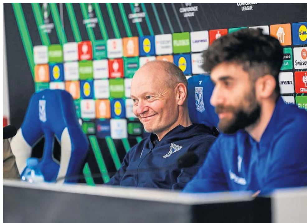
Tych dwóch dżentelmenów zobaczymy też przy Bułgarskiej w przyszłym sezonie. Nowe kontrakty są już przygotowane

Te decyzje świadczą o tym, że władze Kolejorza chcą kontynuować swój projekt pod kierownictwem Duńczyka i liczą, że największa gwiazda zespołu, także od wiosny przyszłego sezonu będzie czarowała na boiskach naszej ekstraklasy.