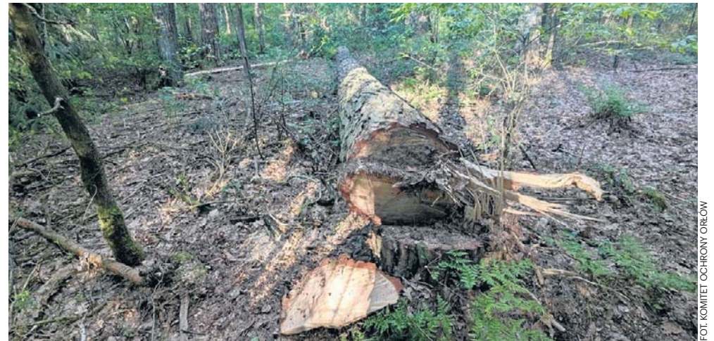
Ścięto drzewo z gniazdem bielików. Sprawa wyszła na jaw w trakcie kontroli

- Długo szukaliśmy i nie mogliśmy odnaleźć gniazda i nie słyszeliśmy charakterystycznych głosów dorosłych. Nagle,