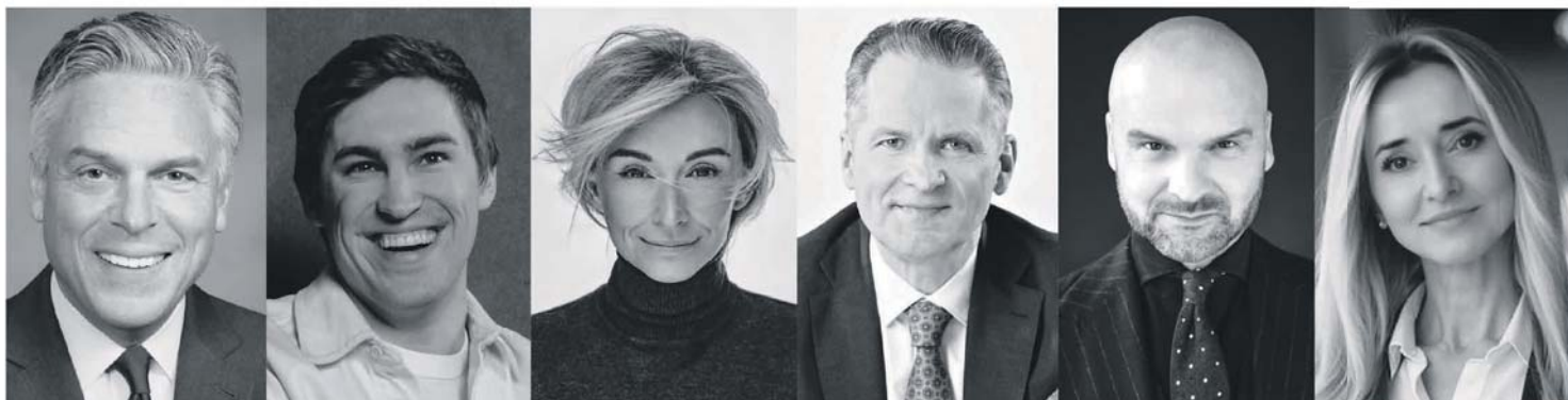
JON HUNTSMAN Mastercard