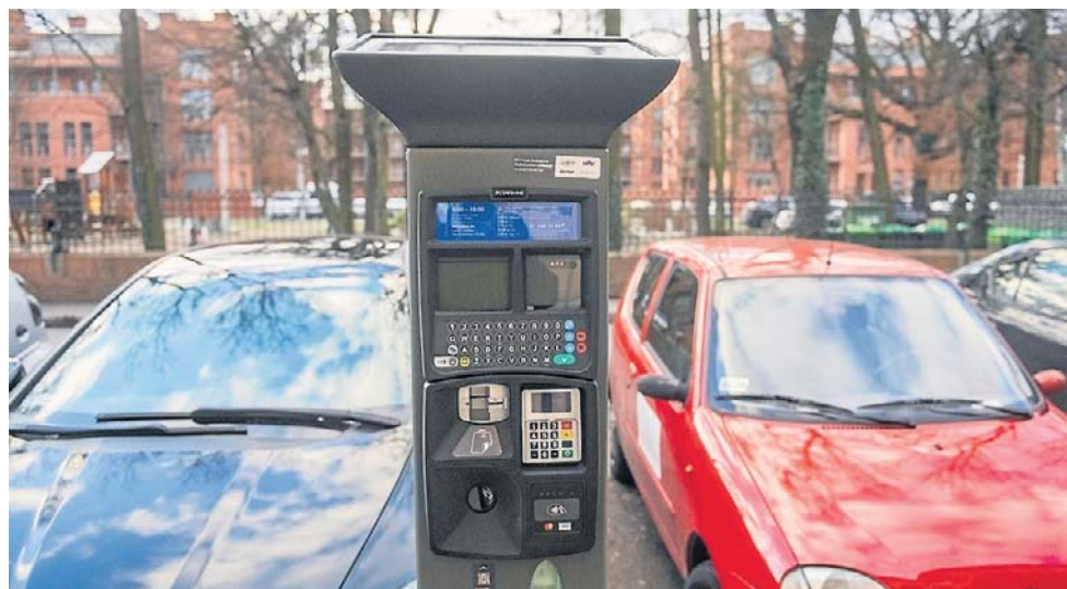
Rada Miasta Poznania przyjęła projekt uchwały, który wydłuża czas na opłatę kary za nielegalne parkowanie z 14 do 30 dni. Ma to zakończyć parkingowe kuriozum

Bohaterowie naszych tekstów, dowiedzieli się o karze do-