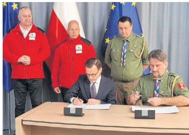
Wojewoda podlaski Jacek Brzozowski podpisał umowę z ZHP i WOPR

- ZHP ma 100 lat doświadczenia w działaniach na rzecz wszystkich wokół nas. Jesteśmy sprawni w wielu obszarach, co udowodniliśmy, organizując wolontariat na rzecz