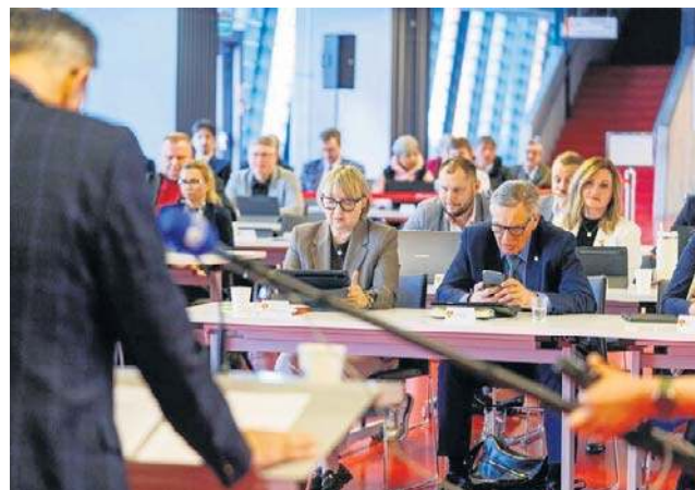
Marcowa sesja białostockiej rady miejskiej odbyła się wczoraj

Radni podczas wczorajszej sesji podzielili też dotacje na zabytki. Wsparcie otrzymają Archidiecezja Białostocka (40