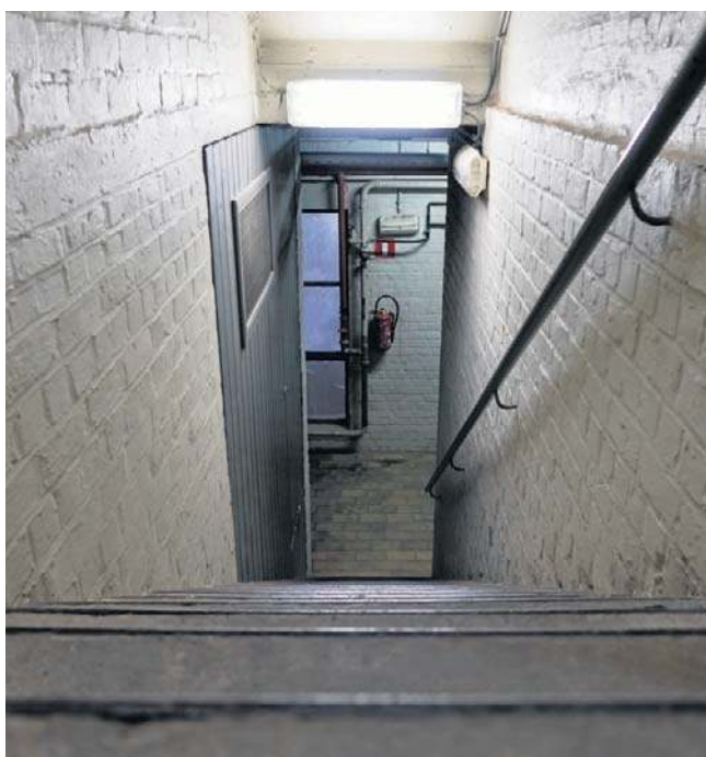
Schron schronowi nierówny. Firmy z branży podpowiadają, na co zwracać uwagę przy takich inwestycjach

I podpowiada, że jeżeli ktoś nie ma miejsca na wybudowa-