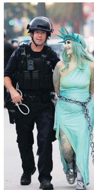
Policja aresztowała protestującą kobietę przebraną za Statuę Wolności po sobotnim wiecu „No Kings”

Organizatorzy protestów „No Kings” twierdzą, że w 50 amerykańskich stanach na ich manifestacjach pojawiły się „miliony osób”. Uczestnicy sprzeciwiali się polityce administracji Donalda Trumpa oraz temu, w jakim kierunku zmierzają Stany Zjednoczone.