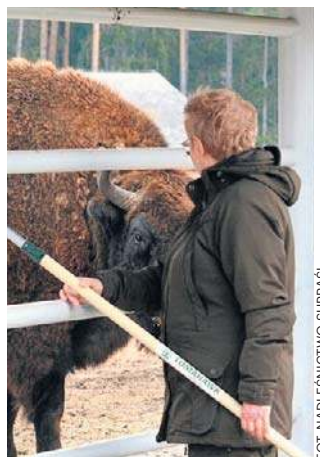
Szczepionka ma uodpornić żubry na chorobę niebieskiego języka

- Z dzidą na żubra? Bywa i tak... Przed kilkoma dniami przeprowadziliśmy trudną operację zaszczepienia żubrów w zagrodzie pokazowej. Szczepionka ma je uodpornić na chorobę niebieskiego ję-