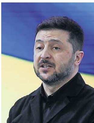
Zelenski popiera rozejm na czas Wielkanocy

- My popieraliśmy wszystkie formaty zakończenia wojny, jednak pod warunkiem, że nie tracisz godności i niepodległości naszego państwa. (...) I gotowi jesteśmy do wstrzymania ognia na święta wielkanocne - powiedział w czacie z dziennikarzami. - Gotowi jesteśmy do jakichkolwiek kompromisów, prócz kompromisów, które (...) dotyczyłyby naszej godności i suwerenności - dodał Zelenski w drodze powrotnej z krajów Bliskiego Wschodu.