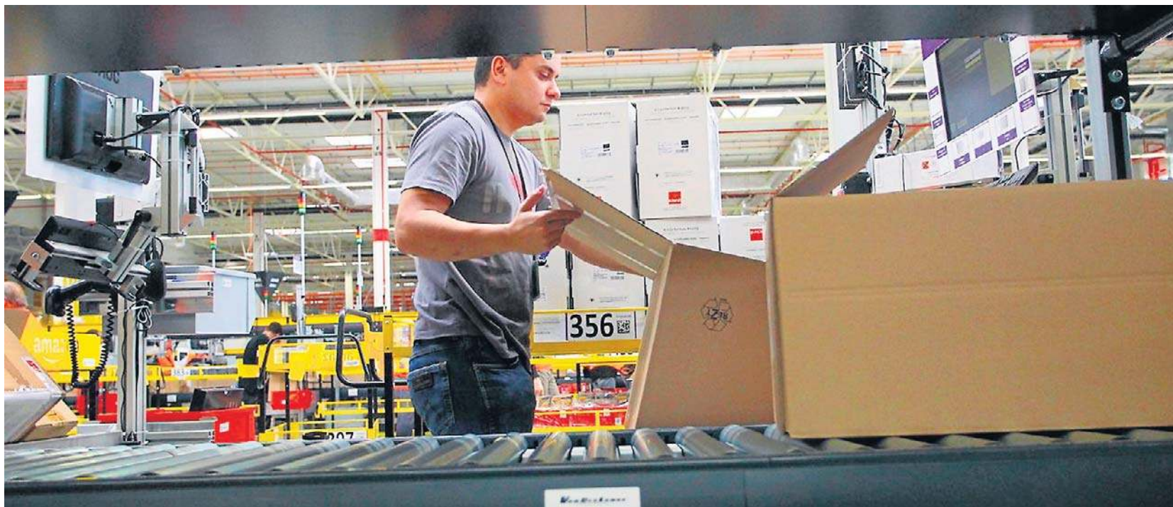
Reforma PIP oznacza duże zmiany na całym polskim rynku pracy

W obowiązującym stanie prawnym inspektor, stwierdzając, że dana osoba wykonuje pracę w warunkach właściwych dla stosunku pracy, mógł jedynie wystąpić do sądu z odpowiednim powództwem