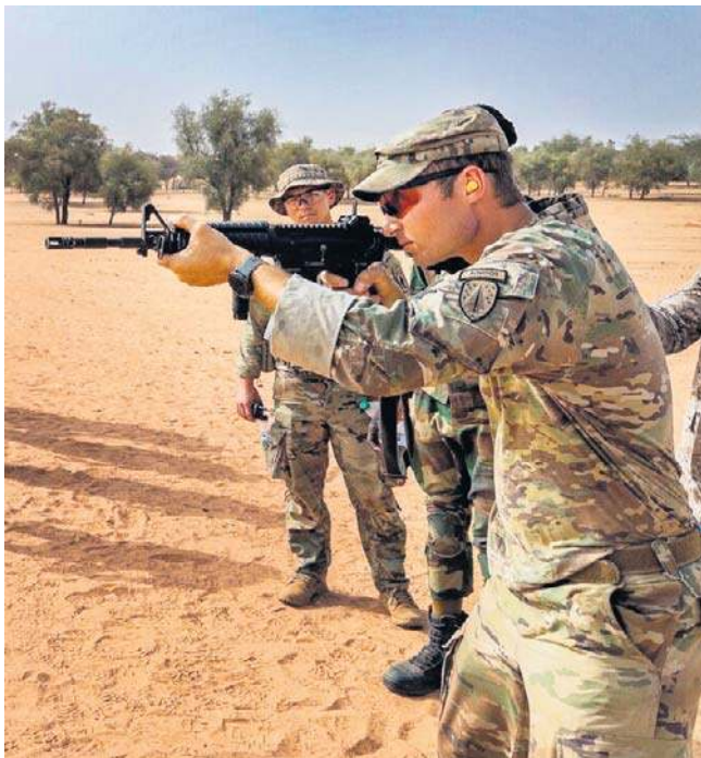
Amerykańscy żołnierze regularnie prowadzą ćwiczenia i operacje wojskowe w Afryce

Jak realne jest zagrożenie na kontynencie afrykańskim? Zapytany przez portal The Africa Report, Departament Stanu USA odmówił podania szczegółów dotyczących „konkretnych środków bezpieczeństwa”, stwierdzając jedynie, że „nieustannie ocenia zagrożenia” i „w razie potrzeby nie-