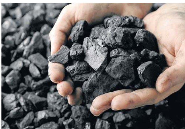
Wszystkie opowieści o tzw. polskim węglu trzeba wziąć w nawias, bo dziś nie ma już dostępnego i taniego węgla

Gdybyśmy mieli dalej iść w tak wysokie ceny, jak w ostatniej aukcji, to nie warto tego robić. Cena offshore zbliża się do ceny elektrowni jądrowej. Jeśli mam porównać te dwie technologie, to wybiorę źródło dyspozycyjne, a nie źródło,