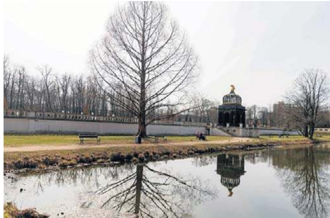
Jednym z Pomników Przyrody została metasekwoja chińska rosnąca w Ogrodzie Dolnym Parku Branickich

Koszty utrzymania i pielęgnacji Pomników Przyrody ponosić ma gmina Białystok. Drzewa, na których pojawi się oznaczenie w postaci tabliczki, nie mogą być niszczone. Zakaz dotyczy też uszkodzania i zanieczyszczania gleby czy dokonywania zmian stosunków wodnych, jeżeli zmiany te nie służą np. ochronie przyrody. Drzewa mają być pod stałym monitoringiem stanu zdrowotnego, a w razie potrzeby wykonane muszą być odpowiednie zabiegi pielęgnacyjne i zabezpieczające.