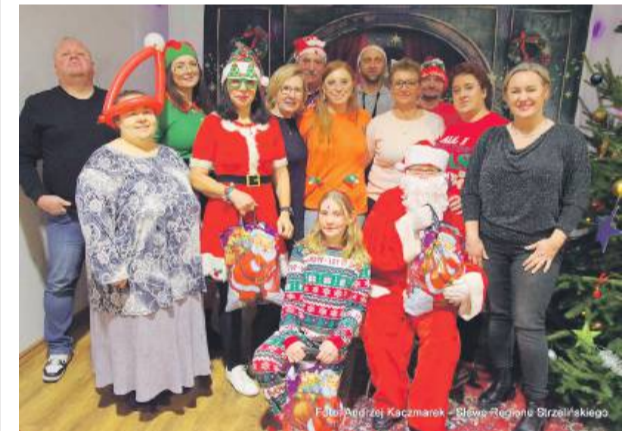
Pamiątkowe zdjęcie organizatorów wydarzenia