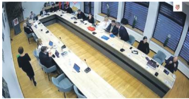
Listopadowa sesja Rady Powiatu Strzelińskiego

Na koniec przyjęto autopoprawkę w sprawie wieloletniej prognozy finansowej.