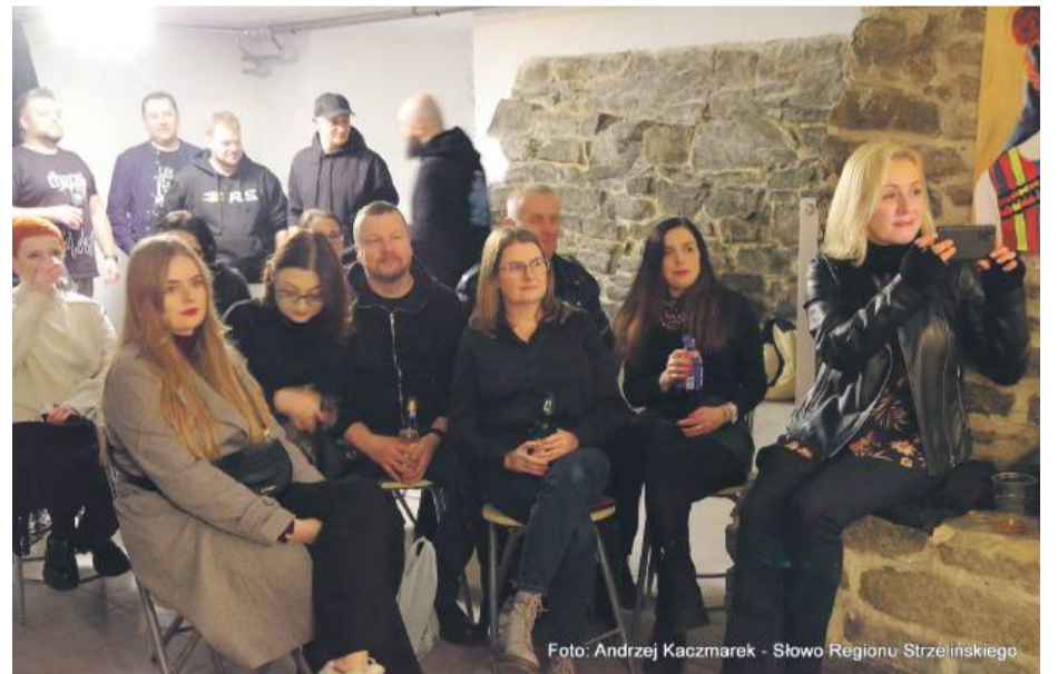
Widownia w „Dziupli” nagradzała brawami kolejnych muzyków. Do podziemi co chwilę przychodzili nowi ludzie