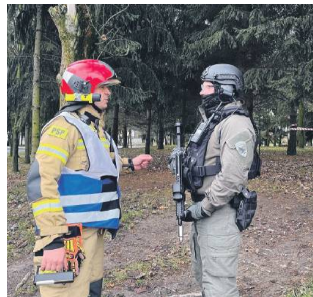
Szczególne znaczenie podczas ćwiczeń miała współpraca między funkcjonariuszami różnych służb, co pozwala na sprawne i skoordynowane działanie w sytuacjach kryzysowych.