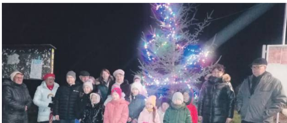
Po Mszy św. w miejscowym kościele, w towarzystwie księdza i licznie zgromadzonych mieszkańców, zorganizowano na placu pełną emocji ceremonię.

Dzięki inicjatywie pani sołtys i wsparciu mieszkańców plac w centrum wsi stał się prawdziwym sercem bożonarodzeniowych przygotowań. WOC