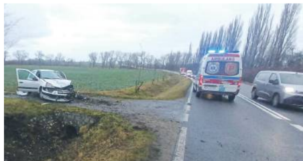
4 grudnia na drodze Strzelin – Wrocław, za zjazdem na Szczawin, doszło do wypadku, w wyniku którego dachował samochód.