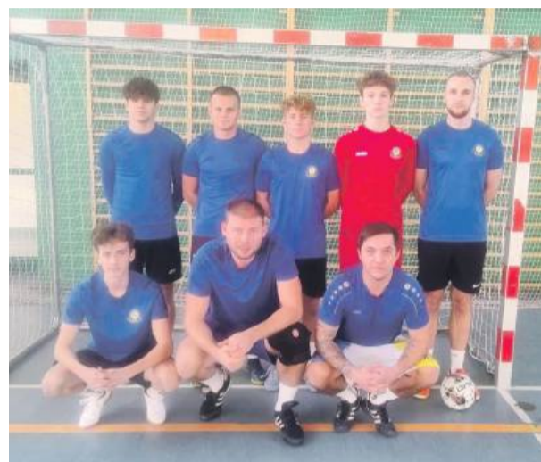
Piłkarze Strzelinianki wygrali drugi pojedynek