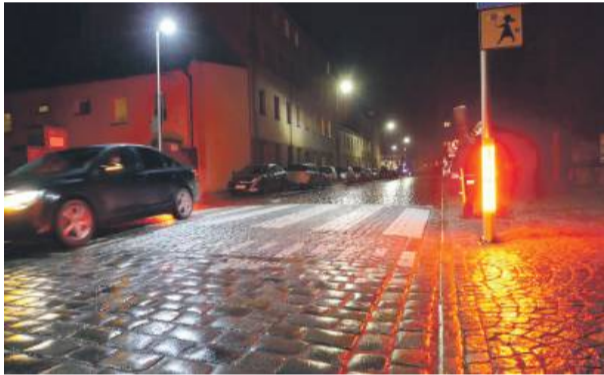
Rodzice dowożący uczniów niszczą system ostrzegania przy strzelińskim liceum - FOTO JUTRO DO PODMIANY!!!