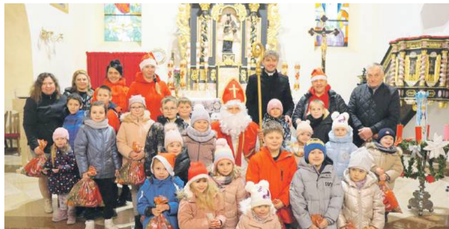
Święty Mikołaj już tradycyjnie pamiętał o dzieciach z Zielenic i Uniszowa