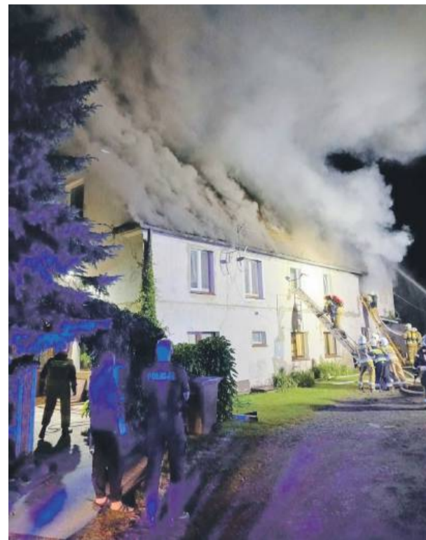
Pożar, który wybuchł w budynku w Podgaju, spowodował ogromne szkody