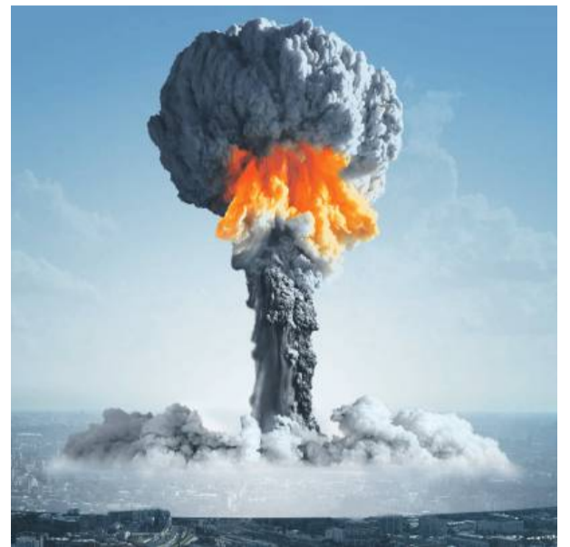
Większość Polaków obawia się wojny atomowej.

– Tylko osoba niemądra nie obawiałaby się