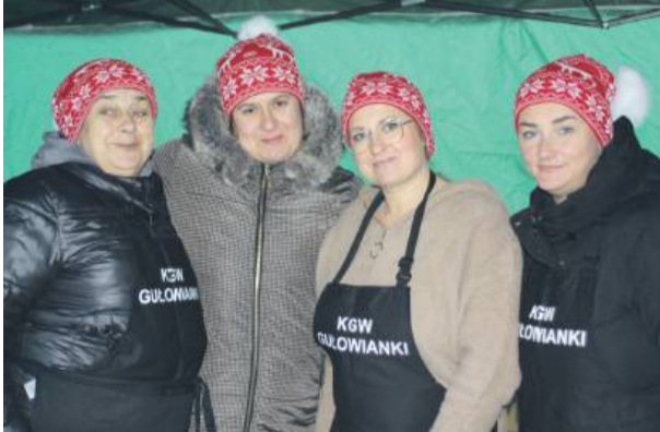
Na jarmarku były stoiska kół gospodyń wiejskich z całego powiatu strzelińskiego

różne stanowiska lokalnych wystawców oraz kół gospodyń wiejskich z terenu powiatu strzelińskiego, na których można było znaleźć ręcznie robione ozdoby, unikalne prezenty i lokalne przysmaki. Namioty gastronomiczne cieszyły się du-