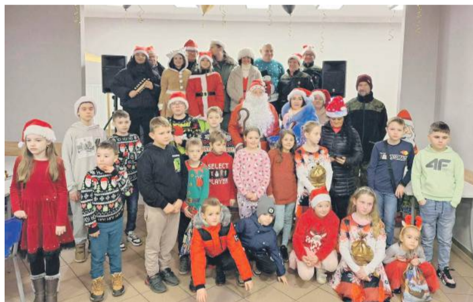
Pamiątkowe zdjęcie ze św. Mikołajem.