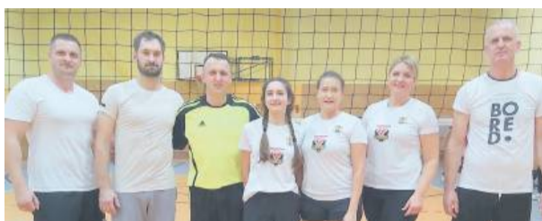
Drużyna Przyjaciół Siatkówki

okazała się lepsza od Vamoss Select. Spotkanie trwało aż pięć setów. Przegrana Vamoss była dużą niespodzianką, ponieważ ten zespół wymieniany był jako kandydat do mistrzowskiego tytułu. W górę ligowej tabeli pnie się klub UKS Sunrise, który bez straty seta zakończył rywalizację z młodymi graczami Tygrysów Strzelin. Ligową tabelę