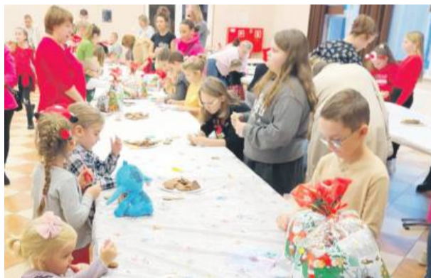
Pierniczkowe szaleństwo w Borku Strzelińskim.