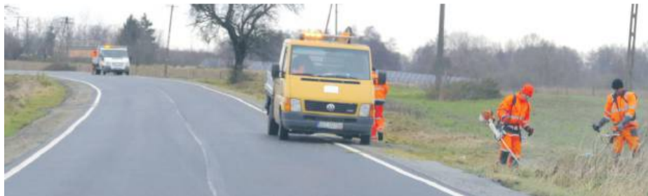
Grudniowa troska o zielen: drogowcy z PZD udowadniają, że na estetykę nigdy nie jest za wcześnie, ani za późno...