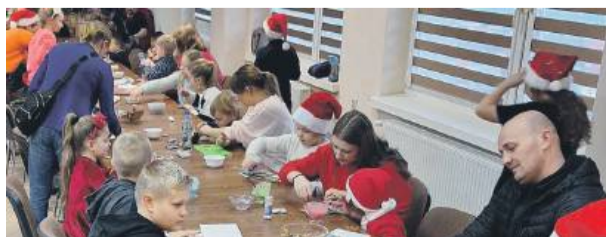
Młodszy i starsi mieszkańcy Borowa przy wspólnym stole pełnym pierniczek.