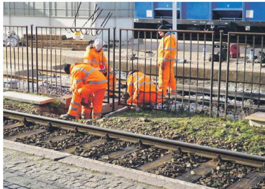
Na dworcu w Strzelinie trwają ostatnie prace wykończeniowe