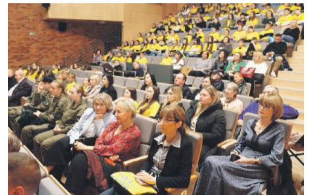
W uroczystości uczestniczyli m.in. uczniowie szkół i wychowankowie placówek przedszkolnych, samorządowcy oraz przyjaciele stowarzyszenia.

wolontariuszom za ofiarność i wielkie serce. Szefowa gminy złożyła też życzenia z okazji nadchodzącego Międzynarodowego Dnia Wolontariusza. W uroczystości uczestniczyli m.in. uczniowie szkół i wychowankowie placówek przedszkolnych, samorządowcy oraz przyjaciele stowarzyszenia. Podczas wydarzenia