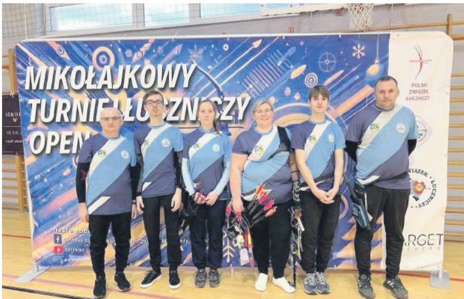
Reprezentanci strzeleńskiej sekcji Granit podczas mikołajkowych zawodów