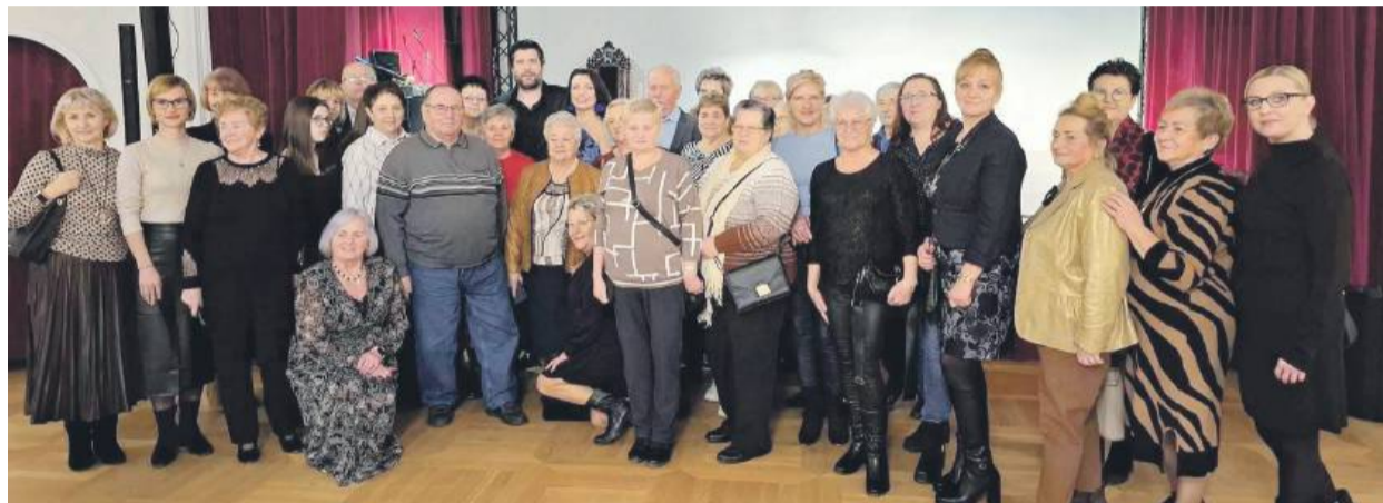
Publiczność Mikołajkowego Koncertu Operowego w Pałacu Sulisław wraz z artystami – wieczór pełen wzruszeń i muzycznych emocji.

Likwidatorzy Spółdzielczej Grupy Producentka Ziarna Zbóż i Roślin Oleistych w likwidacji z siedzibą w Strzelinie 57-100 ul. OGRODOWA, nr 21 (KRS: 0000355237), informuje że na podstawie Uchwały Nr 8/2024 Walnego Zgromadzenia z dnia 19.06.2024 r. oraz Uchwały Nr 4/2024 Walnego Zgromadzenia z dnia 30.09.2024 r. Spółdzielcza Grupa Producentka Ziarna Zbóż i Roślin Oleistych została postawiona w stan likwidacji z dniem 30 września 2024 r.