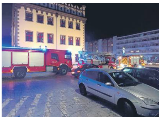
Akcja straży w rynku