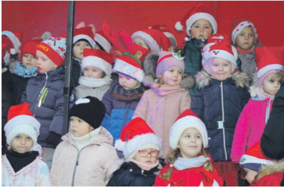
Najmłodszy zaśpiewali świąteczne piosenki

Mieszkańcy mogli wysłuchać świątecznego koncertu zespołu HEAVEN, a po nim odbył się pokaz fajerwerków. Jedną z dodatkowych atrakcji była możliwość wejścia na wieżę ratuszową oraz obejrzenia wystawy