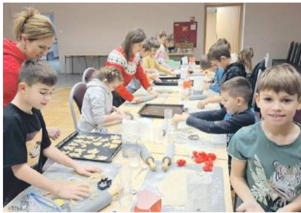
Mali cukiernicy przy pracy – warsztaty pieczenia pierników w Gminnym Ośrodku Kultury.

Popołudniu odbyła się druga tura warsztatów, pod-