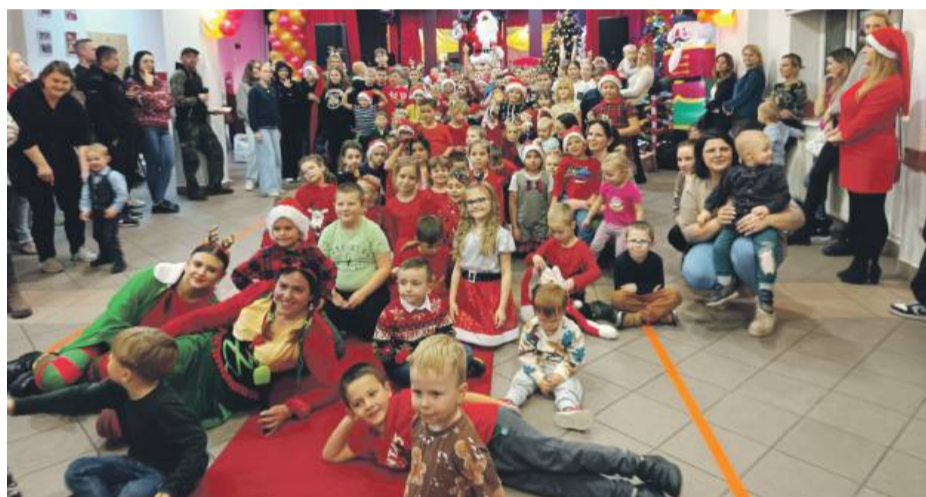
Uczestników imprezy mikołajkowej w GOK-u w Kondratowicach było tylu, że zrobienie grupowego zdjęcia okazało się nie lada wyzwaniem.