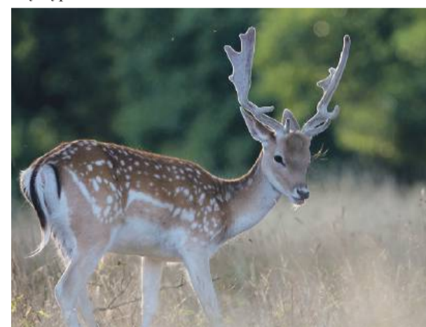
Daniela można poznać między innymi po nakrapianym umaszczeniu