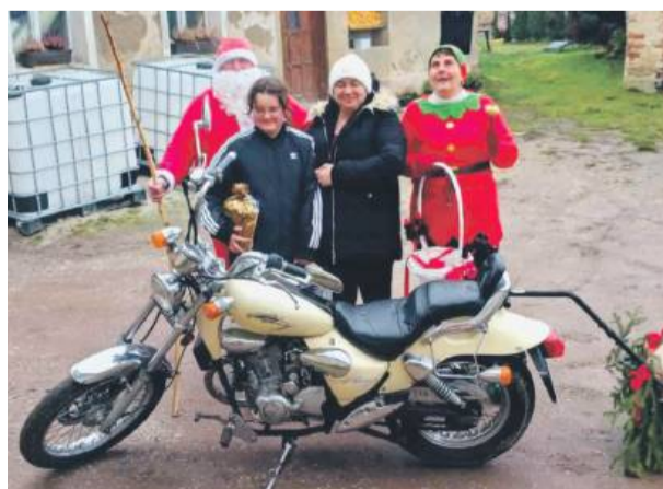
Święty Mikołaj przyjechał do Cierpic na motocyklu.