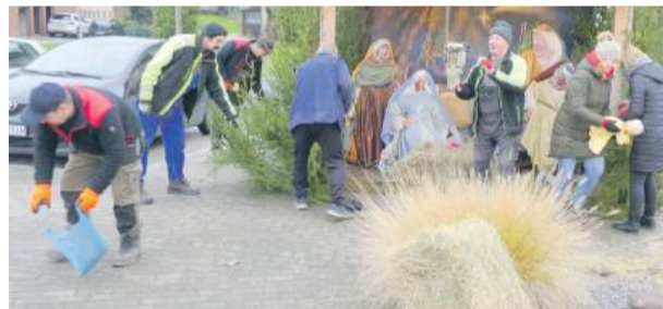
Dzięki współpracy pracowników GOK-u i ZUK-u w centrum Przeworna pojawiła się piękna choinka i szopka

strój. To pierwsze oznaki nadchodzących świąt, które cieszą zarówno dzieci, jak i dorosłych. WOC