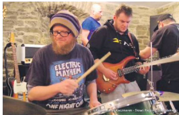
Muzycy zmieniali się co chwilę. Każdy grał niemal z każdym

Muzycy wymieniali się pojedynczo po zagranium jednego lub dwóch utworów. Ktoś brał gitarę, ktoś siadał za perkusją, jeszcze