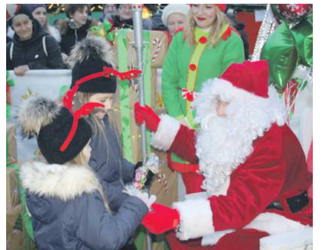
Na jarmark przybył św. Mikołaj, który rozdawał dzieciom prezenty