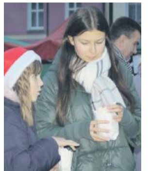
Podczas jarmarku można było posilić się prząną kukurydzą