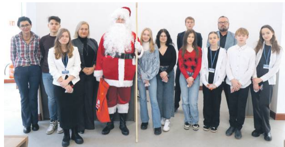
Czwartkowy burmistrz w towarzystwie Młodzieżowej Rady Gminy Strzelin i Świętego Mikołaja.

9:00, a zakończyło około 13:00. Choć to tylko kilka