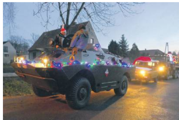
Konwój pojazdów pochodził z Muzeum Militariów i Techniki Wojskowej „Kompania Szklary”

połączyły tradycję z niecodzienną, widowiskową oprawą. WOC