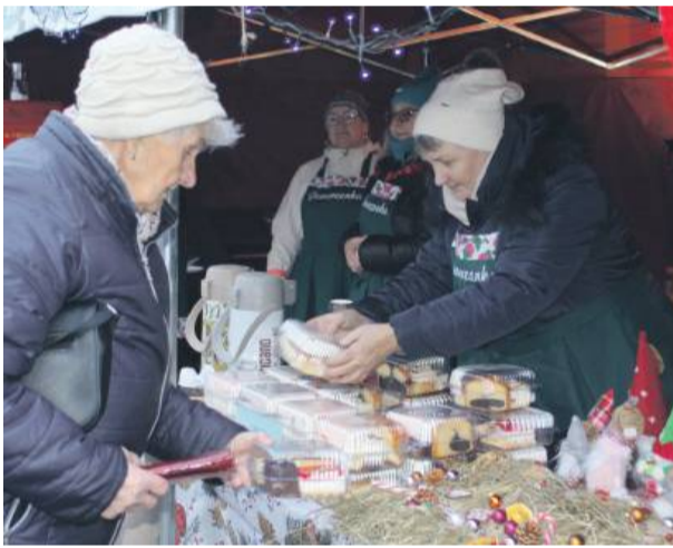
Mieszkańcy mogli kupić lokalne produkty i ozdoby świąteczne