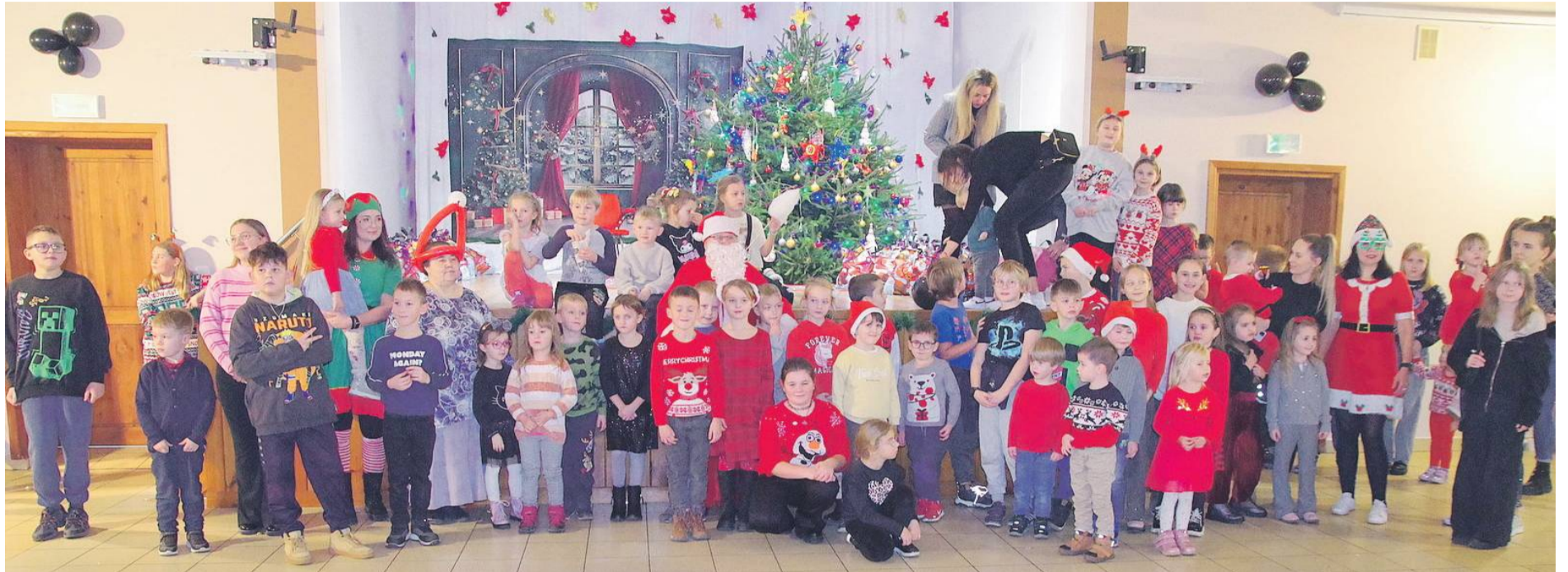
Pamiątkowa fotografia dzieci ze św. Mikołajem

ny przez wszystkich gości. Św. Mikołaj z dzwoneczkiem w rękę wszedł na scenę, zasiadł na fotelu, a usługiwały mu Śnieżynka i Elf. Dzieci ustawione w długiej kolejce podchodziły do niego, otrzymywały paczki i siadając na kolanku, robiły sobie pamięt-