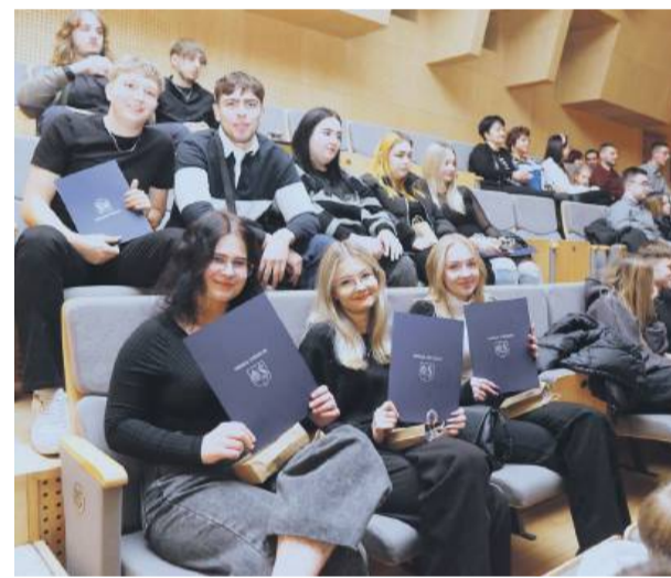
Ta chwila na długo pozostanie w pamięci najmłodszych dorosłych mieszkańców gminy Strzelin.

Jeśli Twój samochód Nie odpala? Dużo pali?