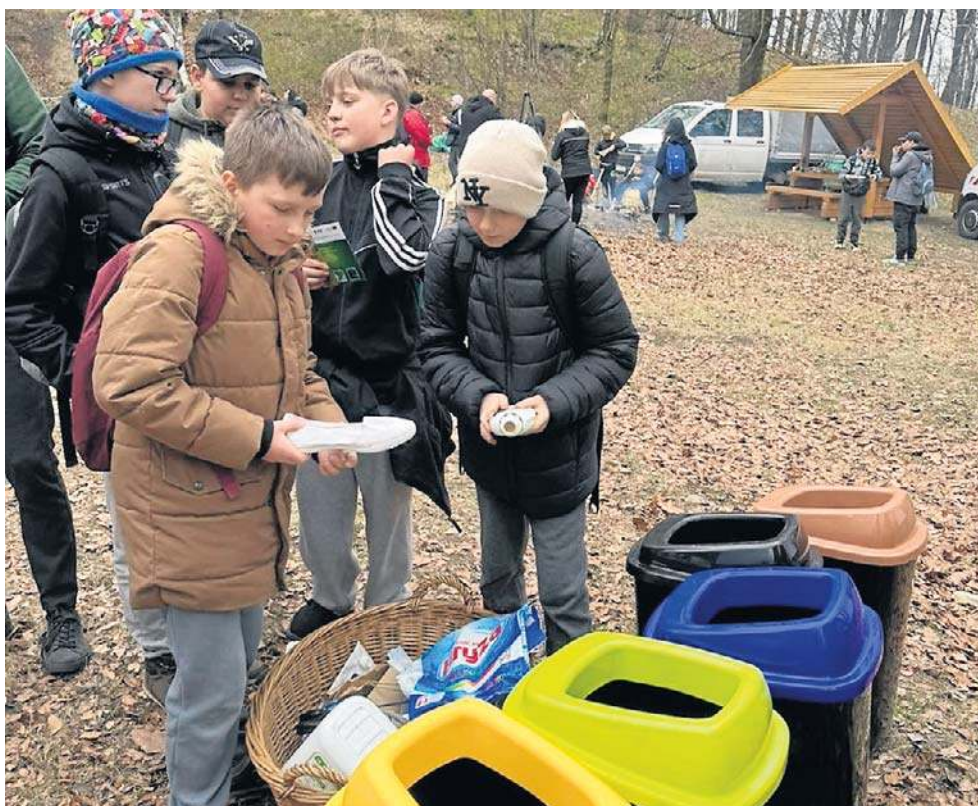
Przygotowano też strefę edukacyjną, konkursy, animacje i namioty partnerów akcji.