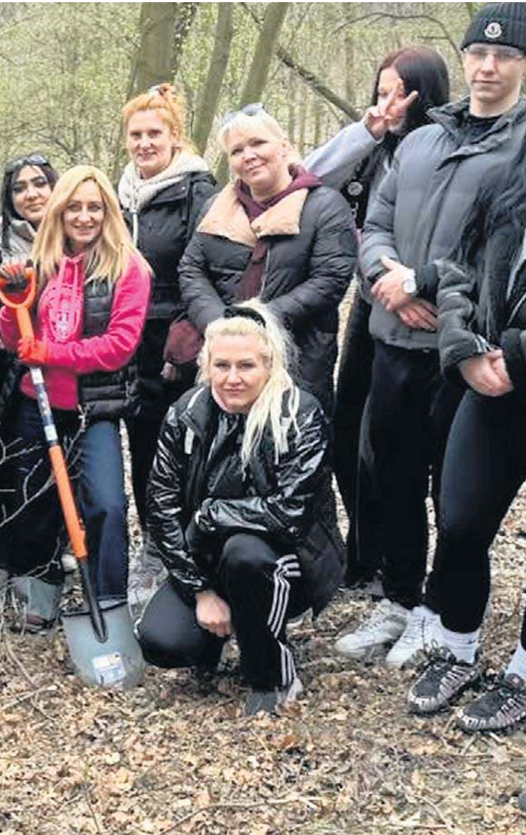
Wałbrzyska, którą 10 kwietnia zorganizowano w mieście.