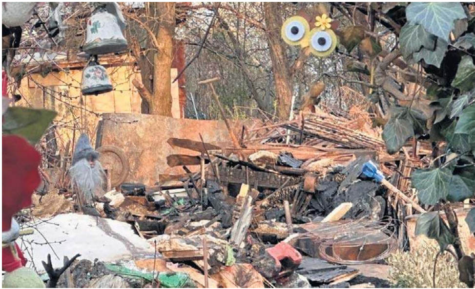
Tak wyglądają niektóre działki na ROD Podzamcze. Ich właściciele muszą je ogarnąć!