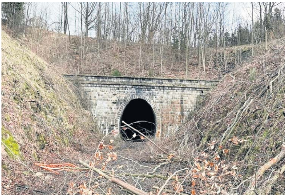
Tunel pod Przełęczą Kowarską to prawdziwy zabytek techniki. Czeka na rewitalizację.

- Obecnie jesteśmy na etapie analizy ofert i wyboru wykonawcy na rewitalizację linii kolejowych nr 308 i 345 na odcin-