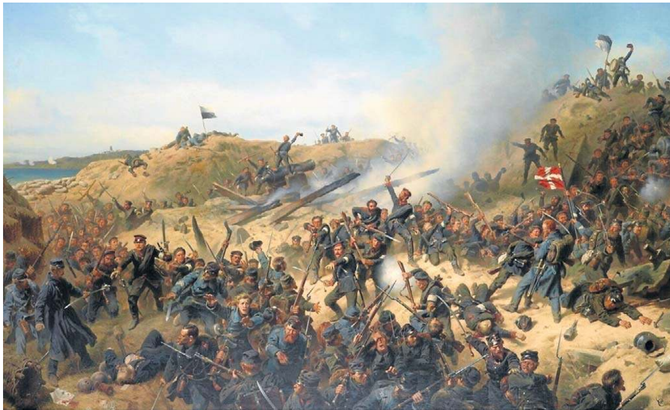
Prusacy - w tym żołnierze z Wielkopolski, Śląska i Pomorza - wdzierają się na duńskie szczyty pod Dybbøl.