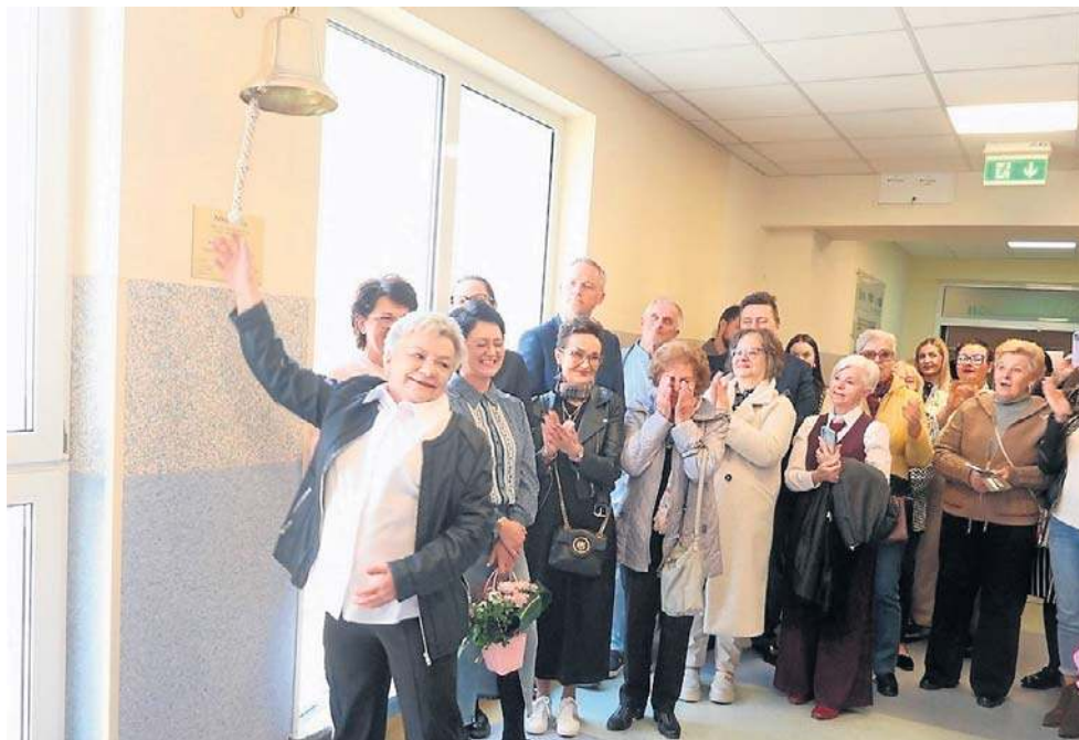
- Niech dźwięk tego dzwonu niesie nadzieję wszystkim, którzy walczą - mówią fundatorzy.

- To miejsce nie jest przypadkowe. Dzwon zawieszono przy przyszłym wejściu do budowanego właśnie nowego skrzydła szpitala, w którym będą się leczyci pacjenci onkologiczni. Poza tym tuż przy tym korytarzu mieści się Przychodnia On-