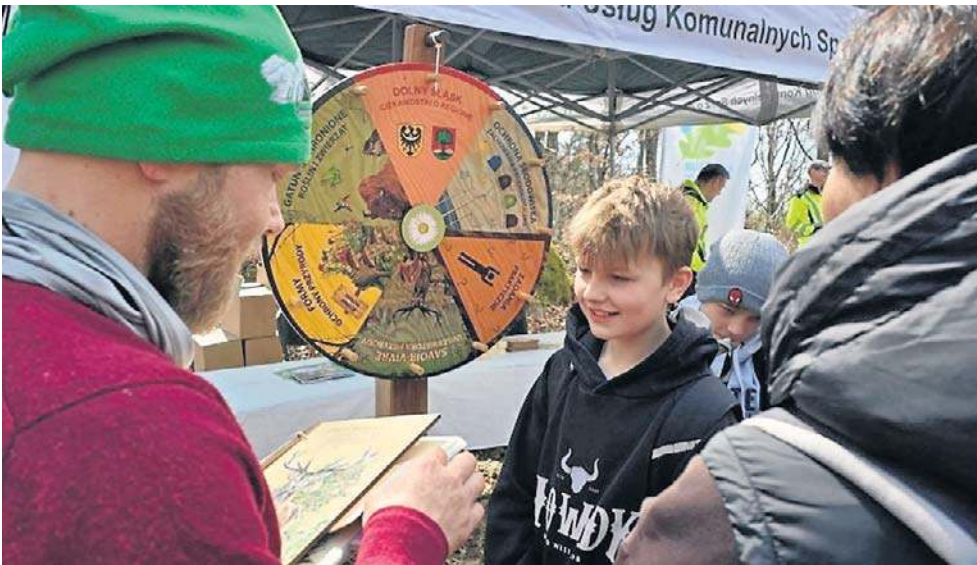
Wydarzenie odbyło się w ramach ogólnopolskiej inicjatywy „Kręci nas recykling”.