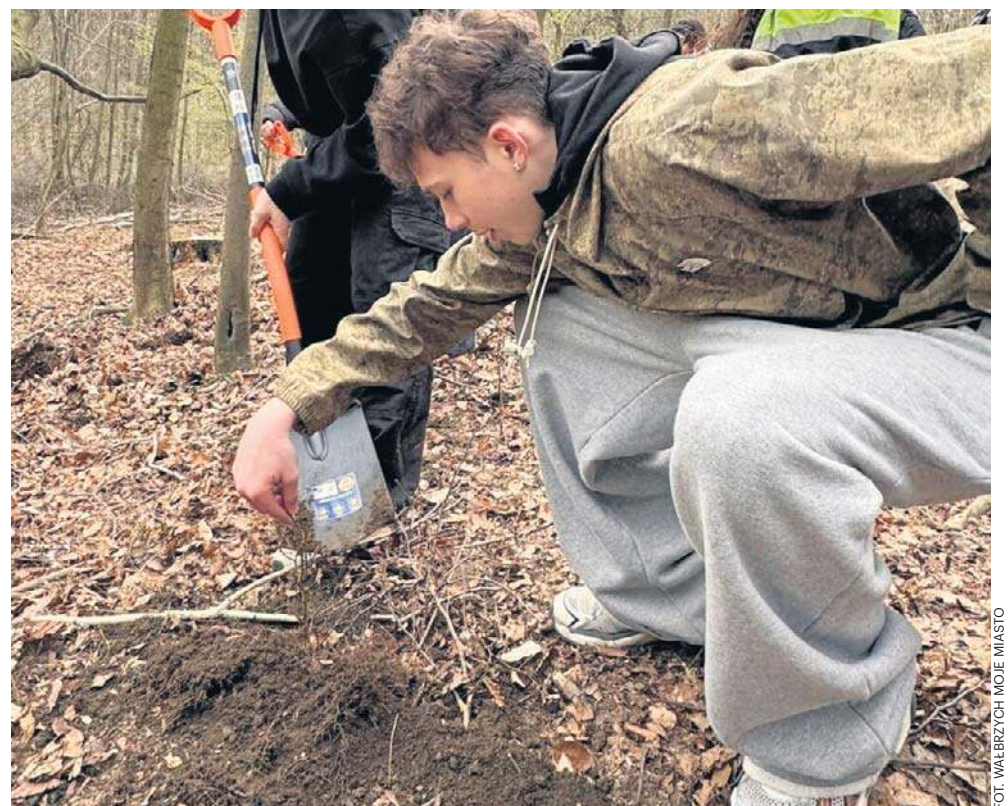
Akcja sprzątnięcia i poznawania Wałbrzyska oraz Szczawna-Zdroju odbyła się po raz ósmy.