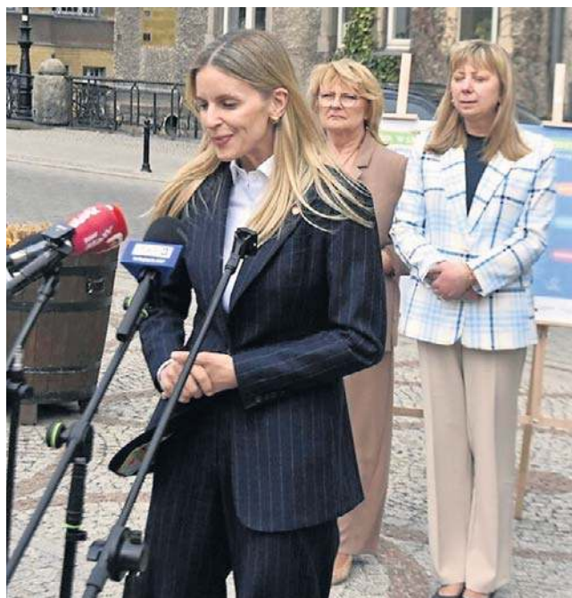
Władze Wałbrzycha zaprezentowały projekt „Młodzi gniewni”. Chcą pomóc dzieciom w usamodzielnianiu się.

- W programie po pierwsze zakładamy, w jaki sposób możemy wesprzeć w usamodzielnianiu dzieciaki pomiędzy 15. a 18. rokiem życia. Mamy takie doświadczenia. W rodzinach zastępczych mamy ponad 580 dzieci, w instytucjonalnej pieczy zastępczej 140 dzieci. Musimy zrobić wszystko, żeby te dzieci z pieczy zastępczej po ukończeniu 18. roku życia dalej dostawały od nas wsparcie, żeby mogły stać się mieszkańcami Wałbrzycha, którzy radzą sobie w codziennym życiu - mó-