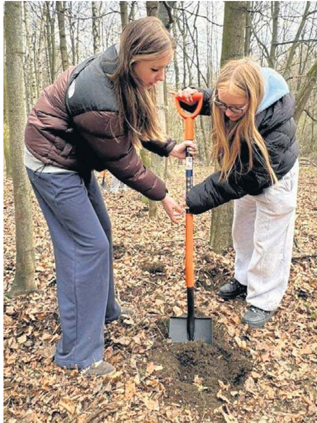
Czasem trzeba było kopać we dwie osoby. Bo przygotowanie dołka na sadzonkę drzewa wcale nie jest łatwe.