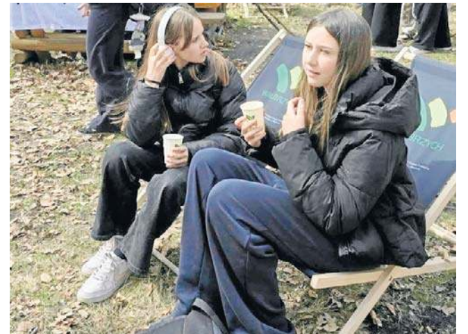
Uczestnicy akcji wyruszyli z sześciu lokalizacji pod opieką przewodników. Spotkali się na Ptasiej Kopie.