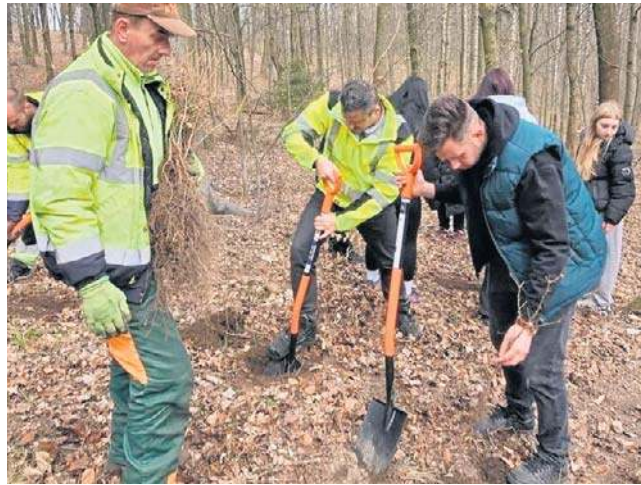
Młodzież i dorośli wspólnie posadzili 600 sadzonek na 600-lecie Wałbrzyska. Liczby doprawdy imponujące!