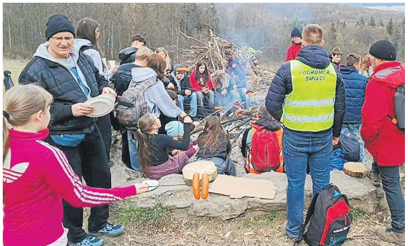
Nie zabrakło ogniska i poczęstunku w postaci pieczonych kiełbasek dla wszystkich uczestników akcji.