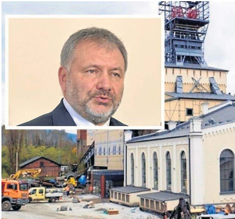
Minister Waldemar Żurek przyjrzy się śledztwu w sprawie Starej Kopalni w Wałbrzychu.

Śledztwo było przez długi czas zawieszona. Wracamy do tej sprawy co kilka miesięcy. Ostatni raz w listopadzie 2025 roku informowaliśmy, że Prokuratura Okręgowa w Jeleniej Górze czeka już tylko na jeden dokument, by wznowić postępowanie. Chodziło o decyzję naczelnika Dolnośląskiego Urzędu Celno-Skarbowego we Wrocławiu.