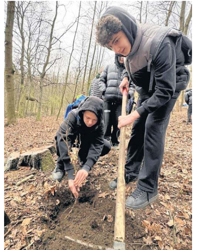
Młodzież szybko nauczyła się podziału zadań. - Ty kopiesz, ja wsadzam sadzonkę i wtedy ją przysypujesz - słyszeliśmy.