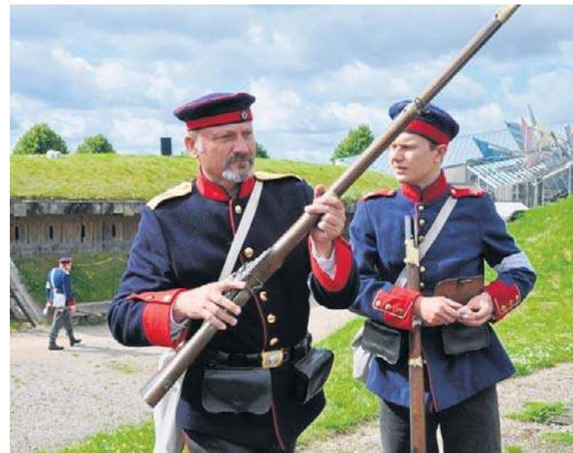
Widoczne detale umundurowania rekonstruktorów.

Rekonstruktorzy z „Tschuffa” zapewniali, że pojechali do Dybbøl raz, później drugi raz, i jak będzie okazja - chę-