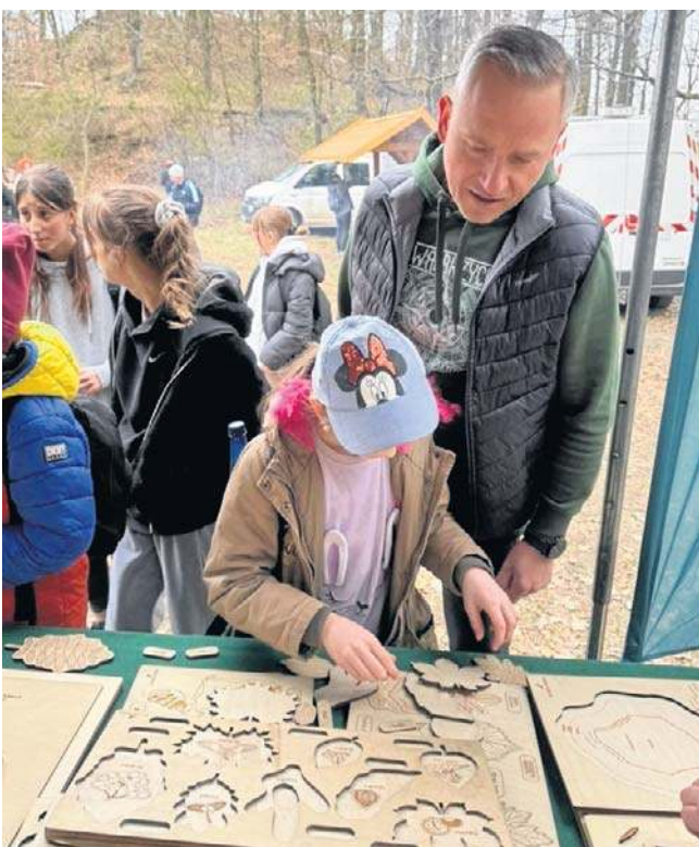
Po zakończeniu sprzątania w terenie, wałbrzyskanie - w tym uczniowie szkół - spotkali się na Ptasiej Kopie.