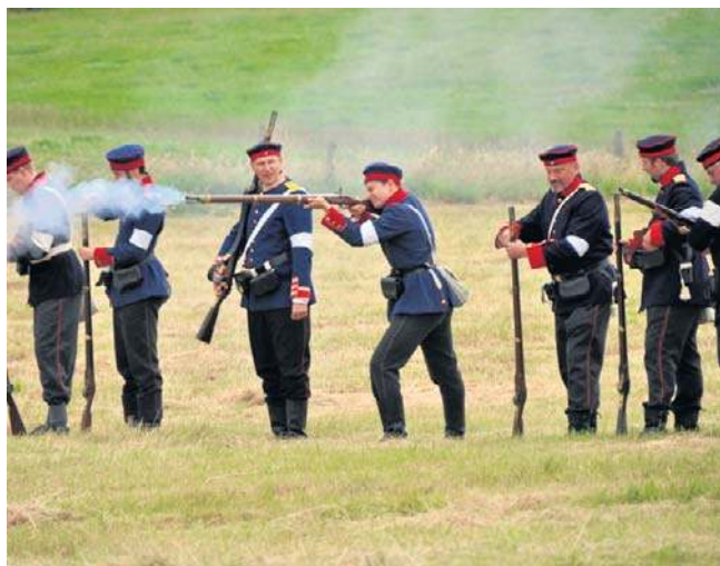
„Tschuff” w czasie ćwiczeń z bronią.

podstaw uczyć się o realiach historycznych, by wiedzieć kogo się odtwarza.