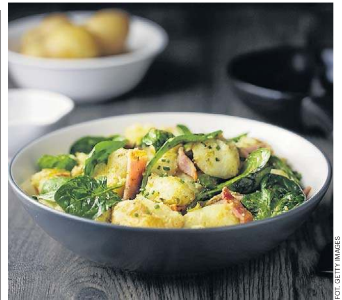
Szpinak i ziemniaki to - według EWG - najbardziej zanieczyszczone warzywa.