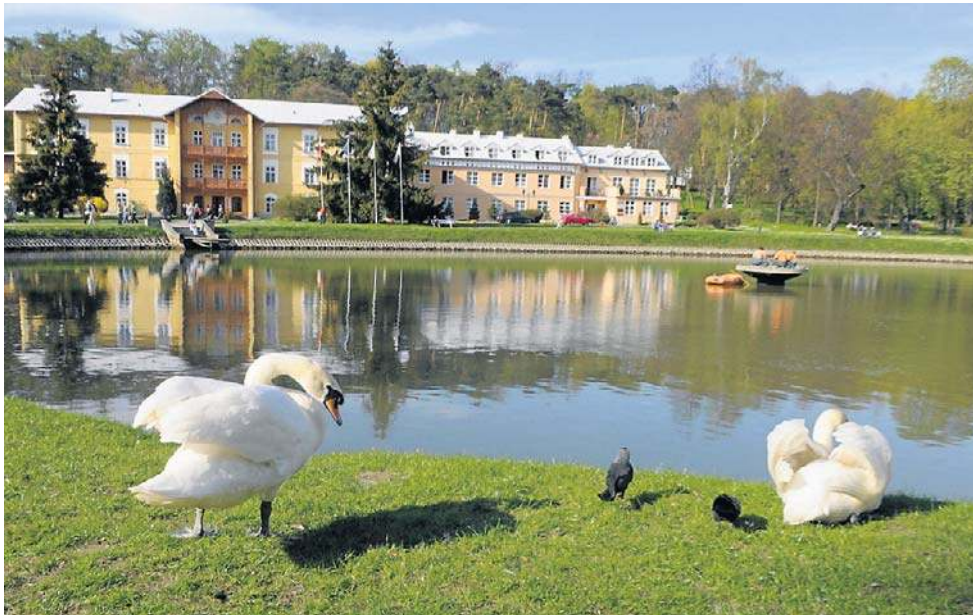
Zobacz listę najlepszych sanatoriów na NFZ.

Wszystko świetnie, ale skąd wiadomo, które sanatorium rzeczywiście jest dobre czy wręcz bliskie ideałowi? Najlepiej spytać o zdanie samych pacjentów, którzy już odbyli turnusy.