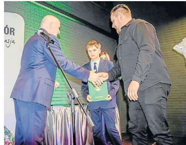
Sportowe i naukowe stypendia wójta gminy Czarny Bór otrzymało 24 uczniów miejscowej Szkoły Podstawowej.

Jak nas zapewniono w Czarnym Borze, szykują się już następni kandydaci. Nic, tylko trzymać za nich kciuki!