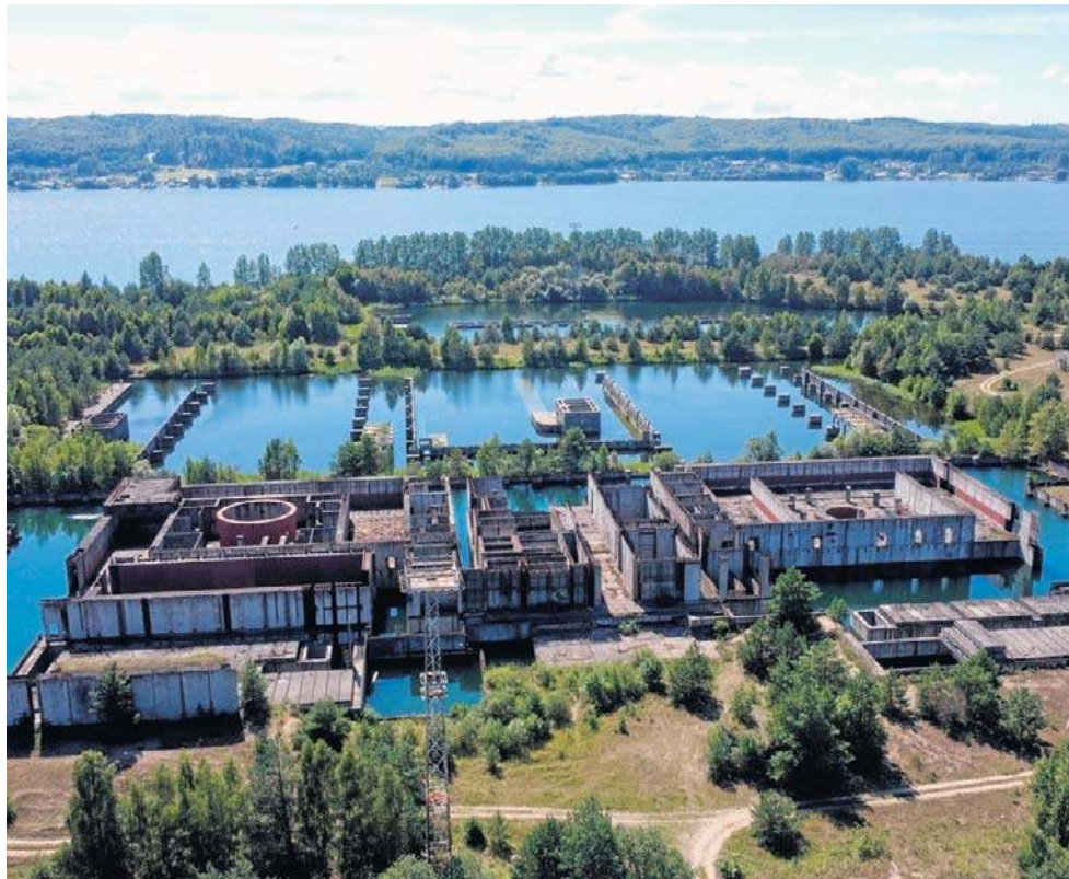
17 grudnia 1990 roku rząd Tadeusza Mazowieckiego podjął uchwałę o postawieniu inwestycji „Elektrownia Jądrowa Żarnowiec w budowie” w stan likwidacji.

Do 1986 r. ukończono prace nad większością obiektów pomocniczych elektrowni, takich jak hale magazynowe, kotłownia technologiczna, hydrofornia,