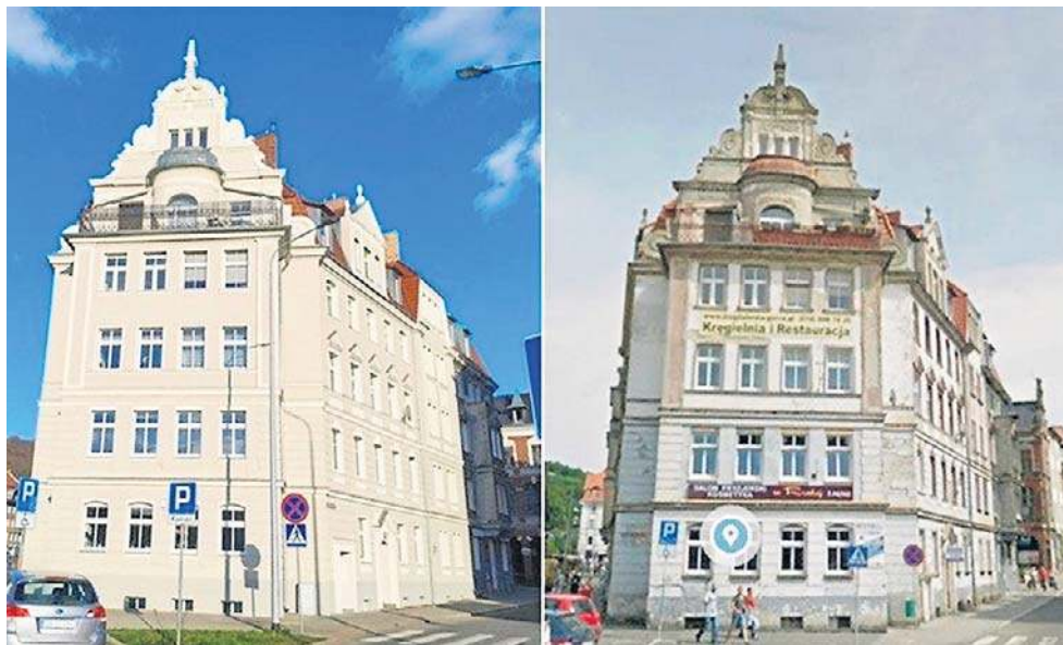
Gmach przy ul. Konopnickiej 5B po i przed renowacją. Prawda, że widać różnicę?

„Prezydent Wałbrzycha informuje, że w wyniku przepro-