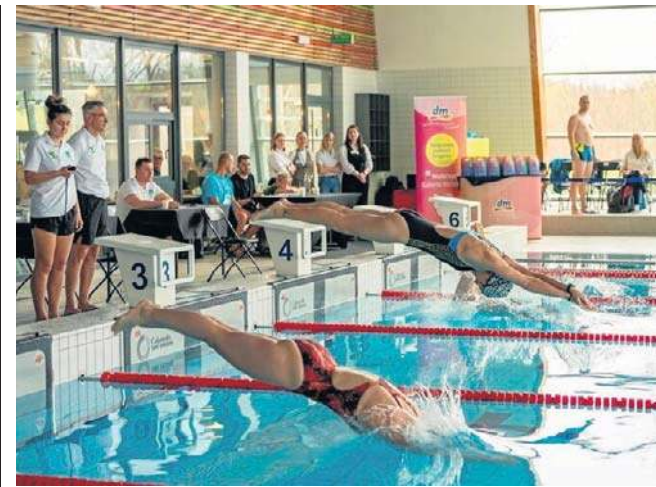
FOT. AQUA ZDRÓJ, WAŁBRZYCH

W późniejszej rozmowie z 84-latką policjanci ustalili, że wyszła z mieszkania, by wyrzucić śmieci. Ale przewróciła się do rowu i nie była w stanie samodzielnie wstać. ©