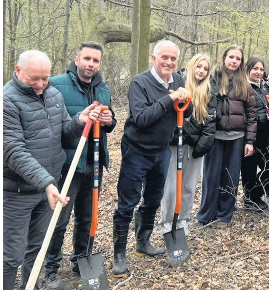
Dzikię Wzgórza – SprzątaMy i SadziMy! - to hasło społecznej akcji dla przyrody i mieszkańców