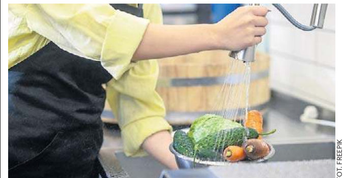
Jak zmniejszyć ilość pestycydów w jedzeniu? Jednym ze sposobów jest właściwe mycie.