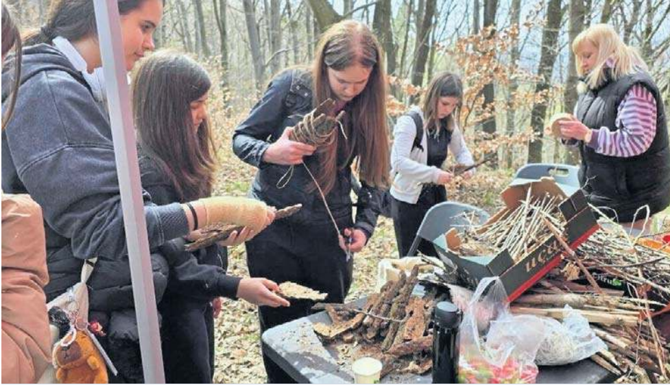
Na trzech wzgórzach - Ptasiej Kopie, Lisim Kamieniu i Czarnocie - zrobiło się czysiej.