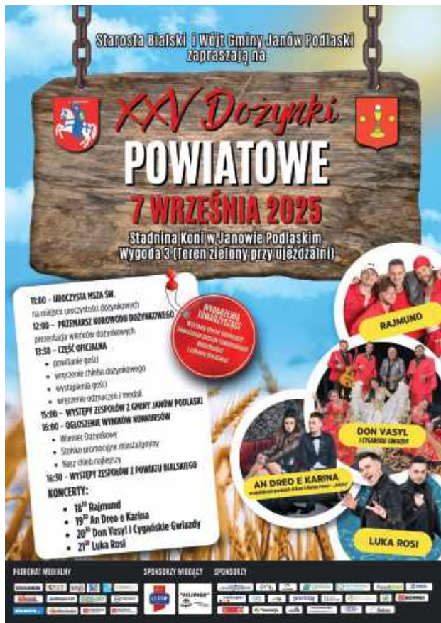
Plakat dożynek powiatowych w Janowie Podlaskim

Na miejscu uroczystości dożynkowych o godz. 11 zacznie się uroczysta msza św. W samo południe wyruszy przemarsz korowodu dożynkowego. Przewidziano wtedy też prezentację wieńców dożynkowych. Część oficjalna o godz. 13.30 z wręczeniem chleba dożynkowego i wystąpieniami gospodarzy oraz gości będzie też okazją do wręczenia odznaczeń i medali.