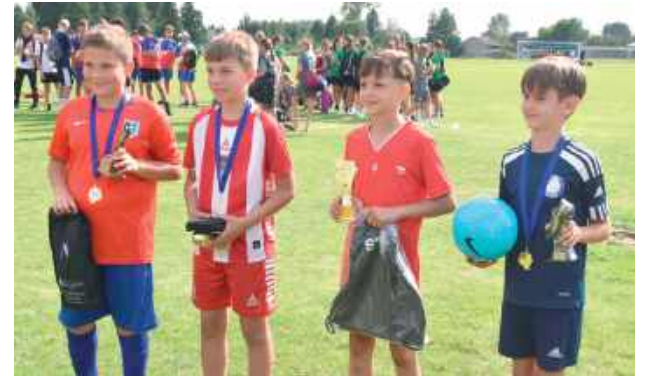
Wybrano najlepszego: strzelca, zawodnika, obrońcę oraz bramkarza, w każdej z sześciu kategorii

Z roku na rok impreza przyciąga coraz więcej drużyn i sponsorów, co pokazuje, że inicjatywa spotkała się z dużym odzewem. Memoriał stał się ważnym elementem kalendarza sportowego Międzyrzecza, a także wydarzeniem, które łączy pokolenia i daje młodzieży nie tylko możliwość rywalizacji, lecz także rozwijania sportowych przyjaźni.