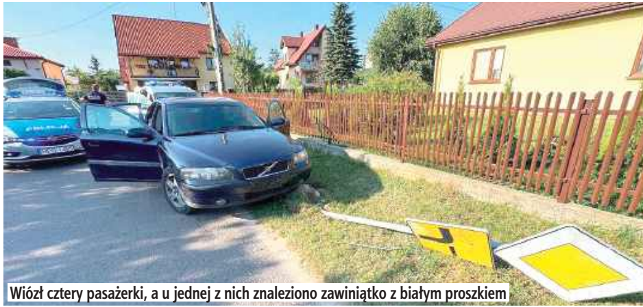
Wiózł cztery pasażerki, a u jednej z nich znaleziono zawiniątko z białym proszkiem

Biała Podlaska: 30-latek nie zatrzymał się do kontroli drogowej. Stracił panowanie nad autem i zakończył jazdę, uderzając w znak drogowy. Był pod wpływem alkoholu i środków odurzających. Na jego koncie „widniał” zakaz prowadzenia pojazdów, a w portfelu miał narkotyki.