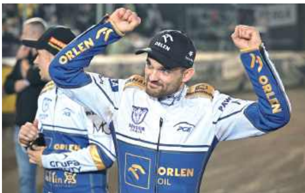
Bartosz Zmarzlik znów pokazał wielką klasę!

Orlen Oil Motor Lublin rozegrał pierwszy półfinał PGE Ekstraligi z Bayersystem GKM-em Grudziądz. Mistrzowie Polski w początkowej fazie zawodów mieli spore problemy i zapowiadało się zaskoczenie. Później koledzy wzięli przykład z Bartosza Zmarzlika.