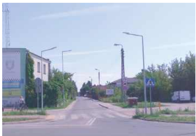
Po długiej przebudowie skrzyżowania już okolica siedziby Straży Miejskiej wygląda lepiej, ale o oznaczeniu ulicy zapomniano

W Białej Podlaskiej część ulic nie jest dobrze oznaczona. Tuż przy białskiej siedzibie Straży Miejskiej znajduje się uliczka o demokratycznej nazwie Średnia.