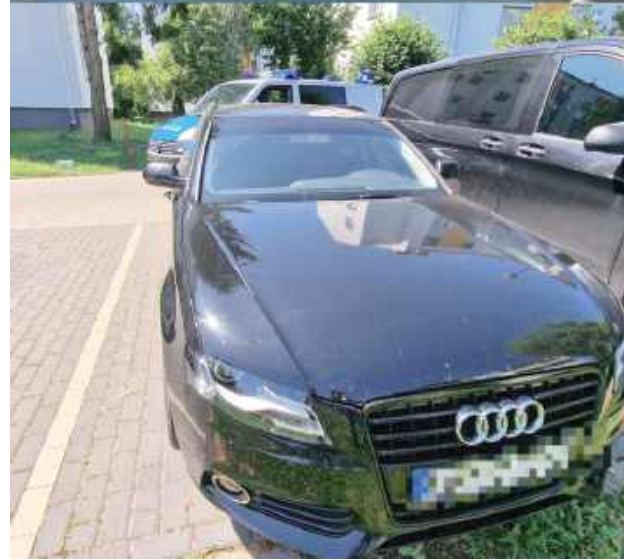
Kierowa Audi przekroczył dopuszczalną prędkość o 39 km/h