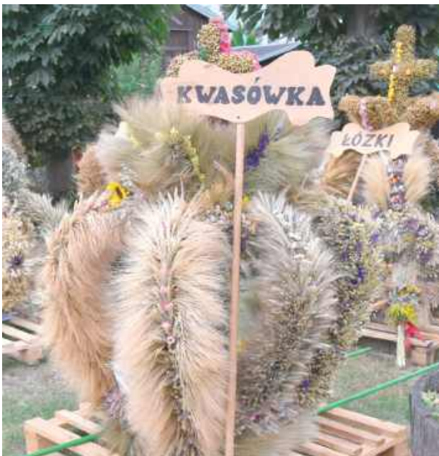
Tak wyglądał wieniec upleciony przez sołectwo Kwasówka

Po mszy świętej korowód dożynkowy przeszedł ulicami Męczenników Podlaskich, Szkolną i Ogrodową, by ostatecznie dotrzeć na plac Gminnego Centrum Kultury w Drelowie, gdzie odbywała się dalsza część uroczystości