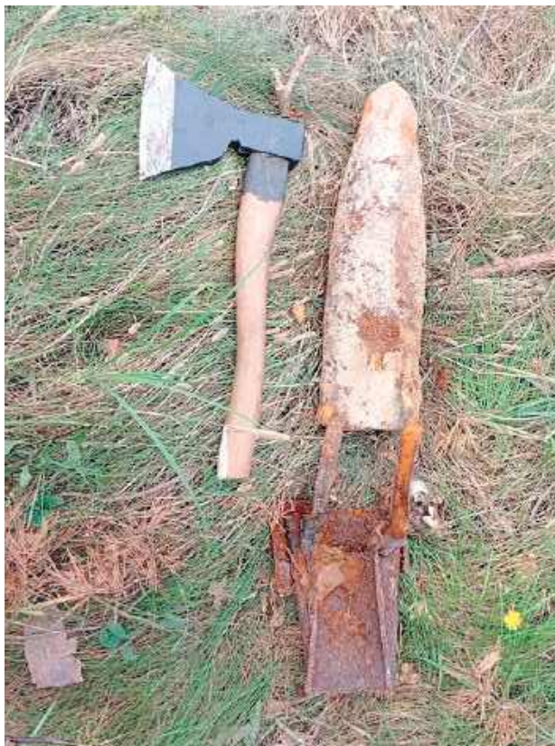
Policja odebrała zgłoszenie dotyczące znalezienia podczas prac ziemnych przedmiotu przypominającego niewybuch

- Na miejsce natychmiast skierowany został patrol, który potwierdził tę informację. Policjanci zabezpieczyli znalezisko do czasu przybycia na miejsce patrolu rozminowania z Jednostki Wojskowej w Chełmie. Saperzy potwierdzili, że znaleziony przedmiot to pocisk artyleryjski kal. 120 mm, przerobiony na bombę lotniczą pochodzący z okresu II wojny światowej. Sprawdzili też pobliski teren, nie