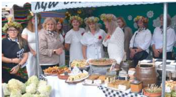
Stoły na stanowiskach sołectw uginały się od ciężaru domowych wypieków, mięs i różnorodnych potraw. Tak prezentowało się stanowisko sołectwa Szachy