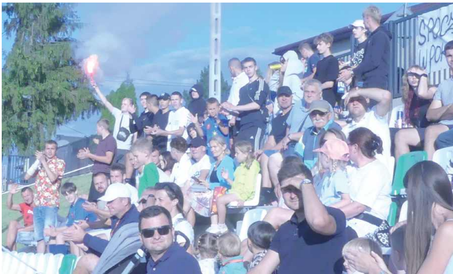
Stadion w Janowie wypełnił się niemal do ostatniego miejsca