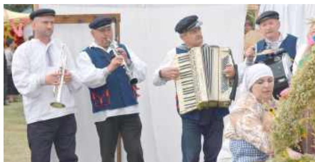
Uroczystość uświetniły liczne występy artystyczne. Na scenie można było zobaczyć między innymi Orkiestrę św. Mikołaja, zespół Hajda Banda oraz Spectrum Live. W trakcie dzielenia się chlebem o oprawę muzyczną zadbała orkiestra Krzyśka

Dla najmłodszych przygotowano bezpłatne dmuchańce, dzięki czemu dzieci mogły aktywnie i bezpiecznie spędzić czas podczas całego wydarzenia. Tegoroczne dożynki były nie tylko