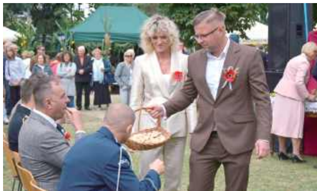
Starostwie tegorocznych dożynek oraz gospodarze gminy – wójt i przewodnicząca rady gminy – podziлили chleb dożynkowy wśród zgromadzonych gości.

Centralnym punktem wydarzenia było widowisko obrzędowe „Wiljo Dożynek” w wykonaniu Zespołu Folklorystyczno-Obrzędowego „Sołtycki”. Grupa od lat zdobywała laury na prestiżowych przeglądach teatrów obrzędowych i wiejskich, a autentyczność oraz serce włożone w każdy występ uczyniły ich ważnym ambasadorem folkloru. Na scenie pojawiły się również zespoły muzyczne grające w duchu ludowych tradycji. Energetyczne oberki i polki w swoich aranżacjach zaprezentowała Hajda Banda, natomiast legendarna Orkiestra świętego Mikołaja, działająca od 1988 roku, oczarowała publiczność wielowarstwowymi aranżacjami z użyciem cymbałów, nyckelharpy, fujarek i mazanki. Nie zabrakło także lokalnych kapel, a zakończenie święta uświetnił zespół Spectrum Live, wprowadzając uczestników w taneczny nastrój.