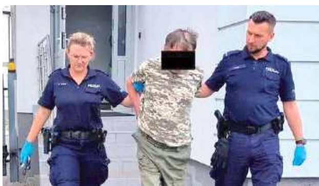
Mężczyzna trafił za kratki

Przybyli pod wskazany w zgłoszeniu adres policjanci zastali 89-latkę, która miała widoczne siniaki oraz opuchliznę w okolicy głowy. Kobieta powiedziała, że sprawcą tej i wielu podobnych sytuacji z przeszłości jest jej syn. Mężczyzna nadużywał alkoholu, a będąc pod jego wpływem, wszczyła awantury, podczas których dochodzi do