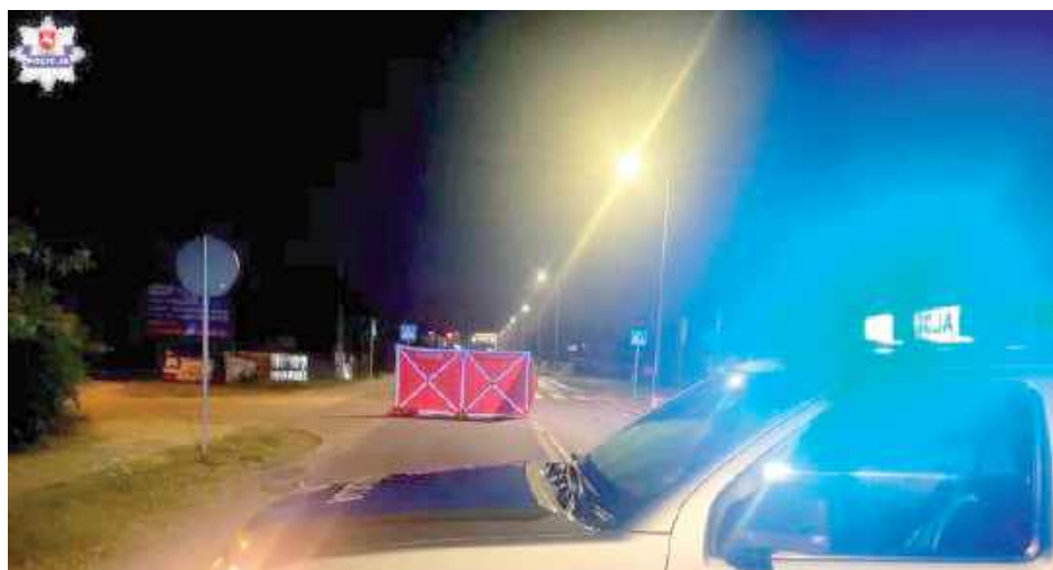
Kierujący samochodem koloru srebrnego, poruszający się od strony Lubartowa, na prostym odcinku drogi w rejonie skrzyżowania z ul. Piwonii wjechał w kobietę prawdopodobnie przechodzącą przez przejście dla pieszych

- Zwracamy się do świadków, którzy mają istotne informacje o zdarzeniu o zgłaszanie się do Komendy Powiatowej Policji w Parczewie - informowała Semeniuk. Ewelina Semeniuk powiedziała w rozmowie z nami, że kie-