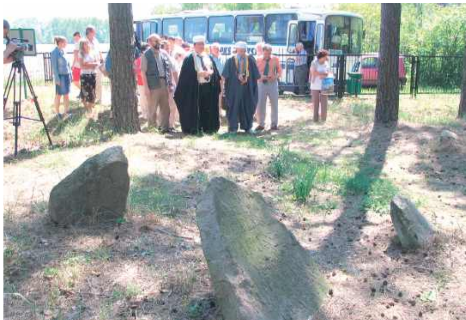
Cmentarz tatarski w Studziance przed konserwacją nagrobków

- Tatarzy mieszkali w kilkunastu miejscowościach blisko Studzianki. To ta miejscowość za sprawą pobożnego w niej meczetu stała się centrum życia społeczności