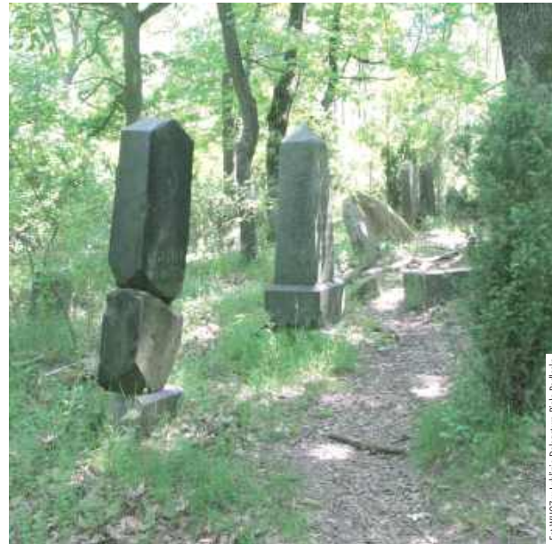
Na zdjęciu mizar w Zastawku (Lebedziewie) - przed podjęciem prac konserwatorskich i porządkowych