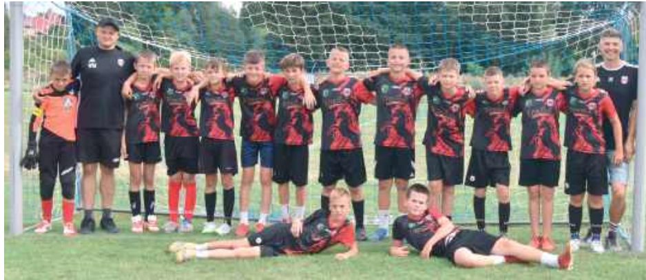
W turnieju wzięło udział aż 31 drużyn

Na stadionie miejskim wyznaczono sześć boisk, na których toczyła się rywalizacja w trzech kategoriach wiekowych: junior, młodzik i orlik. Zawodnicy reprezentowali roczniki od 2010 do 2016. Każdy mecz dostarczał emocji, a dla młodych piłkarzy był nie tylko sportowym spraw-