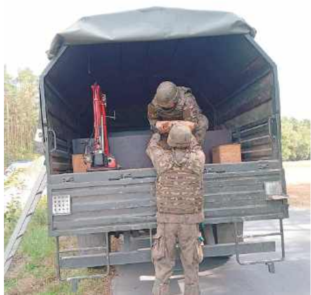
Policjanci zabezpieczali niebezpieczne znalezisko do czasu przyjazdu saperów, którzy podjęli niewybuch

Gmina Tucznia: Pocisk artyleryjski pochodzący z okresu II wojny światowej został znaleziony podczas prac ziemnych.