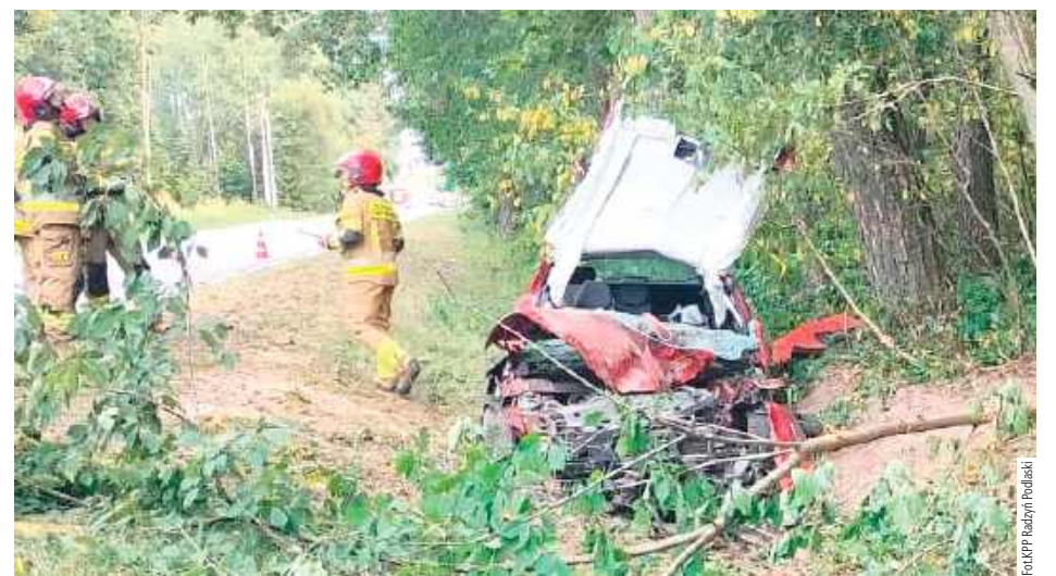
35-letnia mieszkanka gminy Radzyń Podlaski na łuku drogi straciła panowanie nad autem, a następnie zjechała na prawe pobocze, po czym uderzyła w przydrożne drzewo

- Ze wstępnych ustaleń funkcjonariuszy wynika, że kierująca samochodem osobowym marki Renault Megane 35-letnia mieszkanka gminy Radzyń Podlaski na łuku drogi straciła panowanie nad autem, a następnie zjechała na prawe pobocze, po czym uderzyła w przydrożne drzewo - informuje komisarz Piotr Mucha z KPP w Radzynie Podlaskim.