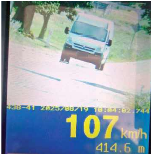
Został ukarany mandatem karnym w kwocie 3 000 zł, a jego konto „wzbogaciło się” o 13 punktów karnych

Biała Podlaska: Do kontroli zatrzymano 70-letniego kierowcę dostawczego Opla. Przekroczył dozwoloną w obszarze zabudowanym prędkość o 57 km/h.