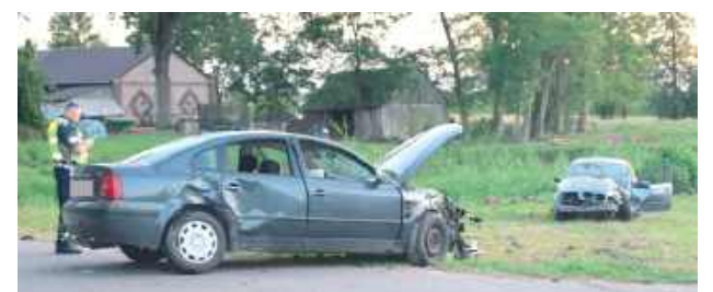
Jedna osoba trafiła do szpitala

Biała Podlaska: Kierująca Volkswagenem wyjeżdżając z parkingu, zderzyła się z drugą osobówką. Była trzeźwa, natomiast drugi z uczestników - kierowca BMW - miał w organizmie ponad 1,3 promila alkoholu.