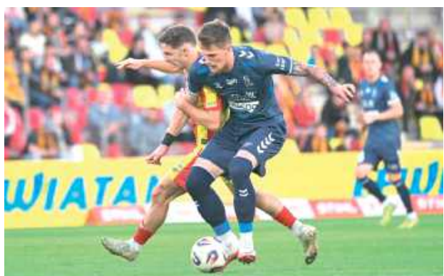
Motor czeka na wygraną od 20 lipca

Piłkarze lubelskiego Motoru zaliczyli czwartą z rzędu mecz w PKO BP Ekstraklasie bez wygranej. W 6. kolejce rozgrywek żółto-biało-niebiescy ulegli na wyjeździe Koronie Kielce.