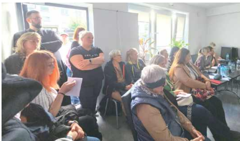
Wydarzenie zgromadziło liczną publiczność

Rodzice zwracali uwagę na rzekomą sprzeczność w argumentacji władz. Z jednej strony, samorząd powołuje się na kryzys demograficzny i malejącą liczbę uczniów w szkole, z drugiej - planuje otwarcie nowej