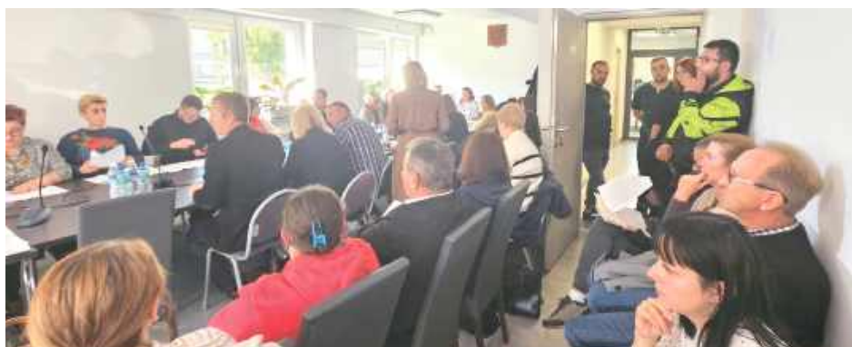
Posiedzenie Komisji Spraw Społecznych i Oświaty

placówki opiekuńczej, licząc na odpowiednie zainteresowanie ze strony rodziców najmłodszych dzieci.