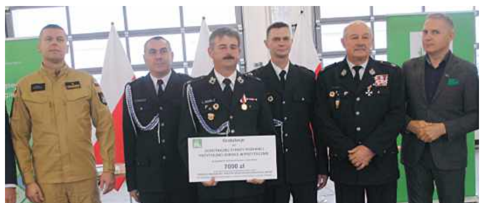
Dotacja dla OSP Przytoczno Osiedle