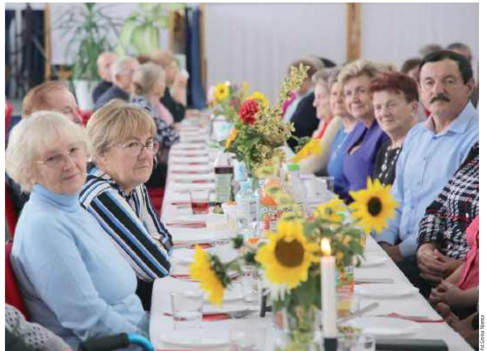
Spotkaniu przebiegało w miłej, uroczystej atmosferze