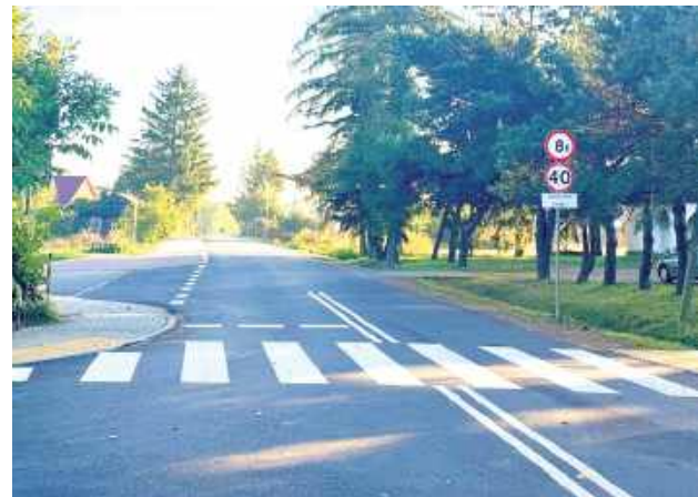
Fragment wyremontowanej drogi w Nasutowie z przejściem dla pieszych i nowym chodnikiem

Niedawno zakończono kolejną inwestycję w gminie Niemce - przebudowę drogi w Nasutowie. Przedsięwzięcie kosztowało 725 956,31 zł.