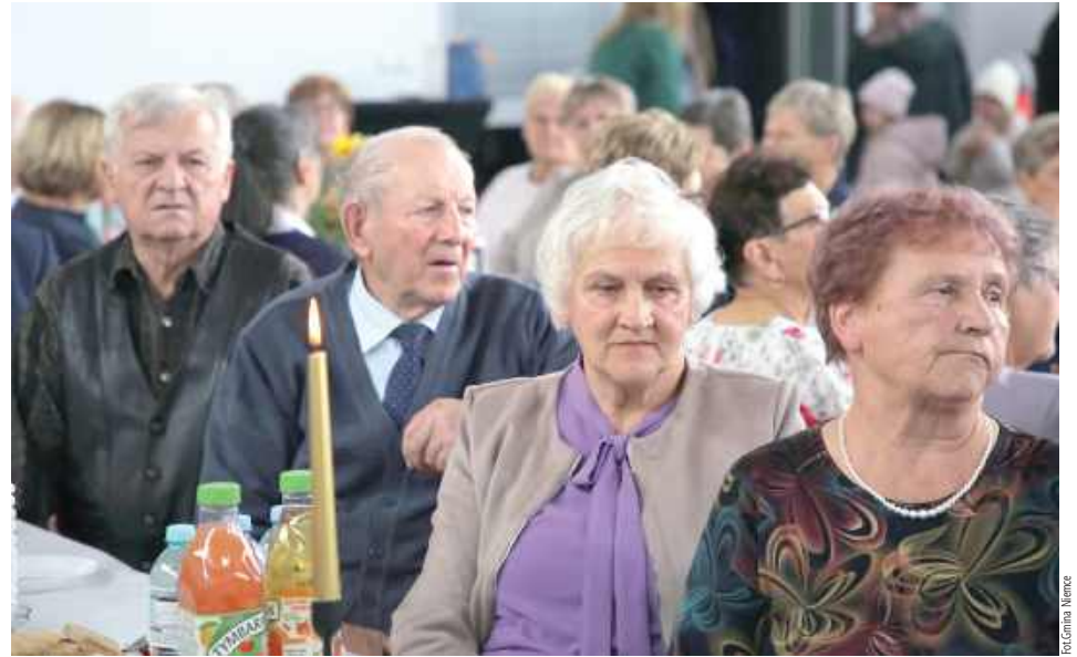
Seniorzy uczcili swoje święto w Bibliotece Gminnej w Niemcach