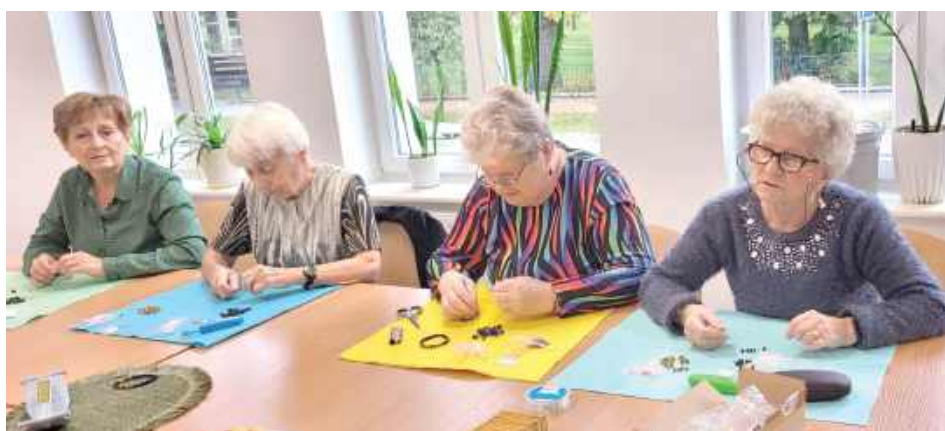
Zajęcia w UTW rozpoczęły warsztaty rękodzieła artystycznego. Uczestniczki wykazały się dużą kreatywnością i stworzyły ciekawe wzory bransoletek z kamieni naturalnych

FIRLEJ: Nowy rok akademicki dla słuchaczy UTW w Firleju zapowiada się niezwykle ciekawie. W planie znajdują się liczne wykłady, warsztaty i spotkania.