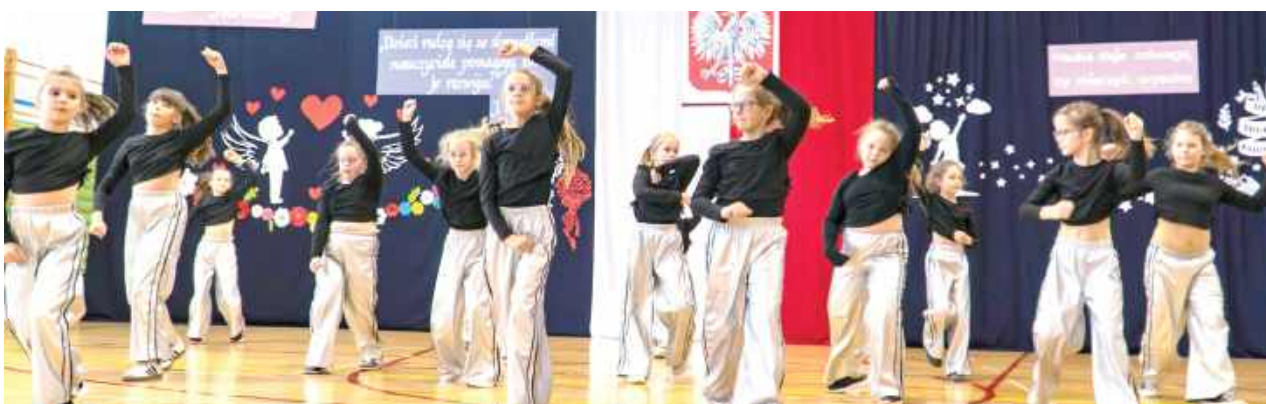
Występ zespołu tanecznego działającego w szkole w Łucce

Dzień Edukacji Narodowej w gminie Lubartów zorganizowano 10 października w Szkole Podstawowej w Łucce.