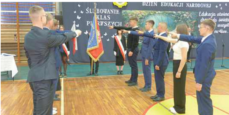
Ślubowanie uczniów klas I w RCEZ