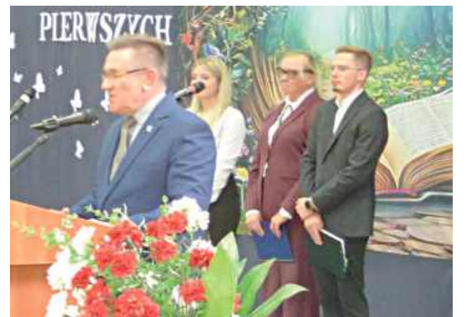
W uroczystości uczestniczył m.in. przewodniczący Rady Powiatu Andrzej Kardasz