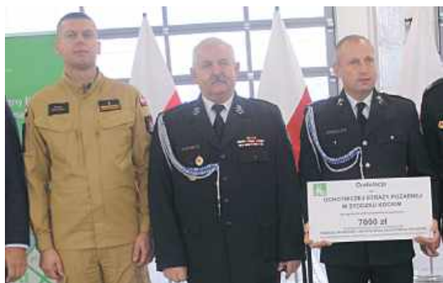
Dotacja dla OSP Stoczek Kocki