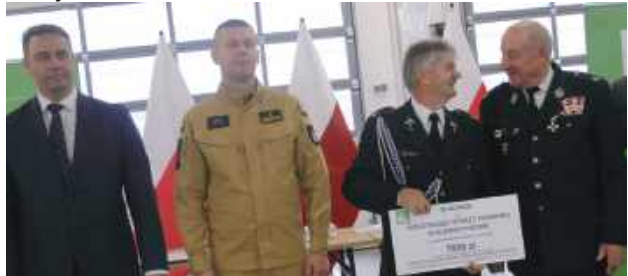
Dotacja dla OSP Klementynów