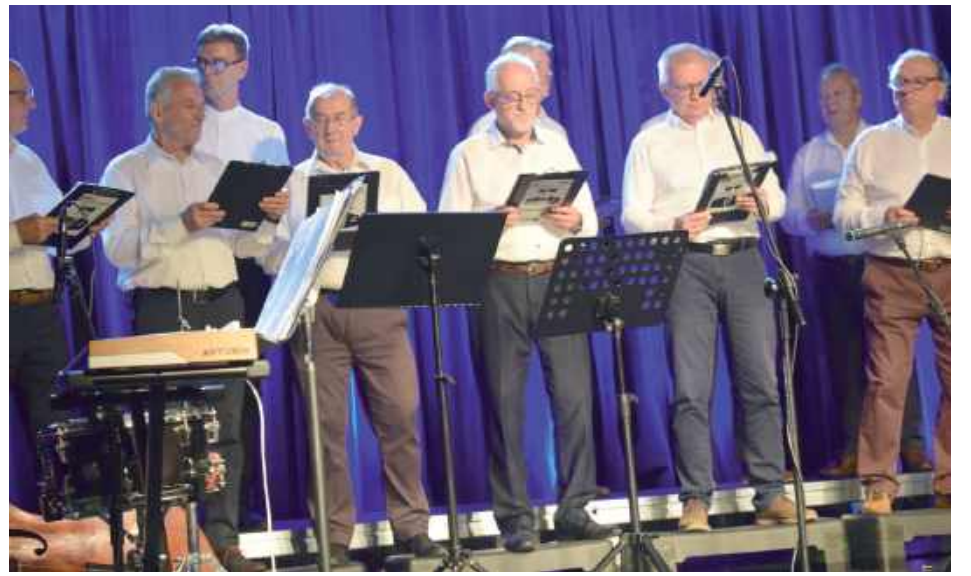
Wystąpiła męska grupa Chórtownia

Chór Ziemi Lubartowskiej działa od 2005 r. W sobotę świętował jubileusz. Chór otrzymał Lubelski Laur Dziedzictwa Kulturowego.