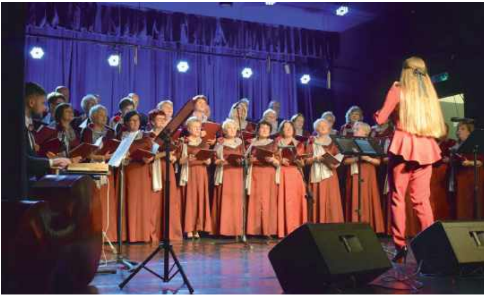
Chór Ziemi Lubartowskiej na scenie