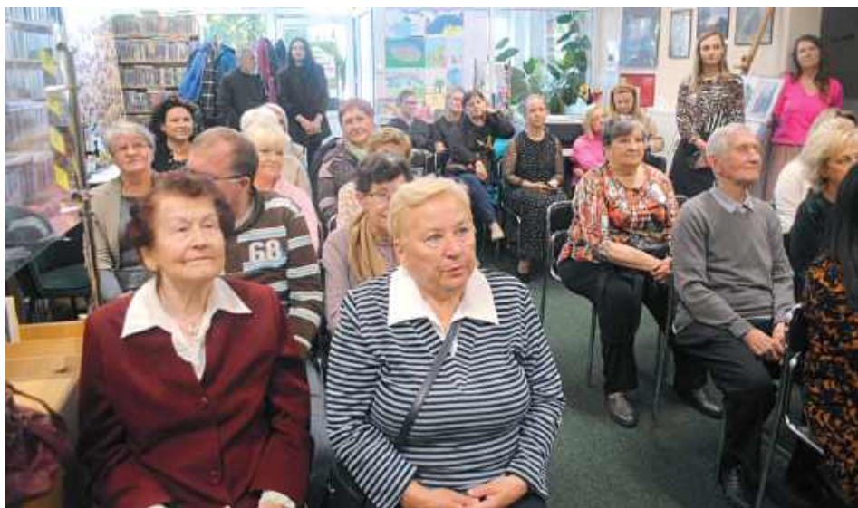
Czytelnicy i pracownicy Filii nr 2 podczas jubileuszu

W 1993 r. filia została przeniesiona na ul. Ks. Popiełuszki 10 A. W 2004 r. pojawił się w niej pierwszy komputer. W 2007 r. nastąpiła kolejna przeprowadzka - do SP 3. Istnieje tu do dziś, chociaż w 2016 r. została pomniejszo-