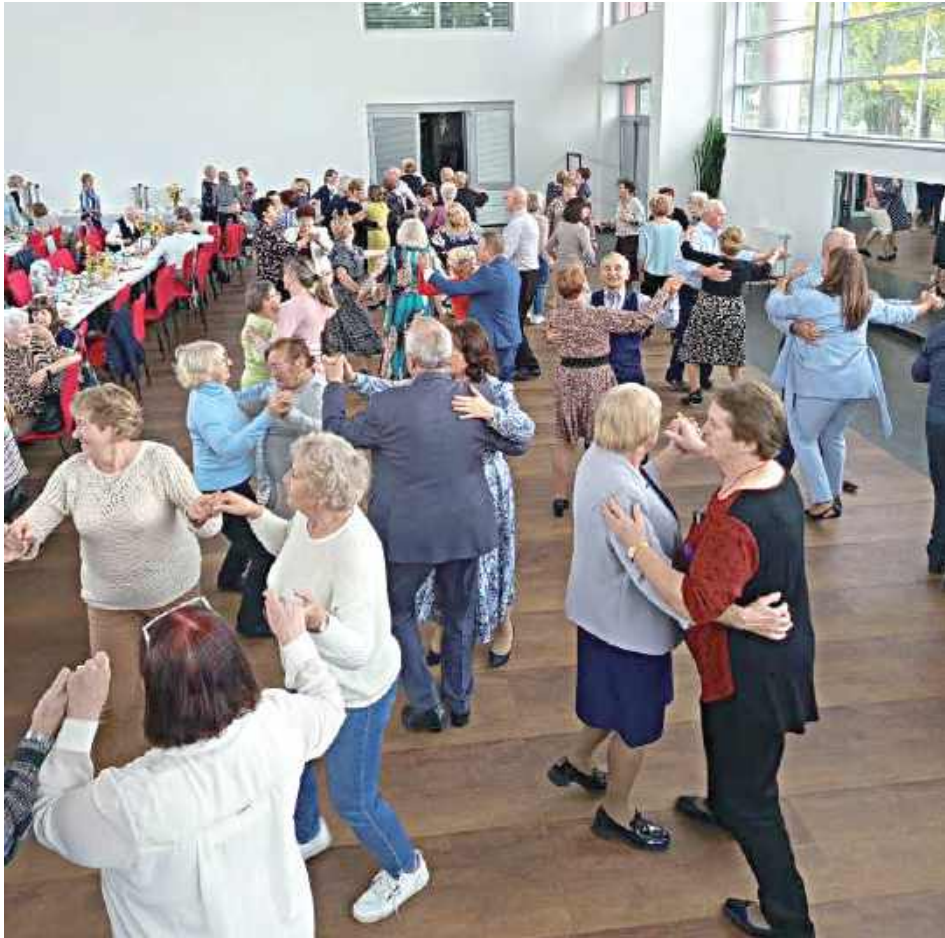
Po części oficjalnej i artystycznej były tańce. Seniorzy z gminy Niemce, jak widać, w wybornej formie

Gminna Biblioteka Publiczna w Niemcach jest miejscem organizacji wielu ważnych imprez. Ostatnio ponownie gościła seniorów z ośmiu gminnych klubów, którzy w miłej atmosferze obchodzili swoje święto.