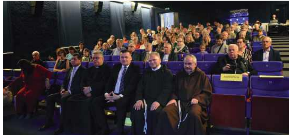
Publicność na jubileuszowym koncercie