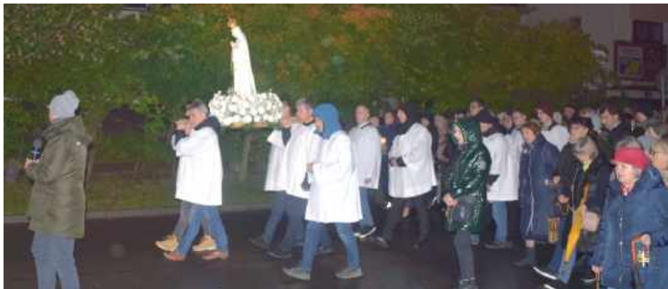
Październik jest miesiącem różańca, więc w procesji niesiono figurę Matki Boskiej Różańcowej