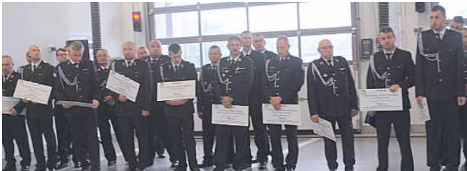
Przedstawiciele OSP z powiatu lubartowskiego

56 jednostek OSP z powiatów lubartowskiego, łukowskiego, puławskiego i ryckiego otrzymało dofinansowanie od KRUS.