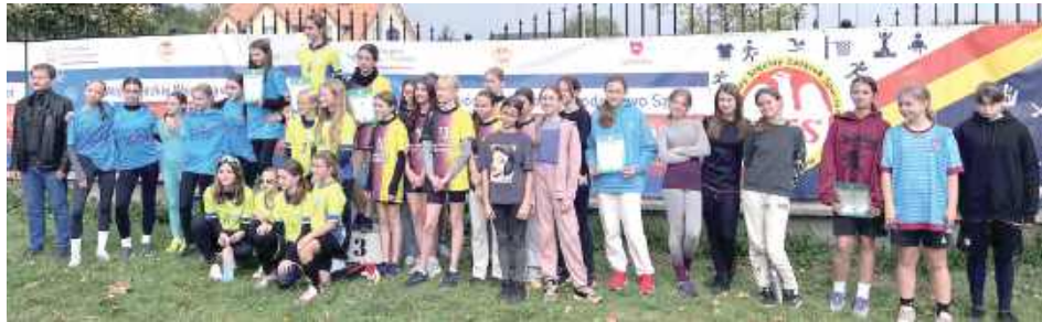
Uczestniczki biegów sztafetowych

Powiatowy Szkolny Związek Sportowy w Lubartowie zorganizował półfinał wojewódzki 9 października. Biegi rozgrywane były w kategoriach: Igrzyska Dzieci, Igrzyska Młodzieży Szkolnej, Licealiada.