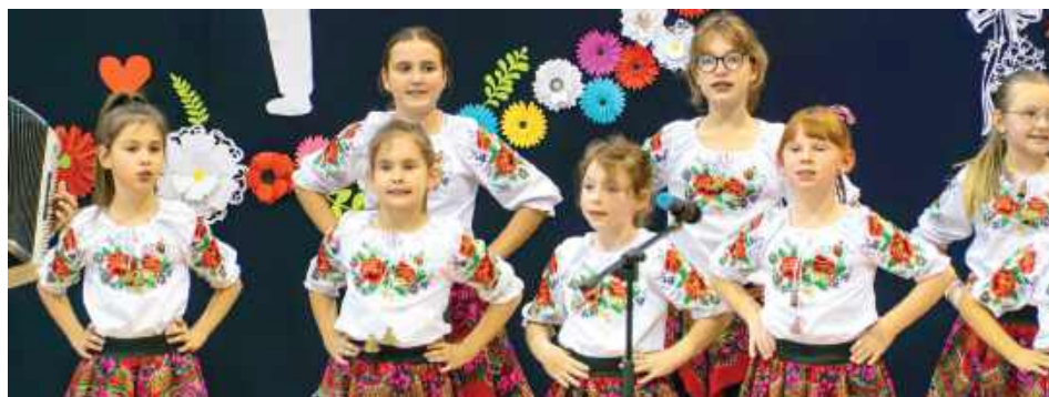
Na uroczystości wystąpiła Mała Rokiczanka

Wręczono nagrody dla dyrektorów i nauczycieli wyróżniających się w pracy zawodowej. Uczestnicy uroczystości obejrzeli występy Małej Rokiczanki i zespołu tanecznego działającego w szkole w Łucce.