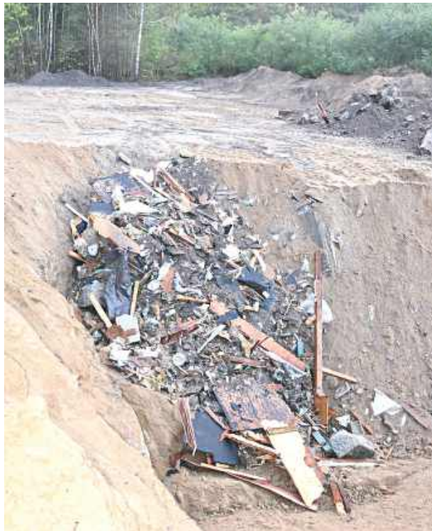
50-latek składował nielegalne odpady

Do zatrzymania doszło w poniedziałek, kiedy to funkcjonariusze ustalili, że w jednej z miejscowości na terenie powiatu lubartowskiego mogą być nielegalnie składowane „odpady klasyfikowane jako niebezpieczne”. Tego samego