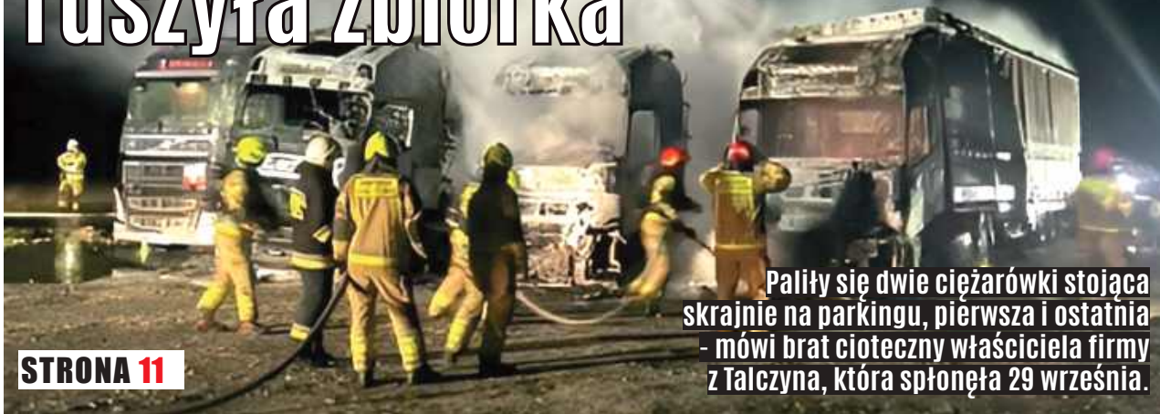
Palily się dwie ciężarówki stojąca skrajnie na parkingu, pierwsza i ostatnia - mówi brat cioteczny właściciela firmy z Talczyna, która spłonęła 29 września.

Właściciel prosi o wsparcie, ruszyła zbiórka