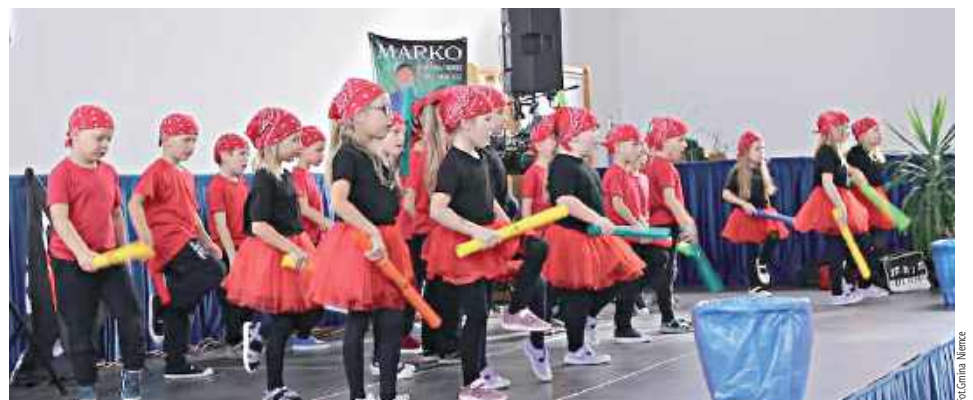
Grupa Gumisie z przedszkola w Niemcach. Występ był okrasą spotkania