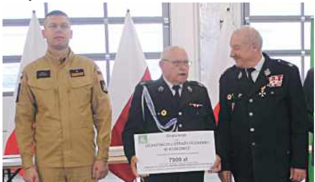
Dotacja dla OSP Kozłówka