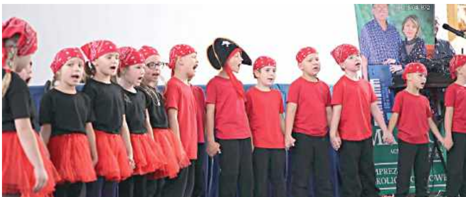
Seniorom zaprezentowało się najmłodsze pokolenie