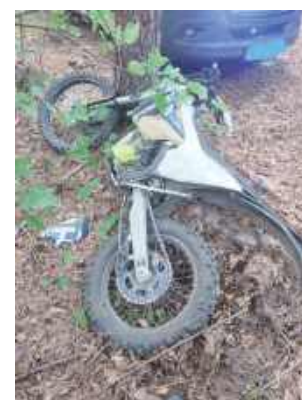
40-letni mężczyzna został przewieziony śmigłowcem LPR do szpitala

4 października na drodze gruntowej w Sobieszynie-Brzozowej doszło do wypadku 40-letniego motocyklisty na drodze gruntowej.