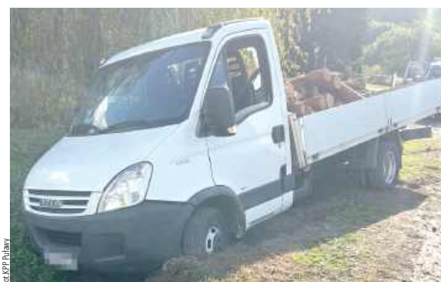
Kierowca Iveco zjechał do rowu. 63-latek wydmuchał ponad 2 promile