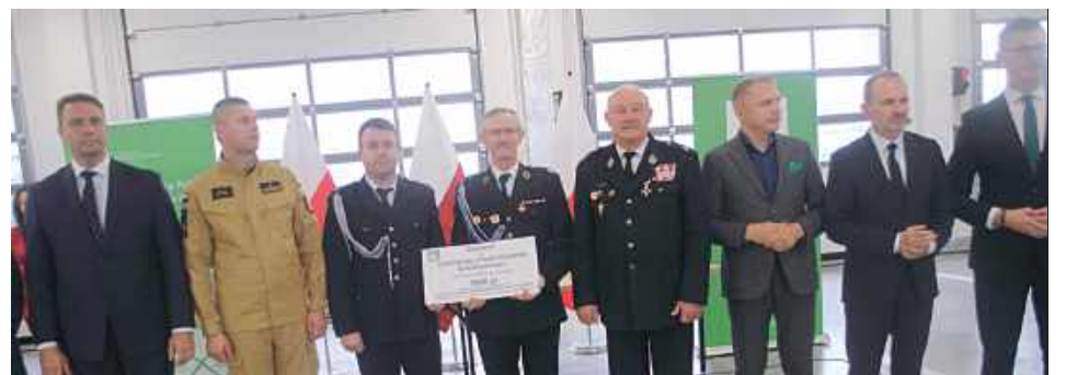
Dotacja dla OSP Nowodwór