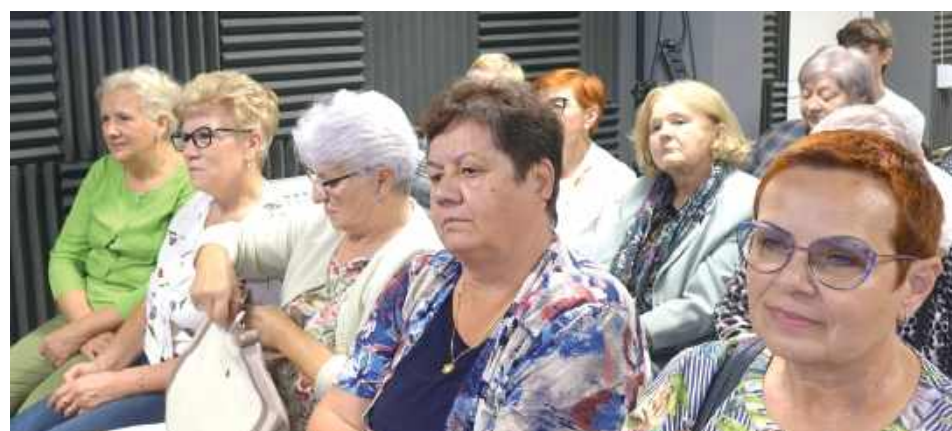
Nowy rok akademicki dla słuchaczy UTW w Firleju zapowiada się niezwykle ciekawie. W planie znajdują się liczne wykłady, warsztaty i spotkania

Podczas inauguracji przedstawione zostały między innymi plany na nadchodzące miesiące. Do grona słuchaczy dołączyło wielu nowych członków, którzy podczas uroczystości odebrali