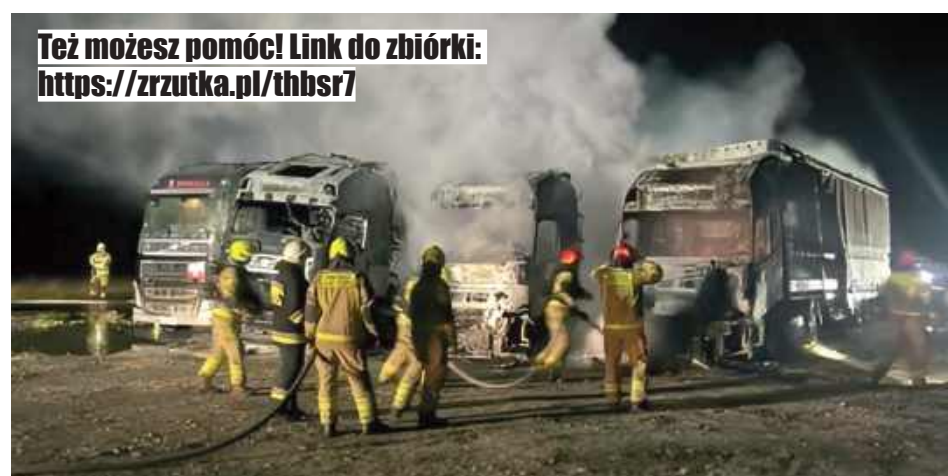
Też możesz pomóc! Link do zbiórki: https://zrzutka.pl/thbsr7