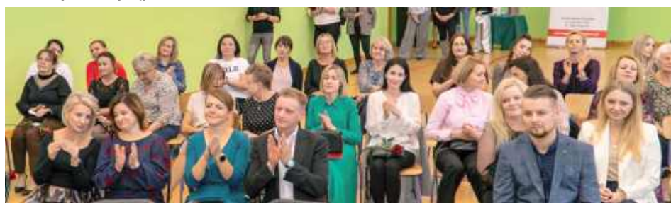
Uczestnicy obchodów Dnia Edukacji Narodowej w Łucce