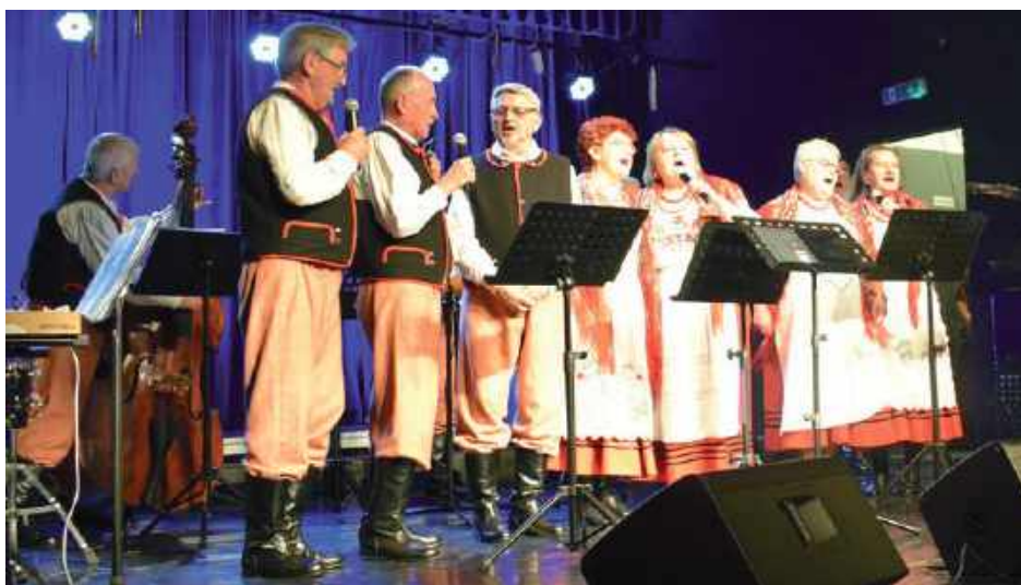
Kapela Lewartowianie, w której występują też członkowie chóru