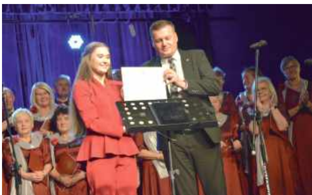
Gratulacje od burmistrza Krzysztofa Pańnika