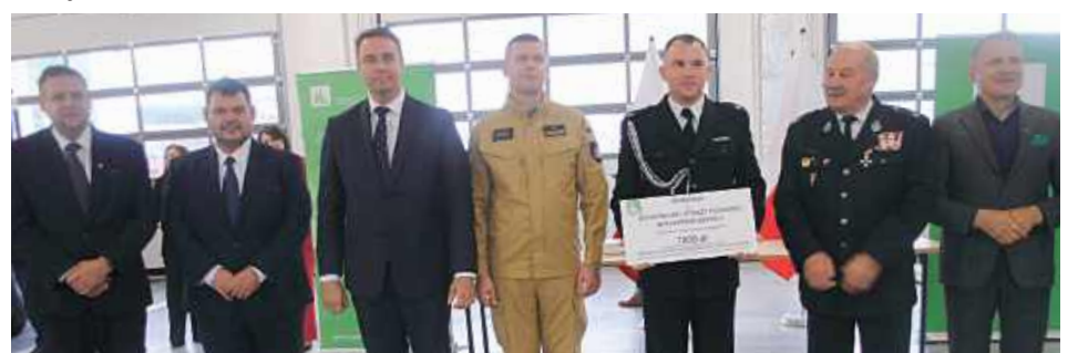
Dotacja dla OSP Rozkopaczew II