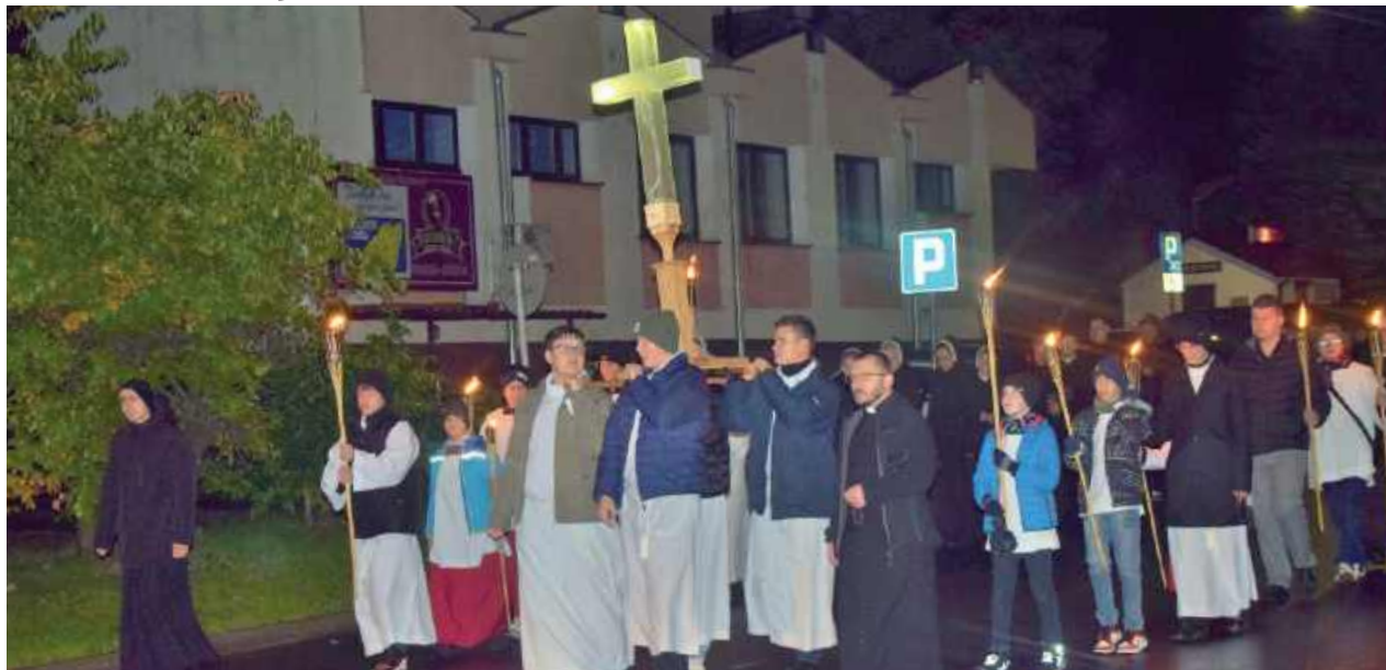
Na czele procesji niesiony był krzyż