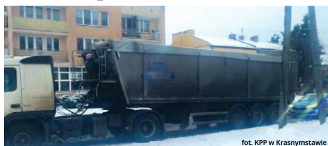
fol. KPP w Krasnymstawie

Podczas rutynowych czynności mundurowi od razu wyczuili, że z siadającym za kierownicą 61-letnim mieszkańcem gminy Izbica jest coś nie tak. Ich podejrzliwość co do stanu trzeźwości mężczyzny szybko się potwierdziły. Badanie alkometrem wykazało, że kierowca miał w orga-