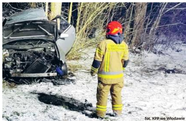
fol. KPP we Włodawie

Jak wynika ze wstępnych ustaleń funkcjonariuszy, 38-letni mężczyzna poruszał się drogą przez Macoszyn Duży, gdy nagle stracił panowanie nad pojazdem. Samochód zjechał