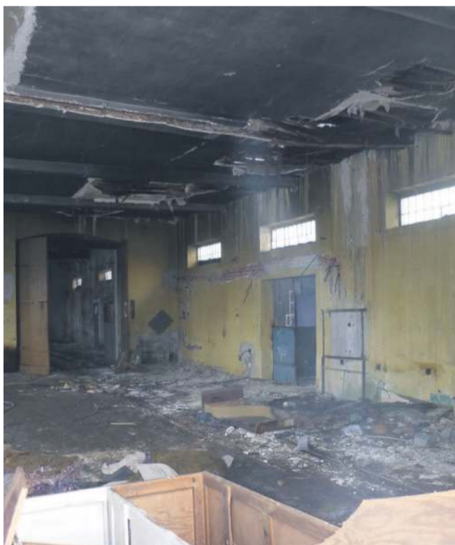
Zdjęcie zdewastowanej lokomotywni, opublikowane przez profil fb - Piotrkowska Kolej Wąskotorowa z 7 lutego 2018 roku.