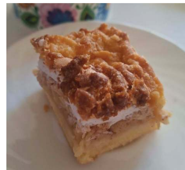
Prosty i pyszny jablecznik pani Asi