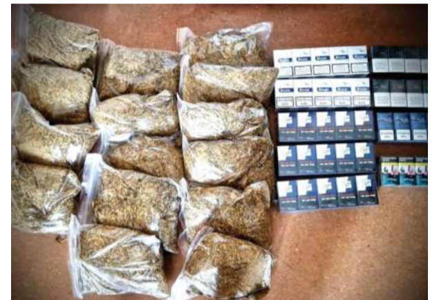
W trakcie przeszukania u mężczyzny znaleziono 1800 sztuk papierosów i ponad 7 kg krajanki tytoniowej