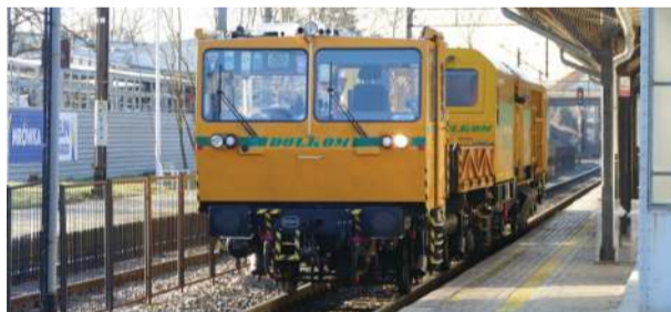
„Sisi” to nowoczesna szlifierka torowa Vulcano LGT 10M