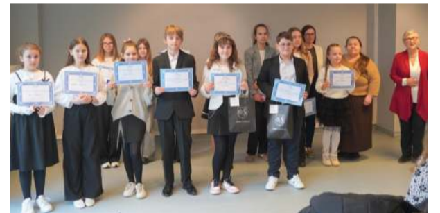
Pamiątkowe zdjęcie uczestników konkursu.