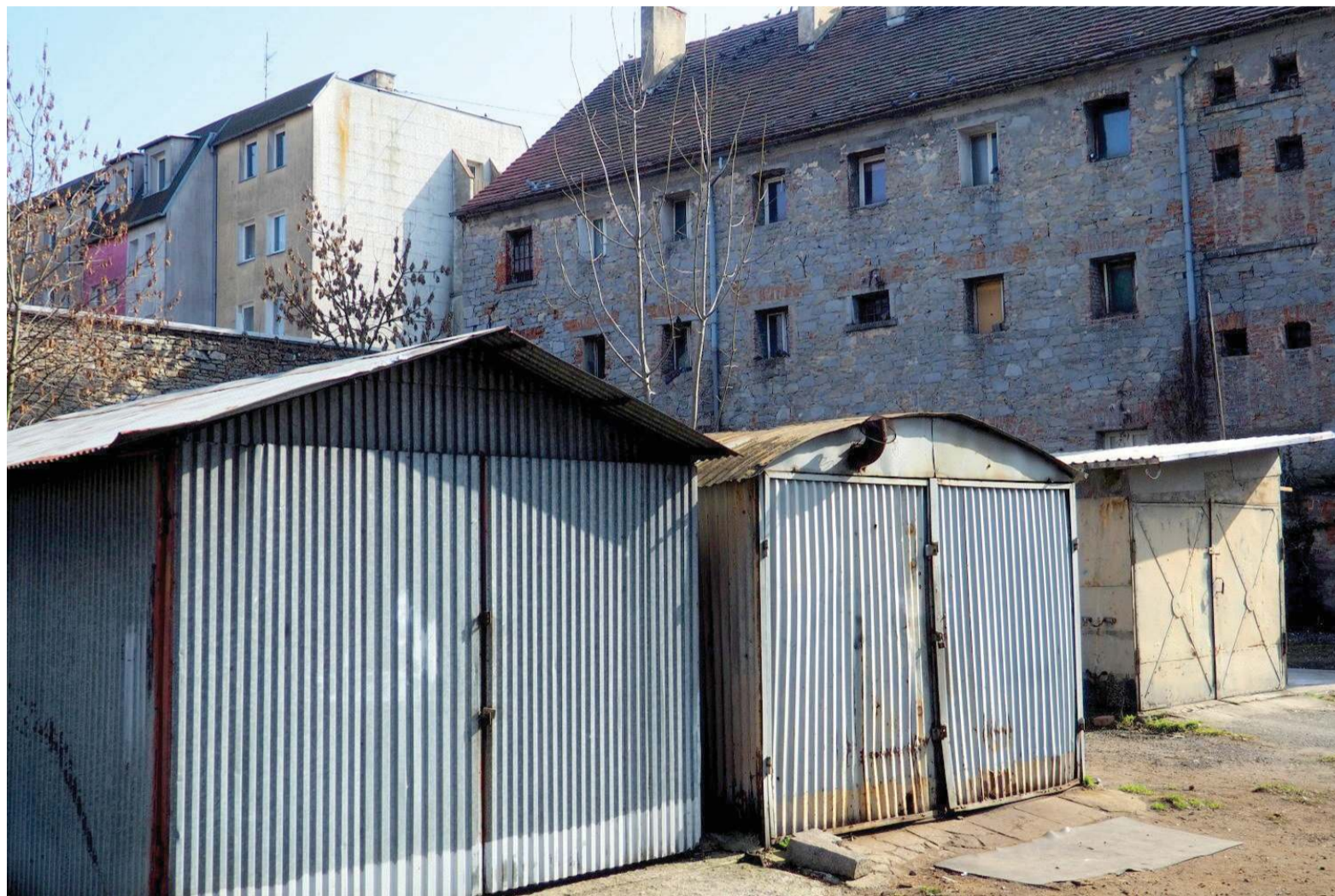
Blażane garaże koło „belwederu”