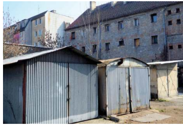
Blasowane garaże koło „belwederu”

„Belweder” to potoczna, ironiczna nazwa dawnego aresztu, który powstał pod koniec dziewiętnastego wieku. Do dziś kojarzony