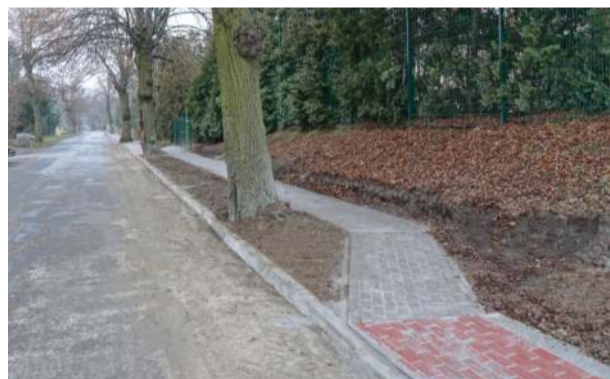
Chodnik w Wąwolnicy

Dankowicach - całkowita wartość inwestycji - 109 000 zł (udział finansowy gminy 59 000 zł, powiatu - 50 000 zł),