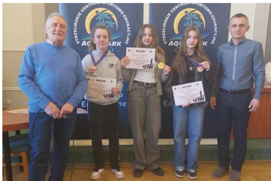
Najlepsze zawodniczki odebrały medale i dyplomy

Powiatu Strzelińskiego. Przy szachownicach spotkali się młodzi zawodnicy z różnych szkół powiatu strzelińskiego, którzy ponownie zaprezentowali wysoki poziom gry, koncentrację oraz prawdziwego ducha sportowej rywalizacji. Podczas dwudniowych zmagania rozegrano wiele emocjonujących partii. Każda z nich miała znaczenie nie tylko dla klasyfikacji indywidualnej, ale również drużynowej, ponieważ zdobywane punkty wpływały