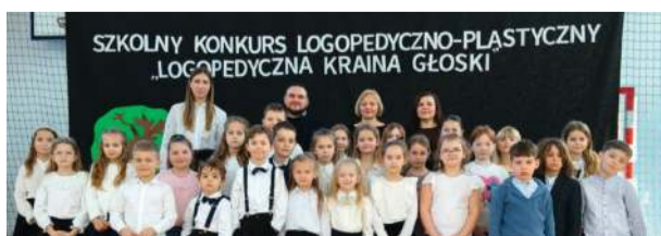
W konkursie udział wzięły dzieci z oddziału przedszkolnego i uczniowie klas I-III.