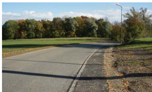
Utwardzenie pobocza w Dankowicach