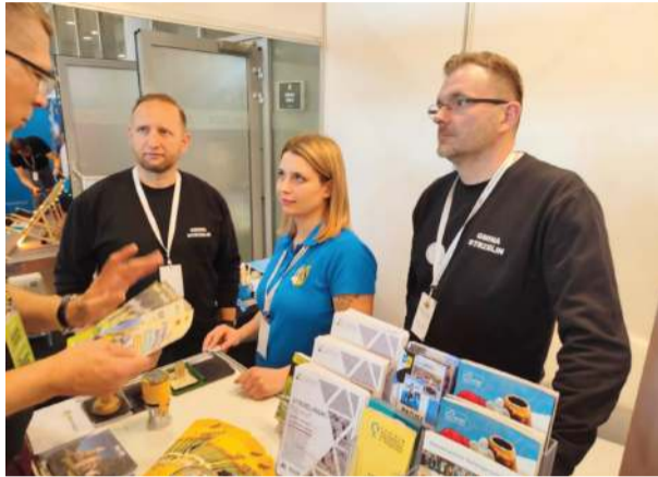
Reprezentacja Gminy Strzelin na ubiegłorocznych targach

W tym roku, po raz trzeci, będę obsługiwał stanowisko Gminy Strzelin i uważam, że mamy w naszej ofercie kilka poważnych atutów. Po pierwsze odbudowany ratusz, który oprócz poprawy walorów estetycznych miasta, jest także atrakcją turystyczną z ekspozycją historyczną w piwnicy oraz wspaniałą panoramą rozciągającą się z punktu widokowego wieży ratuszowej. Warto też podkreślić, że na