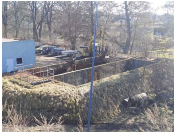
Z początkiem marca rozpoczęły się prace związane z przebudową stacji uzdatniania wody w Wiązowie.

Jak informuje sekretarz Agnieszka Puzyński, zakres prac obejmuje budowę tacy ociekowej wraz z wpustem ulicznym; przebudowę budynku technicznego, w tym demontaż całego układu