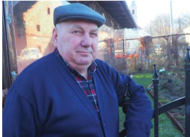
Pan Jan narzeka na biurokrację i powtarzanie czynności w pisaniu podań

dy nowi właściciele gospodarstw będą musieli płacić stuprocentowy podatek za stodoły i inne pomieszczenia gospodarcze. Istnieje wiele błędów, które trudno będzie naprawić – dodaje pan Jan.