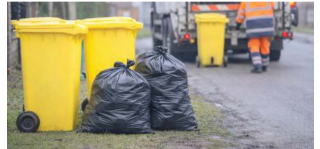
Dodatkowe worki nie zostały zabrane, a wielu mieszkańców podkreśla, że nikt wcześniej nie informował o obowiązku ich opisywania... Fot. ilustracyjne

W internetowej dyskusji nie brakowało głosów z różnych miejscowości gminy. Mieszkańcy Jegłowej i Krzywiny pisali, że worki nie zostały odebrane mimo wystawienia ich jak dotychczas. Część osób relacjonowała, że pracownicy je odbierający informowali dopiero na miejscu, iż worki muszą mieć dodatkową