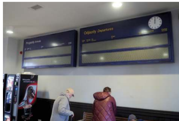
Od kilku miesięcy nie działają tablice informujące o rozkładach ruchu pociągów w holu dworca w Strzelinie

– Rzeczywiście wyświetlane informacje o przyjazdach ułatwiają nam życie. Teraz wszystko trzeba tłumaczyć podróżnym. Zgłaszaliśmy problem u administratora