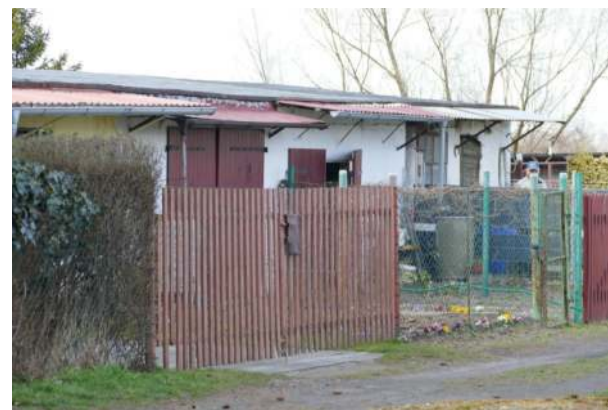
Od czego zależy wysokość podatku od nieruchomości w przypadku komórek lokatorskich?

Od 2025 r. komórki lokatorskie mogą więc korzystać z dużo niższej stawki podatku (jak budynki mieszkalne – w gminie Przeworno obecnie 1,25 zł/m 2 ), ale tylko wtedy,