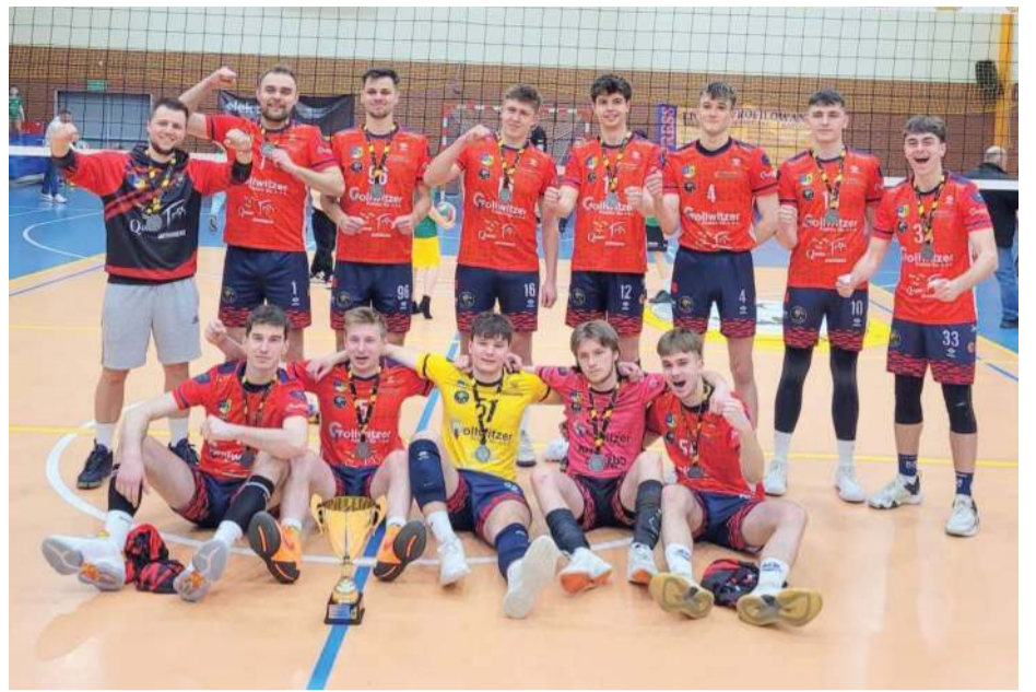
Siatkarze Tygrysów z pucharem za drugie miejsce

siatkarzy Tygrysów Strzelin to jednak jeszcze nie koniec rywalizacji w tym sezonie. Zarówno mistrz – BTS Bolesławiec, jak i wicemistrzowie ze Strzelina, będą reprezentować Dolny Śląsk w turniejach barażowych o awans na wyższy szczebel rozgrywkowy. W historii klubu tylko raz udało się Tygrysom przebrnąć przez baraże i wywalczyć awans. Kibice ze Strzelina liczą, że tym razem historia znów się powtórzy. Już samo drugie