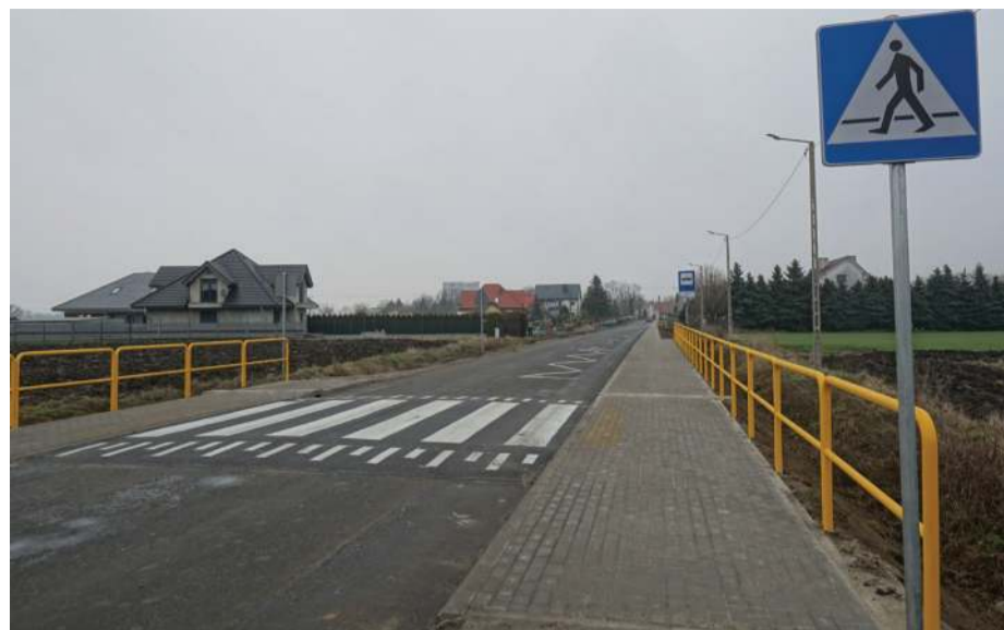
Chodnik w Górcu

Przebudowano chodnik na odcinku o dł. ponad 80