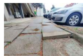
Tak w ubiegłym tygodniu wyglądał chodnik tuż przy starostwie

Przed budynkiem Starostwa Powiatowego w Strzelinie, tuż przy wejściu do Wydziału Komunikacji, znajduje się fragment chodnika, który jest niebezpieczny dla przechodniów. Kilka betonowych płytek mocno odstaje do góry – miejscami nawet o kilka centymetrów. Wystają tak mocno, że bardzo łatwo się o nie potknąć. Najprawdopodobniej przyczyną są korzenie drzewa ro-