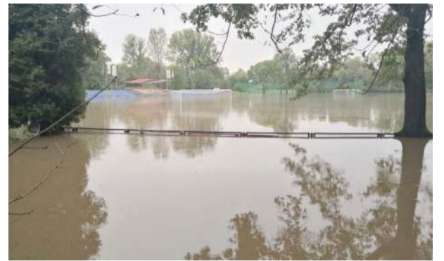
Podczas jesiennych powodzi w 2024 roku pod wodą znalazło się m.in. boisko w strzeleńskim parku.

instalacji nawadniającej oraz systemu drenażu, tak aby obiekt spełniał wymagania techniczne i zapewniał odpowiednie warunki do prowadzenia rozgrywek oraz treningów. Środki na realizację zadania pochodzą z dofinansowania pozyskanego z Ministerstwa Sportu i Turystyki w ramach programu wsparcia infrastruktury sportowej uszkodzonej