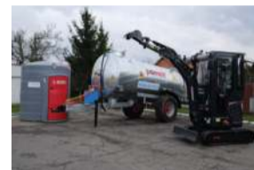
Strażacy zaprezentowali nowy sprzęt

– Chciałabym bardzo podziękować samorządowcom za ogromne zaangażowanie w realizacji tych zadań i za