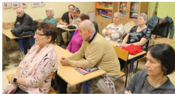
Największe zainteresowanie uczestników wzbudził temat SAFE, zagrożeń związanych z przekroczeniem progów zadłużenia oraz znaczenia złota i suwerenności finansowej

ręczny słownik ekonomiczny dla potrzeb współczesnego konsumenta”. Choć tytuł wykładu zapowiadał uporządkowanie podstawowych pojęć ekonomicznych, zasadniczą część spotkania skupiła się na sprawach znacznie szerszych: długu publicznym, deficycie budżetowym, unijnych procedurach nadmiernego zadłużenia oraz mechanizmie SAFE i jego potencjalnych skutkach dla Polski.