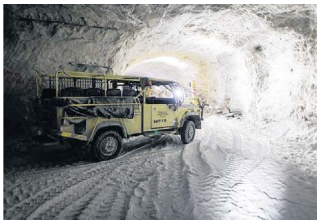
Mamy ogromne złoża soli kamiennych. Mimo to przegrywamy z zagranicznymi podmiotami, które oferują znacznie niższe ceny

– Możliwości produkcyjne kopalń w krajach UE są niewykorzystane, dlatego rynek polski narażony jest na napływ taniego produktu. Z powodu niskiego poziomu cen następuje również wypieranie polskiego „eksportu” soli do takich krajów, jak: Niemcy, Czechy, Słowacja, Węgry oraz kraje nadbałtyckie. Producenci niemieccy, K+S, SUD Salz, stanowią potężną konkurencję dla wszystkich produktów Kopalni Soli