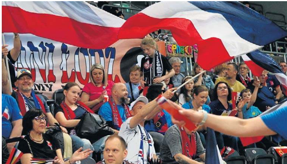
Komplet widzów w Sport Arenie obserwował zwycięski mecz PGE Budowlanych