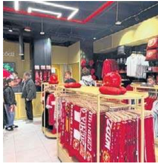
Straty w sklepie Widzewa wyceniono na 400 tys. zł

- Obaj nie przyznali się do winy. Ich motywacja nie jest