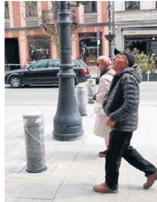
Słupki na Piotrkowskiej - trudno znaleźć ich zwolennika, za to obaw, pytań i wątpliwości jest mnóstwo