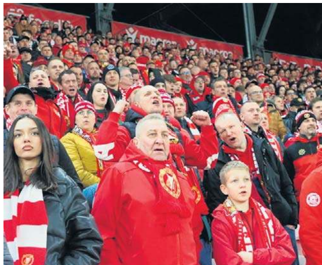
Smutne twarze kibiców Widzewa, którzy w tym sezonie nie mają najmniejszych powodów do radości...

30. kolejka: 26.04: Widzew Łódź - Motor Lublin (14.45)