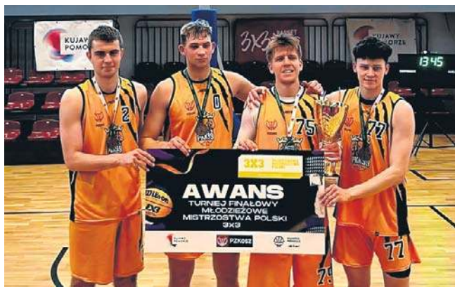
Czwórka pabianickich muszkieterów, która grała świetnie

Turniej stał na wysokim poziomie sportowym, a rywalizacja była zacięta do samego końca. Drugie miejsce wywalczyła drużyna ŁKS, natomiast na najniższym stopniu podium uplasował się drugi zespół z Pabianic.