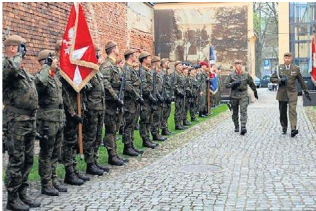
Uroczystości odbyły się na dziedzińcu Muzeum Regionalnego w Radomsku, gdzie w 1946 roku był areszt UB

Dziennik Łódzki ☎ 42 715 80 68 bok.prenumerata@polskapress.pl prenumerata.dzienniklodzki.pl