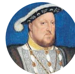
OBRAZ HANSA HOLBEINA MŁ.

Henryk VIII Tudor (na grafice) został królem Anglii. Był jednym z najwybitniejszych władców (Anglii)