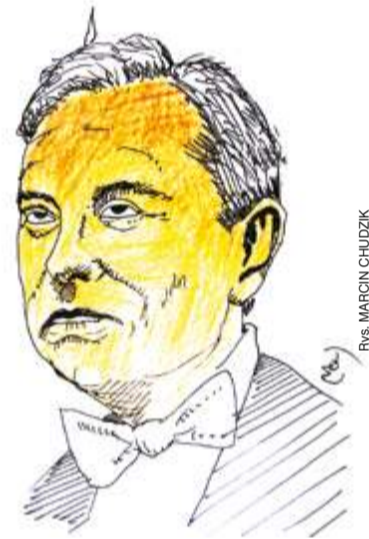
rys. MARCIN CHUDZIK

widu wiele urzędów pracowało zdalnie) i nie możemy dać ci pełnej pewności co do zachowania twojego stanowiska, ale jeśli zostanie wyeliminowane, będziesz potraktowany z godnością. I jeszcze, że oferta jest ważna do 6 lutego, wystarczy odesłać maila, wpisując w temacie Rezygnuję . Koncept, iż tak potężna instytucja jak państwo amerykańskie nie może funkcjonować bez państwowych urzędników, najwyraźniej nie zawiał do elonowego rozumku.