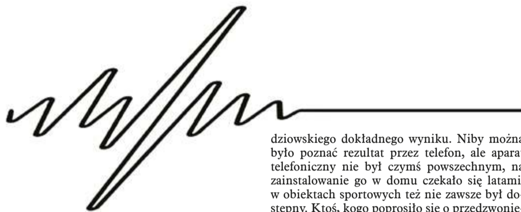
Ilustr. KRZYSZTOF OLEJNIK

Trudno pisać o zmarłych, zwłaszcza żywym tekstem.