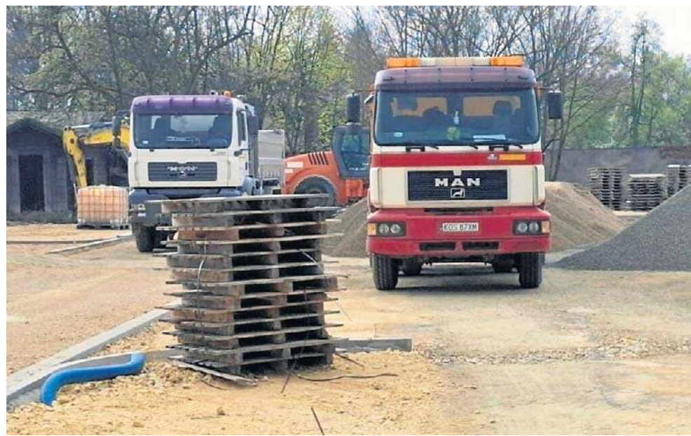
Przy ul. Więźniów Oświęcimia powstaje nowy parking. Planujemy oddać go do użytku w czerwcu - informuje przedstawiciel inwestora