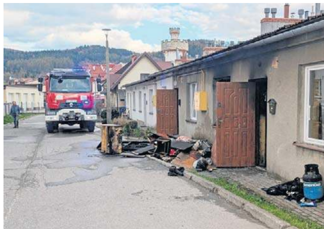
Miejsce pożaru w Krynicy-Zdroju. W szpitalach zmarło dwóch mężczyzn, którzy byli w palącym się mieszkaniu

Śledztwo wyjaśni okoliczności zdarzenia. ©