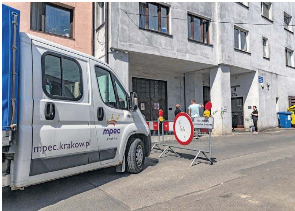
Blok przy Centralnej 73B to samowola budowlana, wydano decyzję o rozbiórce

Mieszkania przy ul. Centralnej 73B to niewielkie lokale jedno-, dwupokojowe. Są stosunkowo niskie, na klatkach schodowych można sięgnąć sufitu, podnosząc rękę, nawet ugiętą. Za to ceny za wynajem są bardzo konkurencyjne, dlatego wszystkie mieszkania są zamieszkałe. Za około 20-metrowe mieszkanie lokatorzy płacą 1700 zł plus czynsz i media. Całość wynosi około 2600 zł. Za nieco większe ceny są np. 2000 zł plus media. W tej okolicy równie tanie lokale trudno byłoby znaleźć.