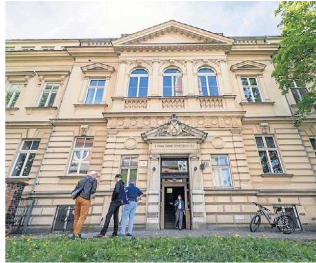
Kopernika 15 - warto zapamiętać ten adres. Tu będzie się mieścić Dom Literatury i Języka

Harmonogram zakłada, że na przełomie lat 2028/2029 budynki przy ul. Kopernika 15 zostanie oddany do użytku. Remont zakłada wymianę wszystkich instalacji, maksymalne