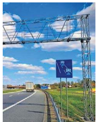
Autostrada A4. Nowy odcinkowy pomiar już działa

- To jeden z najbardziej wypadkowych odcinków na A4