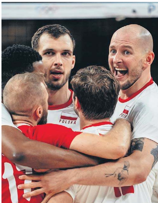
Wszystko wskazuje na to, że tych panów nie zobaczymy w tym sezonie w naszych barwach narodowych...