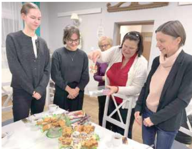
W podziękowanie uczniowie i ich opiekunowie zostali obdarowani ręcznie wykonanymi ozdobami świątecznymi