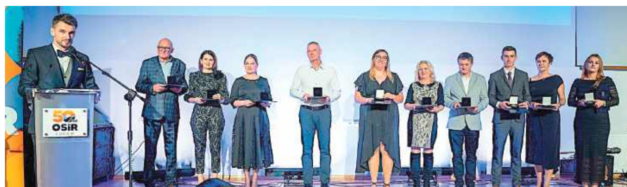
W trakcie uroczystości wręczono wyróżnienia zasłużonym pracownikom, partnerom i instytucjom współpracującym z OSiR