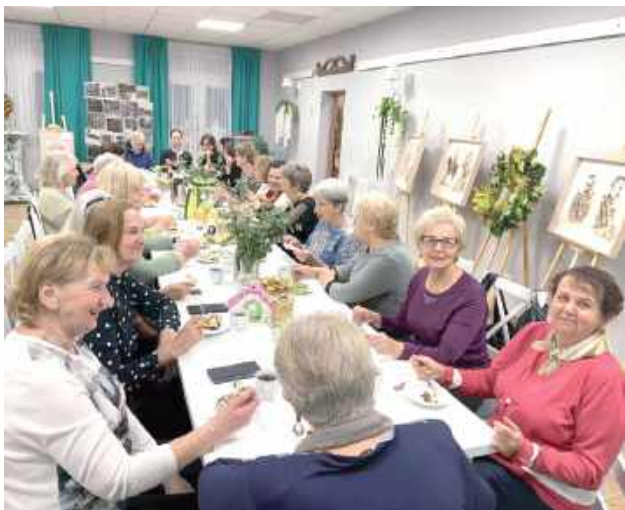
Wspólny poczęstunek przy stole

Uczniowie Zespołu Szkół nr 2 w Łukowie przygotowali dla seniorów smaczną niespodziankę.