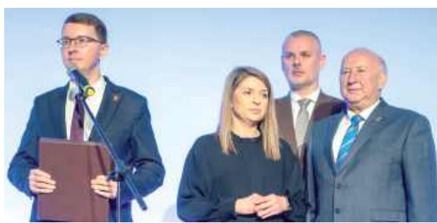
Z okazji Jubileuszu gratulacje pracownikom OSiR złożyli m.in. radni PiS z Rady Miasta