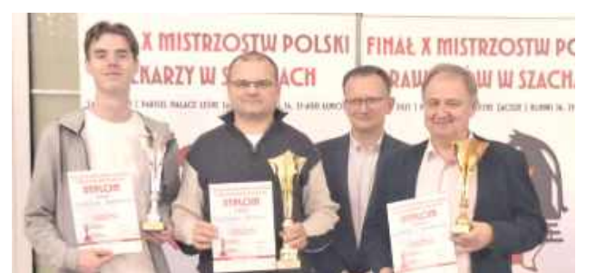
Najlepsi otrzymali dyplomy i puchary

Krajowa Izba Komunikacji Ethernetowej, Województwo Lubelskie, Krajowa Grupa Spożywcza S.A., Polski Związek Szachowy, Parisel Palace Leśne Zacisze.