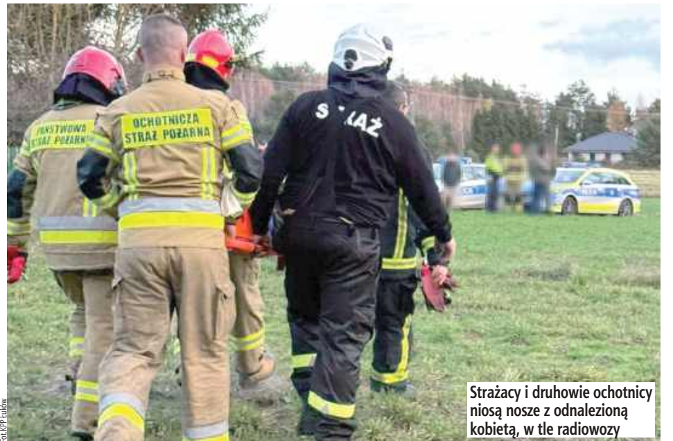
Strażacy i druhowie ochotnicy niosą nosze z odnalezioną kobietą, w tle radiowoz

Po kilku godzinach intensywnych działań odnaleziono zaginioną 73-latkę. Okazało się, że kobieta utknęła w zaroślach, na bagnistym terenie i od dwóch dni nie mogła się z nich wydostać. Przy pomocy specjalistycznego sprzętu wydostano z nich seniorkę, przekazano ją personelowi karetki pogotowia. Na szczęście pomoc przyszła w porę, zdrowie i życie 73-latki