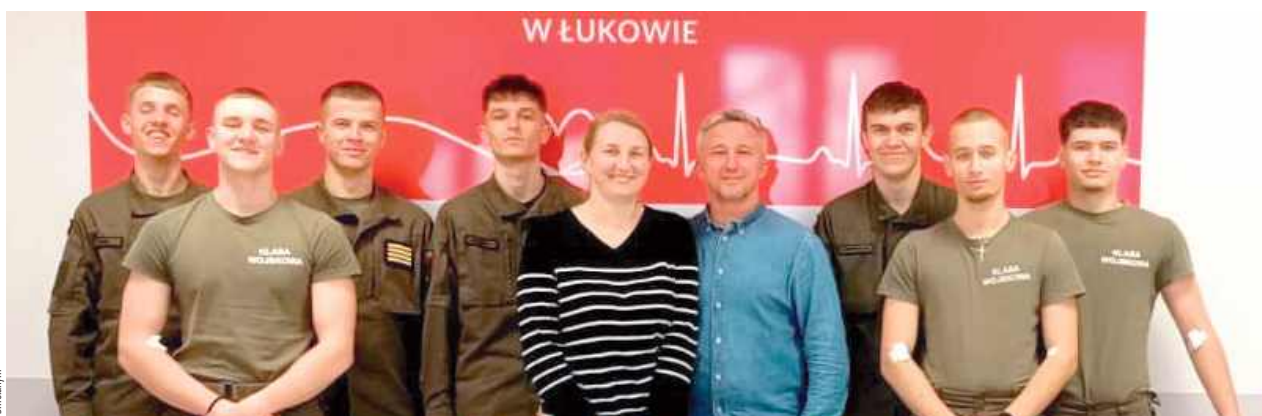
Uczniowie z nauczycielami oddali krew, wspierając pacjentów wymagających transfuzji

Chętni do wsparcia Agatki mogą zgłosić się do oddziału RCKiK w Łukowie i przy