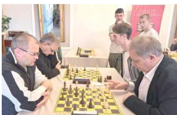
W Turnieju wzięło udział 48 zawodników z całej Polski