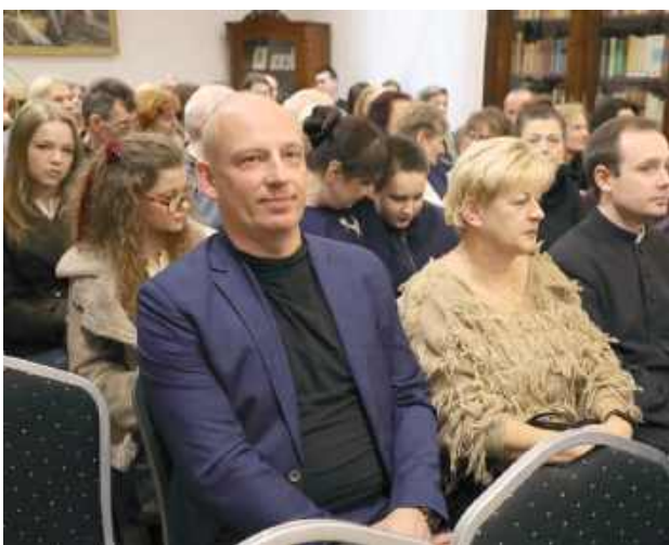
Na koncert przybyło liczne grono słuchaczy