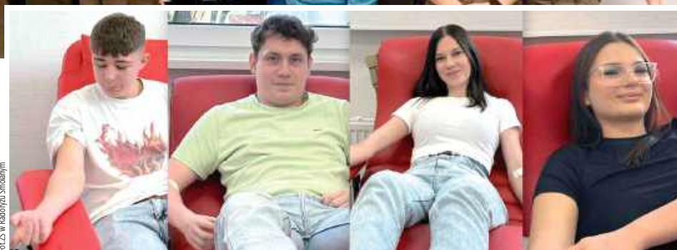
mo Młodzież zachęca innych do odwiedzenia Regionalnego Centrum Krwiodawstwa i Krwiolecznictwa w swojej miejscowości