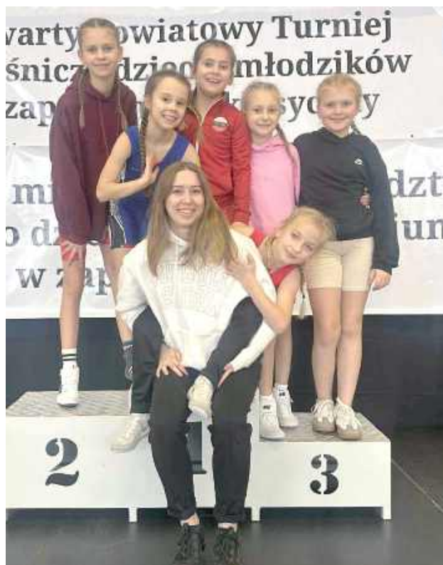
Rosną nam talenty. Zawodniczki Armat zakończyły mistrzostwa z medalami!