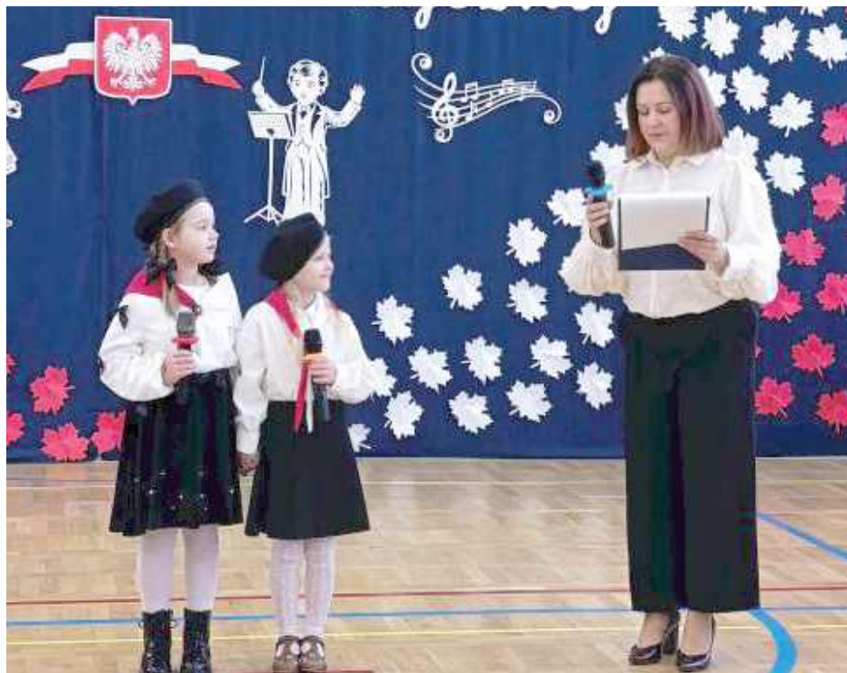
Do przeglądu przystąpiły: ZSP w Trzebieszowie Drugim, ZSP w Dębownicy, szkoły podstawowe w Celinach, w Szaniawach-Matysach, Szkoła Podstawowa w Jakuszach

Uroczystość uświetnił „Taniec dla Niepodległej” w wykonaniu uczniów klasy trzeciej.