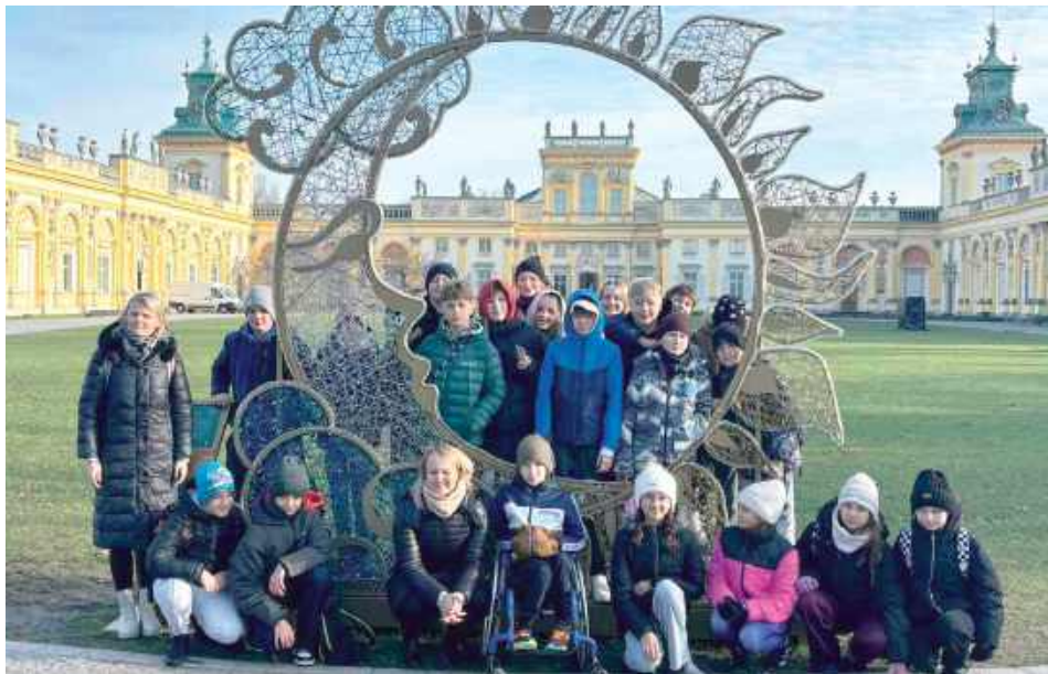
Uczniowie wzięli udział w warsztatach pt.: „Sobie gramy - król Jan i jego track lista” oraz „Roztańczony dwór”, które miały miejsce w Muzeum Pałacu Króla Jana III w Wilanowie

19 listopada uczniowie klasy szóstej z SP w Stoczku Łukowskim po raz kolejny mieli okazję rozwijać swoje pasje artystyczne. Tym razem wybrali się na edukacyjną wycieczkę do Warszawy.