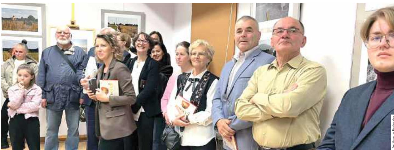
mo Młody artysta fotografik ma liczne grono sympatyków, którzy życzyli mu dalszej owocnej pracy i wielu pomysłów na zdjęcia