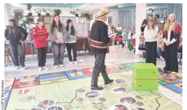
Powstała wielkoformatowa gra planszowa XXL poświęcona tradycjom, postaciom i zwyczajom gminy Wojcieszów

Istotnym etapem były również warsztaty edukacyjne w szkołach związane z lokalną kulturą, w których uczestniczyło ponad 300 uczniów. Spotkania pozwoliły młodszym mieszkańcom gminy poznać historię lokalnych strojów ludowych, symbolikę kolorów i wzorów oraz znaczenie tradycji w budowaniu tożsamości kulturowej. Zwieńczeniem projektu był „Dzień Tradycji Wojcieszkowa” – wydarzenie, podczas którego zaprezentowano efekty wszystkich działań: stroje ludowe, grę planszową,