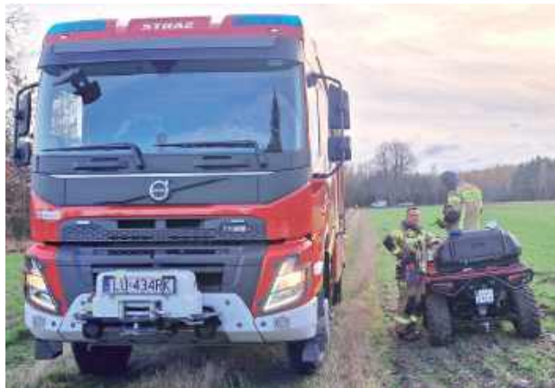
W poszukiwaniach brali udział strażacy zawodowi i druhowie ochotnicy z quadami

Z przekazanej relacji wynikało, że kobieta od kilku dni nie była widziana ani przez sąsiadów, ani też przez jej najbliższych. Skierowani do jej domu policjanci sprawdzili zabudowania posesji i ich najbliższe okolice. Ustalenia mundurowych i chłodna, jesienna aura wskazywały na wielkie prawdopodobieństwo zagrożenia zdrowia, a nawet życia seniorki