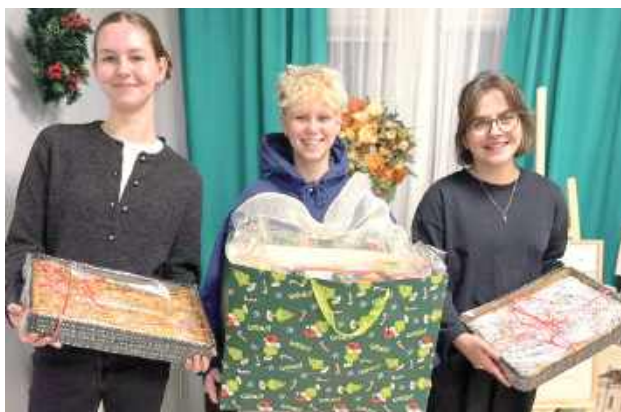
Uczniowie z Zespołu Szkół nr 2 w Łukowie przygotowali zbiórkę herbat oraz upiekli ciasta, aby podarować je seniorom