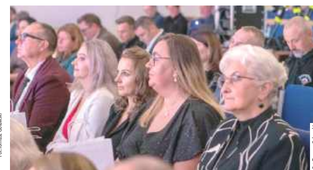
Uroczystość zgromadziła liczne grono sympatyków OSiR