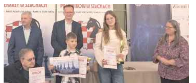
Dzieci także grają w szachy - królewska gra ma się dobrze!