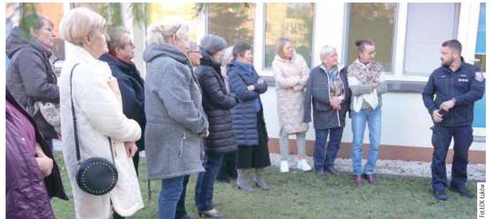
Uczestnicy rozmawiają o potencjalnie niebezpiecznych sytuacjach oraz uczą się prawidłowego reagowania na nie

Sluchacze Łukowskiego Uniwersytetu Trzeciego Wieku biorą udział w cyklu warsztatów z samoobrony organizowanych we współpracy z Komendą Powiatową Policji w Łukowie. Uczą się jak reagować w sytuacjach zagrożenia oraz jak zwiększać własne bezpieczeństwo na co dzień.