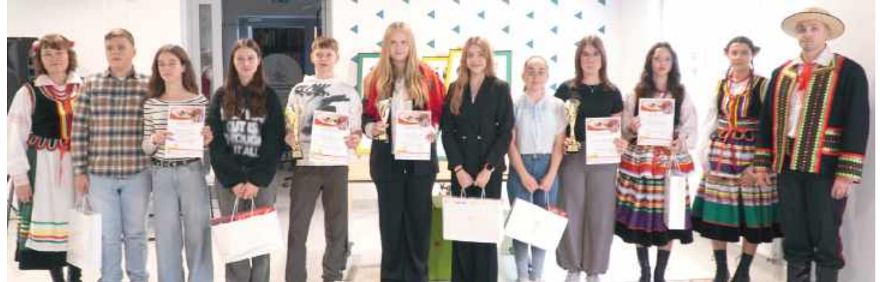
Projekt „Z kulturą do przyszłości” był realizowany przez Gminną Bibliotekę Publiczną w Wojcieszowie