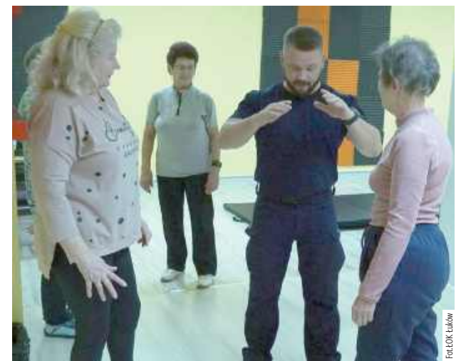
Panie uczą się samoobrony

Zajęcia z samoobrony są okazją do zdobycia praktycznych umiejętności, ale również do zwiększenia pewności siebie i świadomości w zakresie osobistego bezpieczeństwa.