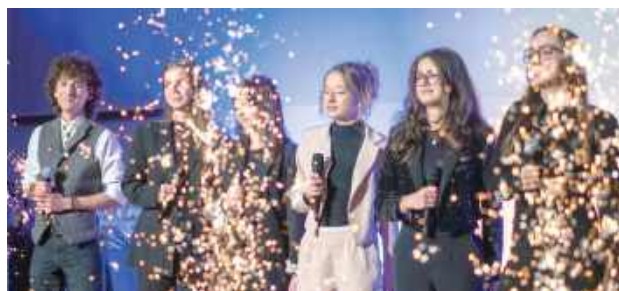
Gałę uświetniły występy zespołu ŁOK'ej Band oraz wokalistów Fabryki Piosenki