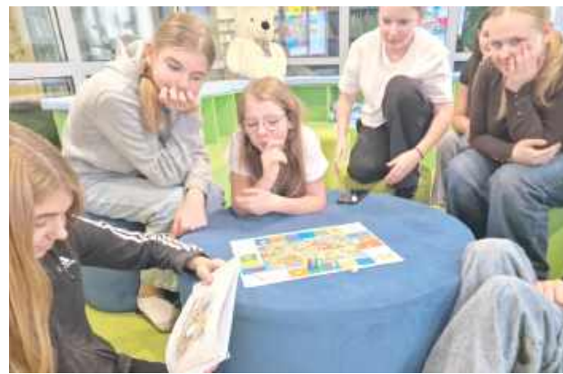
Uczestnicy projektu brali udział w tworzeniu elementów nowoczesnych narzędzi edukacyjnych