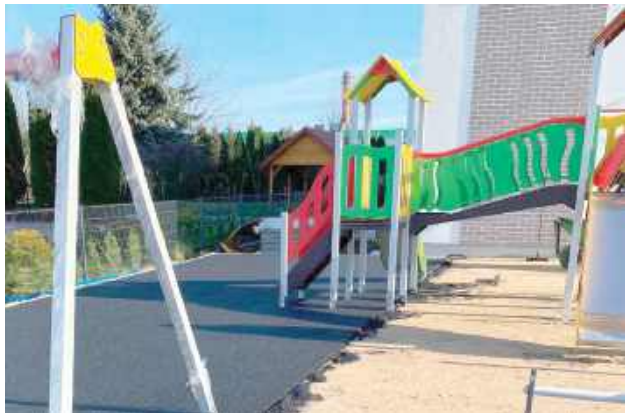
W ostatnim tygodniu wykonawca firma MAL-POL zrealizowała montaż urządzeń na placu zabaw i ułożyła bezpieczną, amortyzującą nawierzchnię

Przy ulicy Ostrobramskiej powstaje nowoczesny kompleks żłobkowo-przedszkolny. Prace przebiegają zgodnie z harmonogramem, zaawansowanie robót wynosi 50,7 proc.