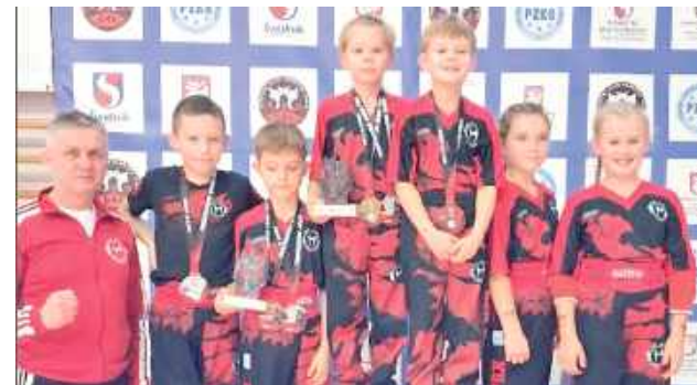
W kategorii dzieci zawodnicy KSW Łuków zdobyli łącznie siedem medali, w tym dwa złote