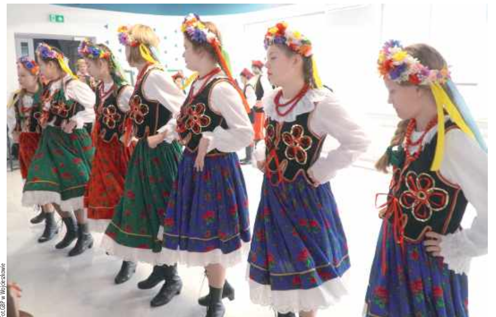
Dzięki projektowi powstały piękne stroje ludowe z zachowaniem elementów charakterystycznych dla naszego regionu

Uczestnicy projektu wzięli udział w procesie projektowania, szycia strojów oraz tworzenia elementów nowoczesnych narzędzi edukacyjnych. Jednym z nich była wielkoformatowa gra planszowa XXL poświęcona tradycjom, postaciom i zwyczajom gminy Wojcieszów. W ramach jej promocji odbył się Gminny Turniej dla uczniów szkół pod-