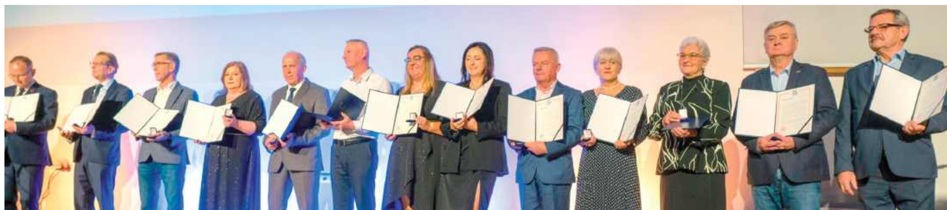
Pamiętkowe listy dla osób współpracujących z OSiR-em w ciągu 50-lecia