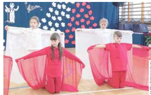
Uroczystość uświetnił „Taniec dla Niepodległej” w wykonaniu uczniów klasy trzeciej