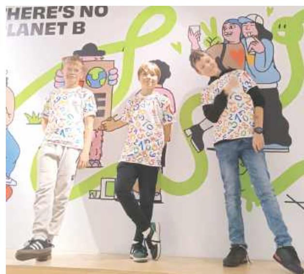
Uczestnicy zdobyli nową wiedzę o ekologii, oszczędzaniu

GMINA KRZYWDA: Uczniowie Zespołu Szkół w Krzywdzie ramach działalności Szkolnej Kasy Oszczędności wraz ze swoimi opiekunkami uczestniczyli w niezwykle ciekawej wycieczce, którą zorganizowano przy wsparciu Banku Polskiego - SKO zaproponowało im świetną miejscówkę.