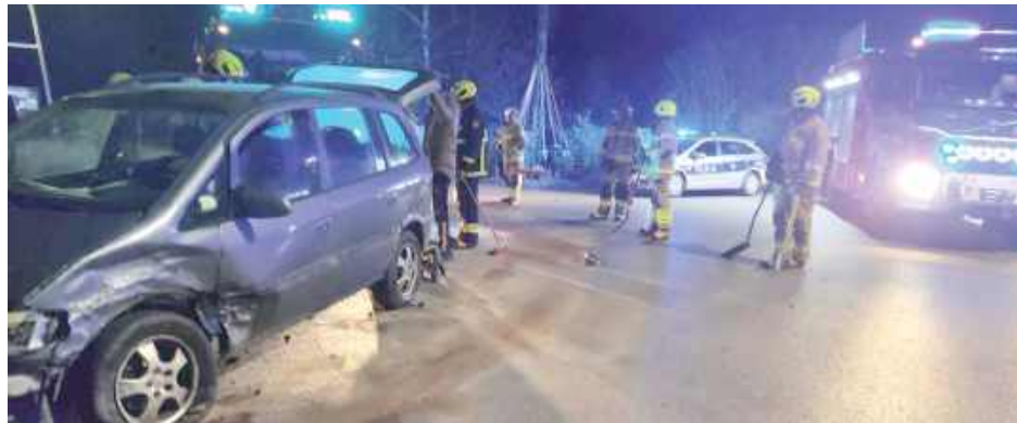
15 listopada w miejscowości Wola Burzecka o godzinie 18.59 zderzyły się dwa samochody osobowe

Strażacy zabezpieczyli miejsce zdarzenia, odłączyli akumulatory w pojazdach, a także uprzątnęli jezdnię z pozostałości pokolizyjnych, przywracając bezpieczny przejazd.