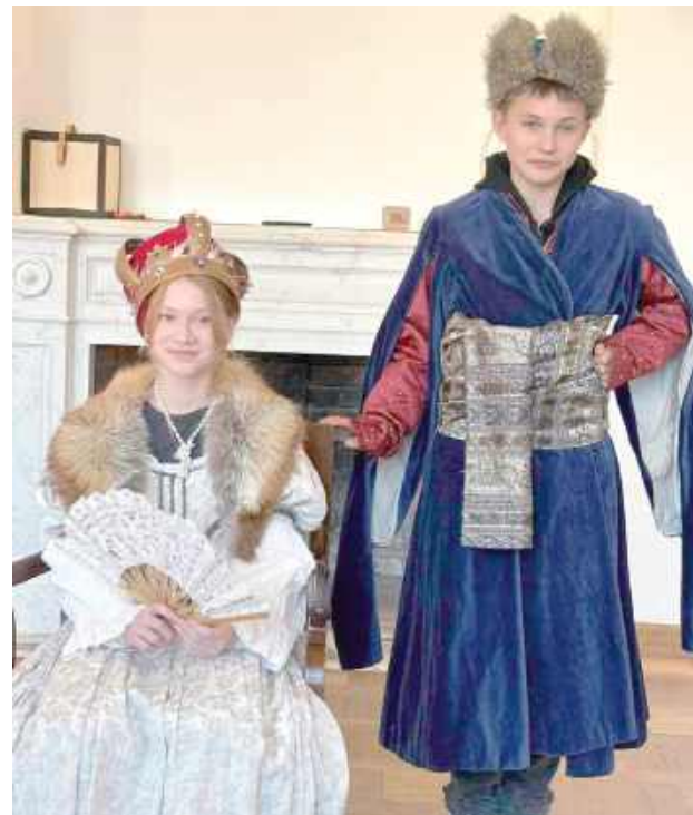
Prezentacja w strojach

Następnie młodzież udała się do miejsca, które przewodnicy nazywają „najszczęśliwszym w Warszawie”. Tam uczniowie odwiedzili Muzeum Łowiectwa