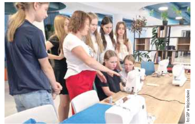
Młodzi uczestnicy po przeszkoleniu sami szyli stroje ludowe na maszynach krawieckich