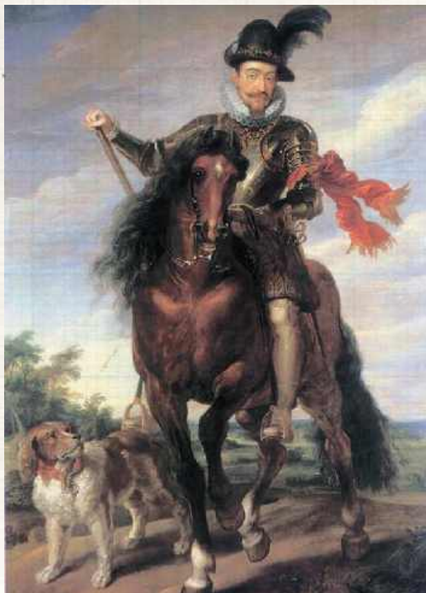
Zygmunt III na koniu, portret z około 1624 roku namalowany pewnie przez jednego z uczniów Rubensa

później konfederaci barscy przy próbie porwania ukorzą się ostatecznie przed mocno wątpliwym skądinąd majestatem Stanisława Augusta... Nikogo nie zdziwiło, że sprawcę zgładzono, mimo że sam król apelował o łaskę. Zdziwienie budziło nadzwyczajne okrucieństwo egzekucji. A także błyskawiczne niemal tempo załatwienia sprawy. Dysku-