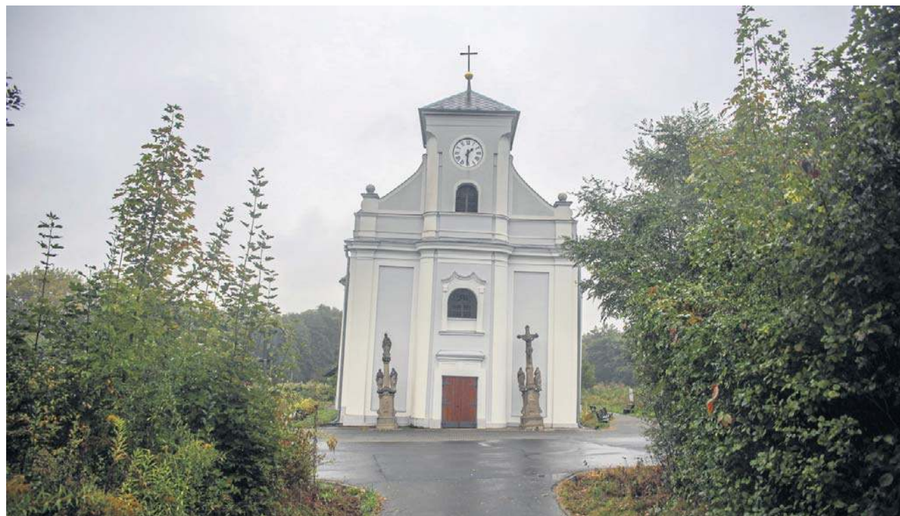
Tak wygląda tytułowy „Krzywy kościół” – jedyny budynek, który zachował się na terenie starej Karwinie