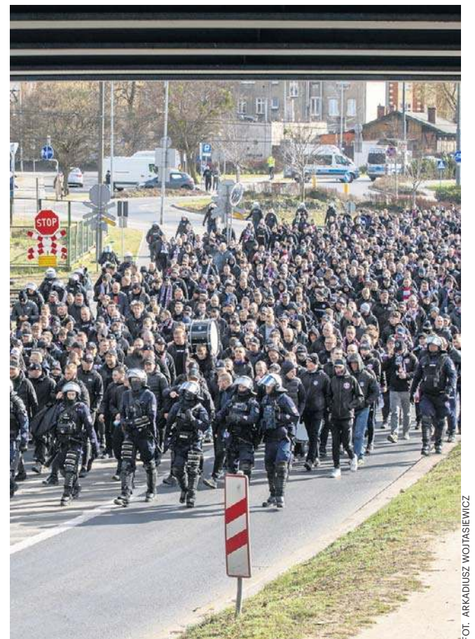
Śląsk idzie na Gdańsk. Tak było w środę przed meczem Zawisza - Górnik. Na stadionie zasiadło 20 000 kibiców, 2000 przyjechało dopingować swoją drużynę. Nasi ulegli gościom 0:1, ale pokazali charakter i dali nadzieję, na przyszłe sukcesy. Niebiesko-czarni rycerze