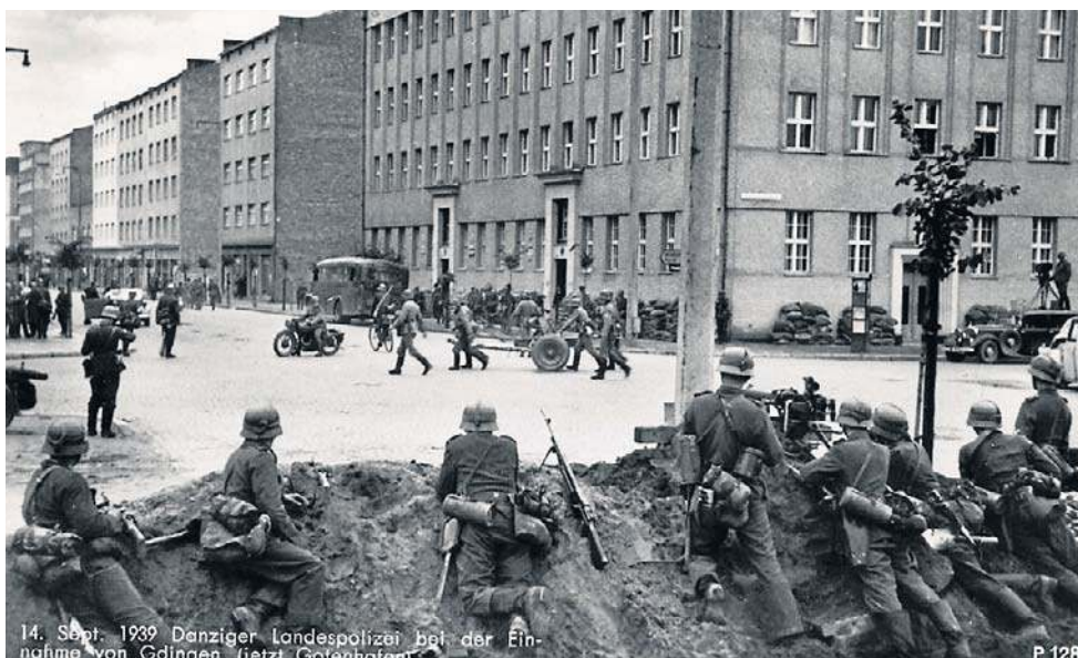
Koniec walk o Gdynię w 1939 roku został uwieczniony przez Niemców na propagandowej pocztówce

fotografów znaleźć można zresztą w albumie.