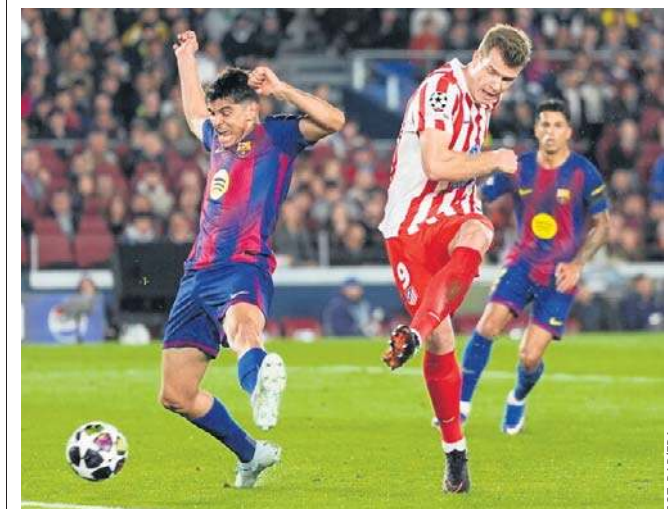
W taki sposób Alexander Sorloth strzelił drugiego gola dla Atletico w meczu z Barceloną. W rewanżu w Madrycie emocji na pewno nie zabraknie

23. kolejka 4. Ligi Kujawsko-Pomorskiej: sobota - Victoria Czernikowo - Łokietek Brześć Kujawski (godz. 11), Start Pruszcz - Lech Rypin (12), Unia Solec Kujawski - Wisła Dobrzyń nad Wisłą (14), Kujawiak Kowal - Chemik Bydgoszcz (14), Unia Gniewkowo - Orleń Aleksandrów Kujawski (15), Unia Wąbrzeźno - Mustang Ostaszewo (16), Pogoni Mogilno - Cuiavia Inowrocław (16), Piast Kołodziejewo - Sparta Brodnica (16). Pauzuje Noteć Łabiszyn.