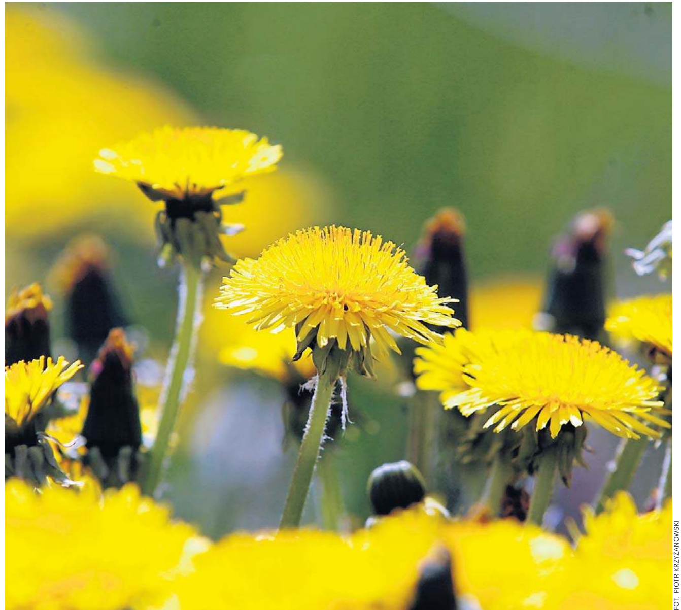
Mniszek lekarski zwany popularnie mleczem kryje w sobie niezwykle bogactwo zdrowia

Gwiazdnica, mimo delikatnej aparycji, to prawdziwa twardzielka. Potrafi rosnąć w naszym klimacie cały rok – w grudniu na Helu można było podziwiać całe jej donice – a po dwóch miesiącach ostrej zimy, znowu wychodzi spod śniegu i kwitnie. Jeden okaz wytwarza około 15 000 nasion,