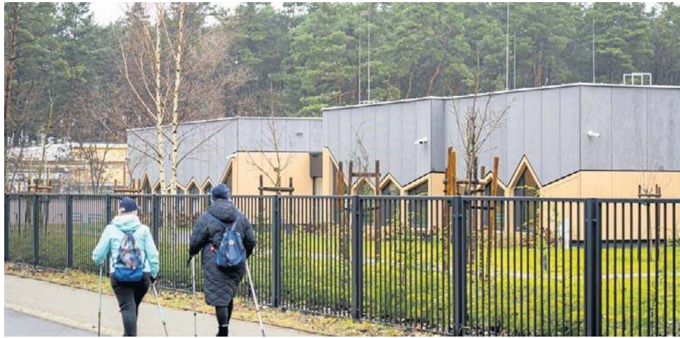
Przedszkole na terenie Bydgoskiego Parku Przemysłowo-Technologicznego zostało otwarte we wrześniu 2024 roku

W czwartek, 2 kwietnia do sprawy wypowiedzenia umowy najmu fundacji odniosły się bezpośrednio władze BPPT.