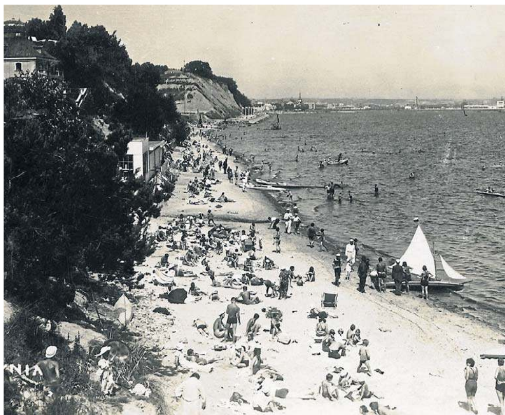
„Gdynia między bulwarem a Polanką Redłowską. Wydawca: Fot. L. Durczykiewicz