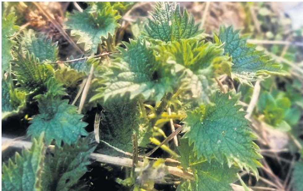
Gnojówka z pokrzywy to ogrodnicze złoto. Wiosną młode listki warto dodać do sałatki

Młode liście pokrzywy dokładnie umyj i przelej wrzątkiem. W garnku rozpuść masło, dodaj pokrojoną w kostkę cebulę i czosnek, obrane i pokrojone w kostkę ziemniaki i marchew. Podsmaż chwilę i zalej gorącym bulionem. Gotuj około 20 minut. Dodaj pokrzywę do zupy i gotuj kolejne 5 minut. Po zdjęciu z ognia zmiksuj całość blenderem. Dodaj śmietanę, sól, pieprz, szczyptę gałki muskatołowej i trochę soku z cytryny. Podawaj z jajkami na twardo, groszkiem ptysiowym albo grzankami.