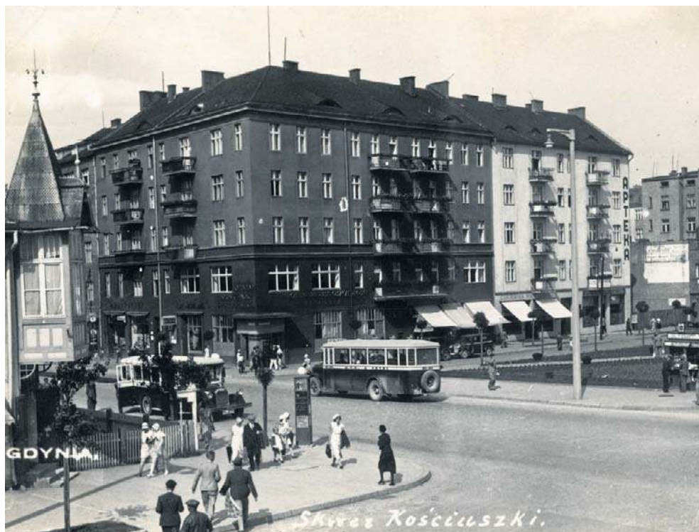
„Gdynia. Skwer Kościuszki”