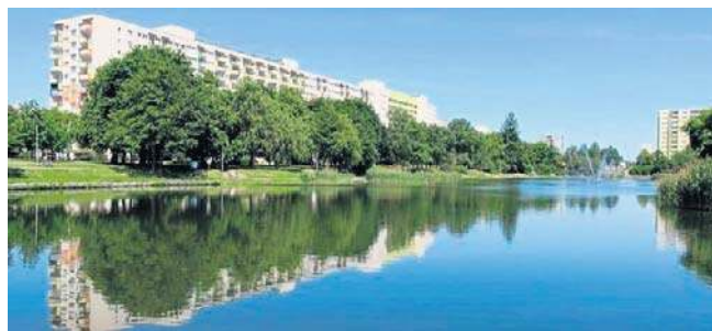
Razem odkryjemy historię wyjątkowych bloków na Bartodziejach

Być może to Twoja historia trafi do gazety! Zapraszamy mieszkańców galeriowców przy ul. Skłodowskiej-Curie 25 i 56 na spotkanie z dziennikarzem redakcji „Gazety Pomorskiej” i „Expressu Bydgoskiego”. To już ponad pół wieku naszych bydgoskich MEGABLOKÓW na Bartodziejach! Podziel się swoją historią! Liczymy na wspomnienia, opowieści, ciekawostki! Jak się tu mieszkało kiedyś, jak się mieszka teraz? Już 11 kwietnia o godz. 11.00 na skwerze przy Balatonie. Kto pamięta, kiedy w Balatonie można było się kąpać? Jak mieszkało się tu kiedyś, jak mieszka się dzisiaj? Czekamy i liczymy na historie życia do spisania! ©©