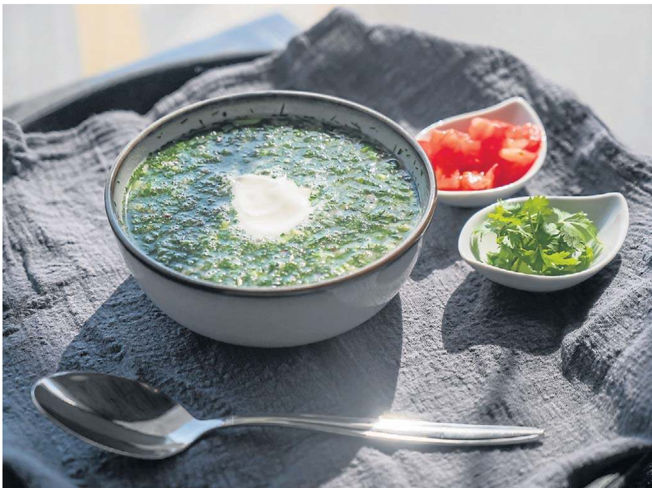
Zupa z pokrzywy, jest pyszna, ale królowa poparzeń to bardzo silne zioło, trzeba zachować umiar w jej spożywaniu

N azewnątrz ciepło i przybywa słońca, więc chętniej wychodzimy na świeże powietrze – na łąkę, do lasu czy na spacer do parku. Tam można znaleźć nieoczywiste, a jednocześnie powszechnie dostępne składniki do naszych codziennych potraw. Na początku trudno sobie wyobrazić, że jakieś zielsko „spod płotu” może w ogóle wyłądować na naszym talerzu. Musimy jednak pamiętać, że jeszcze kilkadziesiąt lat temu to dzikie rośliny stanowiły olbrzymią część diety polskich chłopów, a w czasie II wojny uratowały życie niejednej rodzinie, stojącej na progu śmierci głodowej. Być może wspomnienie tych cza-