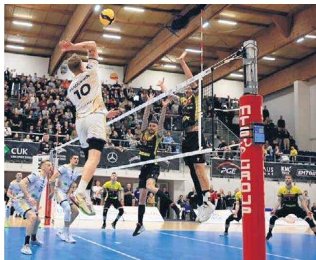
Przy wielkim aplauzie kibiców Anioły pewnie wygrały z Avią w pierwszym meczu pierwszej rundy play offów

Z kolei Metalkas Pałac Bydgoszcz drugi mecz o siódmą pozycję z Chemikiem Police rozegra dopiero w poniedziałek. Pierwszy wygrał 3:2. ©©