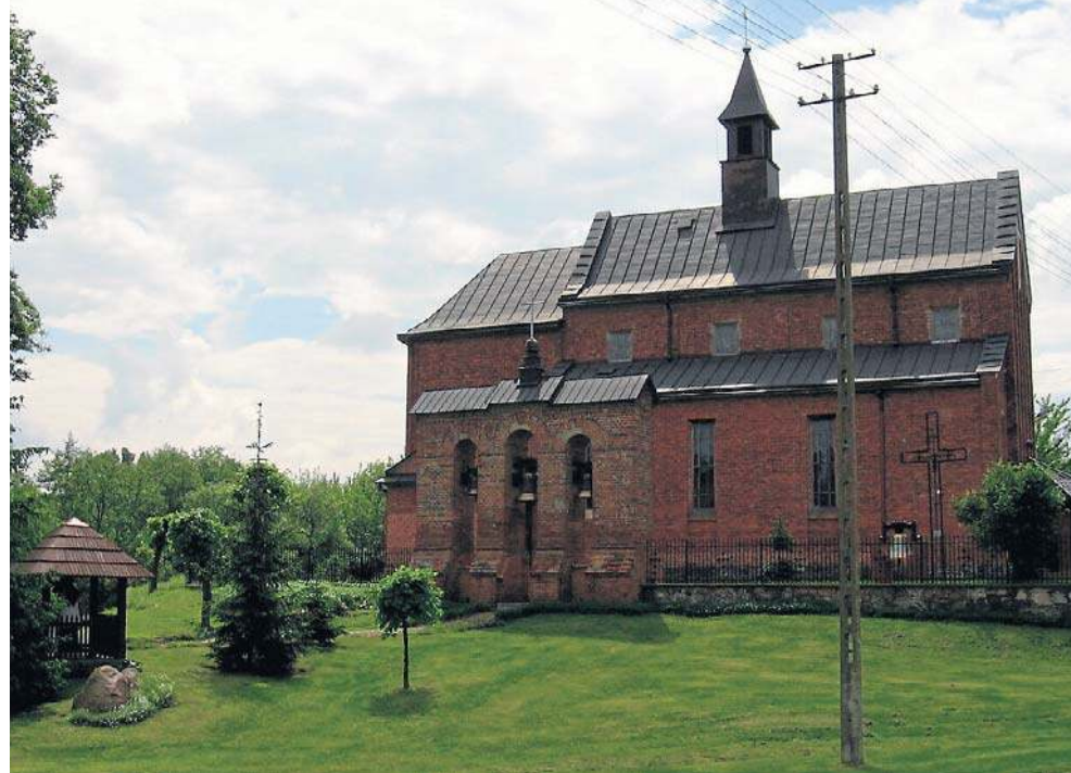
Zbrodnia miała rabunkowy charakter. Sprawcy wiedzieli, że proboszcz z Prawna był majątny