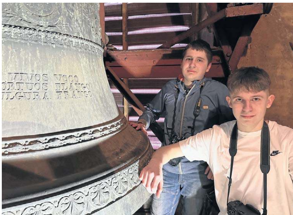
Młodzi „ludwisarze” z Gorlickiego”

- To były dzwony w sanktuarium w Dębowcu. Ich dźwięk po prostu mnie ujął. Miałem wtedy trzy lata. Tego nie da się inaczej wytłumaczyć - śmieje się. - Jako 11-latek zacząłem chodzić po takich wieżach kościelnych i zainteresowałem się