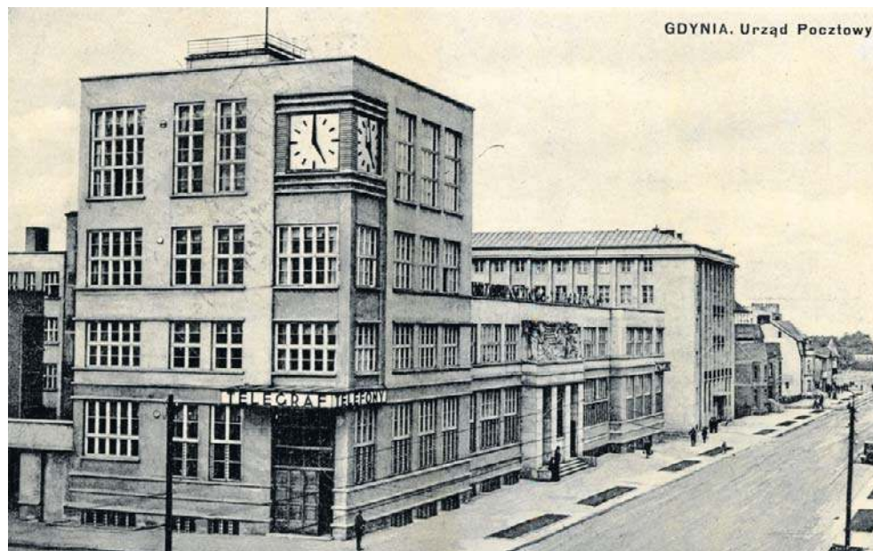
„Gdynia. Urząd Pocztowy”. Wydawca: Fotobrom

M iasta rozrastają się dziś w błyskawicznym tempie, a kolejne bloki powstają jak grzyby po deszczu i po roku można nie poznać okolicy. Jednak proces budowy Gdyni sprzed wieku był inny i imponuje do dziś. Nie tylko ze względu na szybkość, lecz przede wszystkim przemyślaną wizję i modernistyczny charakter, który pozwala rozpoznać jej centrum o każdej porze dnia czy nocy.