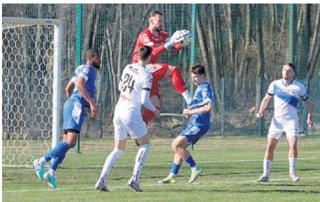
Zawisza walczy o awans, Tłuchowia o utrzymanie. Obu naszym ekipom bardzo potrzebne są zwycięstwa

W Betclit 3. Lidze Zawisza Bydgoszcz zagra w niedzielę (godz. 14) na wyjeździe z Wybrzeżem Rewalskim Rewal. Zespoły dzieli cała ligowa tabela - goście przewodzą stawce (56 pkt.), zaś gospodarze ją zamykają (13 pkt.). Obowiazkiem nie-