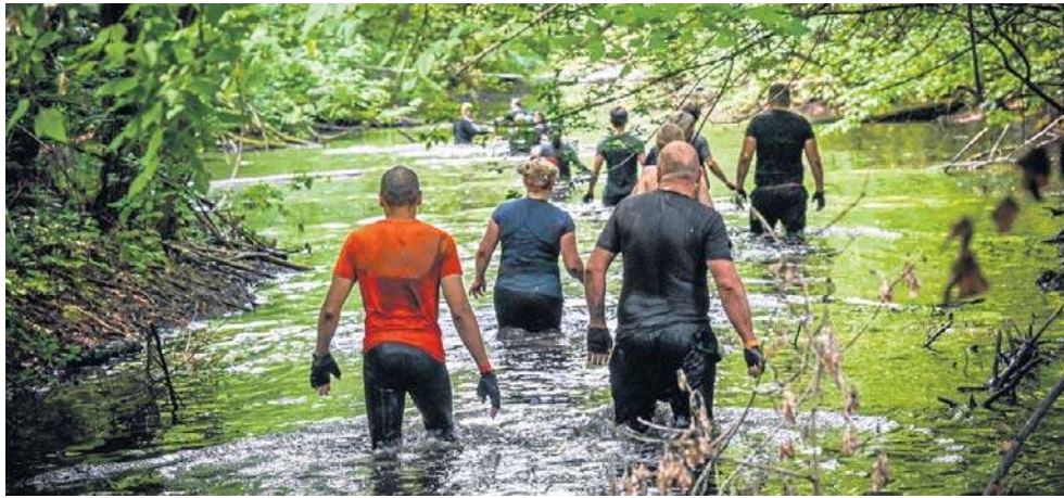
Terenowa Masakra 31 maja 2025 roku. Kijanki raczej się na nią nie pisały...