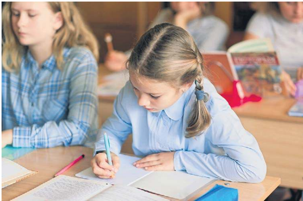
To rodzice zdecydują, czy ich dziecko będzie uczestniczyć w edukacji seksualnej

w działach II-X. Ze względu na uniwersalny charakter tych wymagań dział I ma inną strukturę niż pozostałe działy. Prezentowane pojęcia przedstawiają perspektywę filozoficzno-antropologiczną i stanowią istotę naszej kultury, mają sens powszechny i nieredukowalny, dlatego nie można im przypisać konkretnych umiejętności, a do tego wyrażają się przez przyjętą osobistą hierarchię wartości oraz w kształtowanych