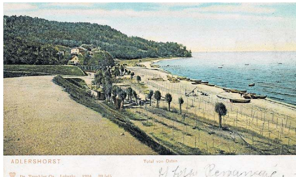
Widok od południa na Osadę Orłowo i Kępę Redłowską (Adlershorst. Total von Osten. Wydawca: Dr. Trenkler Co., Leipzig, 1904)