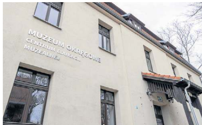
W Centrum Edukacji Muzealnej przy ul. Mennica 6 rozpocznie się, m.in., gra terenowa „Tropem Wyczółki”

W Domu Leona Wyczółkowskiego (ul. Mennica 7) odbędą się natomiast trzy kuratorskie oprowadzania. O godz. 11.30 i o godz. 13 zaplanowano spotkania wokół wystawy „Twórczość Leona Wyczółkowskiego