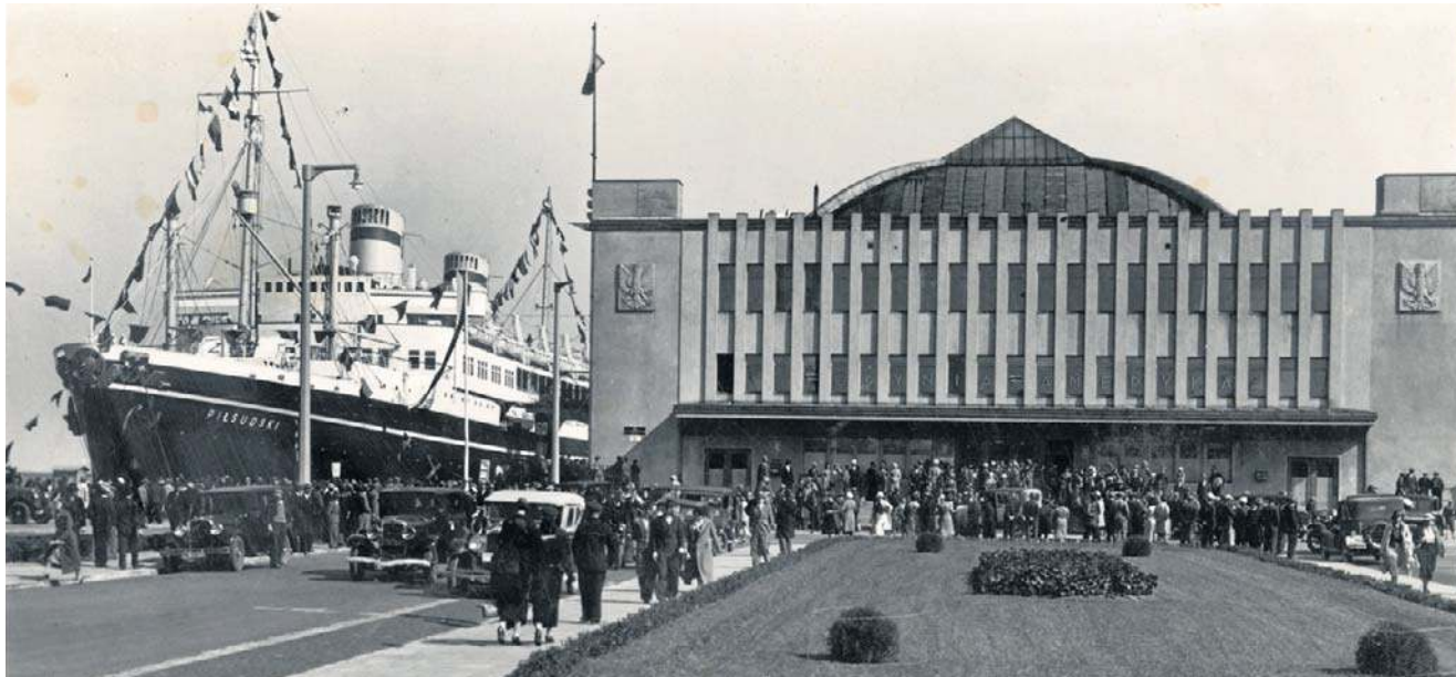
Gdynia. M.S. „Piłsudski” przy Dworcu Morskim. Wydawca: Morska Agencja Fotograficzna

Sama historia pocztówki jest równie ciekawa jak obrazy, które przedstawia. Już pod koniec XIX wieku zaczęły pojawiać się pierwsze widokówki z terenów dzisiejszego Pomorza. Najstarsze znane egzemplarze pokazują m.in. sopocki Dom Zdrojowy i plażę, a ich początki sięgają lat 80. XIX wieku. Gdyńska historia pocztówki rozpoczyna się od litograficznej karty Orłowa z 1892 roku, opatrzonej stemplem z Sopotu. Wydawali je zarówno lokalni przedsiębiorcy, jak i znane europejskie oficyny, a szczególnie uznaniem kolekcjonerów cieszą się m.in. serie lipskiej firmy Dr. Trenkler & Co. Najważniejszych wydawców czy