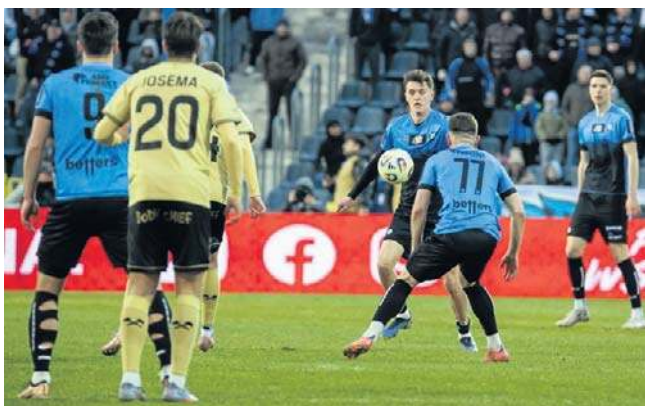
Zawiszę teraz czekają mecze w Betclit 3. Lidze i Pucharze Polski Kujawsko - Pomorskiego ZPN

W całych rozgrywkach STS Pucharu Polski Zawisza zyskał bardzo wiele. I nie chodzi tylko o gratyfikację finansową od PZPN i sponsora rozgrywek czyli 380 tysięcy złotych. O Zawiszy zaczęło się mówić i to nie tylko w re-