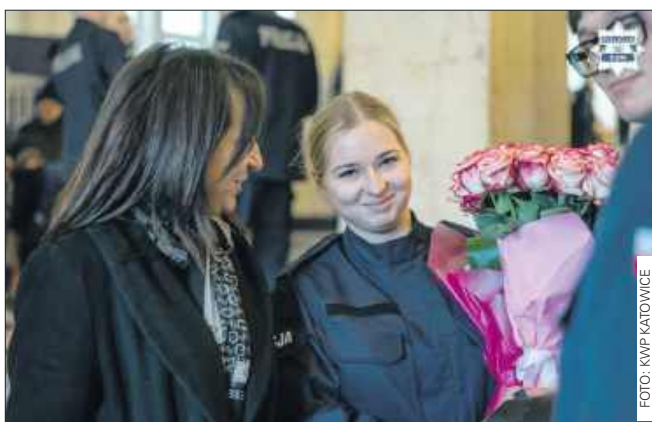
■ Nowo przyjęci funkcjonariusze rozpoczną teraz szkolenie podstawowe.