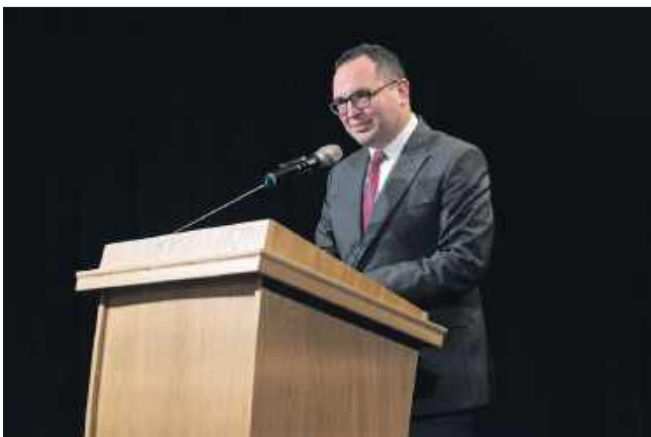
■ Wicewojewoda Śląski Michał Kopański