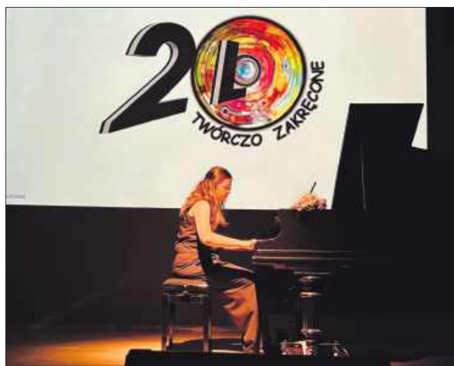
■ Najlepiej w regionie wypadło w słynnym rankingu Perspektyw II LO z Rybnika

Do sporządzenia rankingu wykorzystano dane ze źródeł egzogenicznych (zewnętrznych) wobec ocenianych szkół. (ma.w)