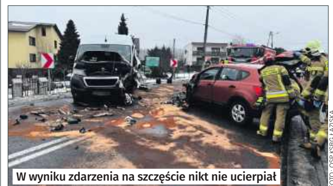
W wyniku zdarzenia na szczęście nikt nie ucierpiał

ŁAZISKA W piątek 16 stycznia doszło do zdarzenia drogowego z udziałem dwóch samochodów. Na szczęście nikt nie ucierpiał.