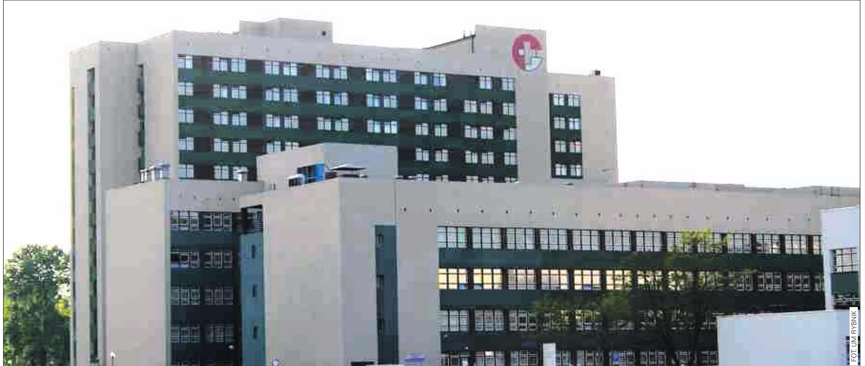
■ Wojewódzki Szpital Specjalistyczny nr 3 w Rybniku. To tutaj działa oddział ginekologiczno-położniczy, który w ostatnich latach przeszedł modernizację i notuje wzrost liczby porodów, na tle trudnej sytuacji porodówek w regionie.

Wydatki na ochronę zdrowia w regionie rosną, ale sytuacja w poszczególnych szpitalach wygląda różnie. W Rybniku oddział porodowy zyskuje na sile i przyciąga coraz więcej przyszłych rodziców, podczas gdy w innych miejscach, jak Żory, dostęp do niektórych świadczeń wciąż bywa ograniczony. Jak prezentuje się bilans wydatków na zdrowie w naszym regionie i co to oznacza dla pacjentów?