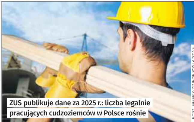
ZUS publikuje dane za 2025 r.: liczba legalnie pracujących cudzoziemców w Polsce rośnie

– Na koniec grudnia w statystykach ZUS było ich ponad 857 tys. Podobnie jest w województwie śląskim, gdzie Ukraińcy stanowią najliczniejszą grupę legalnie pracujących cudzoziemców. Na koniec 2025 r. we wszystkich 6 oddziałach