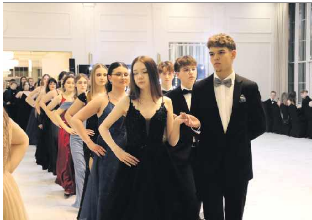
■ Uroczysta studniówka odbyła się 17 stycznia w sali bankietowej Arkadia w Żorach