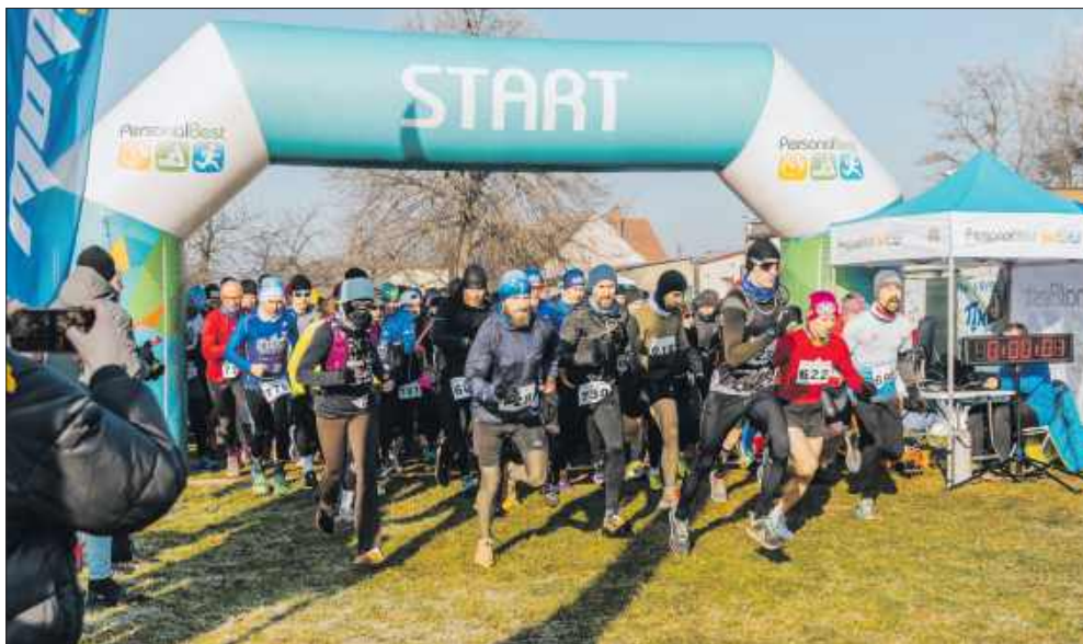
■ Start biegu na 12 km