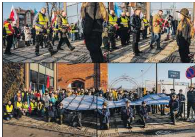
■ Uroczystości pod pomnikiem na dworcu kolejowym