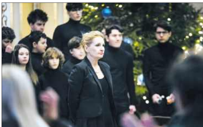
■ Chór Canticum Novum wystąpił w sobotę 10 stycznia w kościele pw. Wniebowzięcia NMP w Wodzisławiu Śląskim

– W kwestii „zapewnienia ciągłości pracy chóru” – informacja o zapewnieniu przez Miasto ciągłości funkcjonowania Chóru Canticum Novum w strukturach OPP nr 1 jest nieścisła. Faktem jest, że wszyscy członkowie zespołu zrezygnowali z zajęć w tej placówce. Chór będzie kontynuował działalność wyłącznie w ramach nieza-