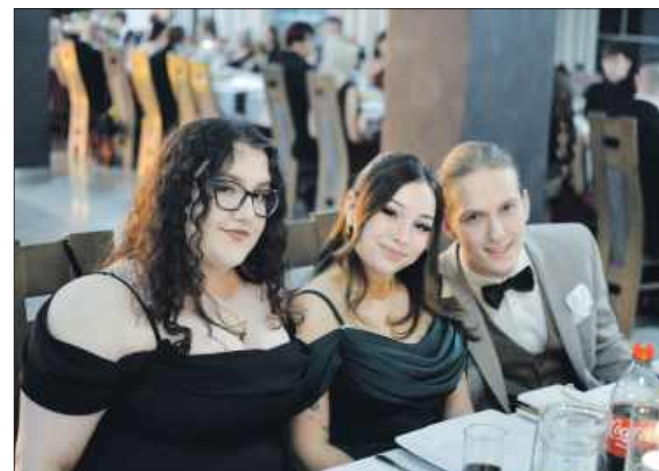
■ Maturalna zabawa odbyła się w „Premium” w Radlinie