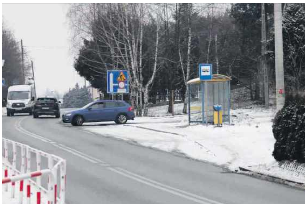
■ Przystanek w kierunku Rydułtów, również wyłączony z użytkowania linii 205.