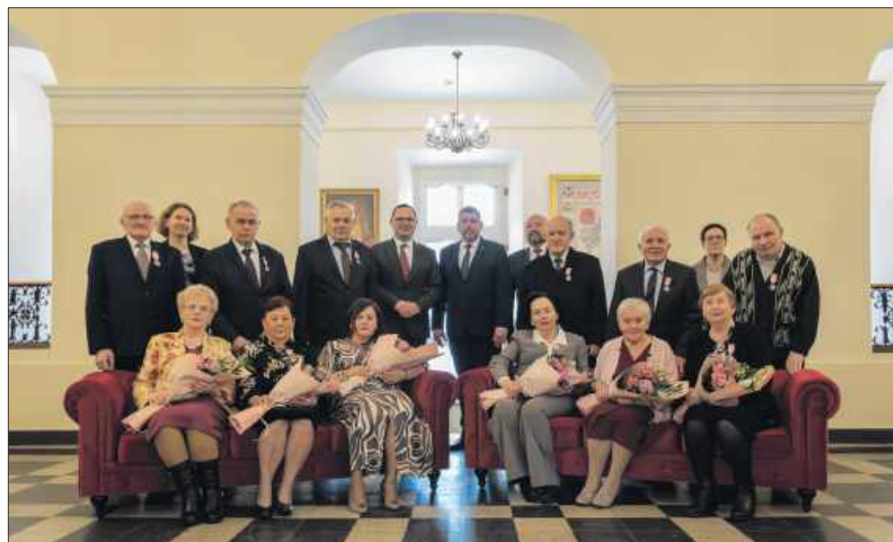
■ Pary świętujące 50 lat po ślubie