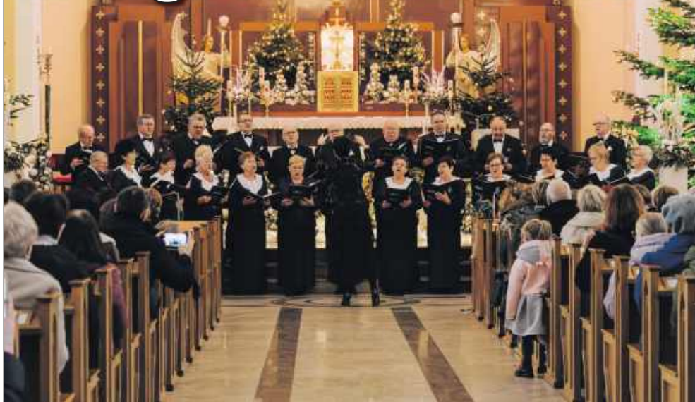
■ Podczas koncertu wystąpił m.in. chór Echo z Syryni

ROGÓW 18 stycznia w kościele pw. Najświętszego Serca Pana Jezusa w Rogowie odbyło się tradycyjne Noworoczne Spotkanie Kolędowe.