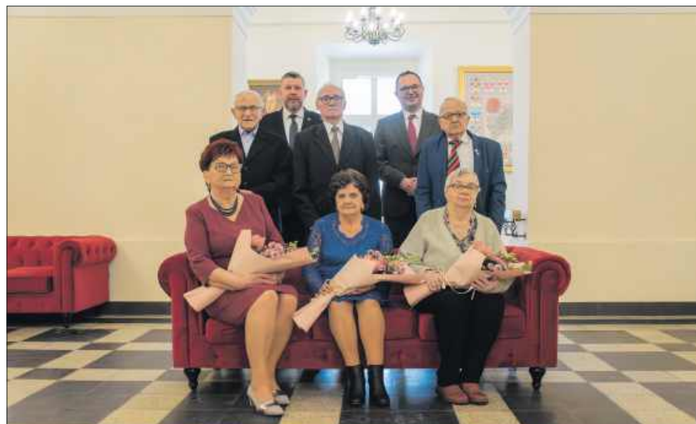
■ Pary świętujące 60 i 65 lat po ślubie