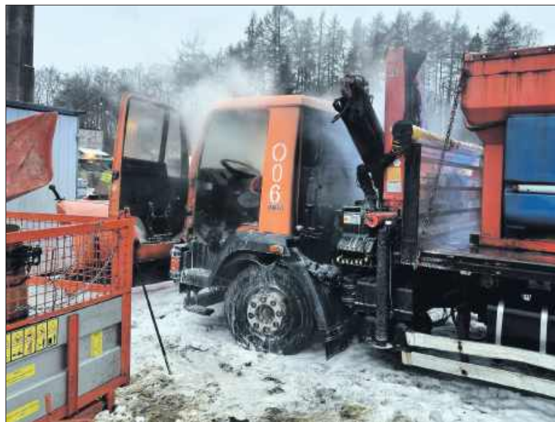
■ W działaniach brały udział jednostki PSP i OSP.

Około godziny 15:54 do stanowiska kierowania komendanta powiatowego Państwowej Straży Pożarnej w Wodzisławiu Śląskim wpłynęła informacja dotycząca pożaru samochodu ciężarowego marki MAN - piaskarki, która znajdowała się na terenie Zarządu Dróg Miejskich przy ulicy Markłowickiej w Wodzisławiu Śląskim. Do akcji skierowano jednostki z JRG Wodzisław Śląski oraz OSP Markłowice i OSP Radlin II. Działania polegały na podaniu prądów wody celem ugaszenia płonącego samochodu oraz udzieleniu pomocy jednemu z pracowników ZDM. Dowódca podjął decyzję o wezwaniu zespołu ratownictwa medycznego. Mężczyzna został przewieziony do szpitala.