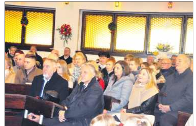
■ Publiczność podczas koncertu kolędowego w kościele w Gołkowicach