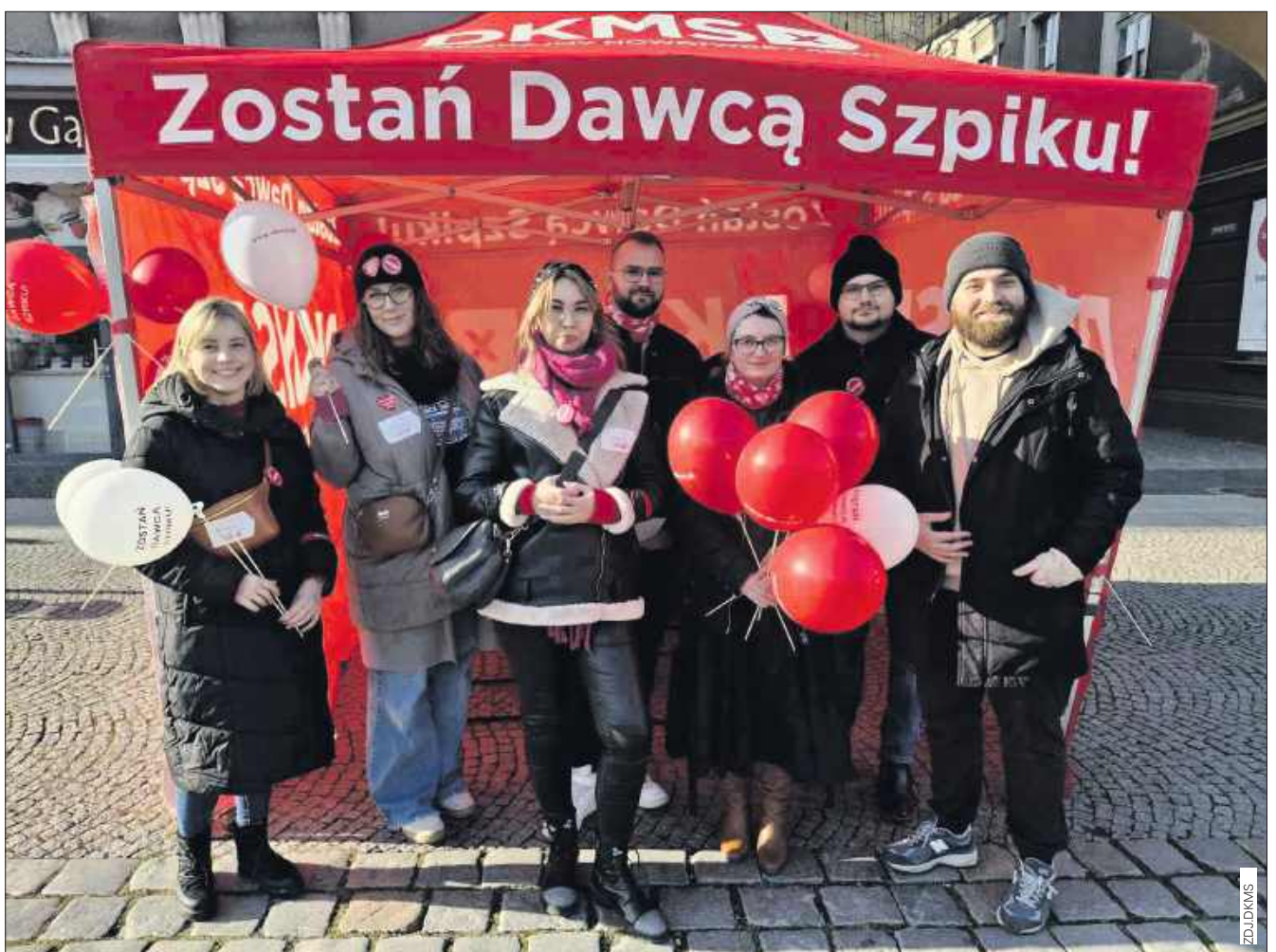
■ Wolontariusze będą czekać w czerwonym namiocie ustawionym na rynku w Raciborzu.

Akcja, która odbędzie się 25 stycznia na rynku w Raciborzu w godzinach 13.00–17.00 w ramach finału Wielkiej Orkiestry Świątecznej Pomocy, jest częścią ogólnopolskich działań Fundacji DKMS mających na celu zwiększenie liczby potencjalnych dawców i szans na przeszczep dla osób zmagających się z nowotworami krwi. (d)