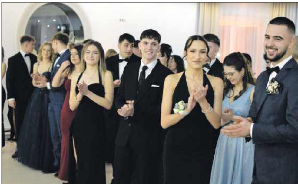
■ Maturzyści z PCKZiU w Wodzisławiu Śl. podczas swojej studniówki, 17.01.2026 r.

Czy podczas balu maturального uczniowie myślą o czekających ich egzaminach? – Dzisiaj się bawi-