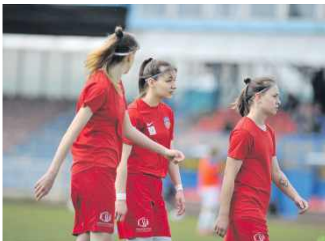
■ Podopieczne SWD zainaugurują zmagania 21 marca w Częstochowie, a tydzień później czeka je prestiżowe starcie z Piastem Gliwice.