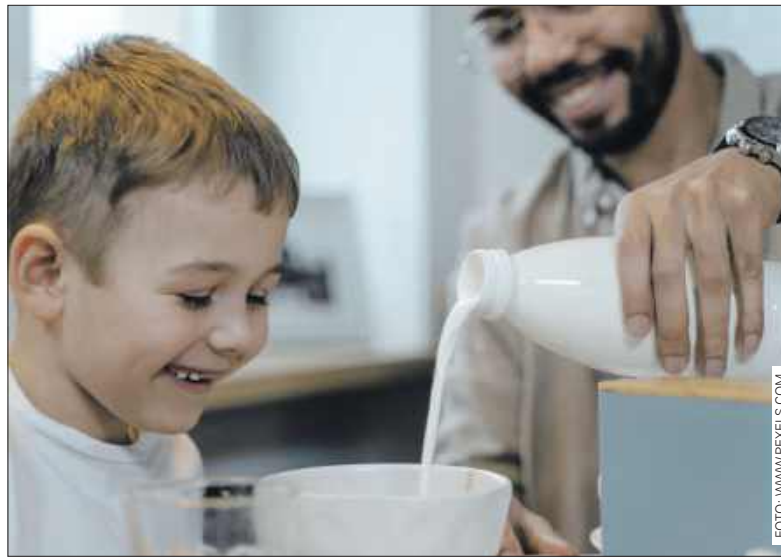
■ Inspekcja wskazała, że nieprawidłowości wykryto w 13,4 % badanych partii