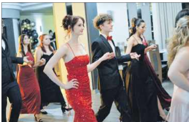
■ Podczas studniówki nie zabrakło tradycyjnego poloneza