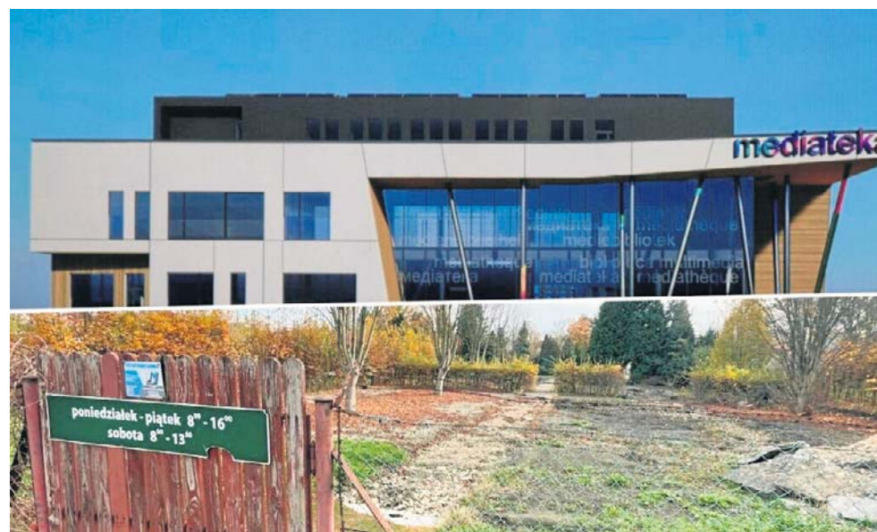
Tak miałyby wyglądać biblioteka XXI wieku w Tarnowie. Miasto ma projekt i działkę

Na drugim piętrze zaplanowano pomieszczenia biurowe oraz taras z ogrodem zielonym. W ogóle to część ścian frontowych budynku miałyby porastać pnącza.