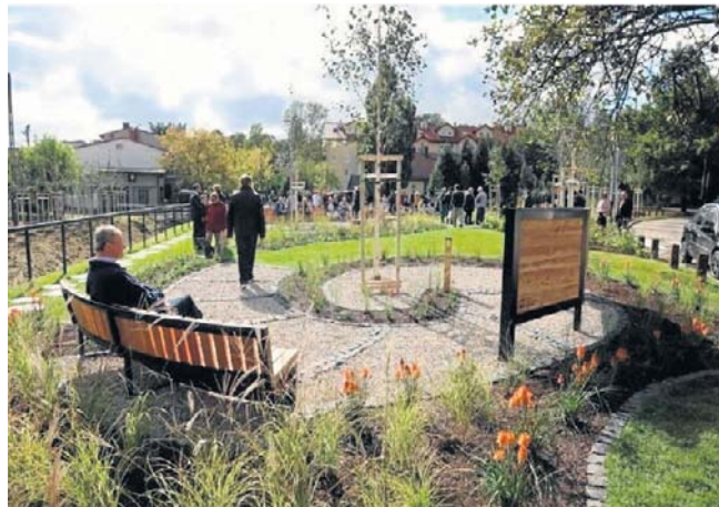
Oto przykład, jak może wyglądać nowy park kieszonkowy

Inwestycja będzie realizowana dzięki dofinansowaniu w wysokości 1,4 mln zł pozyskanemu z budżetu Województwa Małopolskiego. Całkowita wartość projektu przekracza 1,7 mln zł. W ramach przedsięwzięcia nowe parki kieszonkowe powstaną na osiedlu Zygmunta Augusta, przy Limanowskim Domu Kultury, przy ulicy Stanisława Jordana, w Parku Leśnym oraz przy ulicy Mickiewicza.