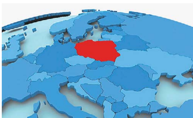
Dlaczego polskim przedsiębiorcom tak trudno przebić się do globalnej ekstraklasy?

Jednocześnie przedsiębiorca zwraca uwagę, że przez