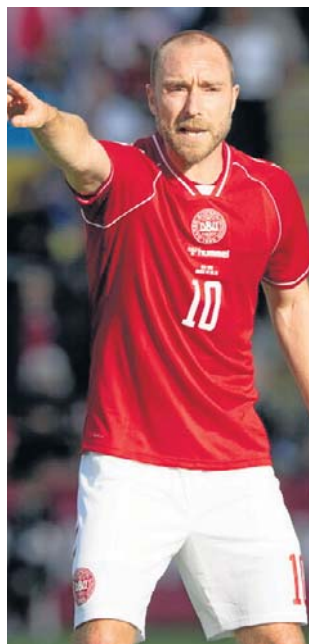
Możliwe, że po drugim takim zajściu Christian Eriksen zakończy sportową karierę...

- To może być dla danej osoby bardzo gwałtowne doświadczenie, ponieważ przypomina porażenie prądem z zwykłego defibrylatora. Człowiek