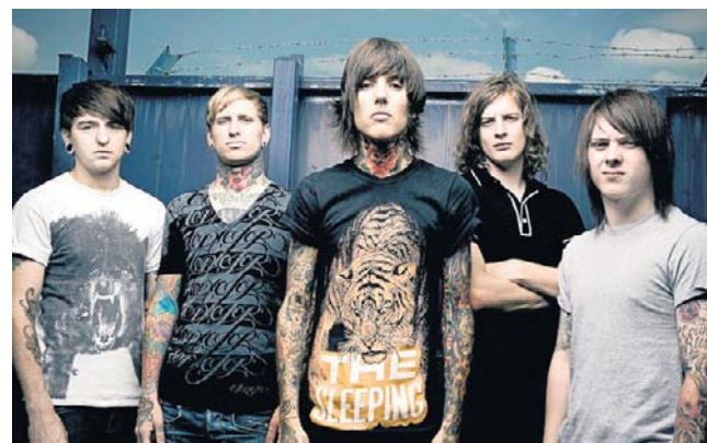
Bring Me The Horizon zagrają dziś w w Tauron Arenie

Kiedy w 2004 roku grupa nastolatków z Sheffield zakładała zespół Bring Me The Horizon (BMTH), brytyjska prasa muzyczna nie wróżyła im długiej kariery. Scena deathcore'owa, z której się wywodzili, była niszowa, a wokół Oli Sykesa - choć pełen pasji - ranił uszy tradycyjnych fanów. Ponad dwadzieścia lat później ci sami muzycy stoją na czele rockowej rewolucji, gromadząc na koncertach tysiące fanów i udowadniając, że w muzyce gitarowej nie ma miejsca na świętość.