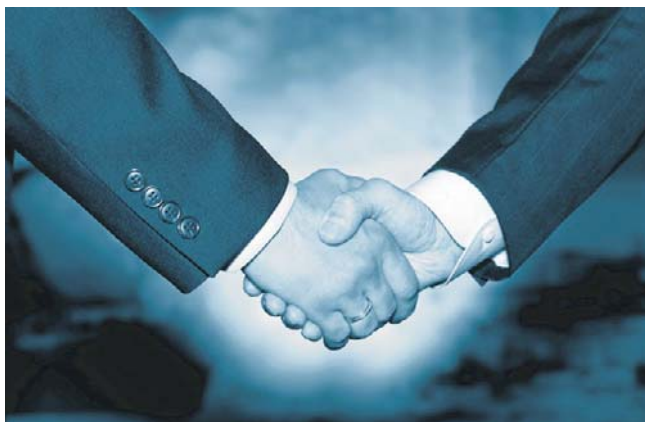
Pierwsze pokolenie polskich dziedziców przejmuje biznes

W opinii właściciela Zakładu Mięsnego Karczew jednym z największych błędów