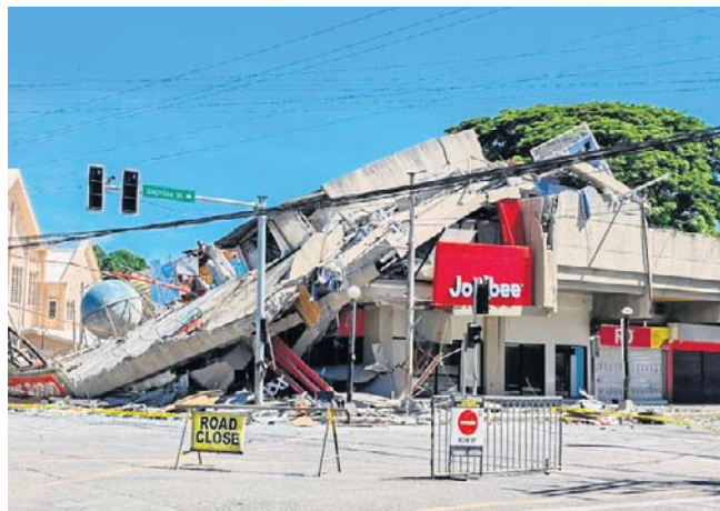
Trzęsienie ziemi nawiedziło południowe Filipiny. Uszkodzony budynek w General Santos

Australijskie Biuro Meteorologiczne (BoM) wycofało ostrzeżenie przed tsunami dla wybrzeża kraju i jego terytoriów.