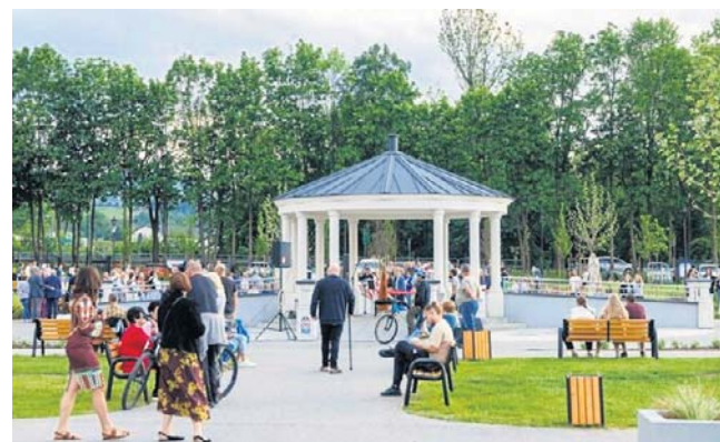
Otwarcie Centrum Aktywności i Wypoczynku w Nawojowej. Uwagę zwraca centralnie usytuowana glorieta

- Centrum Aktywności i Wypoczynku w Nawojowej jest przykładem inwestycji, która podnosi jakość życia mieszkań-