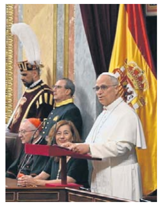
Parlamentarzyści zgotowali papieżowi owację

Papież gościł w niższej izbie parlamentu królestwa Hiszpanii, noszącego nazwę Kortezy Generalne. Przemawiał jednak do członków obu izb. Na sali zabrakło parlamentarzystów lewicowego ugrupowania Podemos i lewicowo-nacjonalistycznego bloku galicyjskiego BGN, którzy zaprotestowali w ten sposób przeciwko obecności przywódcy religijnego w parlamencie świeckiego państwa. Na wstępie Ojciec Święty zadeklarował: Staję przed wami jako biskup Rzymu i pasterz Kościoła katolickiego świadomy, że misja powierzona następcy apo-