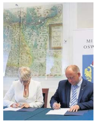
Umowy podpisano na zamku w Oświęcimiu

Z blisko 91 mln zł prawie 18 mln zł wyniesie wsparcie już w tym roku na 14 zaplanowanych zadań realizowanych przez Zarząd Województwa Małopolskiego, Powiat Oświęcimski, Miasto Oświę-