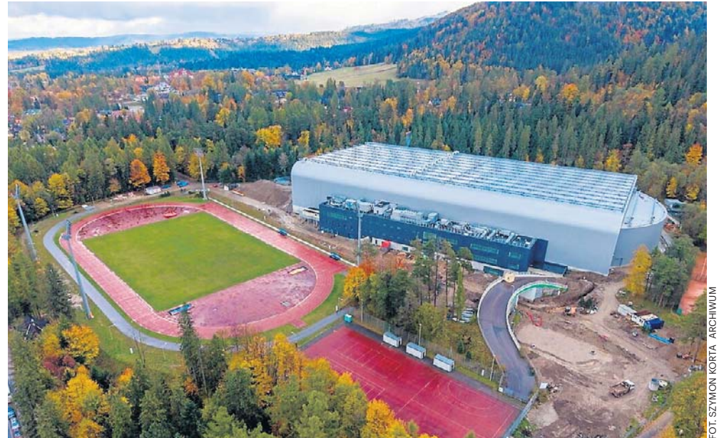
Prace nad dokończeniem budowy hali lodowej Centralnego Ośrodka Sportu w Zakopanem wychodzą na prostą

- Najważniejszym elementem w torze, jest to, co podwieszono w suficie, czyli technolo-