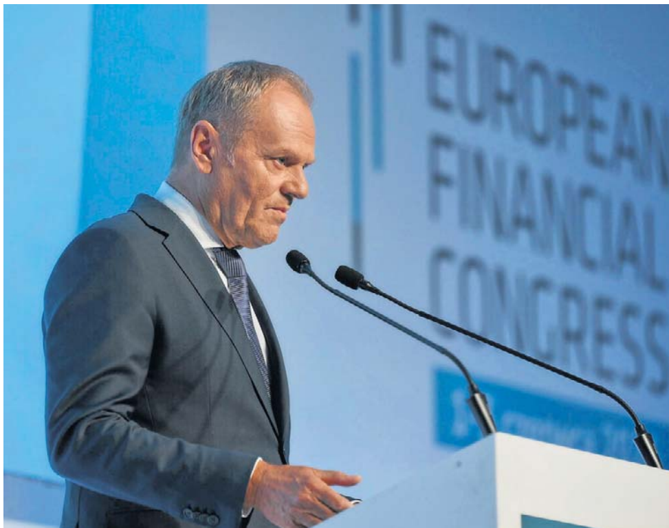
- To my mamy dysponować AI, a nie AI nami - mówił premier Donald Tusk na EKF

Polska ma szansę, by w ciągu najbliższych 10 lat znaleźć się w grupie trzech najbardziej wpływowych gospodarek w Europie