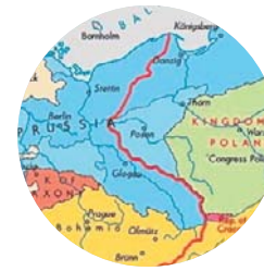
MAPA EUROPY 1815

Imieniny obchodzą: Anna, Felicjan, Józef, Ryszard, Sylwester 1772 – I rozbiór Polski: wojska austriackie zajęły Wieliczkę 1945 – rozpoczął działalność Teatr Lalki, Maski i Aktora Groteska w Krakowie 1987 – papież Jan Paweł II przybył do Tarnowa. Przyleciał śmigłowcem ok. godz. 21. Potem, mimo rześkiego deszczu, pojawił się oknie kurii na drugim piętrze i rozmawiał z tarnowianami