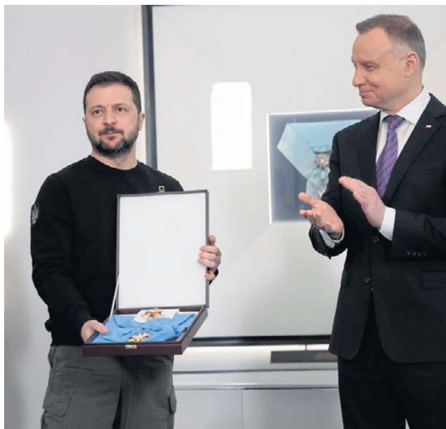
Zelenski został odznaczony Orderem Orła Białego w kwietniu 2023 roku przez prezydenta Andrzeja Dudę

„Ponieważ dyplomacja nie przyniosła żadnych efektów, zwracam się publicznie do Prezydentów Karola Nawrockiego i Wołodymyra Zelenskigo o bezpośrednią i szczerą rozmowę. Zanim emocje zrujną naszą solidarność, która narodziła się w obliczu rosyjskiego zagrożenia” - napisał premier. Podkreślił, że „współpraca leży w interesie obu naszych państw i narodów, a konflikt w interesie Mo-