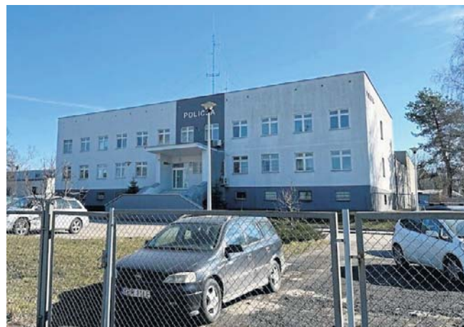
Komenda przy ul. Szczepanowskiej. Wojsko wystąpiło do władz powiatu z wnioskiem o przekazanie budynku