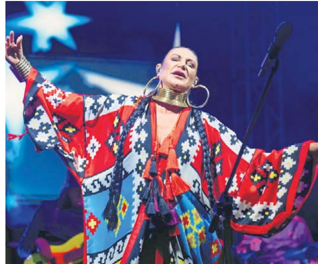
Gwiazdą tegorocznej edycji Wodecki Twist Festival, który odbędzie się od 10 do 14 czerwca, będzie Kayah

- Tata powiedział kiedyś, że nie znosi śpiewać cudzych piosenek, a jeżeli już sięga po covery, są to utwory pochodzące z filmów. Choćby „Kobieta i mężczyzna” ze słynnego filmu Claude Leloucha czy amerykańskie standardy, które zawsze przewijają się przez hollywoodzkie produkcje. Kiedyś tata miał mieć swój benefis w Teatrze STU i napisał w poprzedzającej go noc piosenkę „Tylko w kinie”. W pełni fraza ta brzmi „Tylko w kinie świat był taki, jaki być powinien”. Stąd konwencją tego galowego koncertu będzie trochę bajkowa. Zabrzmią filmowe utwory, które tata wykonywał, ale też piosenki, które