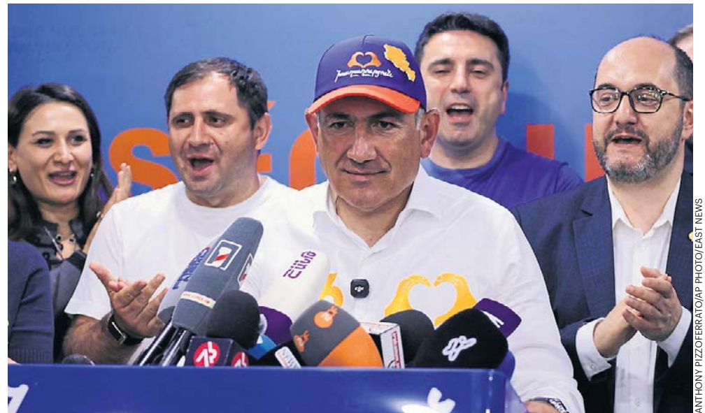
Premier Armenii Nikol Paszynian przemówił w siedzibie swojej partii Umowa Społeczna po wygranych wyborach parlamentarnych w Erywanii

Paszynian oświadczył, że „trójgłowa partia wojny została zmiażdżona”. Paszynian od lat przedstawia opozycję jako siłę, która dąży do ponownego rozpoczęcia wojny z Azerbejdżanem.