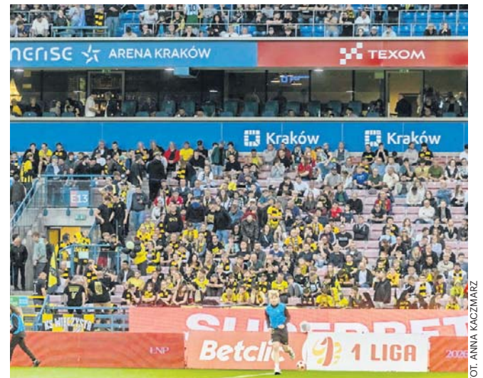
Wieczysta awans świętowała z kibicami na stadionie Wisły, ale nie wiadomo, czy w ekstraklasie tam zagra

„Oznacza to wprost, że Wieczysta będzie rozgrywać mecze w ESA przy R22” - napisał Królewski. ©