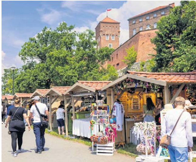
Jarmark Świętojański wraca na Bulwar Czerwiński od 11 do 20 czerwca