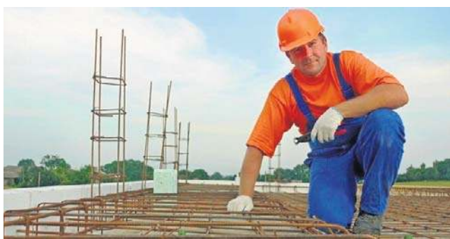
Nowe przepisy (na razie to projekt rozporządzenia resortu pracy) mają uszczelnić rynek zatrudnienia cudzoziemców

Ale przepisy nie podobają się przedsiębiorcom. Co prawda popierają oni konieczność uszczelnienia systemu i walki z patologiami, ale obawiają się wydłużenia czasu rekrutacji. Zamiast natychmiastowego przyjazdu pracownika, firma będzie musiała zaplanować czas na procedurę wizową, która obejmie weryfikację dokumentów przez polskiego konsula w kraju pochodzenia kandydata.