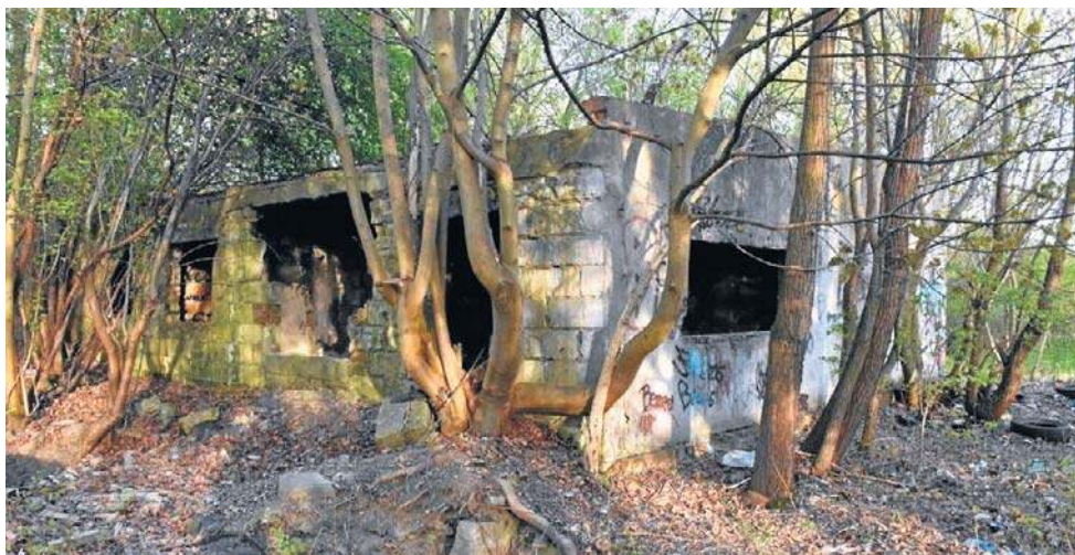
Na terenie przewidzianym do sprzedaży znajdują się jeszcze ruiny po Makopie

Teren jest położony między miejskim parkiem a Pomorską Specjalną Strefą Ekonomiczną. W przeszłości ta działka, tak jak większość obszarów przy ul. Bydgoskiej należała do jednego z najbardziej znanych malborskich przedsiębiorstw - Makopie.