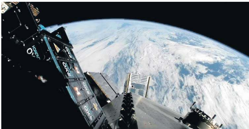
To historyczny krok dla polskiego przemysłu kosmicznego