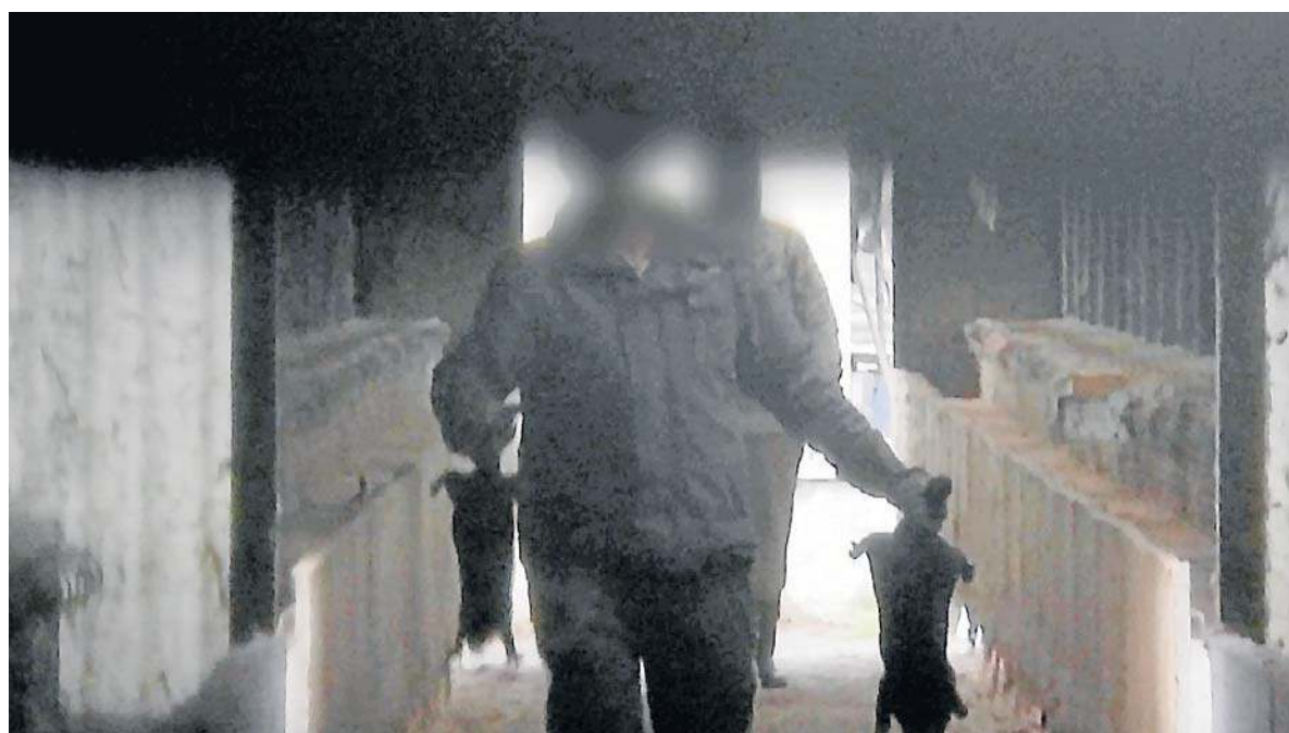
Fragment nagrania opublikowanego w mediach społecznościowych przez Vena - inicjatywa dla zwierząt

z Elżbietą Rogowską o odzyskiwaniu strat wojennych str. 2