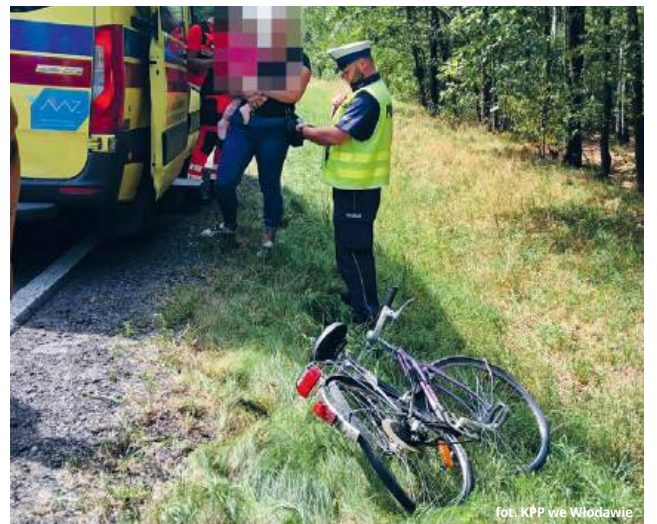
fol. KPP we Włodawie

● GMINA WYRYKI To mogło się skończyć tragicznie!