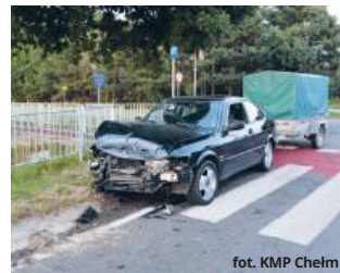
fort. KMP Chełm

W fordzie podróżowało czworo pasażerów – w tym