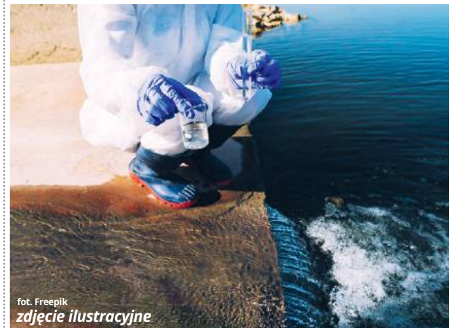
fol. Freepik zdjęcie ilustracyjne

Tymczasem urzędnicy ocenili, że modernizacja instalacji wiązałaby się tak naprawdę z potrzebą wykonania zupełnie nowej instalacji, a co za tym idzie, przedsięwzięcie pociągnęłoby za sobą znaczne koszty. W czasie kolejnych już rozmów w tej samej sprawie zaproponowano więc, że gmina postara się o zmianę nieruchomości z nadleśnictwem i przekaze działkę w dzierżawę lub w czyste użytkowanie mieszkańcom bloków. Co jednak ważne, podjęcie starań związanych