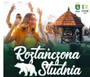
widziani są zarówno miłośnicy tańca, jak i ci, którzy po prostu chcą spędzić czas w dobrym towarzystwie.

Dyskotekowe rytmy, kolorowe światła, mnóstwo energii - to będzie noc, której nie zapomnicie! - obiecują organizatorzy. Koniecznie zabierzcie ze sobą wygodne obuwie. Mile