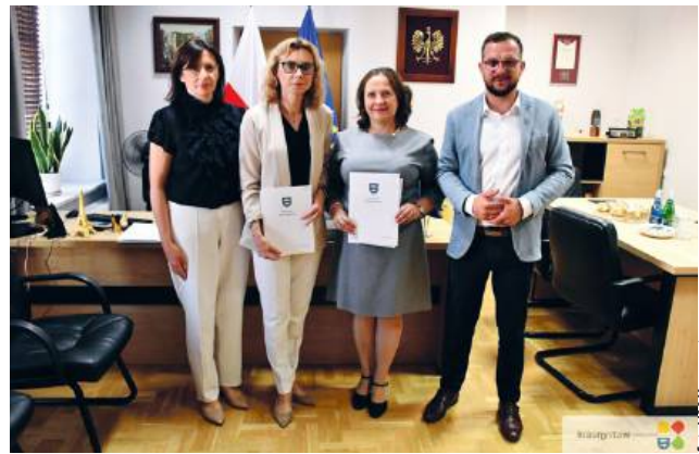
fol. UM Krasnystaw

Nauczycielki zobowiązały się do rzetelnego pełnienia swoich obowiązków, dbania o rozwój uczniów i własny, a także wychowywania młodego pokolenia