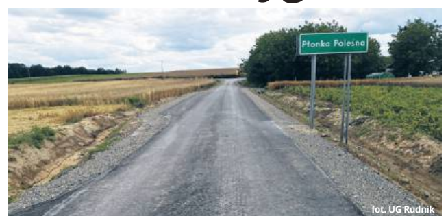
fol. UG Rudnik

- Prowadzone prace obejmowały m.in.: roboty ziemne, wykonanie odwodnienia wraz ze