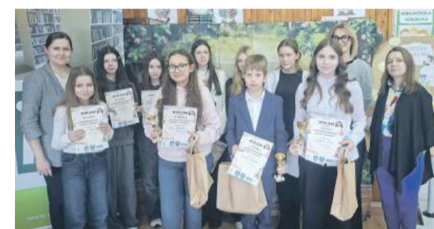
Wręczenie nagród. Laureaci z przodu z pucharami, dyplomami i nagrodami.