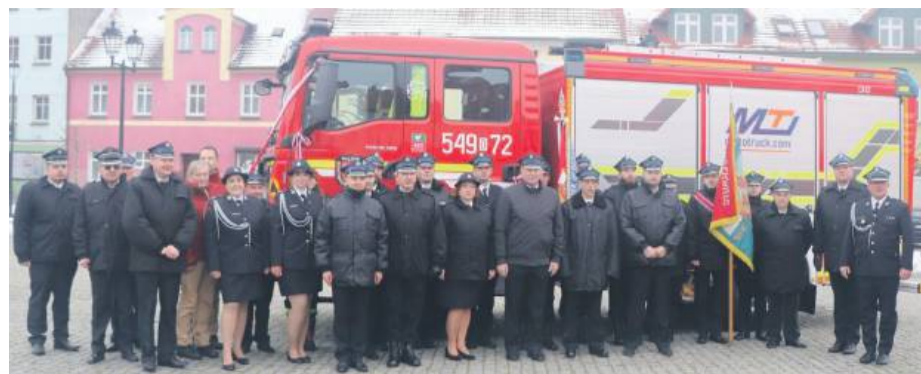
Strażacy i samorządowcy przy nowym wozie strażackim.