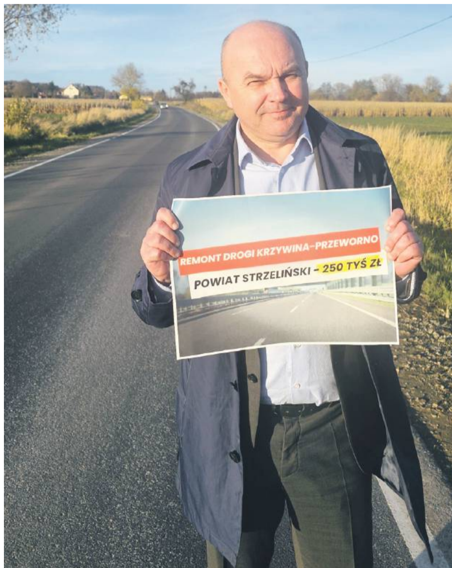
Jednym z wyremontowanych odcinków dróg powiatowych jest droga w Krzywini, na którą powiat strzeliński otrzymał 250 tys. zł.

W ciągu ostatnich 18 miesięcy na teren powiatu strzelińskiego trafiło ponad 5,1 mln zł przeznaczonych na remonty dróg śródpolnych. To ogromny zastrzyk środków, dzięki któremu zrealizowanych zostanie aż 16 inwestycji w gminach Strzelin, Wiązów, Kondratowice i Przeworno oraz na drogach powiatowych. Samorządowcy podkreślają, że te modernizacje mają kluczowe znaczenie przede wszystkim dla mieszkańców wsi i kierowców, a także dla rolników i lokalnych przedsiębiorców.