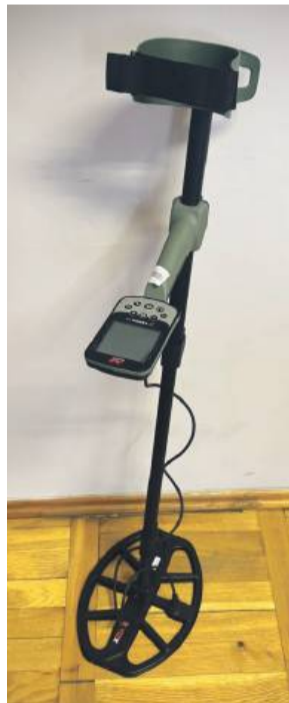
Skradziony wykrywacz metalu

W dniu 18 listopada policja otrzymała zgłoszenie o kradzieży wykrywacza metalu.