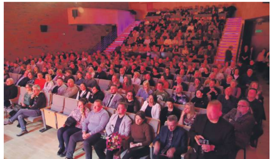
Podczas jubileuszowego koncertu sala była wypełniona po brzegi

Po koncercie była jeszcze okazja do nabycia płyt zespołu, a zaproszeni goście spotkali się w sali obok przy jubileuszowym torcie. AK