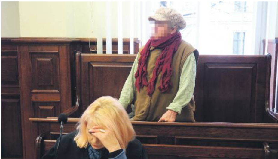
75-letnia emerytka odpiesa zarzut znęcania się nad zwierzętami

Sędzia pytała, dlaczego zwierzęta były zaniedbane, dlaczego nie mogły wychodzić na dwór, czy miały stały dostęp do pożywienia i świe-