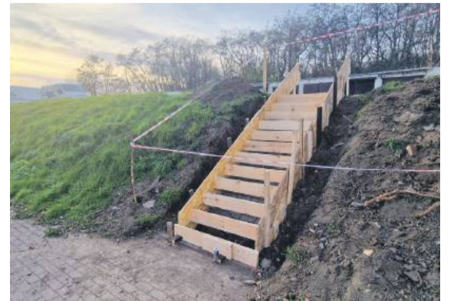
Nowe schody poprawią bezpieczeństwo i wygodę mieszkańców