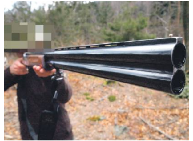
Nagonka na myśliwych powtarza się co kilka lat