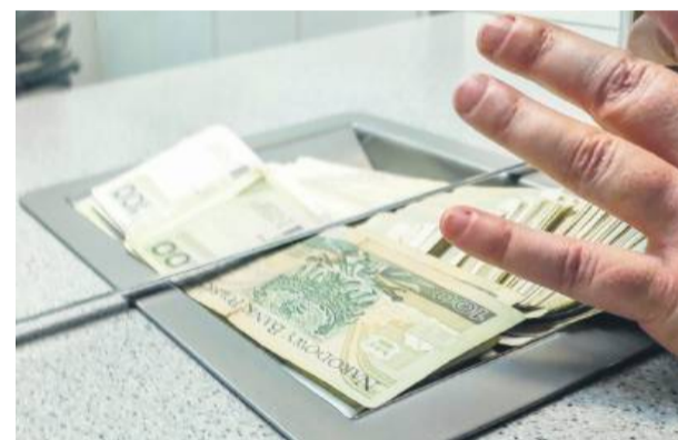
W pierwszym półroczu 2025 roku odnotowano w Polsce blisko 52 tysiące przypadków oszustw internetowych, a liczba zgłoszeń wciąż rośnie

– Po przekazaniu pieniędzy kobieta nadal przekonywała, że środki są zagrożone i że ktoś próbuje wykraść je z konta. Zaleciła mężczyźnie wybranie z banku wszystkich pieniędzy, jakie posiada. Poszkodowany udał się do banku i dokonał wypłaty reszty oszczędności. Miał je przekazać, korzystając