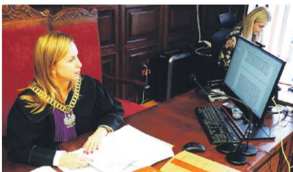
Sprawa o znęcanie się nad zwierzętami toczy się w Sądzie Rejonowym w Strzelinie

która w czerwcu przeprowadziła inspekcję na posesji. Kobieta mówiła o fatalnych warunkach, jakie panowały w domu i pomieszczeniu gospodarczym.