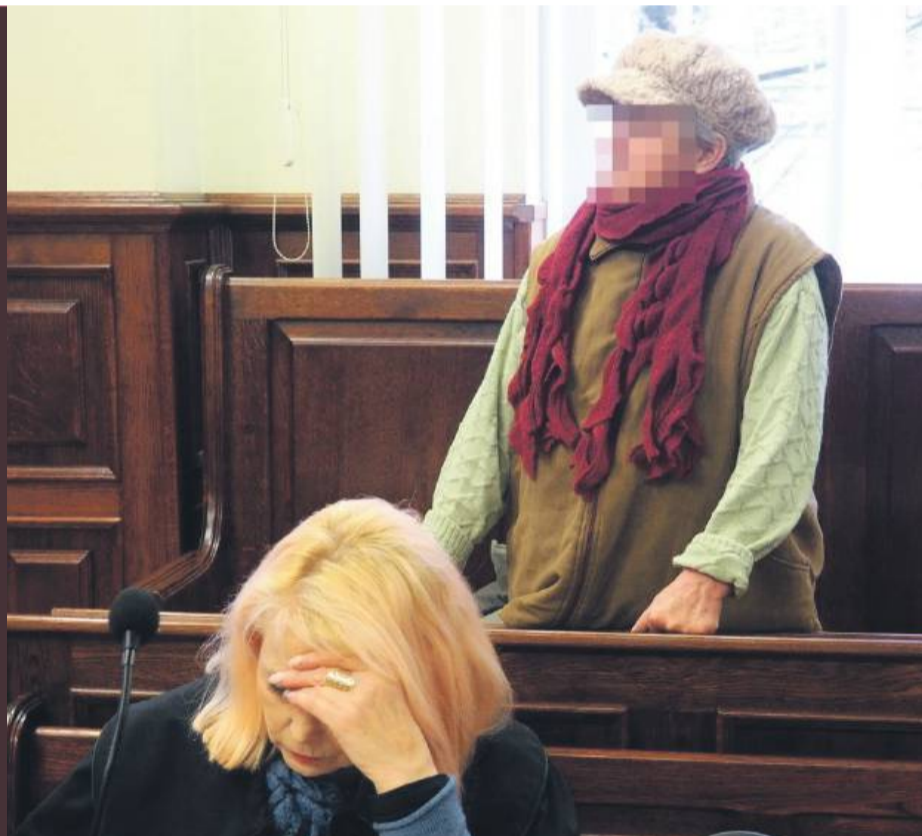
75-letnia emerytka odpiera zarzut znęcania się nad zwierzętami