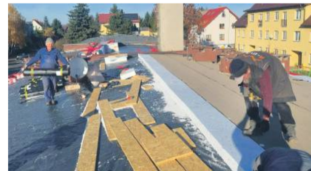
Latem zakończył się remont dachu budynku przy ulicy Konopnickiej 20. Prace objęły połowę powierzchni dachu