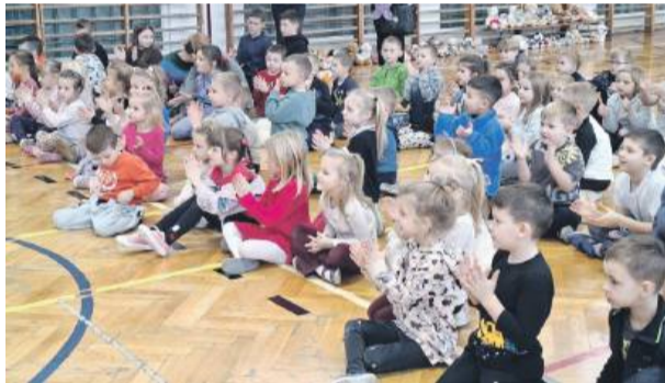
Dzieci z uwagą słuchają historii o pluszowych misiach.

upamiętniający to wydarzenie, zainspirował do stworzenia maskotki nazwanej na cześć prezydenta „Teddy Bear”. Sto lat później na pamiątkę tych wydarzeń wszystkie pluszowe misie, które stały się bardzo popularną zabawką, po raz pierwszy obchodziły swoje święto – mówił. Dzieci po wysłuchaniu tej i wielu innych ciekawych opowieści,