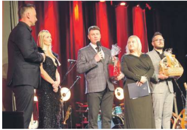
Wydarzenie rozpoczęli kierujący SOK-iem oraz samorządowcy

szym przesłaniem mówił o treści granych piosenek i o tym, co w życiu istotne. Były to interesujące słowa, za które również otrzymywał brawa. Sześciu muzyków przez ponad 1,5 godziny zaprezentowało wiele swoich znanych przebojów.