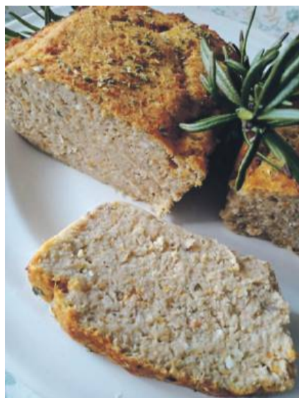
Wspaniale jest zaskoczyć gości przy świątecznym stole czymś tradycyjnym w nowej odsłonie.

wa: marchewki, seler, por i cebulę wkładamy do garnka. Zalewamy wodą, dodajemy liście laurowe, ziele angielskie i sól. Wszystko gotujemy al dente . Pod koniec gotowania warzyw, dodajemy oczyszczone i umyte karpie bez głowy, pokrojone w dzwonki. Gotujemy razem ok. 10 min. Rybę i warzywa wyjmujemy i studzimy. W tym czasie gotujemy dwa jajka na twardo, bułkę moczymy w mleku, rozpuszczamy masło i odstawiamy do wystygnięcia.