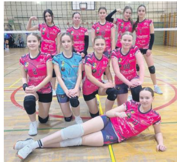
Zwycięska drużyna młodniczek Tygrysów Strzelin