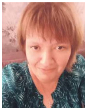
Autorka cudnego przepisu na nietypowy paszтет.

Rybę obieramy z ości i skóry. Mielimy w maszynce razem z warzywami i ugotowanymi jajkami. Przekładamy do miski i dodajemy dwa surowe jajka, namoczoną bułkę, wystudzone masło, gałkę muszkatołową i oregano. Wyrabiamy i doprawiamy do smaku pieprzem i solą, jeśli potrzeba. Jest to proporcja na dwie średnie foremki. Formy smarujemy oliwą i obsypujemy bułką tartą. Przekładamy masę i formujemy ładny kształt. Wierzch można udekorować, delikatnie posypując oregano, kolorowym pieprzem lub płatkami papryki. Pieczemy w temperaturze ok. 175-180°C przez godzinę. Odstawiamy do wystudzenia i zjadamy ze smakiem. Zamiast dwóch karpie można dać jednego i jednego amura, jeśli ktoś woli.