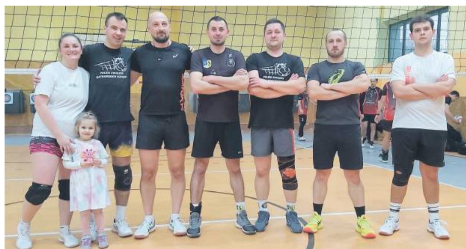
Zespół Uzależnionych od Siatkówki

na czele ligowej stawki z kompletem zwycięstw. W ostatnim niedzielnym pojedynku Vamoss zmierzli się z drugą drużyną Sunrise. Spotkanie zakończyło się wynikiem 3:1 dla