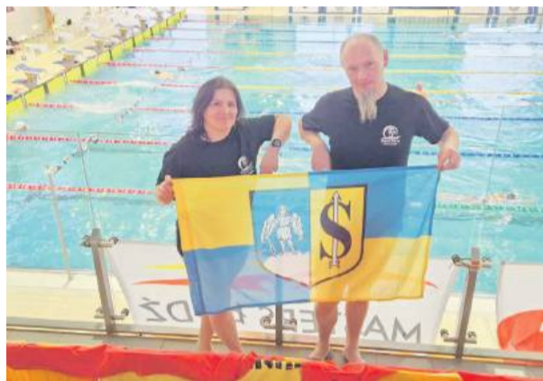
Reprezentanci Strzelina podczas rywalizacji w Gliwicach

W dniach 14–16 listopada w Gliwicach odbyły się Zimowe Mistrzostwa Polski Masters – jedna z najważniejszych imprez pływackich w kraju dla zawodników kategorii Masters. Do rywalizacji przystąpiło