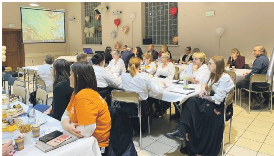
Spotkanie zorganizowane przez Biuro Powiatowe ARiMR w Strzelinie cieszyło się wysoką frekwencją