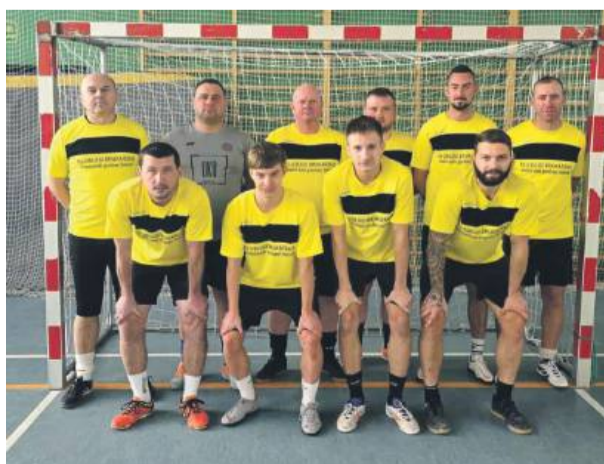
Drużyna Czarnych Kondratowice