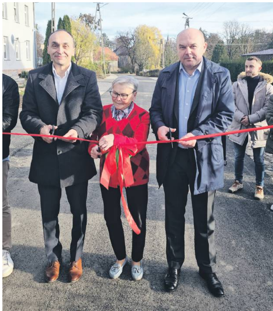
Uroczyste otwarcie drogi przy ul. Pocztowej w Przewornie