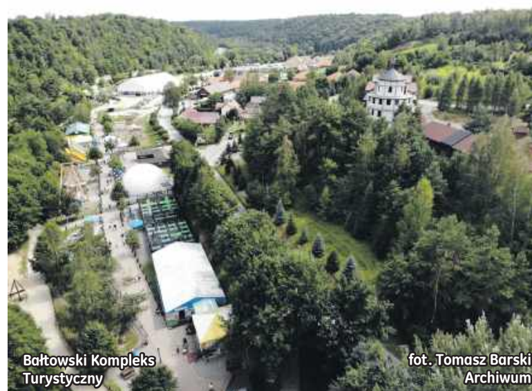
Bałtowski Kompleks Turystyczny

Na terenach gminy powiatu ostrowieckiego jest szereg miejsc nie odkry-