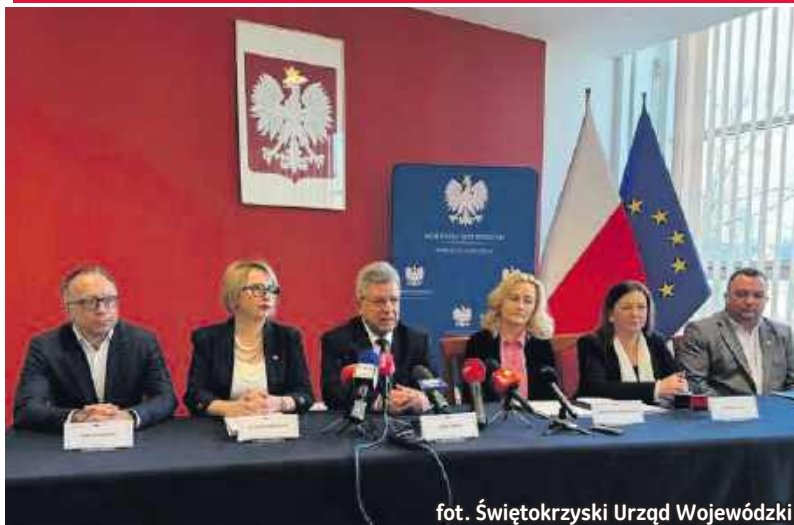
fol. Świątokrzyski Urząd Wojewódzki

W minionym tygodniu w Urzędzie Wojewódzkim w Kielcach został podpisany list intencyjny w sprawie zabezpieczenia przeciwpowodziowego Ćmielowa, Brzóstowej, Grójca i Woli Grójeckiej. To domy i gospodarstwa mieszkańców tych miejscowości ucierpiały w lipcu 2024 roku po nawałnicy, która zamieniła się w powódź.