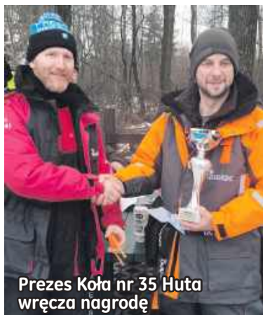
Prezes Koła nr 35 Huta wręcza nagrodę