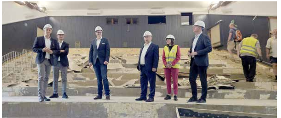
Od kilku miesięcy burmistrz oprowadza kogo się da po zrujnowanej w sierpniu 2025 sali kinowej (po co już wtedy), gdzie nic się remontowo nie dzieje