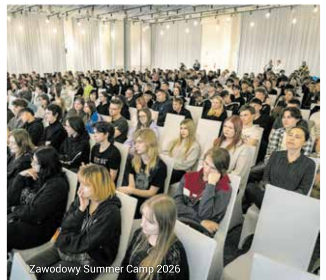
Zawodowy Summer Camp 2026

Z video relacjami i zdjęciami z wydarzeń można zapoznać się na stronie internetowej