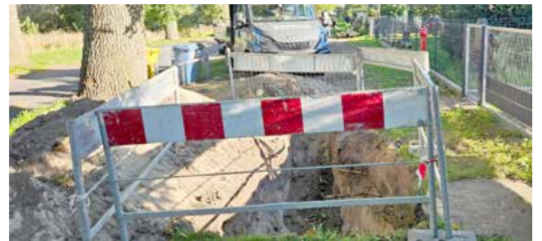
Zdjęcia dokumentujące inwestycję w Konarzewie a załączone jako ilustracja do materiału firmy PR, zostały wykonane dość dawno. Dlaczego sami pracownicy UM nie mogli sporządzić artykułu promocyjnego - nie wiadomo

za sporządzenie w imieniu gminy informacji prasowej o inwestycjach ściekowych - notabene informacji, nie zawierających żadnych nowości, wszyscy znamy te szczegóły inwestycyjne, które na dodatek wielokrotnie podawaliśmy w przestrzeni medialnej „za darmo”. Za darmo, ponieważ dotyczy inwestycji ważnych dla mieszkańców. Mamy nadzieję, że burmistrz wytłumaczy radnym na najbliższej sesji - CO TO JEST! i poda