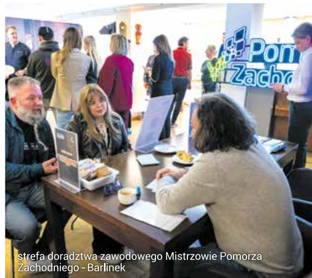
strefa doradztwa zawodowego Mistrzowie Pomorza Zachodniego - Barlinek

– Dzięki swojej kreatywności i zaangażowaniu młodzi ludzie otrzymali wiele cennych wskazówek od mistrzów w swoim fachu. Udział w tym konkursie dał im także możliwość nawiązania kontaktów z przyszłymi pracodawcami, pozwolił na zdobycie nowych doświadczeń i inspiracji do planowania swojej kariery. Dla wielu uczestników było to również pierwsze tak bliskie