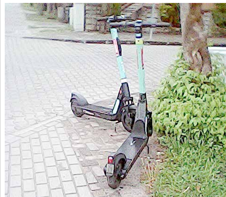
To barykada zbudowana z hulajnogi przy ul. Ogrodowej

Jeszcze niedawno hulajnogi elektryczne w powszechnym odbiorze miały być symbolem nowoczesności i miejskiej mobilności. Dziś coraz częściej (przykładów aż nadto tu na miejscu) stają się symbolem bałaganu, bezmyślności i kompletnego braku nadzoru.