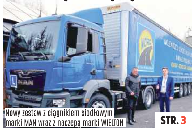
Nowy zestaw z ciągnikiem siodłowym marki MAN wraz z naczepą marki WIELTON

Białski WORD gotowy do nowych egzaminów. Komentujący mają wątpliwości