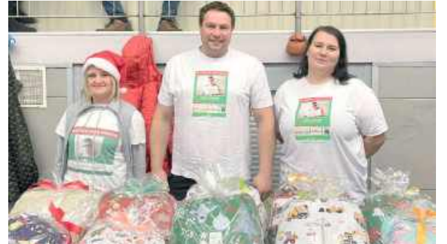
Rodzina i przyjaciele Adasia są kołem napędowym akcji „Kup jaśka dla Adaśka”

Walka trwa – i potrzebuje ludzi. Rodzina Adasia podkreśla, że dziś