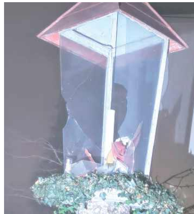
Grozi mu do 5 lat pozbawienia wolności

Lublin: Za obrazę uczuć religijnych i zniszczenie mienia odpowie 26-latek. Mężczyzna dokonał uszkodzenia aż czterech przydrożnych kapliczek.