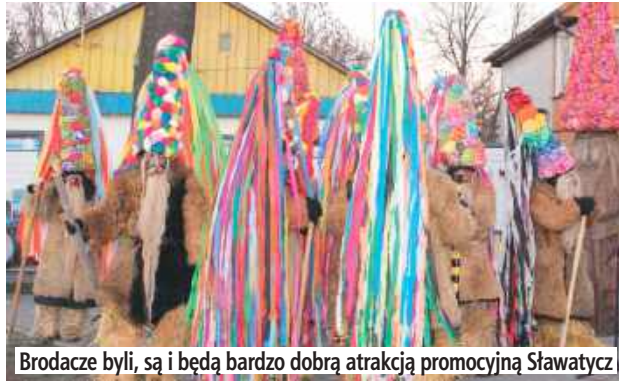
Brodacze byli, są i będą bardzo dobrą atrakcją promocyjną Sławatycz

W godz. 11.30-14.30 będą paradować i biegać po miejscowych ulicach. Przy okazji mogą swawo-