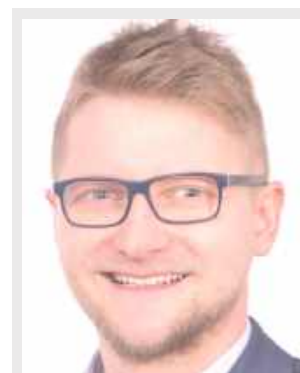
L organizator akcji

Ostatecznie organizatorzy otrzymali blisko 100 listów. Wiele z nich wyróżniało się starannością, kreatywnością i zaangażowaniem. Było widać, że dzieci pisały je wspólnie z rodzicami, poświęcając na to czas i uwagę. To właśnie te wyjątkowo dopracowane listy postano-