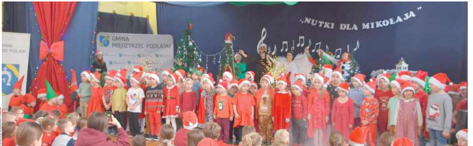
Drużyna z przedszkola w Rzeczy. Druga część wydarzenia odbyła się w świątecznie udekorowanej sali gimnastycznej szkoły w Rzeczy, gdzie przedszkolaki z Przedszkola Samorządowego im. Doroty Gellner oraz uczniowie szkół w Rzeczy i Misiach zaprezentowali koncert pod hasłem „Nutki dla Mikołaja”

Ulicami Rzeczy przeszedł IV Gminny Korowód Świętego Mikołaja. W wydarzeniu wzięło udział blisko 350 osób – przedszkolaki, uczniowie, młodzież, rodzice, nauczyciele, seniorzy oraz przedstawiciele lokalnych instytucji, organizacji i władz samorządowych.