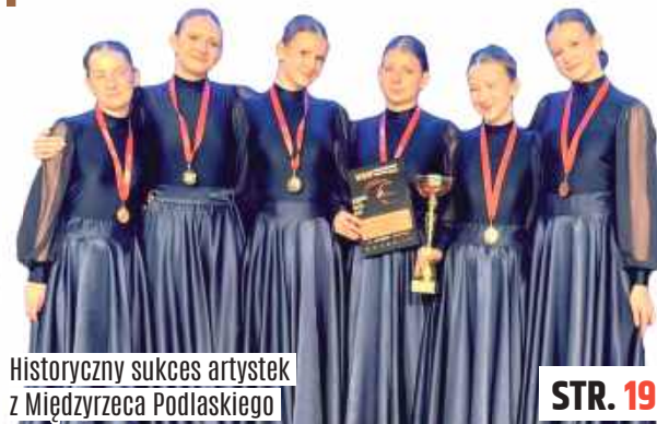
Historyczny sukces artystek z Międzyrzecza Podlaskiego

Reprezentantki szkoły tańca MOVE MI sięgnęły po mistrzostwo świata