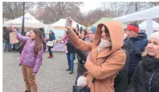
Mamy oczywiście kibicowały swoim pociechom występującym na scenie Jarmarku Bożonarodzeniowego