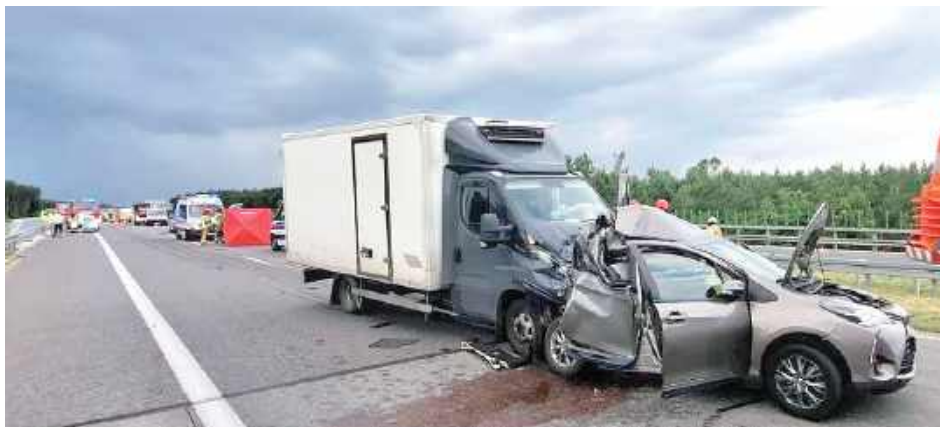
O sile, z jaką auto dostawcze wjechało w niewielką osobówkę, może świadczyć skala zniszczeń widocznych na zdjęciach z miejsca zdarzenia. Iveco zmiażdżyło niemal pół toyoty, wbijając się przednią maską w tył pojazdu

POWIAT RYCKI: Osoba toyo stała nagle na trasie S17. 92-latek postanowił zepchnąć swoje auto na pas awaryjny. Nie zdążył, bo najechało na niego iveco. Mężczyzna zginął na miejscu. Kierowca dostawczaka usłyszał zarzut. Prokurator czeka na kluczowy dowód w sprawie.