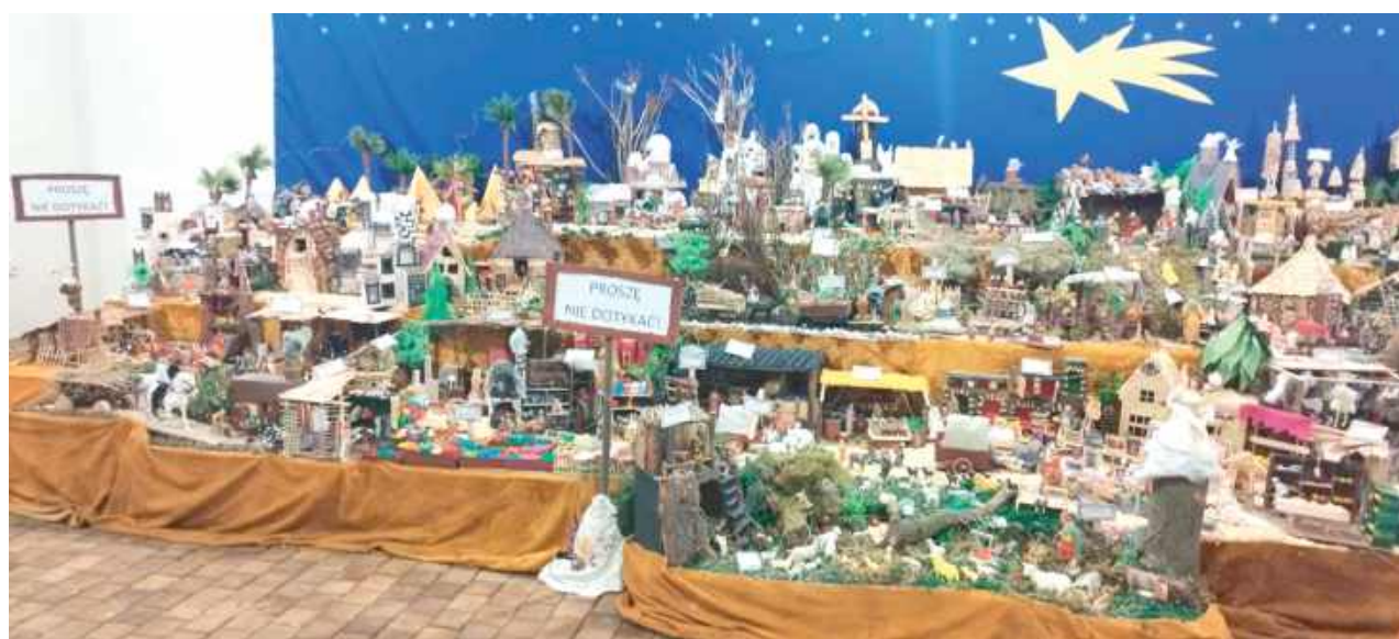
W tym roku to dzieło zostanie po raz pierwszy udostępnione szerszej publiczności