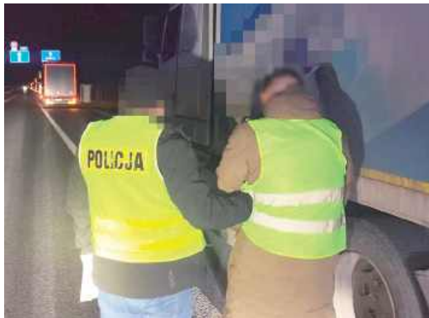
Kryminalni białskiej komendy pełniący służbę w rejonie kolejki podjęli kontrolę drogową wobec 25-letniego kierowcy ciężarowego Volvo

Policjanci przy współpracy z placówką Straży Granicznej złożyli kolejny wniosek o wydalenie z Polski cudzoziemca. W tym przypadku dotyczy on 25-letniego obywatela Białorusi. Mężczyzna podejrzany jest o posłużenie się przerobionym wcześniej dokumentem przewozowym. Na swoim koncie miał też inne przewinienia drogowe.