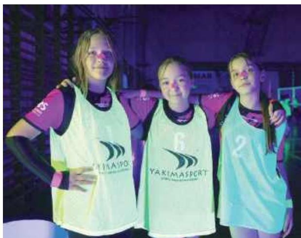
Fluorescencyjne elementy strojów i piłek sprawiły, że sportowa rywalizacja nabrała zupełnie nowego wymiaru

Najmłodszy adepci siatkówki z Międzyrzec Podlaskiego wzięli udział w wydarzeniu, które na długo pozostanie w ich pamięci. „Siatkarskie Mikołajki w ultrafiolecie” połączyły sportową aktywność, nowoczesną oprawę wizualną oraz świąteczną atmosferę, tworząc wyjątkowe widowisko pełne ruchu, uśmiechów i pozytywnej energii.