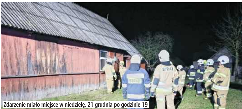
Zdarzenie miało miejsce w niedzielę, 21 grudnia po godzinie 19

POWIAT ŁUKOWSKI: W niedzielę, 21 grudnia o godz. 19.09 strażacy gasili budynek mieszkalny w miejscowości Klimki.