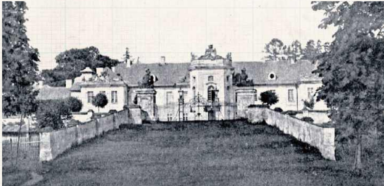
Pałac w Radzynie na początku XX wieku