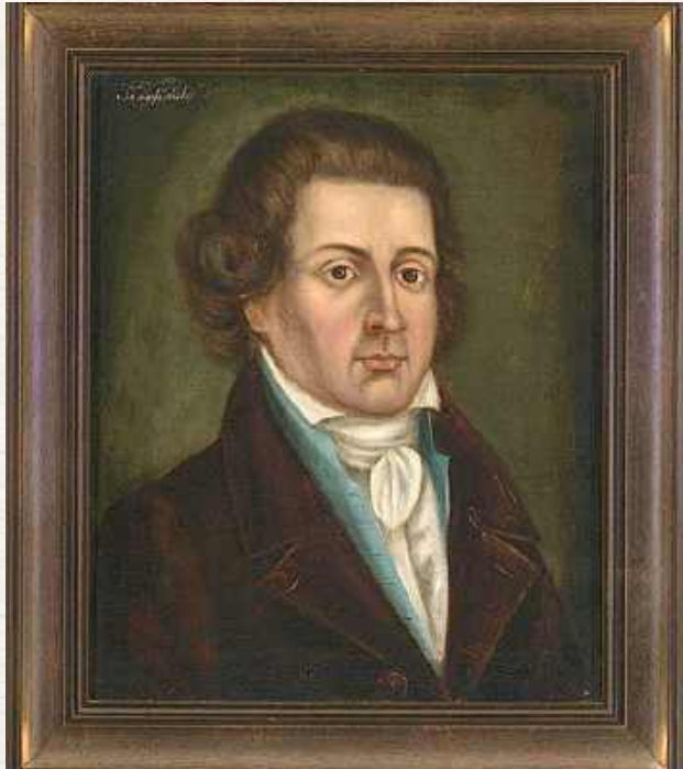
Portret Smuglewicza z początków XIX stulecia. Pod koniec życia wycofał się z życia dworskiego i artystycznego, osiadając w dworku na Białorusi, argumentując to (podobnie jak Książka...) żalem za utraconą Ojczyznę. Zmarł w 1825 roku

Pierwszy raz „Pieśń o Narodzeniu Pańskim”, znaną szerzej - tak szeroko, jak tylko się da... - jako „Bóg się rodzi”, wykonano w Białymstoku w kościele farnym w 1792 roku, wydano ją (razem z innymi „Pieśniami nabożnymi”) w niedalekim Supraślu. Autor, Franciszek Karpiński (1741-1825), był jednak przez długie lata związany z rodziną Czartoryskich i częstym gościem w Puławach.