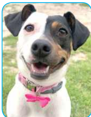
Bambi, Oliwia Bednarczyk, Kowala Druga