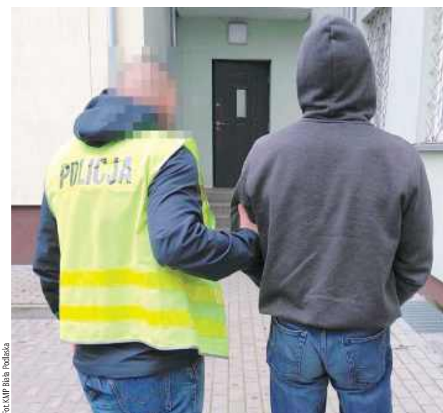
Agresywnemu 41-latkowi grozi kara do trzech lat pozbawienia wolności

- Z relacji zgłaszającej wynikało, że tego dnia powróciła do domu z wyjazdu. Jej partner wszczął awanturę, w trakcie której groził jej i ich dwumiesięcznemu synkowi pozbawieniem życia. Był przy tym agresywny i próbował ją uderzyć. Mężczyzna został zatrzymany na terenie jednej z posesji w gm. Biała Podlaska, gdzie próbował odzyskać rzeczy partnerki pozostawione tam przez nią. Agresor trafił do „policyjnego aresztu” - informu-