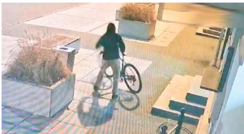
Policyjne działania przyczyniły się do ustalenia personaliów sprawcy oraz odzyskania skradzionego mienia i zwrócenia prawowitemu właścicielowi

- Na miejsce skierowano policjantów patrolówki, którzy ustalili, że 24-latek zgłaszający wszedł do sklepu spożywczego,