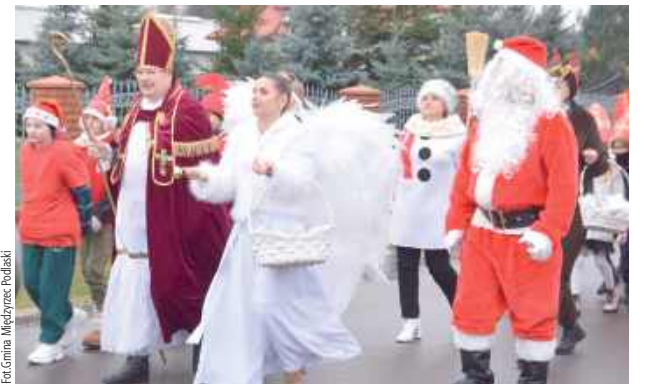
Korowód poprowadzili dwaj Święci Mikołajowie – biskup Miry oraz współczesny Mikołaj

Zwieńczeniem spotkania było wręczenie prezentów dzieciom oraz wspólne zabawy i tańce z udziałem Świętego Mikołaja.