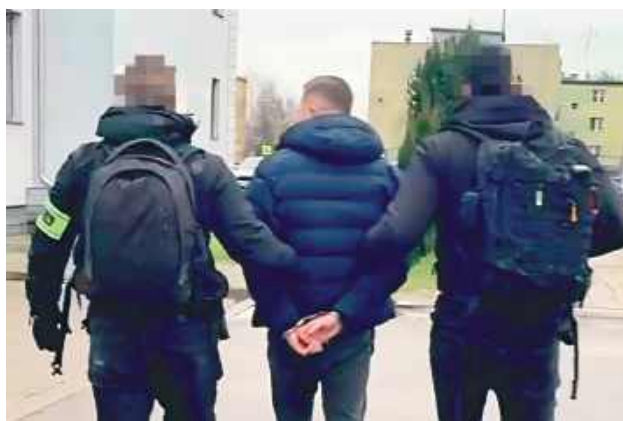
Sprawcom grozi kara do 5 lat pozbawienia wolności

Do zdarzenia doszło w nocy z 25/26 lipca. Dyżurny parczewskiej jednostki otrzymał zgłoszenie dotyczące pobicia mężczyzny w rejonie jednego z lokali gastronomicznych w miejscowości Białka. Na miej-