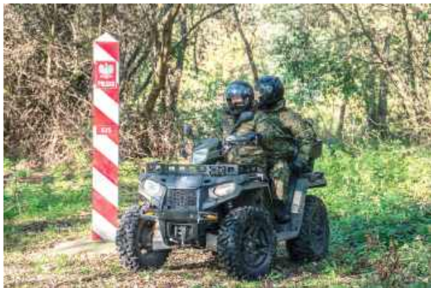
Niektórej służba przy granicy może wydawać się nawet przygodą...

Kontrakty mogą zawierać zarówno byli funkcjonariusze, jak i osoby dotychczas niezwiązane ze służbą. Głównym zadaniem nowo przyjętych funkcjonariuszy będzie fizyczna ochrona granicy pań-