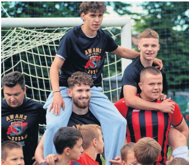
W klasie B2 Stalowa Wola - San Rozwadów zapewnił sobie awans dzięki wygranej w ostatniej kolejce