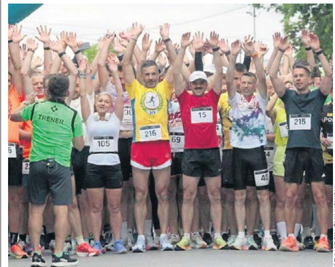
Rozgrzewkę przed biegiem na 10 km poprowadził Robert Korzeniowski, który potem przebiegł się z dziećmi na 1 km

Partnerem Biegu było Województwo Podkarpackie.