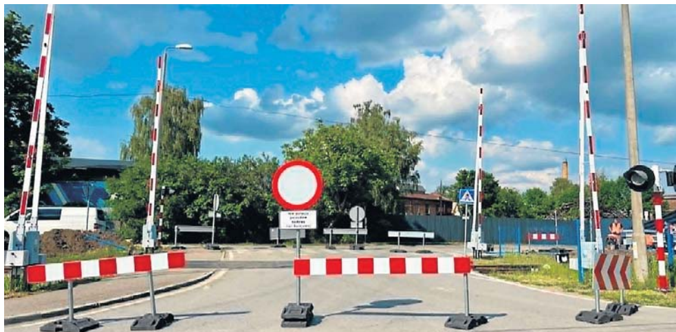
Część przejazdów kolejowych w Krośnie już została zamknięta. To jednak dopiero początek. Kolejne utrudnienia planowane są w najbliższych tygodniach

- Aktualnie kontynuowane są prace na kolejnych odcinkach linii nr 108 od stacji Jasło