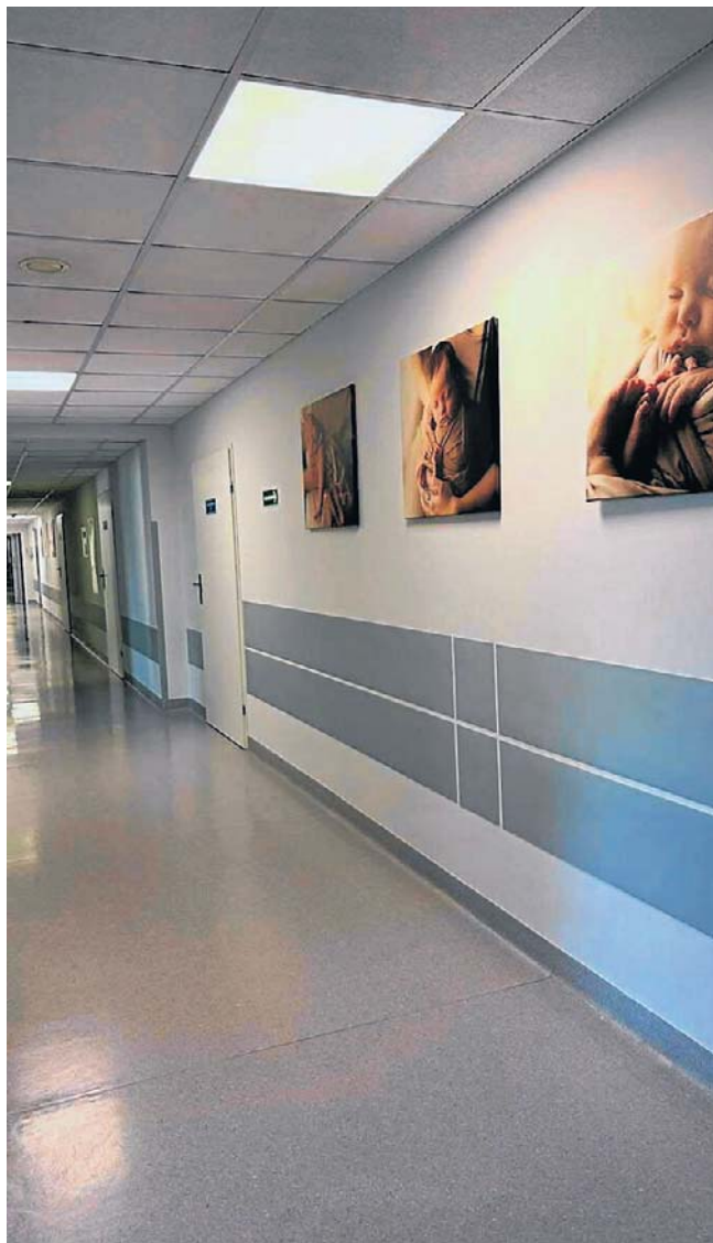
Sąsiednie powiaty, które zlikwidowały porodówki, kierują pacjentki do szpitala w Brzozowie.

- Mówienie, że skala porodów jest problemem przy naszej liczbie około 700 porodów rocznie, jest kpina. Jeżeli pojedyncze świadczenie jest wykonywane ze stratą, to gdybyśmy je pomnożyli nawet dwa razy, dalej będziemy generować stratę - zaznacza.