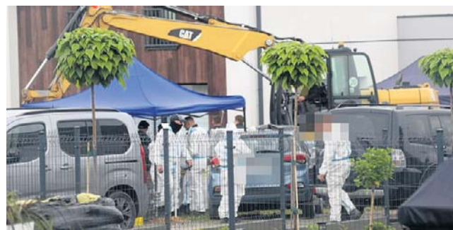
Przez cztery dni śledczy przeszukiwali działkę

Śledztwo w tej sprawie prowadzi Prokuratura Okręgowa w Rzeszowie.