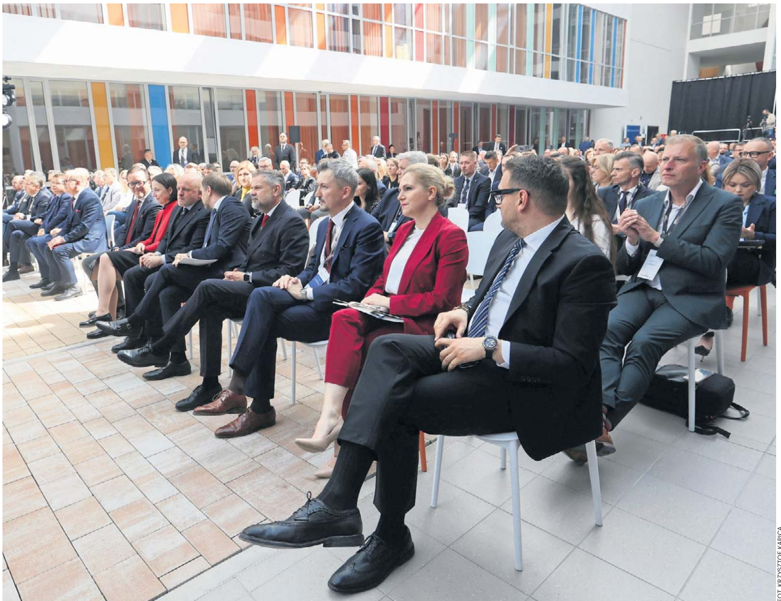
Forum zgromadziło przedstawicieli największych firm, administracji i ekspertów, stając się miejscem ważnych debat i nawiązywania współpracy