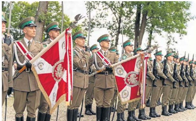
W Kalwarii Paclawskiej w trakcie uroczystości oddano salwę honorową ku pamięci pomordowanych duchownych.

Inicjatywa powstania alei została podjęta wspólnie przez Zakon Franciszkanów w Kalwarii Paclawskiej oraz Stowarzyszenie Pamięć Kapelanów Katyńskich.