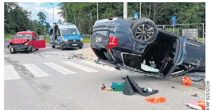
Ze wstępnych ustaleń policji wynika, że kierujący VW Caddy nie ustąpił pierwszeństwa przejazdu Volvo

Policjanci sprawdzili stan trzeźwości uczestników zdarzenia. Zarówno kierowca volkwagena, jak i kierująca volvo byli trzeźwi.