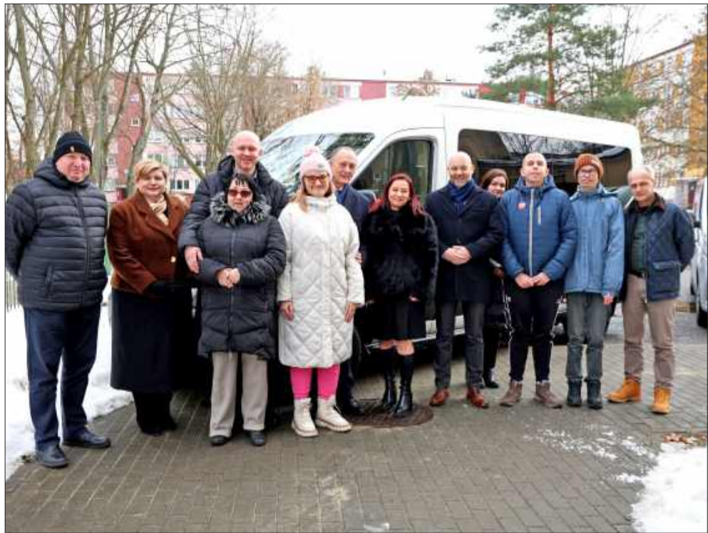
Nowy minibus dla osób z niepełnosprawnościami.

To jedna z tych inwestycji, które realnie wpływają na codzienne życie mieszkańców. Gmina Miejska Mielec, przy wsparciu Państwowego Funduszu Rehabilitacji Osób Niepełnosprawnych, zakupiła całkowicie nowego minibus przeznaczony do przewozu osób z niepełnosprawnościami. Z pojazdu korzystać będą uczestnicy Warsztatów Terapii Zajęciowej w Mielcu.