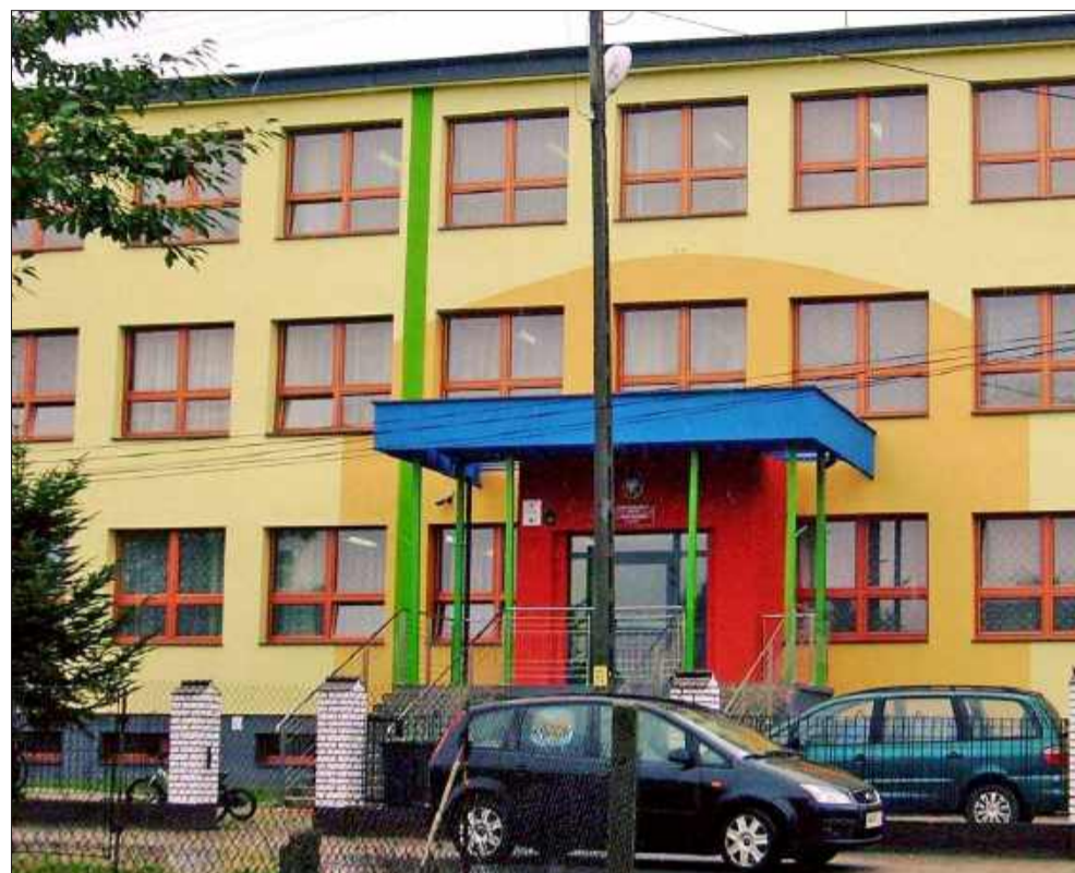
Wyróżniona mielecka szkoła

Jeśli aktualni i byli uczniowie w plebiscycie oddają głosy na swoją szkołę, to znaczy, że jest naprawdę dobra. Życzymy tego wszystkim placówkom.