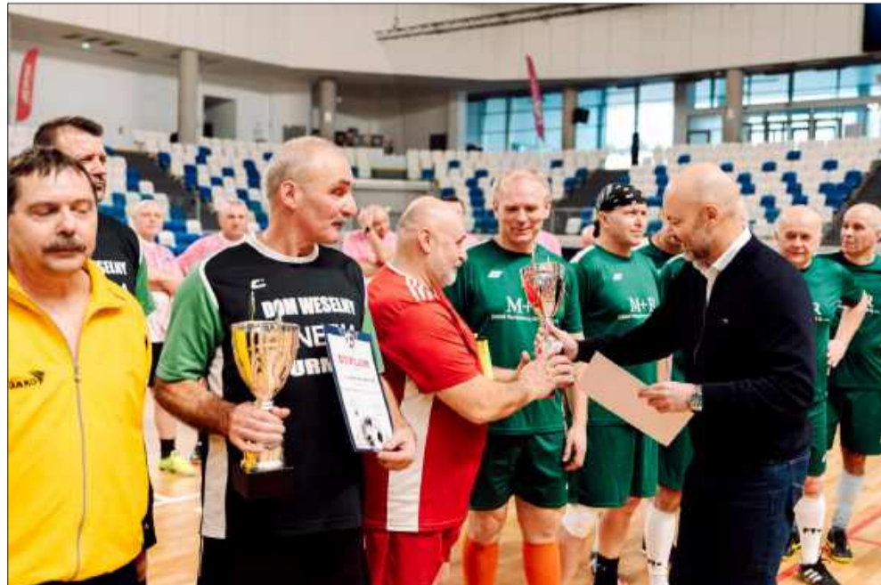
Gratulacje dla zwycięzców!