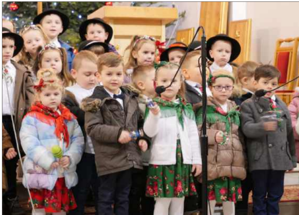
Występ był efektem wielu tygodni pracy nauczycieli i opiekunów Ochronki.

W czwartek, 29 stycznia, kościół parafialny wypełnił się po brzegi. W ławkach zasiedli dumni rodzice, rodzeństwo, babcie i dziadkowie, którzy przyszli zobaczyć i usłyszeć występ dzieci z Ochronki Świętego Józefa w Radomyślu Wielkim. Okazja była wyjątkowa – koncert kolęd i pastorałek połączony z obchodami Dnia Babci i Dziadka.