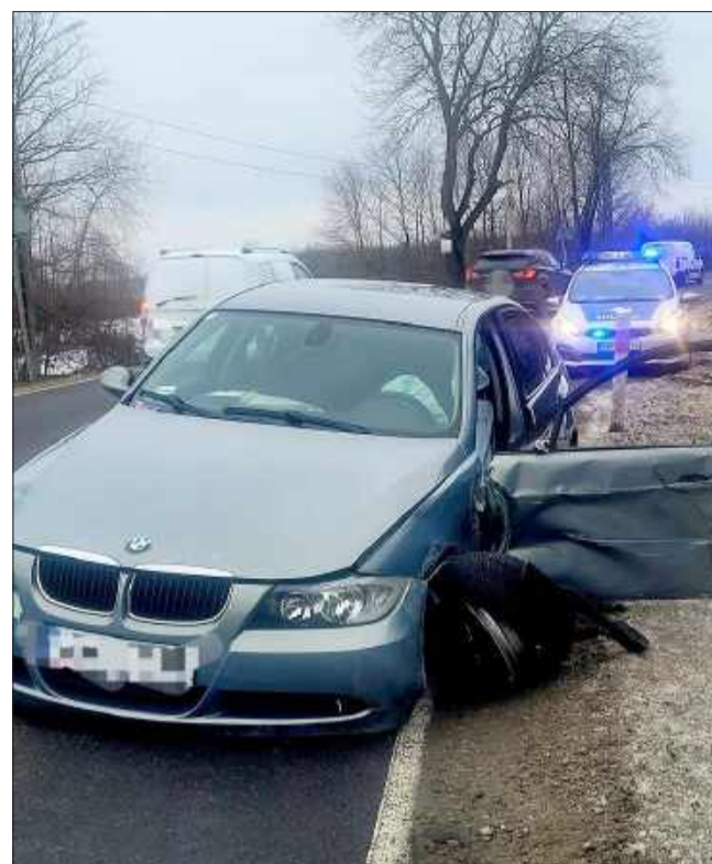
Poranna kolizja w Zgórsku. Kierowca BMW był pijany