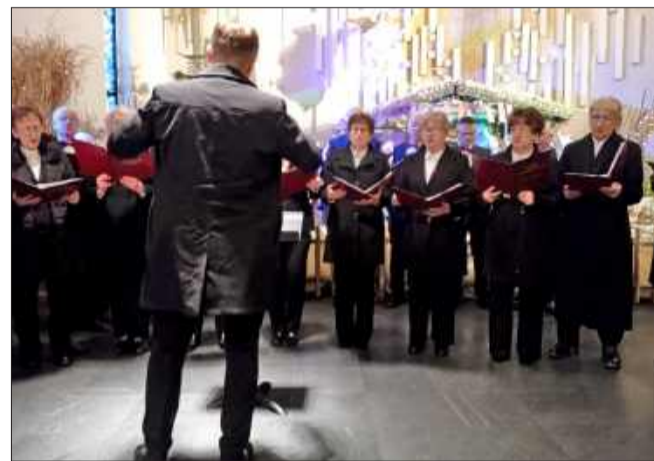
Wykonania wzbudzały prawdziwe emocje.

Publiczność mogła usłyszeć kołędy doskonale znane, ale także te rzadziej wykonywane – w tym kołędy francuskie i nie-