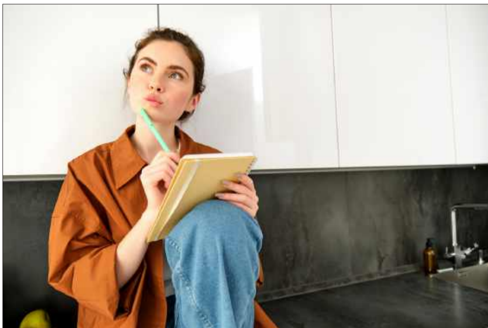
To kobieta zazwyczaj odpowiedzialna jest za całą logistykę domową.

Wielu mężczyzn bagatelizuje to, uważając, że sporo z tych przemyśleń czy niewidzialnych ruchów po prostu nie jest konieczne, a pomoc może lepsza organizacja, kalendarz, lista zakupów czy coś podobnego. Potwierdzeniem tego jest fakt, że przecież mężczyźni bez kobiet także żyją i to często w bardzo dobrym stylu. Po co analizować rozmowę i wypowiedzi tej czy tamtej osoby? Człowiek odpowiada za to, co powiedział i czego nie powiedział - reszta jest milczeniem. Dodatkowo spraw-