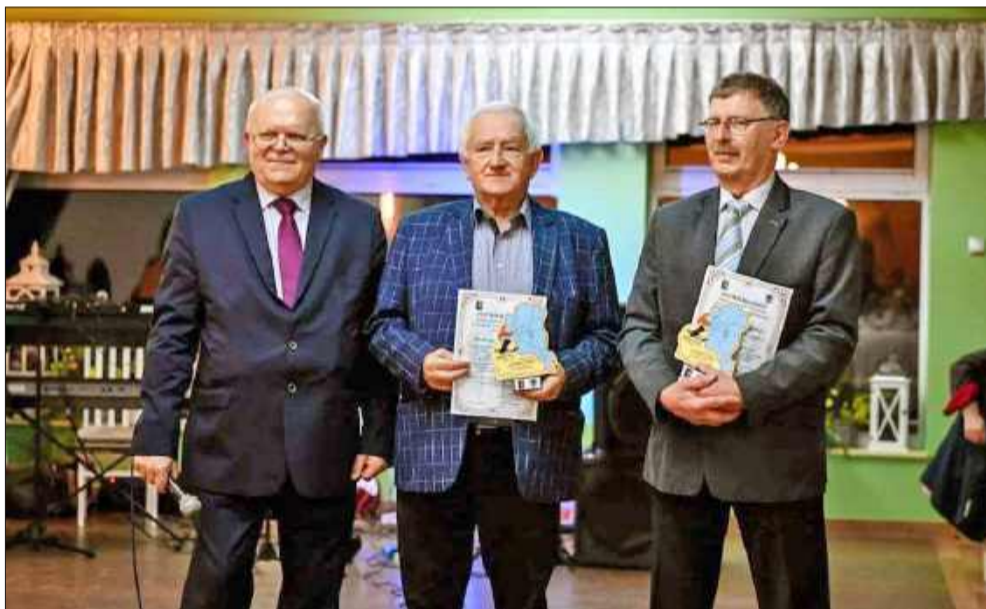
Wręczono także statuetki „Przyjaciel Osiedla Kilińskiego”