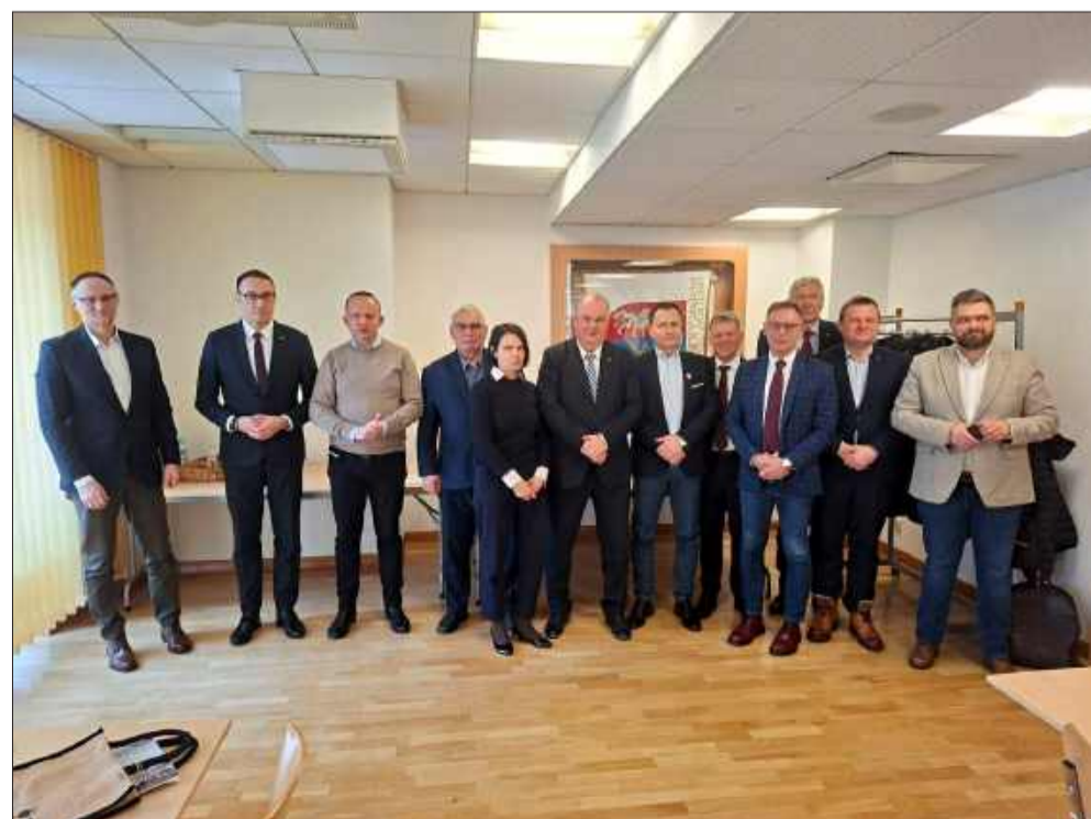
Nowy projekt kolejowy na Podkarpaciu. Samorządy już po konsultacjach.

dzy samorządami a instytucjami odpowiedzialnymi za infrastrukturę kolejową. Marta Warias