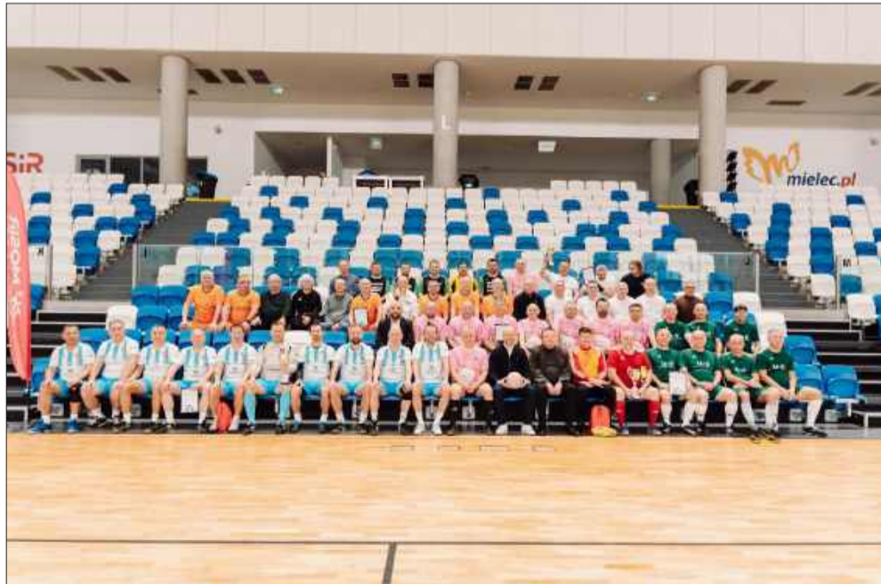
W turnieju udział wzięło 6 drużyn.

Turniej Oldboys 45+ po raz kolejny pokazał, że sport nie zna wieku, a wspólna rywalizacja i spotkanie na boisku są doskonałą okazją do integracji oraz budowania relacji w lokalnym środowisku sportowym. MW