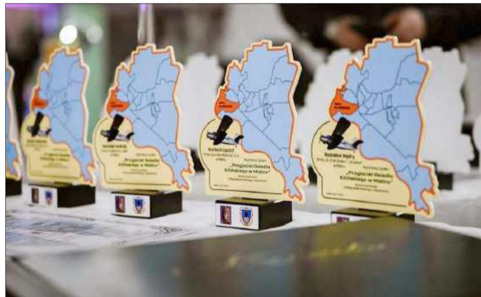
Statuetki „Przyjaciel Osiedla Kilińskiego”.