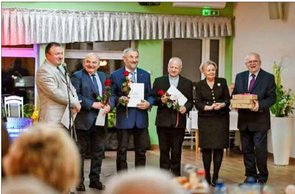
Wręczono tytuły „Zasłużony dla Osiedla Kilińskiego i Osiedla Kościuszki”