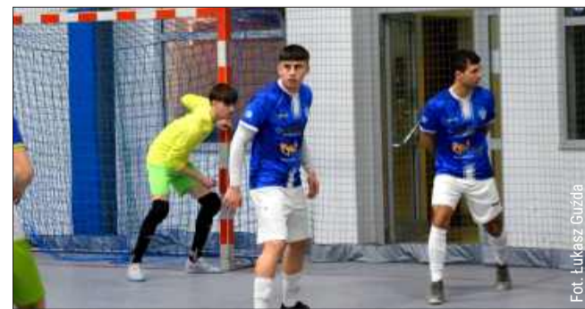
Mielczanie przegrali w Nisku.

Łukasz Guźda - dziennikarz sportowy tel. 509 173 793 mail: lukasz.guzda@korso.pl