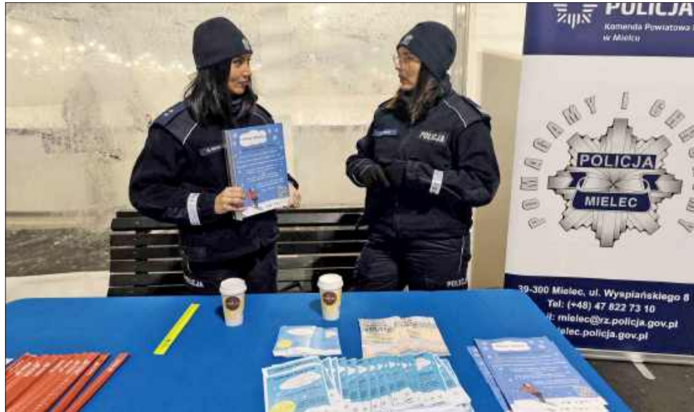
Funkcjonariuszki omawiają strategie działania.

Nasze mieleckie funkcjonariuszki kilkakrotnie zjawiały się na tafli lodowiska. Okazało się, że nie tylko świetnie radzą sobie na w łyżwach, ale też bez problemu rozmawiają przy tym z użytkownikami obiektu, rozdają materiały informacyjne i przypominają o podstawowych zasadach bezpieczeństwa. Udało się nawet przeprowadzić konkurs