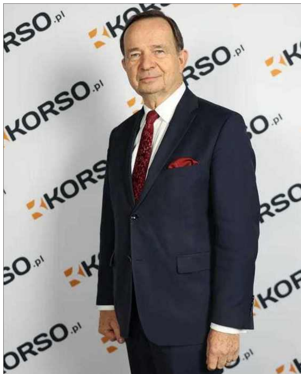
Marszałek Władysław Ortyl także zapozował na naszej ścianie.