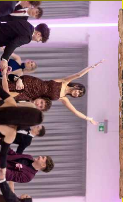
Studiówka ZST w Mielcu 2026.