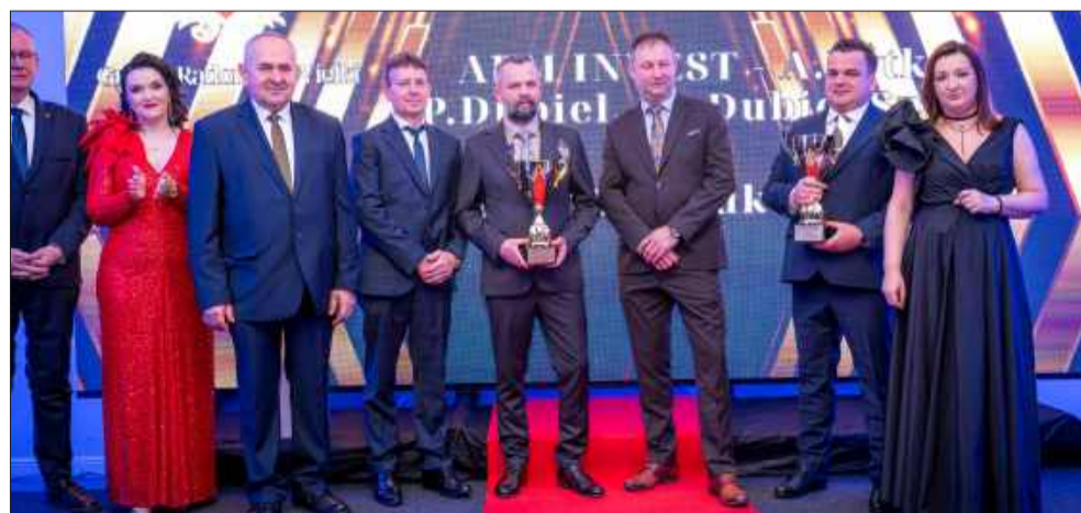
Wręczenie nagród i wyróżnień dla przedsiębiorców, którzy szczególnie wyróżnili się w minionym roku.