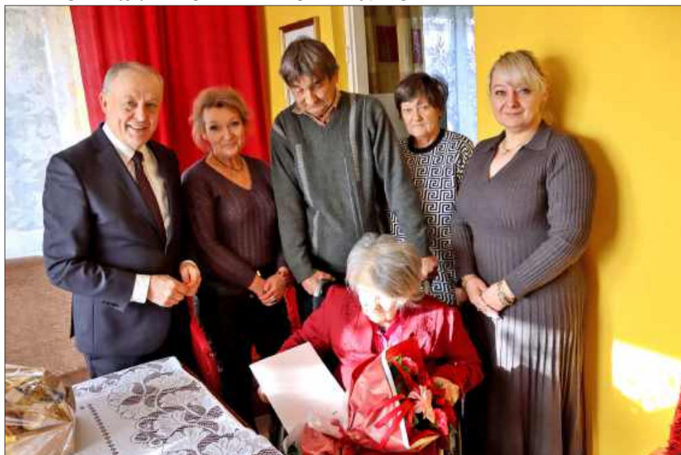
Jubilatka od lat otoczona jest troskliwą opieką dzieci i wnuków.