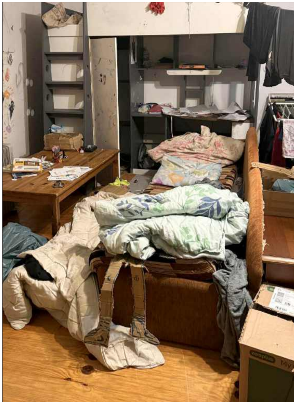
W jednym pomieszczeniu toczy się całe życie rodziny – sen, nauka, zabawa i chwile wyciszenia.