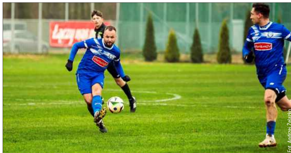
Victoria na wiosnę zagra o utrzymanie w klasie okręgowej.

Przygotowania do nowej rundy ruszyły już w Czerminie. Victoria jest już po dwóch sparingach, których w sumie rozegra siedem.