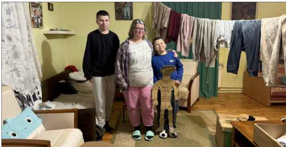
Mimo trudnych warunków mama robi wszystko, by zapewnić synom stabilne i bezpieczne dzieciństwo.

Jedno pomieszczenie, brak ogrzewania i problemy z wilgocią – w takich warunkach w Maliniu (gm. Tuszów Narodowy) żyje samotna matka z dwójką dzieci w spektrum autyzmu.