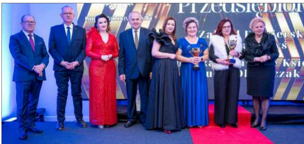
Nagrodzeni w kategorii: wytrwały przedsiębiorca.