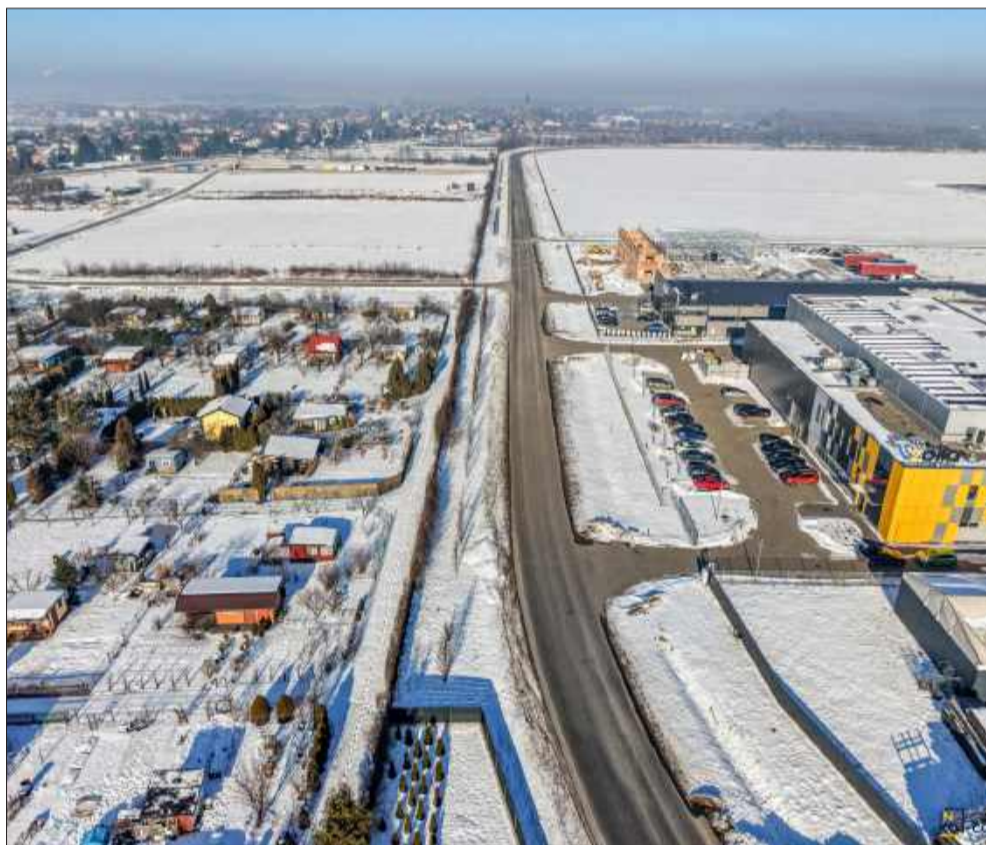
Dwie ważne inwestycje drogowe w regionie. Ruszają prace przy strefie ekonomicznej i w Szydłowcu.

tys. pojazdów, a natężenie ruchu systematycznie rośnie.