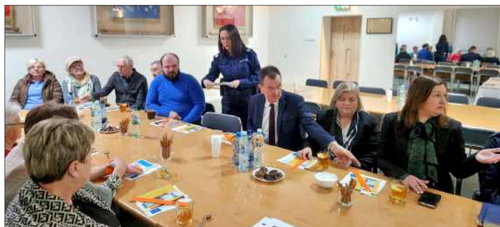
Debata z Policją w Radomyślu Wielkim.