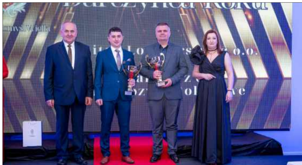
Darczyńcami Roku zostały firmy: United Logistics z Janowca oraz Wolak Przewozy Autokarowe z Dulczy Wielkiej.