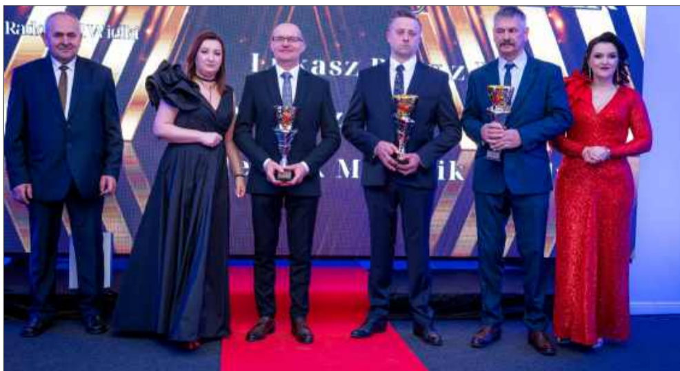
Zasłużeni rolnicy gminy Radomyśl Wielki.