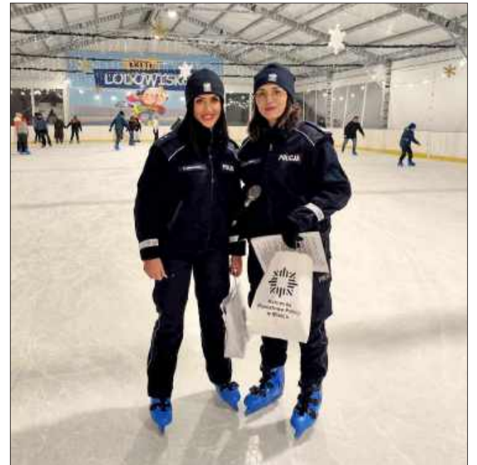
Kto nie lubi kontroli trzeźwości, powinien cieszyć się na bardziej „wesole” działania policji

Mieleckie policjantki zachęcały także do wzięcia udziału w ogólnopolskim konkursie Policji, który również ma na celu promowanie zimowego bezpie-