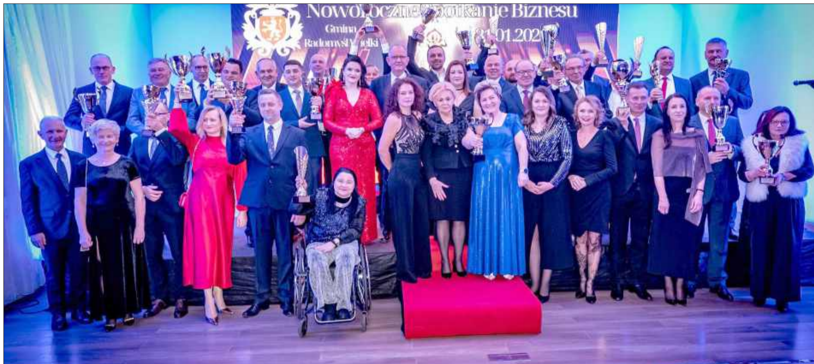
Uhonorowani przedsiębiorcy odebrali gratulacje i podziękowania za rozwój swoich firm oraz aktywność społeczną.

Jednym z ważnych punktów wydarzenia było wręczenie nagród i wyróżnień dla firm, które w szczególny sposób zapisały się w minionym roku na mapie lokalnej gospodarki. Uhonorowano przedsiębiorców za rozwój działalności, innowacyjność,