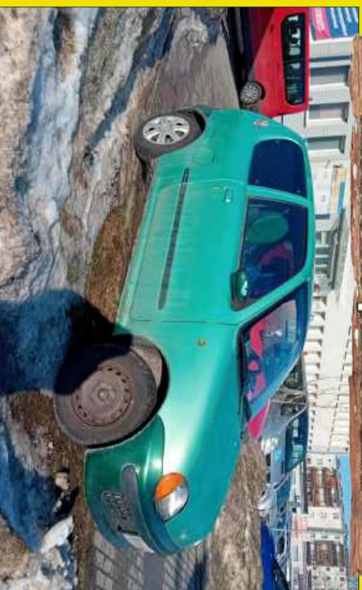
Niewielki, to i na chodniku się zmieści.