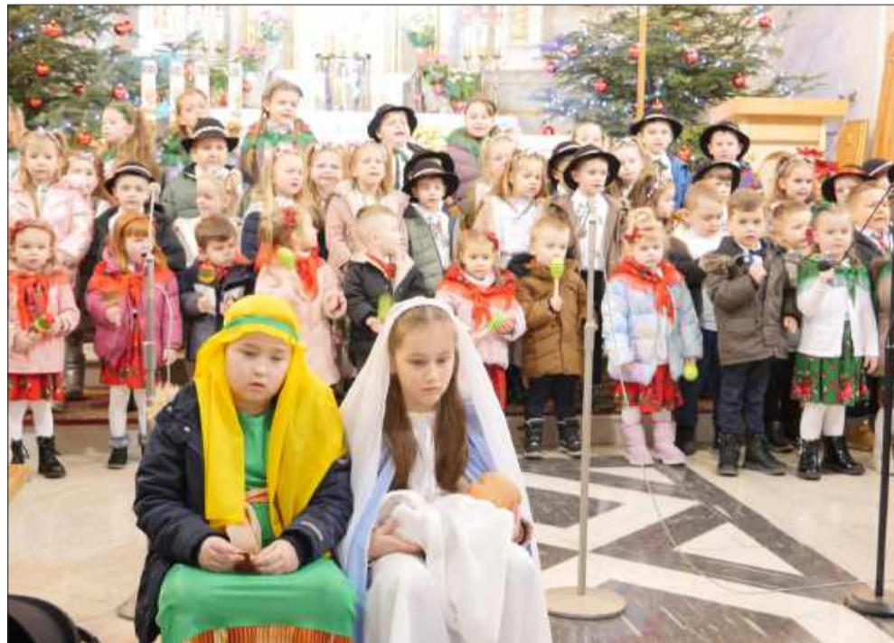
Dzieci z Ochronki Świętego Józefa zachwyciły kolędami

brze znane kolędy. Publiczność mogła usłyszeć m.in. „Była noc”, „Grajmy Panu”, „Wolek i Osiołek”, „Nie płacz Jezus”, a także klasyczne kolędy: „Z Narodzenia Pana”, „Przybieżeli do Betlejem Pasterze” oraz „Wśród nocnej ciszy”. Każdy utwór był wykonany z sercem i starannością, co tylko potwierdziło, jak wiele pracy i troski wkładane jest w co-