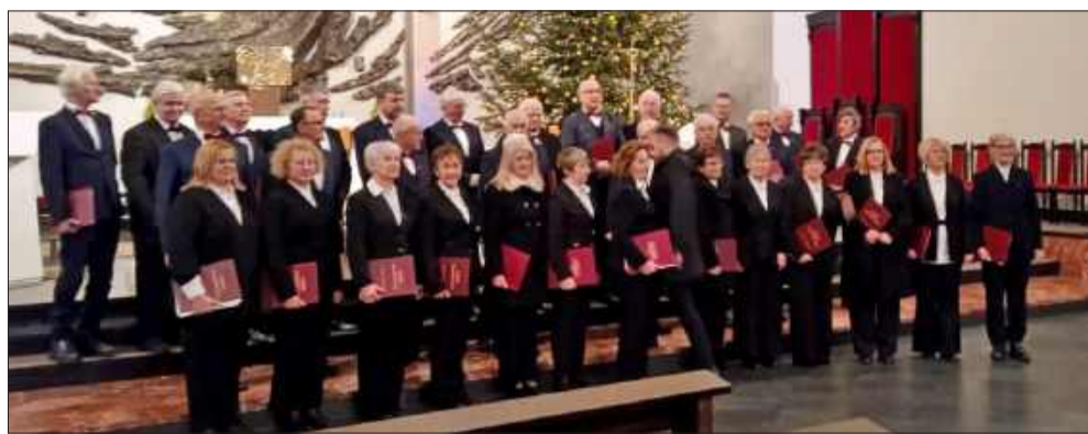
Chóry wykonały pamiątkowe zdjęcie na tle głównej nawy kościoła.

2 lutego obchodzimy w Kościele katolickim święto Ofiarowania Pańskiego. Tradycyjnie w Polsce kołędy śpiewamy właśnie do tego dnia. I z tego powodu warto je godnie pożegnać.