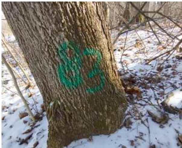
„To nie chodzi o jedno drzewo. To około 80 sztuk roślin, które tworzą unikalny krajobraz i charakter tego zabytkowego parku”