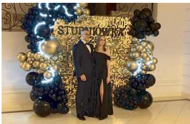
Sezon studniówkowy w Siedlcach dobiegł końca.

Sezon studniówkowy w Siedlcach dobiegł końca. Jako ostatni w tym roku swój wielki bal mieli uczniowie Zespołu Szkół Ponadpodstawowych nr 6 im. gen. Józefa Bema, czyli popularnej Kolejówki. Studniówka odbyła się 22 lutego w sali bankietowej Orchidea.