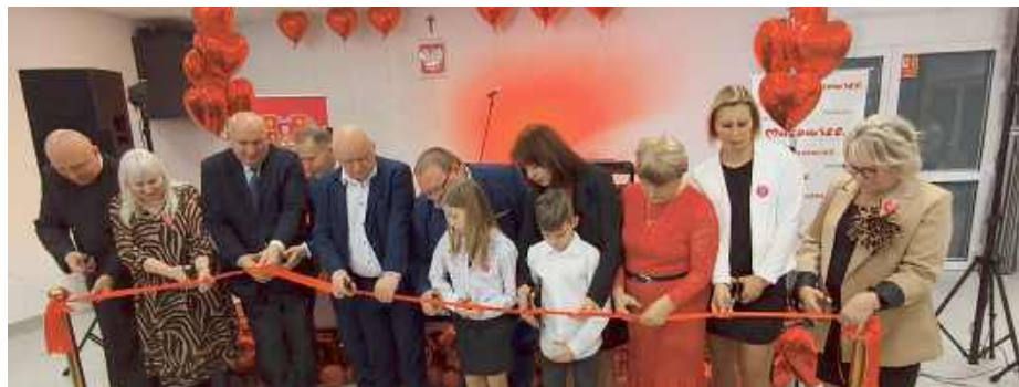
Otwarcie świetlicy w Wołyńcach