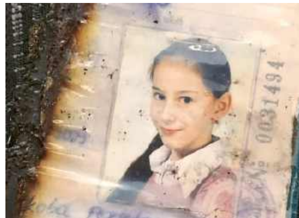
Ogień pojawił się niespodziewanie i pochłonął wszystko.

Podstępny żywioł Ogień pojawił się niespodziewanie i w kilka chwil pochłonął wszystko – meble, pościel, sprzęt kuchenny, ubrania, książki, dokumenty, zdjęcia. Tego ranka mama zauważyła, że komin jest gorący, choć w piecu nie paliło się od kilku godzin. Przerazona wezwała straż pożarną. Przyjechali ok. 5:30, sprawdzili komin termowizją, przeczyścili go i uspokoili nas, że nie ma zagrożenia. Mieliśmy