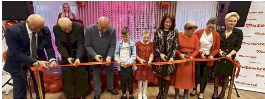
Otwarcie świetlicy w Purzecu

- Wołyńce i Wołyńce-Kolonia to dwie miejscowości, które będą mogły teraz aktywnie uczestniczyć w spotkaniach organizowanych przez Koło Gospodyń Wiejskich, a także wykorzystywać to miejsce do spotkań rodzinnych. Plany na oko-