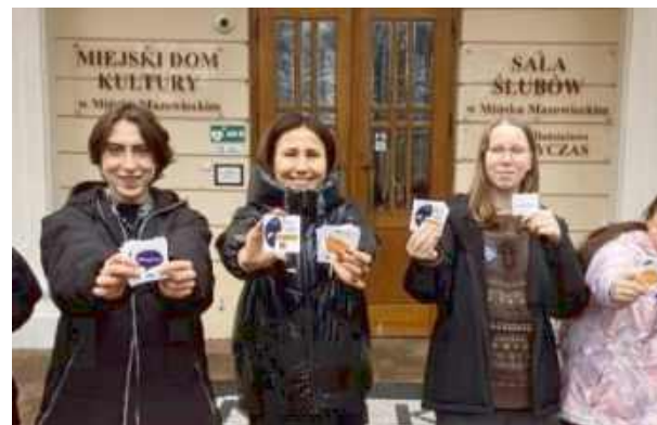
#MałyReset, #DbamOSiebie czy #KochamSię

Z okazji Ogólnopolskiego Dnia Walki z Depresją młodzież z Centrum Międzyczas oraz uczniowie EPAS Zespołu Szkół nr 1 im. Kazimierza Wielkiego