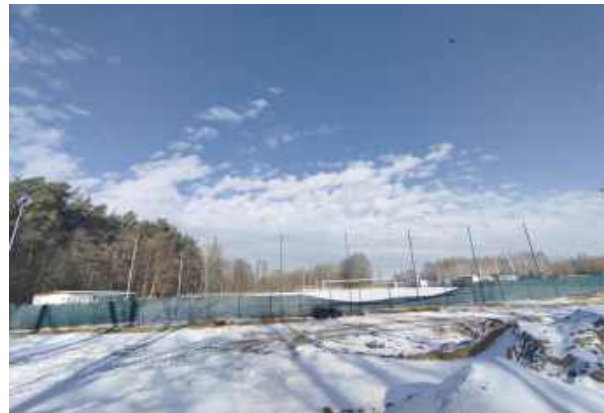
Inwestycja do której nie ma drogi dojazdowej... Czy ten spór ma szansę zakończyć się polubownie?

Pan Piotr zapewnia, że jest w pełni otwarty na propozycje rozwiązania sporu, a jednym z możliwych kompromisów jest zamiana działek, aby umożliwić