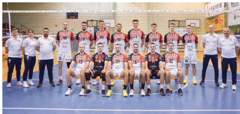
Siedlczanie wciąż nie mogą przełamać swojej wyjazdowej niemocy.

KPS Siedlce po raz kolejny musiał uznać wyższość rywali na wyjeździe. W meczu 24. kolejki PLS 1. Ligi przeciwko WKS Czarni Radom, siedlczanie walczyli do końca, ale ostatecznie przegrali 1:3. Radomianie wygrali pierwszego seta do 15, a w drugim secie, po zaciętej walce, to