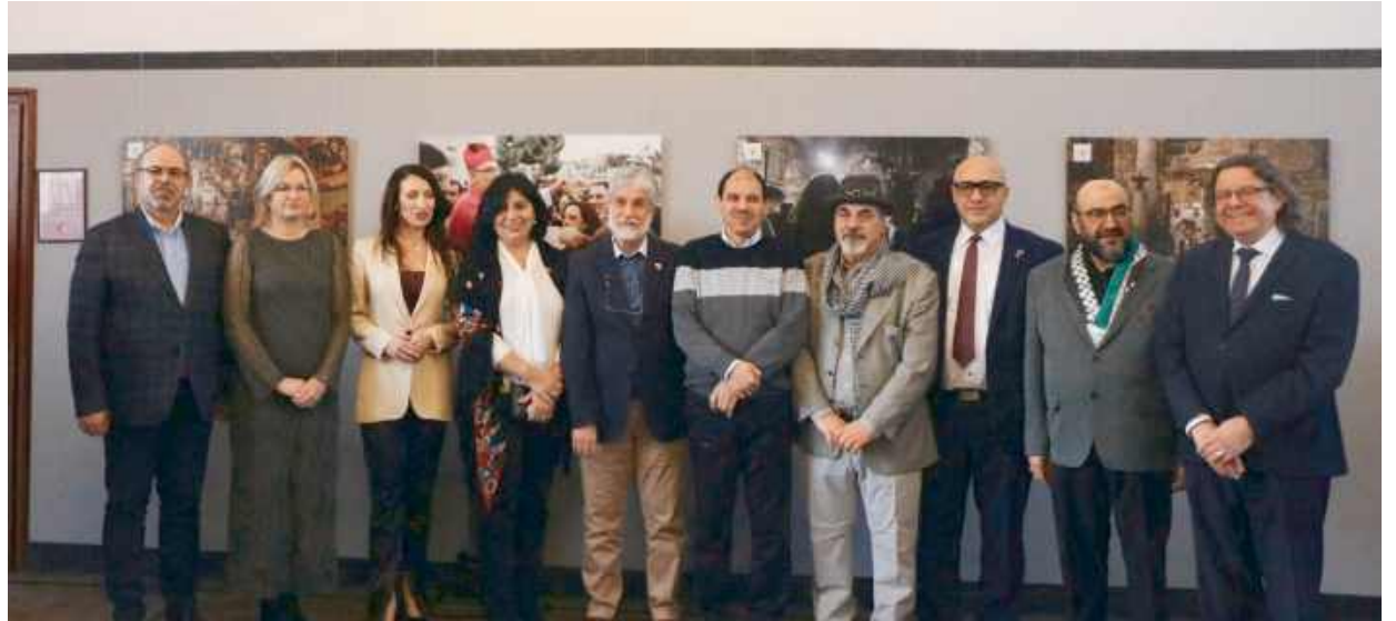
Wystawa będzie otwarta dla wszystkich do 6 kwietnia. Organizatorem ekspozycji jest Forum Palestyńskie w Polsce.