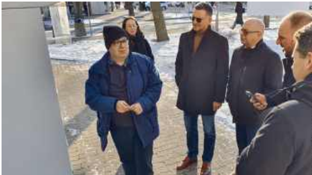
Odbiór ważnych dokumentów przez całą dobę w szybki sposób.