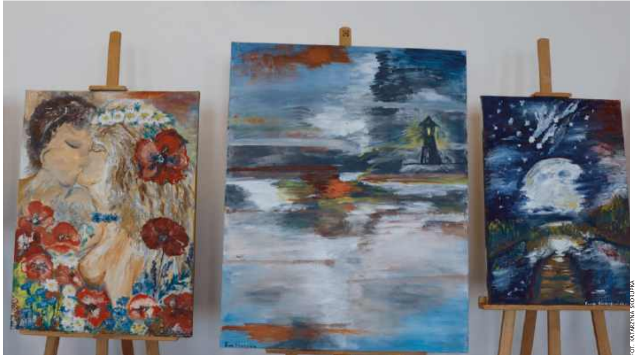
Obrazy były jednym z trzech elementów spotkania

Spotkanie w GOK w Repkach było nie tylko okazją do obcowania z poezją, muzyką i malarstwem, ale także momentem integrującym lokalną spo-