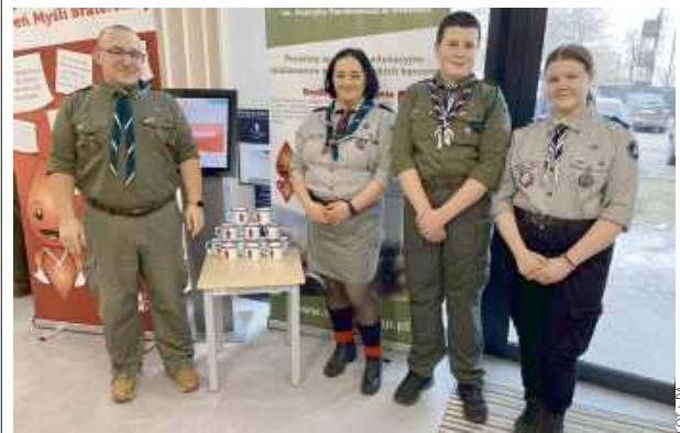
Dzień Myśli Braterskiej to szczególne święto dla harcerzy.

W ramach podziękowania za podzielenie się tym cennym darem życia, krwiodawcy mogli liczyć nie tylko na czekolady, ale także drobne upominki. PA