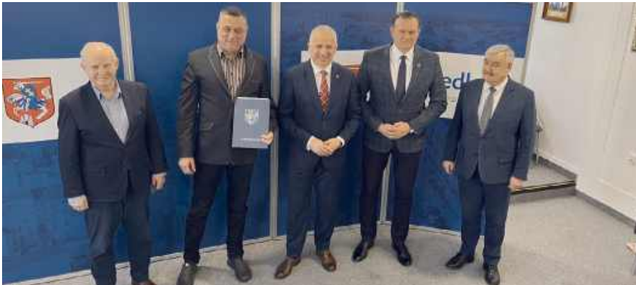
Prace potrwać około siedmiu miesięcy.

Po latach oczekiwań mieszkańcy Siedlec wreszcie doczekali się remontu jednej z najważniejszych ulic w mieście. Ulica Terespolska, która przez długi czas borykała się z licznymi niedogodnościami, przejdzie modernizację.