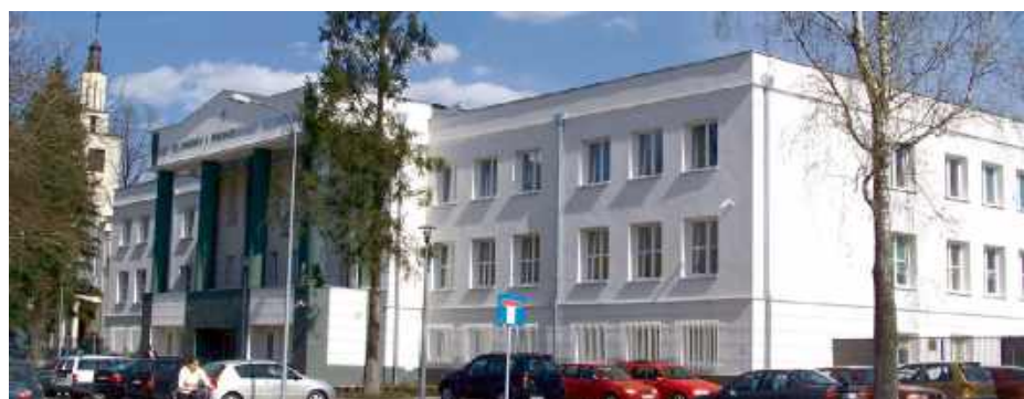
Czy uda się odzyskać całość zdefrudowanych pieniędzy?

Za przywłaszczenie mienia znacznej wartości kodeks karny przewiduje od roku do 10 lat więzienia. Jednak zanim sprawa trafi na wokandę, prokuratura chce dokładnie zbadać, jak przez tak długi czas nikt nie zauważył znikających środków i czy pieniądze da się odzyskać w całości. P A