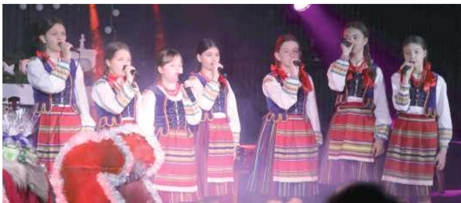
Zwieńczeniem wydarzenia był występ gminnego zespołu „Drelowskie Kukaweczki”

Scena Gminnego Centrum Kultury w Drelowie wypełniła się 21 grudnia muzyką i bożonarodzeniową atmosferą. Wszystko dzięki trzeciej edycji Świątecznego Koncertu, podczas którego wystąpiło ponad dwudziestu wokalistów i instrumentalistów z terenu gminy Drelów oraz okolic.