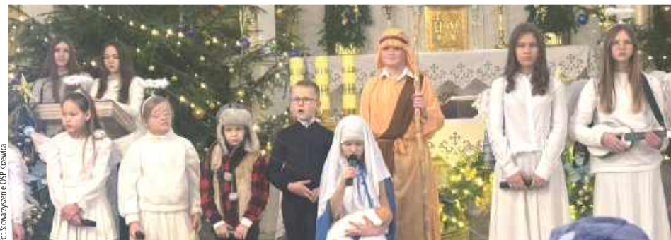
W realizację projektu zaangażowana była liczna grupa młodych strażaków oraz kilku dorosłych wspierających przygotowania