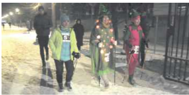
Na starcie stanęło 150 uczestników (55 kobiet i 95 mężczyzn), którzy rywalizowali na dystansach biegowych, w Nordic Walking oraz w niezwykle barwnym biegu przebierańców

nawiązuje do najstarszego biegu sylwestrowego świata, zapoczątkowanego w 1924 roku w São Paulo, a Nałęczów jest dziś jednym z nielicznych