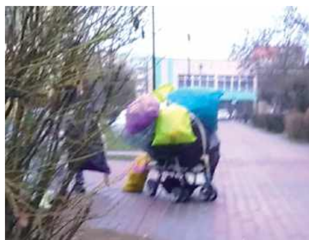
Zbieracz takich „skarbów” nie zarobi kokosów, ale wystarczy mu na przetrwanie kolejnego dnia...

Kiedy operatorzy systemów kaucyjnych prognozują miliardowe zyski z wprowadzenia bardzo dochodowej ekologii, zwykli konsumenci mineralnej jeszcze żyją w starym rytmie. Nie czują ciężaru 50 groszy dodatkowej opłaty za butelkę i najczęściej jeszcze nie poszukują recykloematów, czyli butelkomatów. Wrzucają plastik do pojemników na wyselekcjonowane odpady.