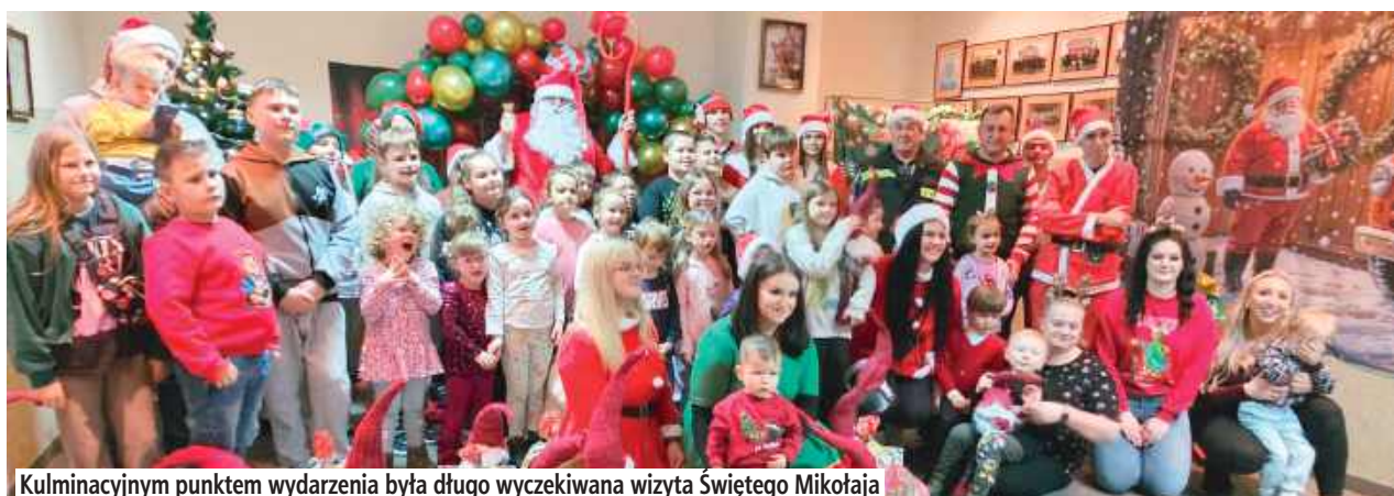
Kulminacyjnym punktem wydarzenia była długo wyczekiwana wizyta Świętego Mikołaja

W Międzyrzecu Podlaskim 12 grudnia odbyły się mikołajki zorganizowane przez Ochotniczą Straż Pożarną Zawadki. Było to już drugie takie wydarzenie przygotowane przez drużyny i druhow, którzy po raz kolejny zadbały o to, aby dzieci mogły poczuć prawdziwą magię nadchodzących świąt.