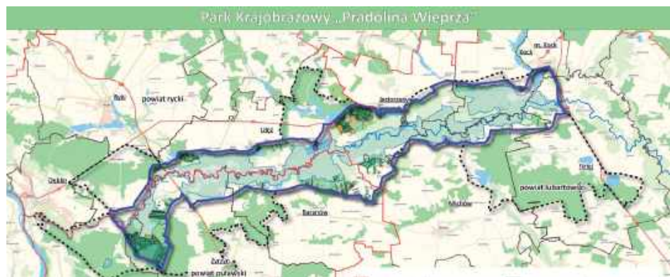
Tak miałyby przebiegać granice nowego Parku Krajobrazowego Pradolina Wieprza

Zespół Lubelskich Parków Krajobrazowych chce na terenie trzech powiatów - puławskiego, ryckiego i lubartowskiego utworzyć nowy park krajobrazowy - Pradolina Wieprza. Przyrodnicy przekonują, że przyciągnąłby do regionu turystów m.in. z okolic, Lublina czy Warszawy.