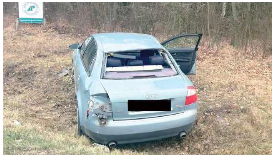
Mężczyzna w rozmowie z funkcjonariuszem przyznał, że tego dnia spożywał alkohol

Funkcjonariusz, widząc w rowie uszkodzony samochód, natychmiast zareagował. Był przekonany, że niezbędna będzie pomoc medyków.