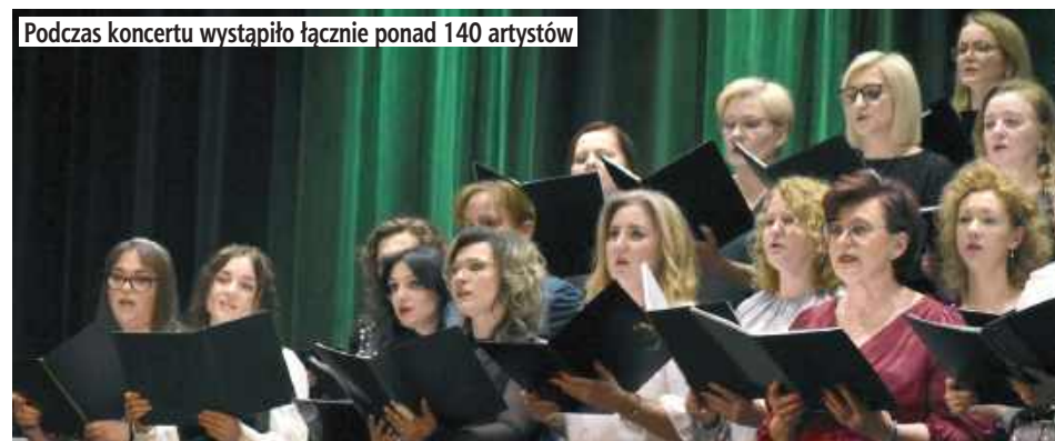
Podczas koncertu wystąpiło łącznie ponad 140 artystów

Podczas podsumowania konkursu doceniono nie tylko młodych twórców, ale również osoby, dzięki którym to artystyczne przedsięwzięcie mogło się odbyć. W dowód uznania za szczególne zaangażowanie pamiątkowymi