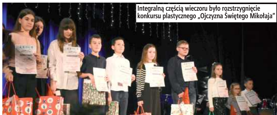
Integralną częścią wieczoru było rozstrzygnięcie konkursu plastycznego „Ojczyzna Świętego Mikołaja”

Pełna sala, wspólne śpiewanie koled i artyści z kilku pokoleń na jednej scenie – tak w skrócie można opisać koncert koled, który odbył się, 28 grudnia, w sali widowiskowej Miejskiego Ośrodka Kultury w Międzyrzecu Podlaskim.