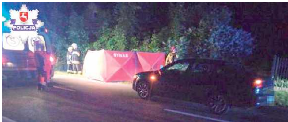
W tym roku od tragedii miną cztery lata. Kierujący Seatem, mieszkaniec powiatu lubartowskiego, na prostym odcinku drogi w terenie zabudowanym najechał na 42-latkę niosącego na rękach 58-latkę