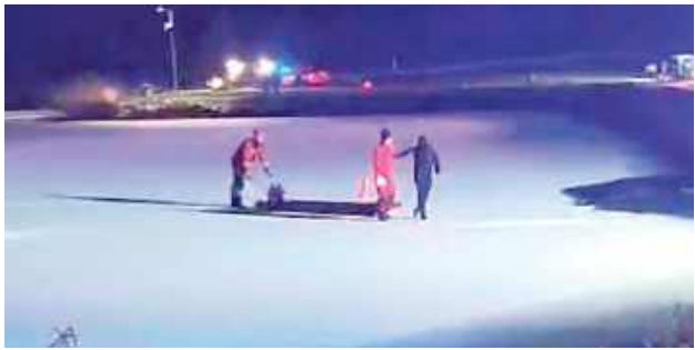
Nie mogąc kontynuować ucieczki, zatrzymał się tuż przy linii brzegowej. Po tym, chcąc uniknąć odpowiedzialności agresywny mężczyzna wbiegł na środek zbiornika

Tuż po północy w miejscowości Zakanale policjanci komisariatu w Janowie Podlaskim zwrócili uwagę na osobowe Volvo, którego kierowca poruszał się bez świateł mijania. Funkcjonariusze postanowili zatrzymać kierowcę do kontroli drogowej. Mężczyzna początkowo zatrzymał auto na pobo-