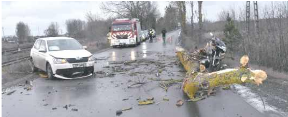
Z relacji mężczyzny wynikało, że jadąc motorowerem, zauważył konar w ostatniej chwili

Do zdarzenia doszło w niedzielę (28 grudnia) na ulicy Pol-