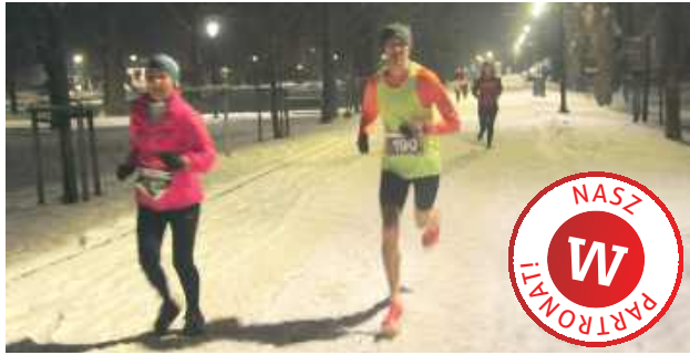
Trasa biegu prowadziła uczestników malowniczymi alejkami Parku Zdrojowego i ulicami Nałęczowa

Na starcie stanęło 150 uczestników (55 kobiet i 95 mężczyzn), którzy rywalizowali na dystansach biegowych, w Nordic Walking oraz w niezwykle barwnym biegu przebierańców. Tradycja