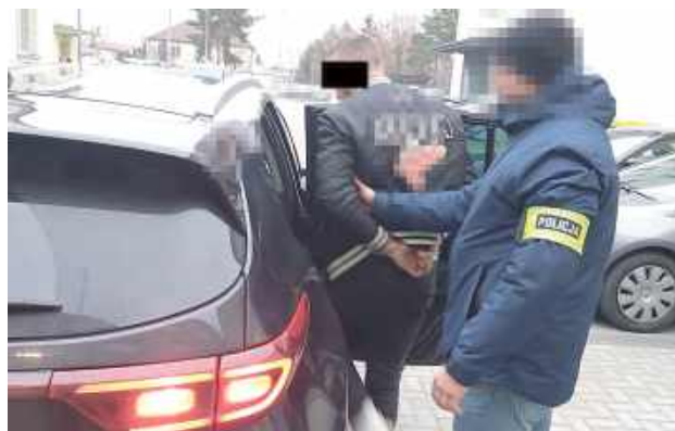
Bialscy policjanci przeprowadzili kolejną akcję „Poszukiwany”, mającą na celu zatrzymanie osób ukrywających się przed wymiarem sprawiedliwości

Wśród zatrzymanych znalazł się 41-latek z powiatu lubartowskiego, poszukiwany za przestępstwo przywłaszczenia oraz niealimentację. Mężczyzna nie spodziewał się, że policjant zapuka do jego drzwi. Funkcjonariusz zatrzymał także 22-latkę, który