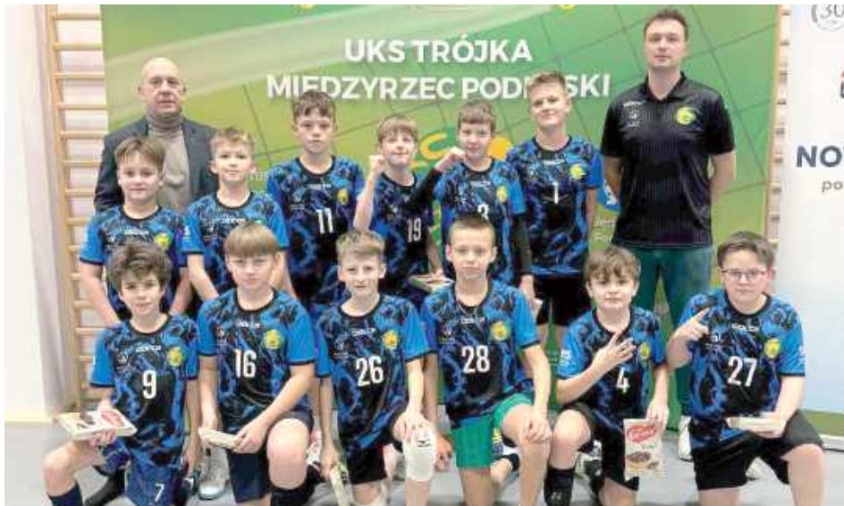
W zawodach udział wzięły m.in. zespoły z Białej Podlaskiej, Lublina, Warszawy, Legionowa, Zawiercia, Kielc, Świdnika czy Mińska Mazowieckiego

Wydarzenie zgromadziło ponad 200 młodych siatkarki i siatkarzy reprezentujących 19 klubów z całej Polski, którzy dostarczyli kibicom mnóstwo sportowych emocji. Turniej był doskonałą okazją do sprawdzenia umiejętności, zdobycia cennego doświadczenia i integracji środowiska siatkarskiego.