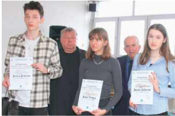
W finale wzięło udział blisko 50 uczniów!

Uczestnicy odpowiadali na zestawy pytań testowych (od 20 do 40 pytań, w zależności