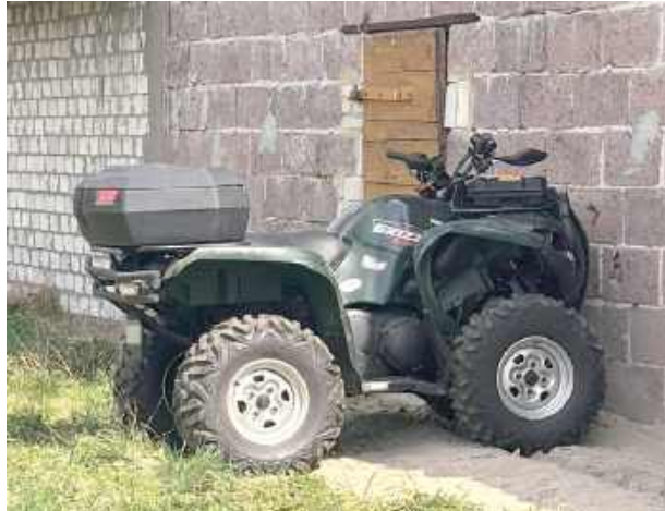
Na łuku drogi kobieta pomyliła pedał gazu z hamulcem, w wyniku czego straciła panowanie nad pojazdem, zjechała z drogi i uderzyła w ścianę budynku

Łuku drogi pomyliła pedał gazu z hamulcem, w wyniku czego straciła panowanie nad pojazdem, zjechała z drogi i uderzyła w ścianę budynku. Zdarzenie wyglądało bardzo groźnie, jednak jego uczestnicy mogą mówić o dużym szczęściu. Zarówno kierująca, jak i jej 45-letni pasażer, mieli na sobie kaski ochronne, dzięki czemu skończyło się jedynie na ogólnych potłuczeniach. Kobieta była trzeźwa.