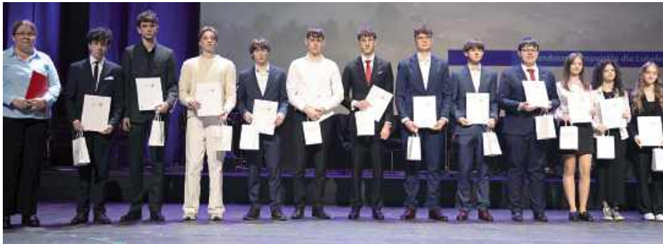
Stypendyści z ZS 2 w Lubartowie

W czasie uroczystej Gali stypendystów programu Fundusze Europejskie dla Lubelskiego 2021–2027 13 kwietnia stypendia otrzymali też uczniowie lubartowskich szkół.