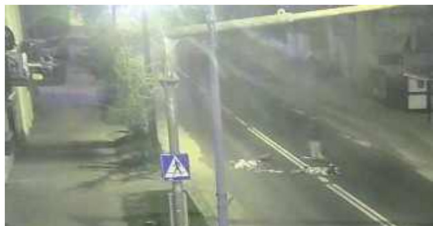
Wszystko nagrała kamera monitoringu. Dzięki temu szybko udało się zidentyfikować sprawczynię zdarzenia

35-latką w rejonie jednego ze skrzyżowań w Puławach wysypała na środek jezdni zawartość worka na śmieci, a następnie rozgarnęła odpady nogą po ulicy. Wszystko nagrały kamery miejskiego monitoring. Kobieta usłyszała zarzuty.