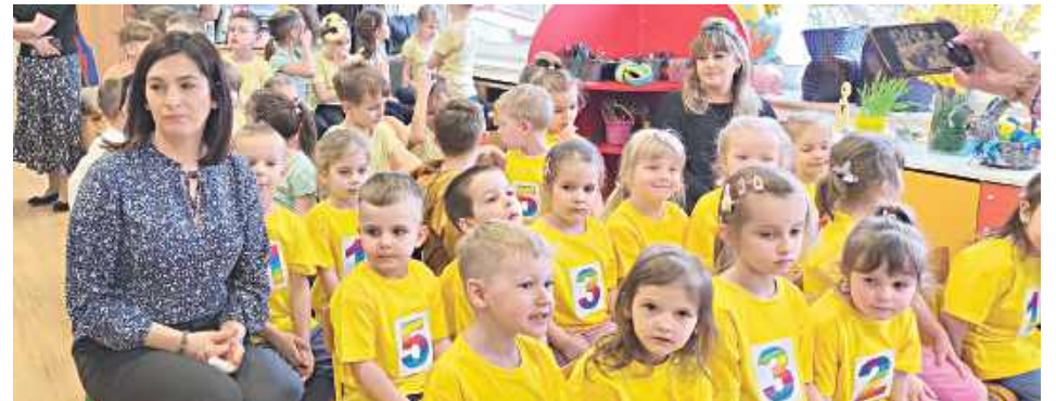
Oczekiwanie na wynik konkursu