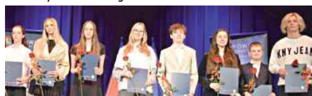
Nagrodzeni za wyniki w pływaniu