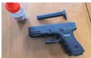
Podczas przeszukania funkcjonariusze ujawnili broń pneumatyczną oraz kulki

LUBLIN: Policjanci zatrzymali podejrzanego o kierowanie gróźb karalnych i zranienie 19-latkę. Sprawca z broni pneumatycznej oddał strzał w tył głowy mężczyzny.