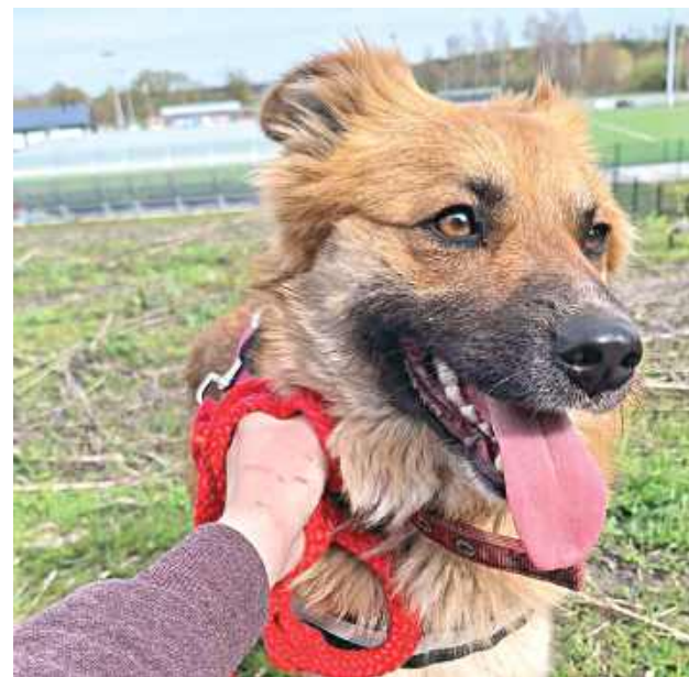
Amber to wyjątkowa suczka, która mimo młodego wieku dała się poznać jako zwierzę o wspaniałym, zrównoważonym charakterze

Amber to wyjątkowa suczka, która mimo młodego wieku dała się poznać jako zwierzę o wspaniałym, zrównoważonym charakterze. Jest niezwykle przyjazna nie tylko w stosunku do ludzi, ale również w relacjach z innymi zwierzętami, co czyni ją idealną kandydatką do domu, w którym mieszkają już inne stworzonogi. Sunia uwielbia kontakt z człowiekiem, wspólnie zabawy oraz spacerować, podczas których z ciekawością odkrywa otaczający ją świat. Co ciekawe, jej wielką pasją są kąpiele, co z pewnością ucieszy miłośników wypoczynku nad wodą.