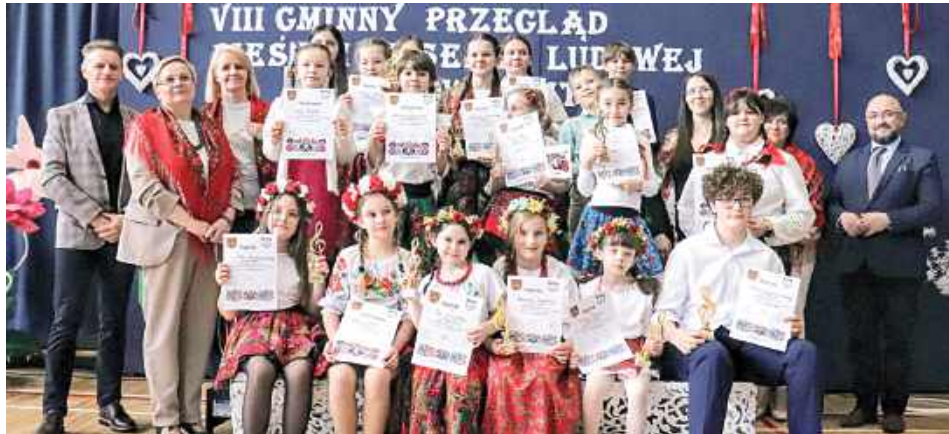
Przeegląd odbył się 15 kwietnia w Szkole Podstawowej im. Bolesława Prusa w Wólce Rokickiej