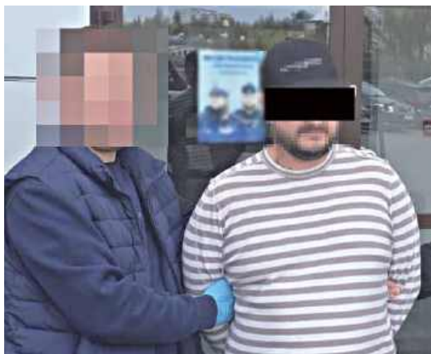
Na miejsce zostali skierowani patrolowcy z VII Komisariatu Policji w Lublinie, którzy szybko zatrzymali mężczyznę. Trafit do policyjnej celi

LUBLIN: 41-latek wypchnął drzwi do plebanii, wszedł do środka, a następnie wypił wino mszalne. Został nakryty przez księdza, którego miał szarpać i zażądać pieniędzy.