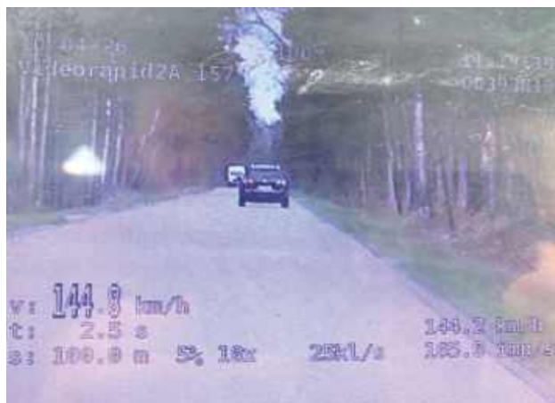
Wszyscy stracili prawa jazdy, zostali ukarani wysokimi mandatami, a na ich konta trafiły punkty karne

POWIAT OPOLSKI: Policjanci z opolskiej drogowki przeprowadzili kolejne działania wymierzone w kierowców łamiących przepisy. W ciągu kilku dni funkcjonariusze zatrzymali aż pięciu kierowców, którzy znacznie przekroczyli dozwoloną prędkość. Wszyscy stracili prawa jazdy, zostali ukarani wysokimi mandatami, a na ich konta trafiły punkty karne.