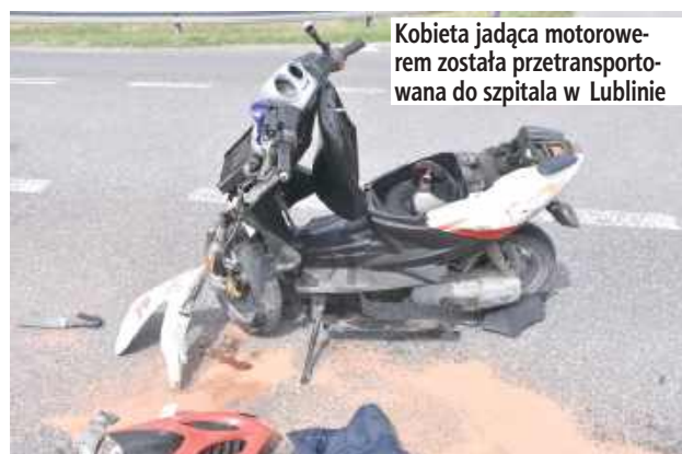
Kobieta jadąca motorowerem została przetransportowana do szpitala w Lublinie

POWIAT OPOLSKI: Do groźnego wypadku doszło we wtorek, 14 kwietnia przed południem na drodze wojewódzkiej nr 747 w miejscowości Nowe Komasyce. Chwila nieuwagi jednego z kierowców doprowadziła do poważnych konsekwencji - 53-letnia kobieta trafiła do szpitala po zderzeniu z samochodem osobowym.