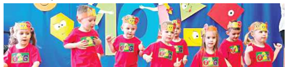
Były też występy muzyczne