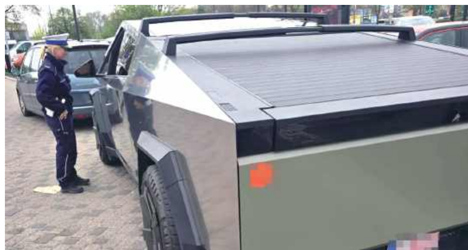
Mężczyzna jechał przez miasto 115 km/h w miejscu, gdzie obowiązywało ograniczenie do 50 km/h

LUBLIN: Policjanci zatrzymali kierowcę samochodu Cybertruck, który przekroczył dozwoloną prędkość w mieście.