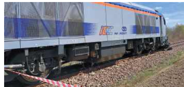
Ze wstępnych ustaleń wynika, że 77-letni mieszkaniec gminy Łuków, kierujący samochodem, wjechał na niestrzeżony przejazd kolejowy i został potrącony przez pociąg relacji Warszawa - Lublin

w rejonie przejazdu, a także ruch kolejowy na odcinku Łuków - Lublin. Wprowadzono również