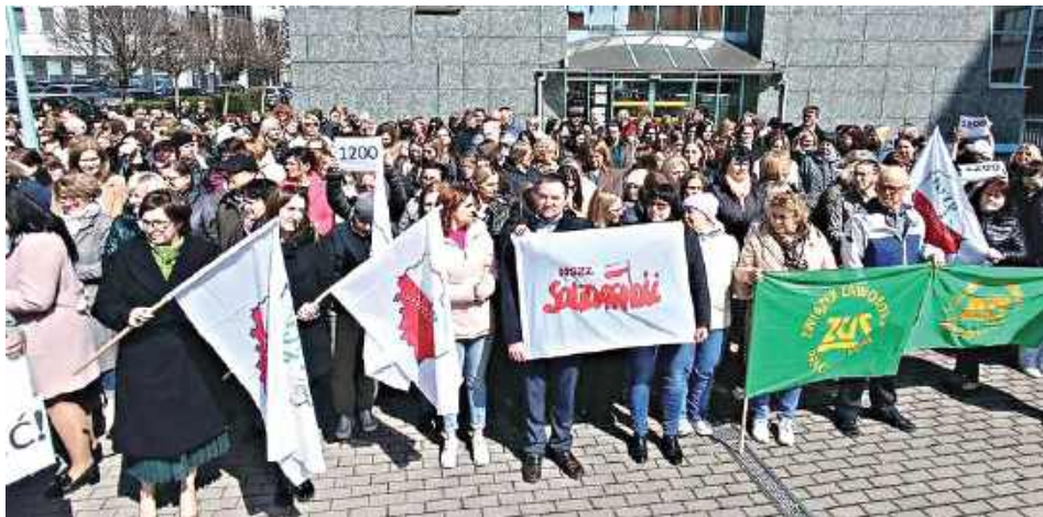
Pracownicy ZUS w Lublinie każdego dnia wychodzą w południe tłumnie przed budynek przy Zana. Zaraz potem wracają do pracy, bo na protest wykorzystują przysługującą im przerwę. Mają dość warunków pracy i płacy

– Szybko i sprawnie realizujemy wszystkie dodatkowe zadania typu 800 plus i renta wdowia. Ponad milion dwie-