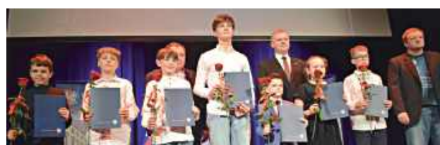
Zawodnicy tenisa stołowego