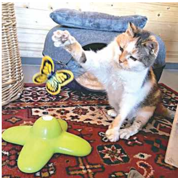
Kocia babcia Danusia marzy o ciepłym kącie

Obecnie kotka jest już całkowicie zdrowa i gotowa do przeprowadzki do nowego domu. Przeszła niezbędny zabieg kastracji. Danusia wzorowo korzysta z kuwety i świetnie odnajduje się w domowych warunkach. Mimo trudnej przeszłości nie straciła za-