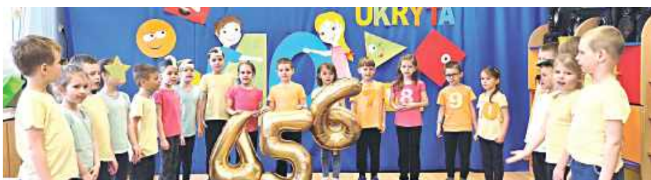
Dzieci recytujące wiersze o matematyce pokazywały wielkie liczby

„Matematyka w wierszach ukryta” to konkurs recytatorski, który zorganizowano w Przedszkolu nr 2. Dzieci recytowały wiersze o tematyce matematycznej. Występy oceniło konkursowe jury w składzie: Wioletta Matyjaszczyk - Miejska Biblioteka Publiczna w Lubartowie. Filia nr 1; Wioletta Brzozowska - Miejska