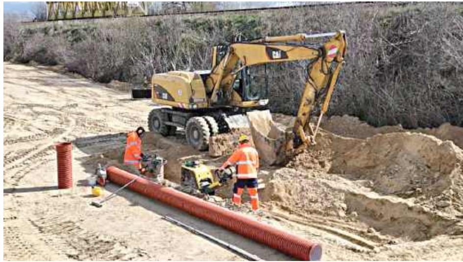
Trasa S19 będzie przebiegać po zachodniej stronie Lubartowa. Codziennie na budowie pracuje ok. 500 osób

Wykonanych zostanie także ponad 40 km dróg do obsługi ruchu lokalnego i 29 obiektów inżynierskich, w tym cztery węzły drogowe, wiadukty, drogi równoległe do obsługi ruchu lokalnego, urządzenia ochrony środowiska oraz bezpieczeństwa ruchu drogowego. Odcinek drogi ekspresowej S19 Lubartów-Lublin nabiera coraz wyraźniejszych kształtów. Trwa budowa trasy głównej, miejscami ułożona jest już warstwa podbudowy bitumicznej.