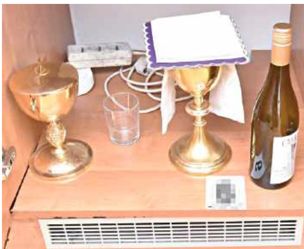
Mężczyzna usłyszy zarzuty kradzieży z włamaniem oraz usiłowania rozboju