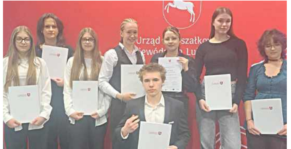
Uczniowie RCEZ ze stypendiami