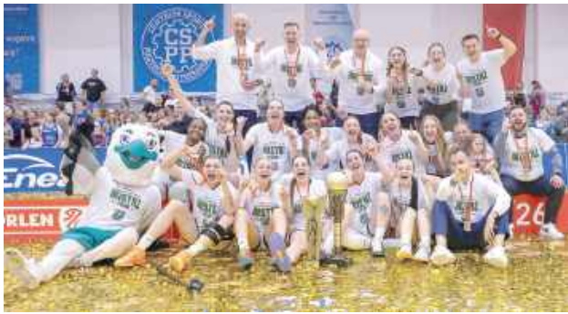
Złote medalistki sezonu 2025/2026

Po raz drugi w historii klubu koszykarki Lotto AZS UMCS Lublin wywalczyły złote medale Orlen Basket Ligi Kobiet. W czwartym finale sezonu 2025/26 biało-zielone pokonały Enea AZS Politechnikę Poznań i sięgnęły po upragniony triumf.